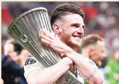
HABARI UKURASA 22