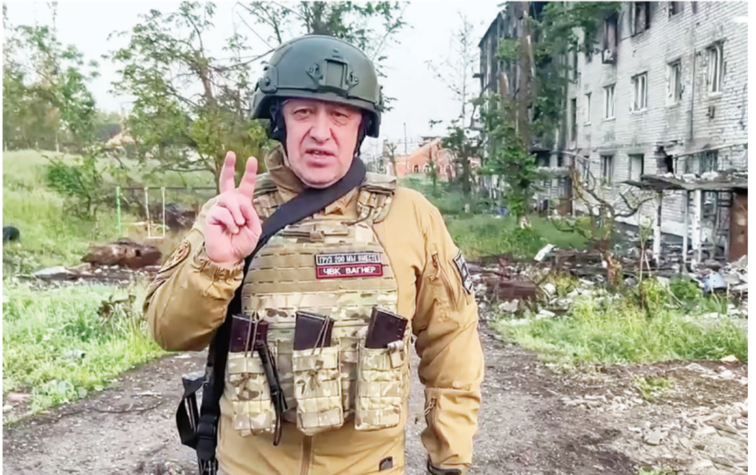
Kiongozi wa kundi la Wagner, Yevgeny Prigozhin.

Rais wa Russia ni mara chache ukimkosoa utabaki salama. Ni