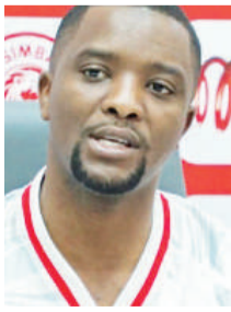
Simba, huku akisema