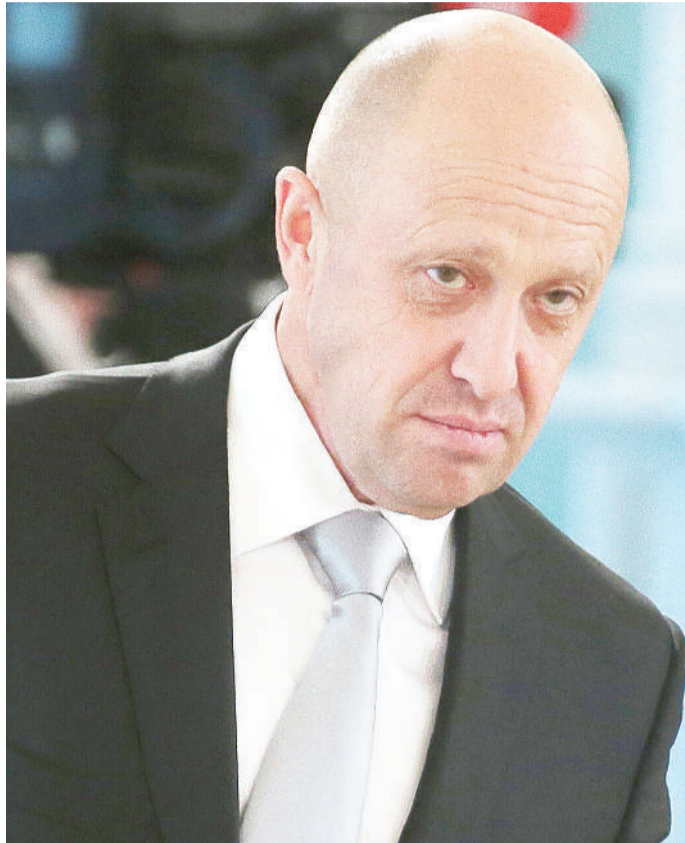
Kiongozi wa kikundi cha mamluki cha Wagner, Yevgeny Prigozhin.

Hata hivyo, Putin anatumia hotuba hiyo kama jaribio la