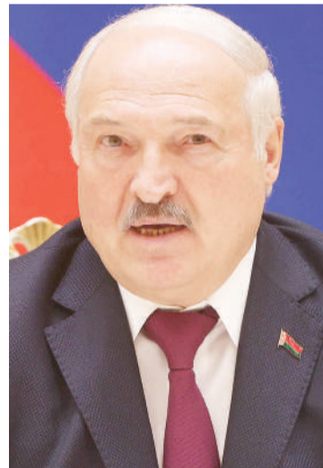
Rais wa Belarus Alexander Lukashenko

“Leo, una fursa ya kuendelea na huduma yako kwa Russia kwa kutia saini mikataba na Wizara ya Ulinzi au vyombo vingine vya kijeshi na kutekeleza sheria, au kurudi kwa familia yako na watu wa karibu, wale wanaotaka wanaweza kuondoka kwenda Belarus, ahadi