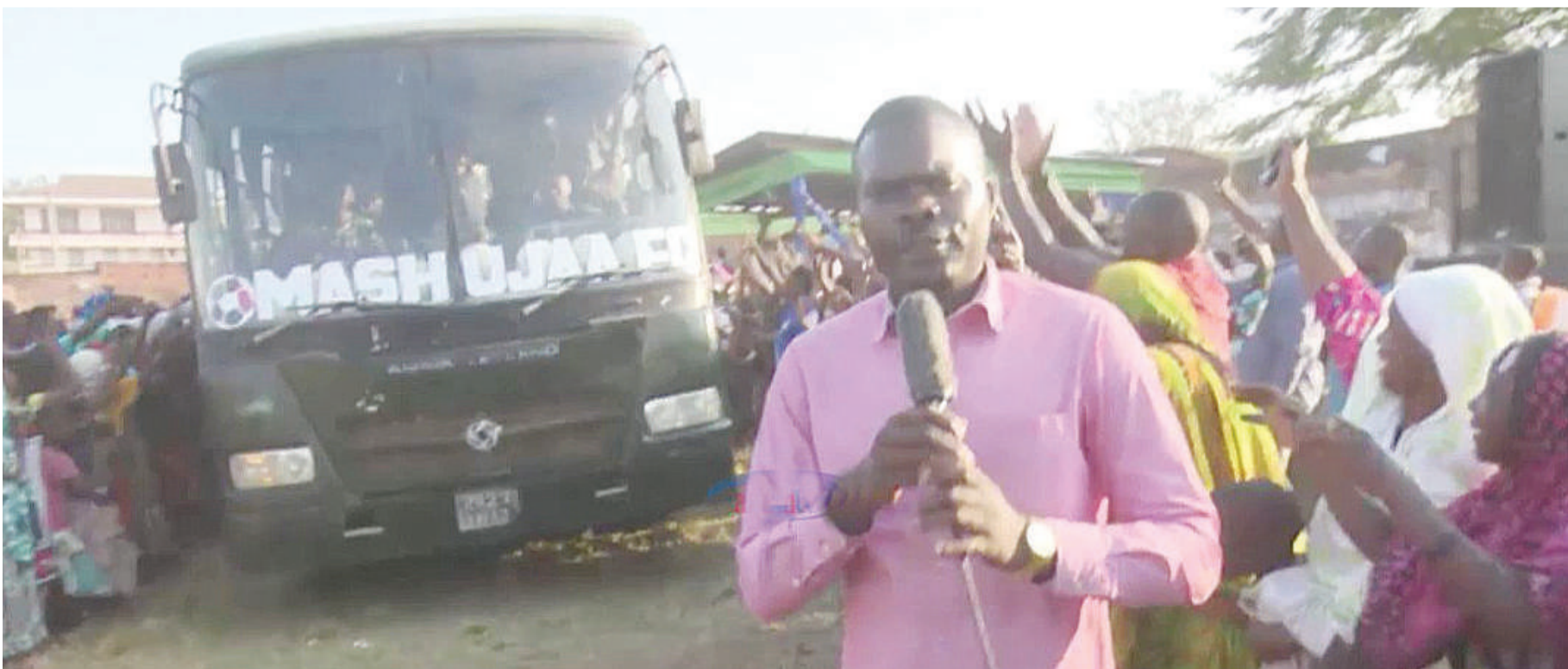
Mashabiki wa soka Kigoma wakiwamefurika kwenye Uwanja wa Central mkoani humo, wakiilaki timu ya soka ya Mashujaa FC ikiingia ikitokea jijini Mbeya ilipofanikiwa kutinga Ligi Kuu, kwa kupata ushindi wa jumla wa mabao 4-1. Bao 1-0 ugenini na nyumbani 3-1.