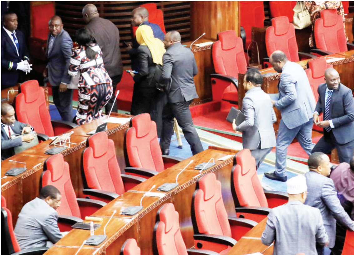
Baadhi ya wabunge wakitoka nje ya ukumbi wa Bunge jijini Dodoma jana, baada ya kusikika kwa sauti ya king'ora ambapo Spika wa Bunge, Dk. Tulia Ackson, aliaahirisha shughuli kwa muda.