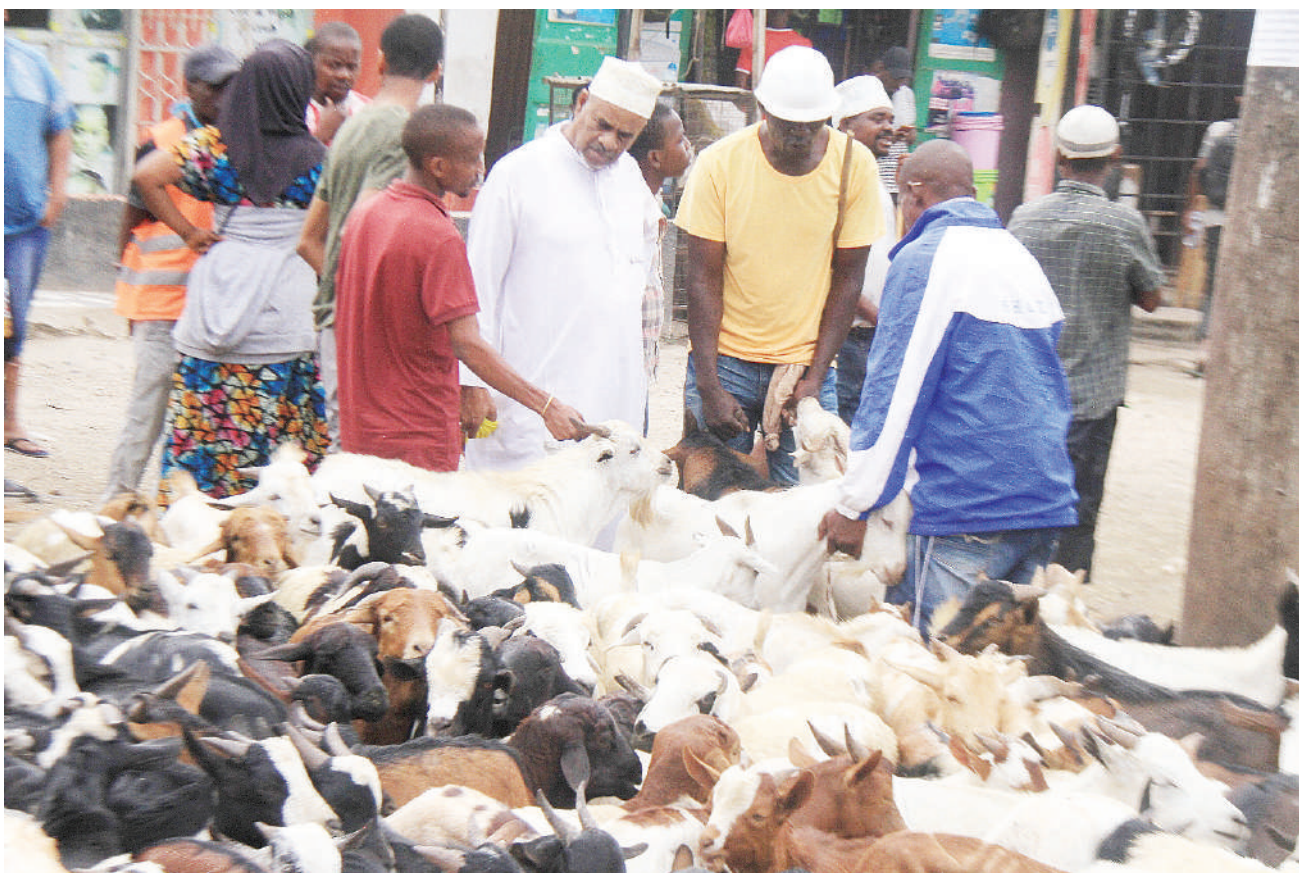
Wananchi wakichagua mbuzi Vingunguti, Dar es Salaam jana kwa ajili ya maandalizi ya sikukuu ya Eid El-Adha. Mbuzi mmoja aliuzwa kwa bei ya 100,000/- hadi 150,000/- kulingana na ukubwa wake.