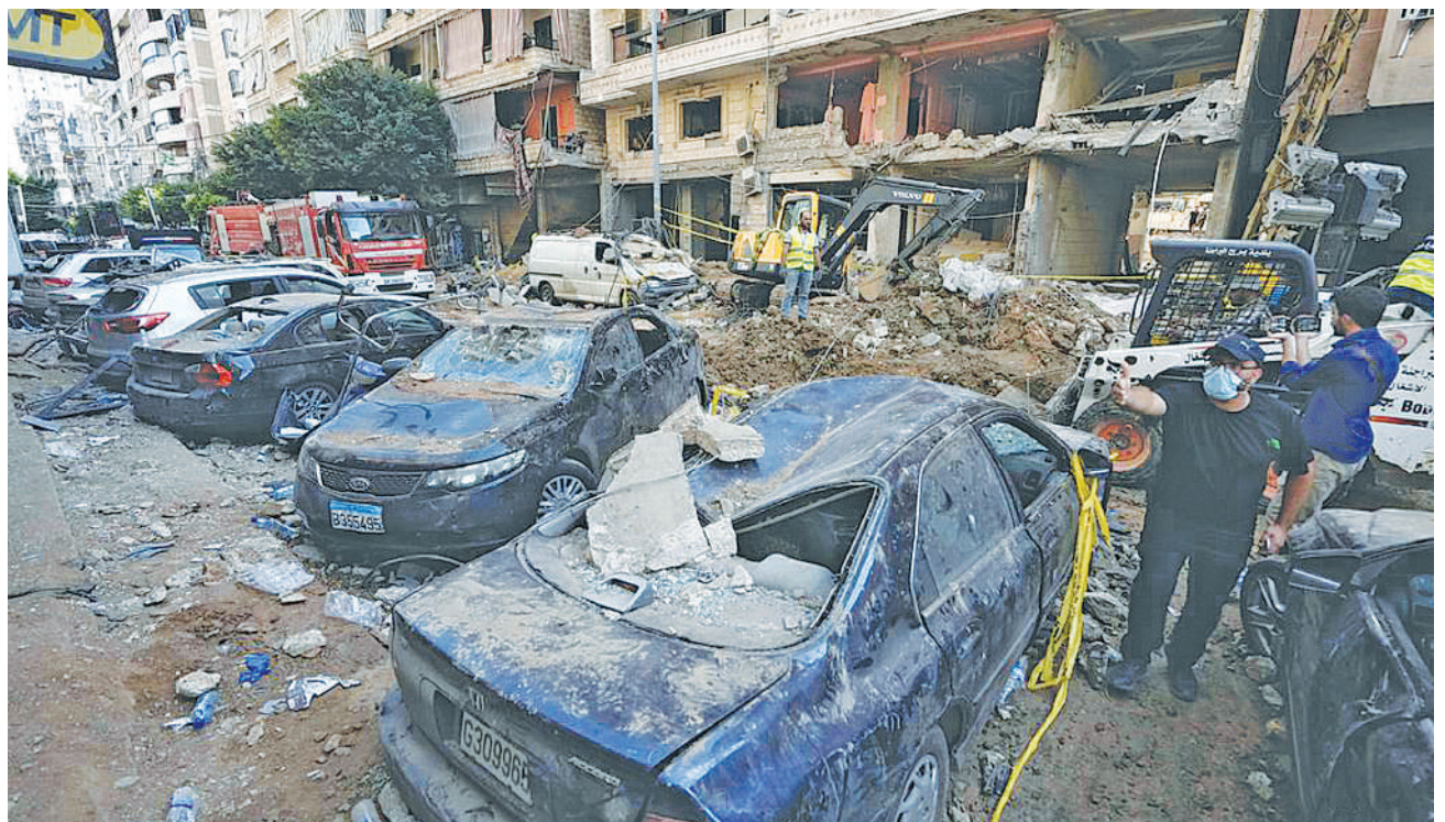
Athari zilizosababishwa na shambulizi la Israel karibu na eneo la Beirut Mashariki ya Kati.