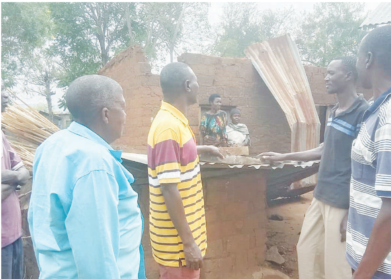
Baadhi ya wakazi wa Kijiji cha Suguti wilaya ya Musoma mkoani Mara, wakiangalia moja ya nyumba zilizozuliwa na mvua ilionyesha usiku wa kuamkia jana, ikiambatana na upepo mkali. PICHA: MPIGAPICHA WETU