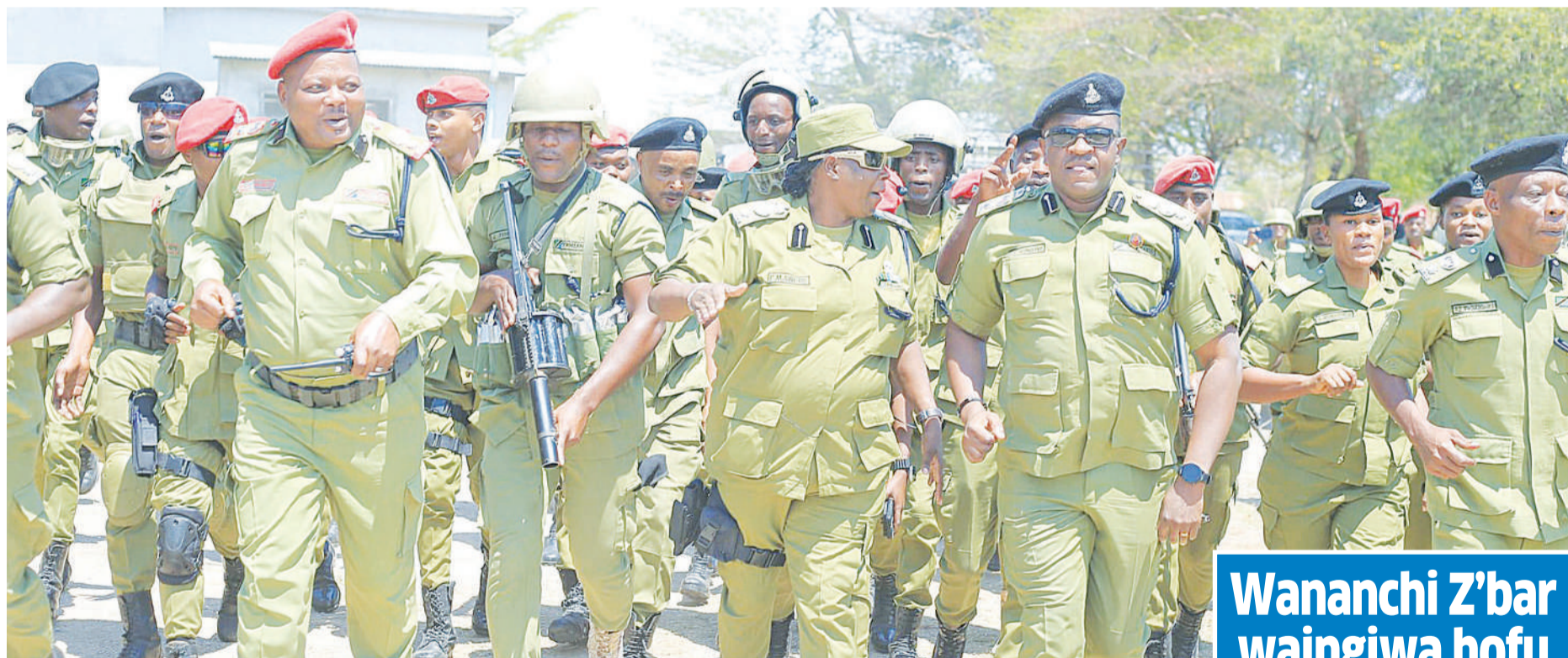
Jeshi la Polisi Mkoa wa Simiyu likifanya mazoezi katika mitaa mbalimbali ya Mji wa Bariadi, mkoani Simiyu jana kwa lengo la kuimarisha usalama wa raia na mali zao.

Sanamu la Nyerere la kilo 6,000 labomolewa, vipande vyaibwa