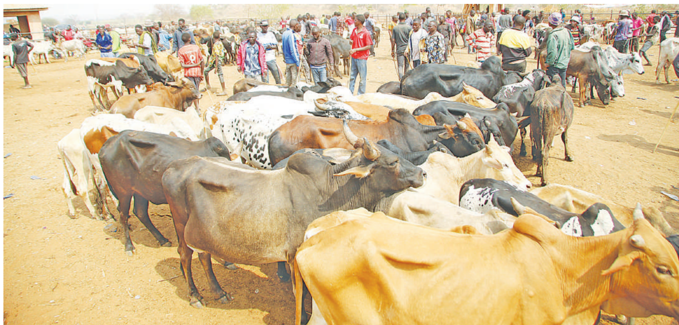
Baadhi ya wafanyabiashara wa mifugo wakiwa kwenye Mnada wa Mifugo Kigwe, Halmashauri ya Wilaya ya Bahi, mkoani Dodoma mwishoni mwa wiki.

Mchengerwa alisema mikopo hiyo ikisimamiwa vizuri na kuwafikia walengwa itabadilisha maisha ya wanufaika hao na kuwataka wasimamizi hao kutoa elimu ya namna bora ya kuitumia mikopo hiyo kuboresha maisha yao na kufanya marejesho kwa wakati ili kuwezesha wengine kunufaika.