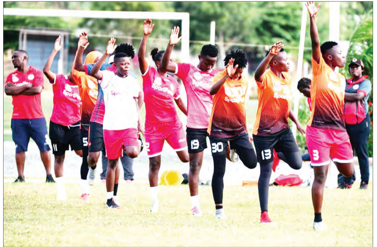
Kikosi cha mabingwa wa Ligi Kuu ya Wanawake Tanzania Bara, Simba Queens ya jijini Dar es Salaam kikiwa kwenye mazoezi kwa ajili ya kujiandaa na mashindano ya Kanda ya Afrika Mashariki na Kati (CECAFA), yatakayofanyika baadaye mwezi huu huko Nairobi nchini Kenya.