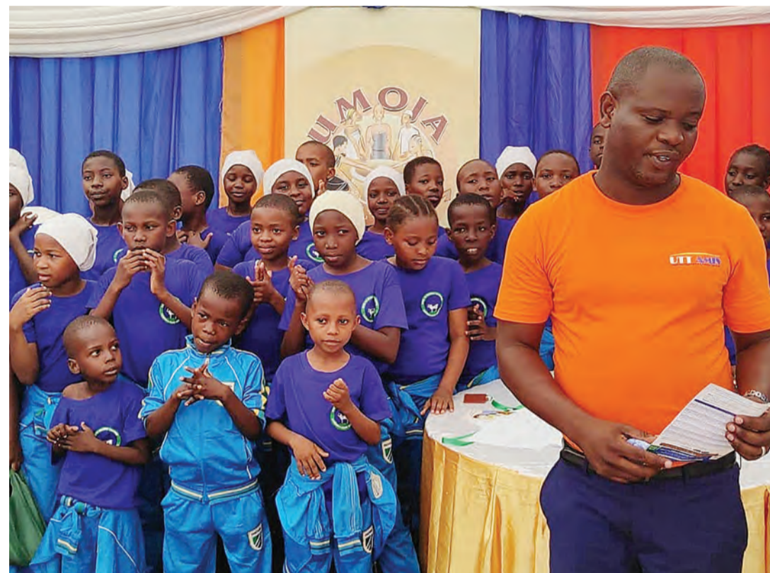
Ofisa kutoka kampuni ya UTT AMIS, akitoa elimu kwa watoto kuhusu umuhimu wa kuweka akiba na kufunguliwa akaunti.

moja) kila mwezi atahitajika kuwekeza kiasi cha Sh. 8,340 tu ili kukamilisha mpango wake wa uwekezaji.