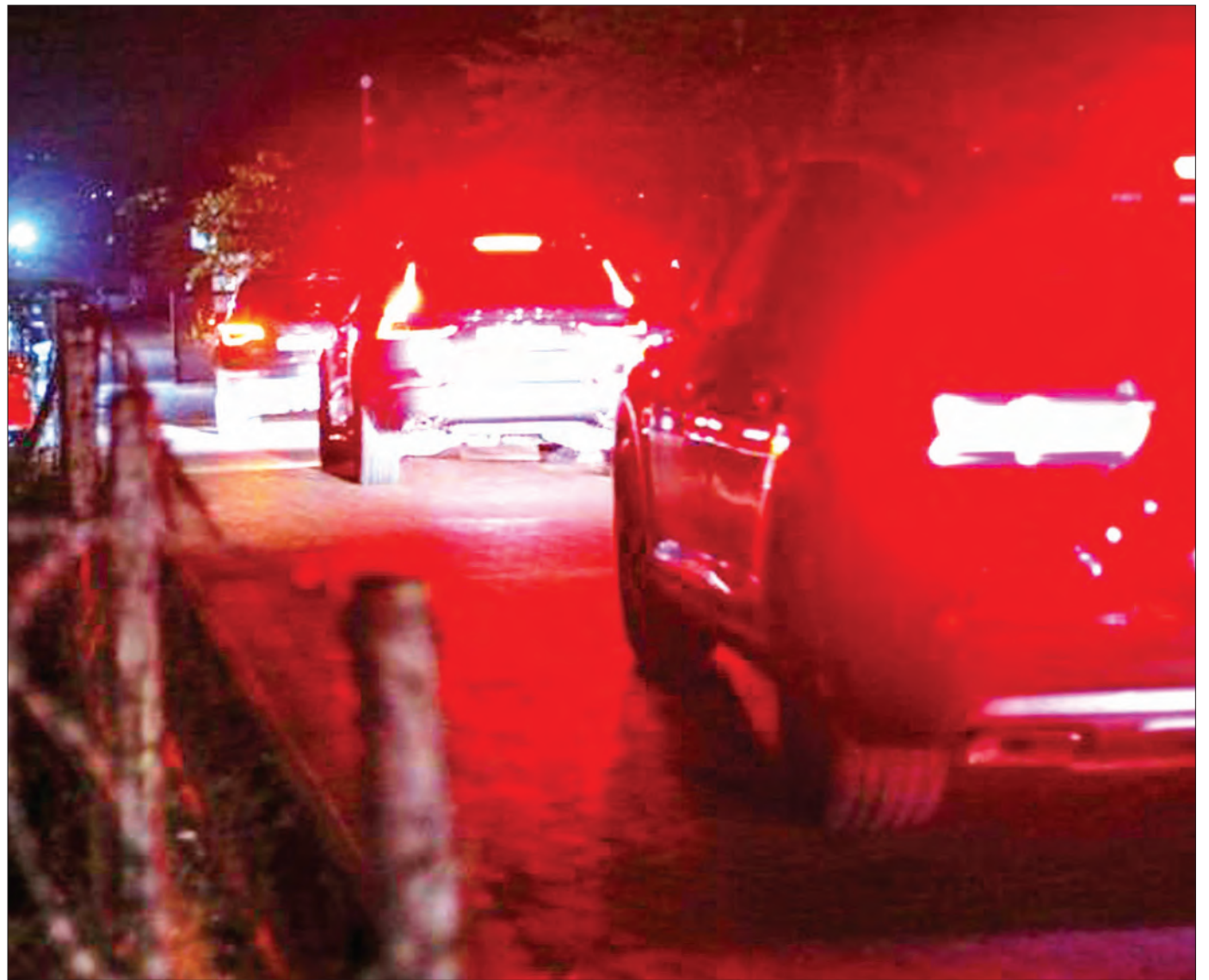
Msafara wa magari uliombeba aliyekuwa Rais wa Afrika Kusini, Jacob Zuma wakati akipelakwa gereza jana.