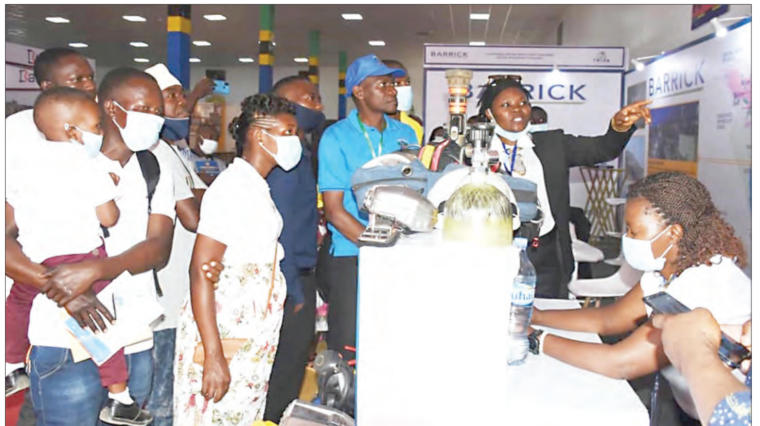
Wananchi wakipata maelezo kuhusu shughuli za kampuni ya Barrick, walipotembelea Maonyesho ya 45 ya Biashara ya Kimataifa ya Dar es Salaam yanayoendelea katika Viwanja vya Mwalimu Nyerere Barabara ya Kilwa.

Hii itasaidia kupatikana kwa urahisi malighafi za kilimo kwa ajili ya kuongeza thamani katika viwanda,” alisema.