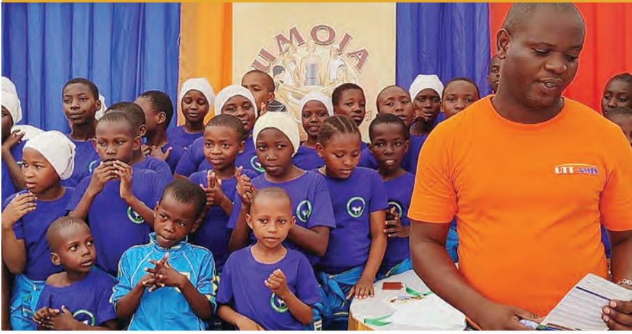
Mapinduzi ya UTT, uwekezaji 'kidogo' kwa vijana na wazee, sasa chanzo kipato cha mwezi