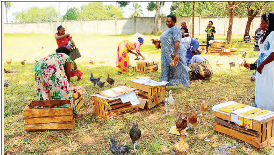
Kinamama wajasiriamali wa Mkuranga wakiwa katika nyendo za shughuli zao.

neo yao, kumekuwapo halmashauri mbalimbali zimekuwa zikiyasaidia, waweze kunufaika nayo.