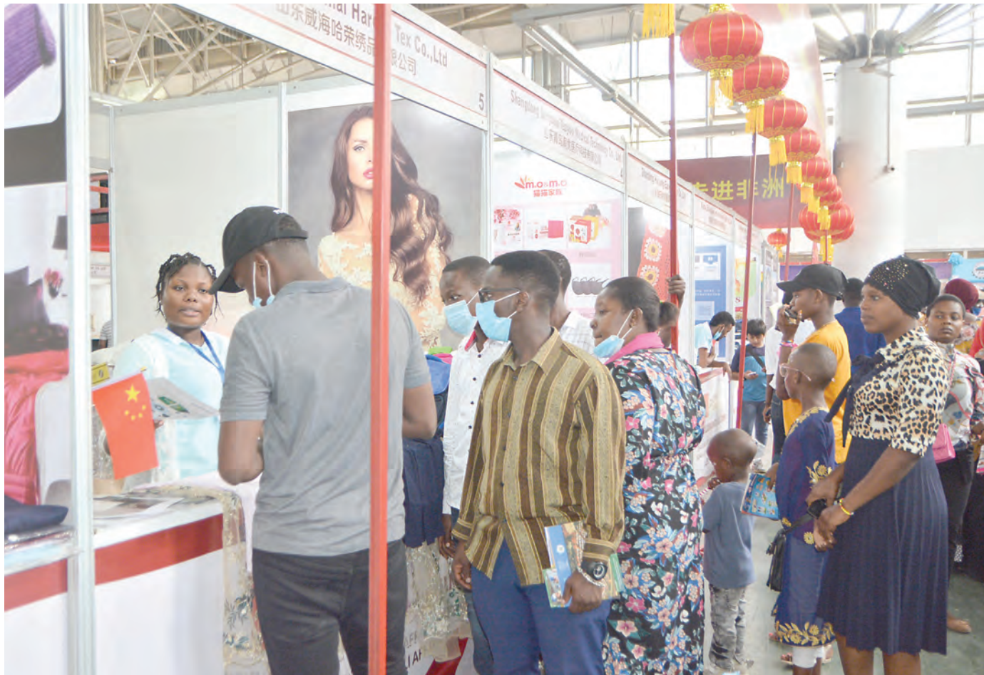
Wananchi wakiangalia bidhaa kwenye banda la wafanyabiashara kutoka China, katika Maonyesho ya 45 ya Biashara ya Kimataifa ya Dar es Salaam, yanayoendelea kwenye Viwanja vya Mwalimu Nyerere, Barabara ya Kilwa jana.

Alisema teknolojia hiyo ya malisho bora kwa mifugo ni kuhakikisha wanaotesha majani ya kisasa yenye virutubisho kwa ajili ya mifugo hiyo.