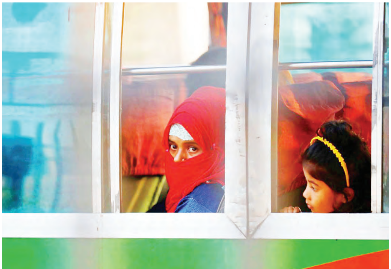
Wakimbizi wa Rohingya watahamishwa katika kisiwa cha a Bhasan Char, pichani baadhi wakiwa katika mabasi maalum kwa ajili ya kutoka kwenye kambi yao ya sasa ya Chattogram, nchini Bangladesh.