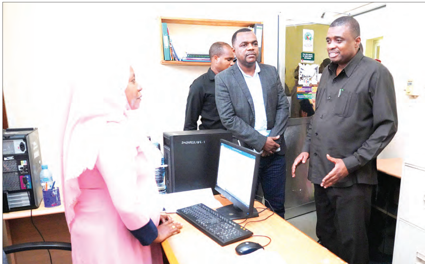
Makamu wa Pili wa Rais wa Zanzibar, Hemed Suleiman Abdulla (kulia), akizungumza na mmoja wa wafanyakazi wa Tume ya Ukimwi Zanzibar, alipofanya ziara maalum kwenye tume hiyo, Shangani jana.