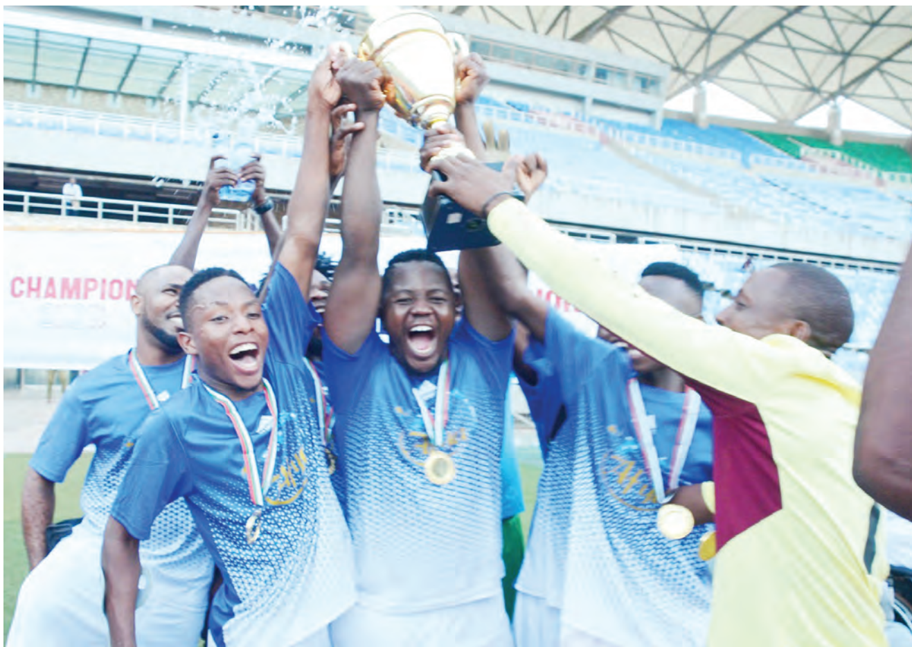
Wachezaji wa timu ya LSL, wakishangilia ubingwa na kombe lao baada ya kuifunga timu ya Ballymun mabao 4-2 na kuibuka mabingwa katika mashindano ya ligi ya soka ya walemavu kwenye Uwanja wa Benjamin Mkapa jijini Dar es Salaam juzi.