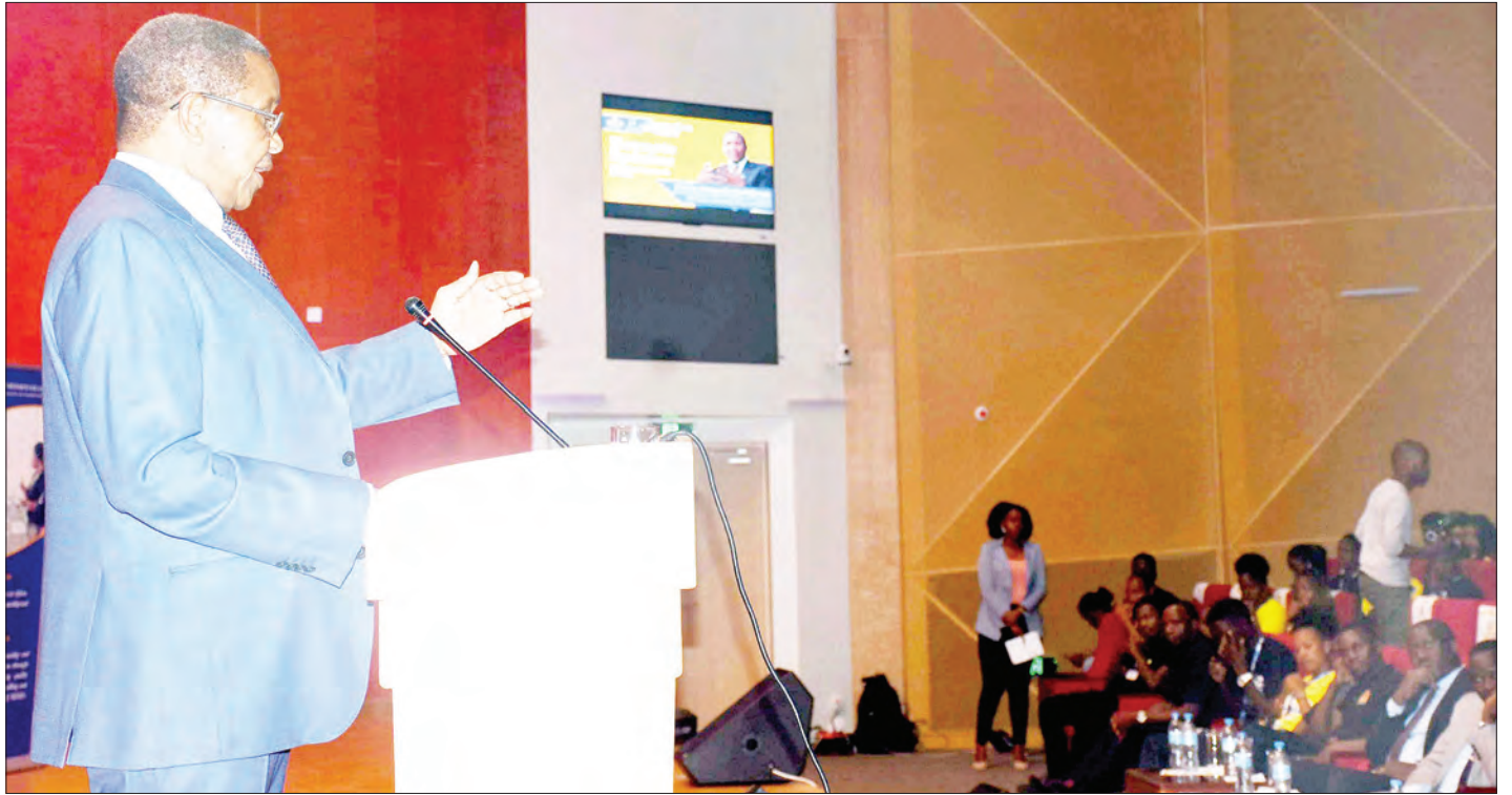
Mkuu wa Chuo Kikuu cha Dar es Salaam, Rais mstaafu Dk. Jakaya Kikwete akizungumza wakati akizindua programu mpya ya mafunzo ya kuwajengea uwezo zaidi wanafunzi ili wahimili soko la ajira, jijini Dar es Salaam, jana.

Mkurugenzi huyo alifafanua kuwa mafunzo hayo yatandeshwa kwa njia shirikishi na kwa vitendo zaidi, kwamba watashiriki semina za kubadilishana mawazo na pia mafunzo kutoka kwa wataalam.