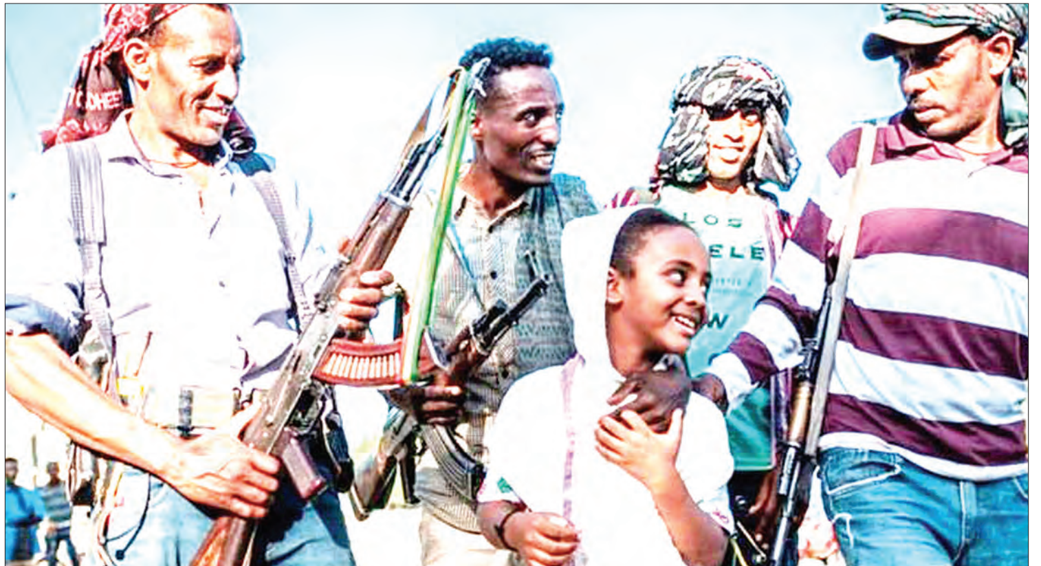
Wanamgambo wa TPLF wakionekana kabla ya kukimbia mji.

"Ninafurahi kuwashirikisha kwamba tumekamilisha na tumesitisha harakati za kijeshi katika jimbo la Tigray," alisema Abiy.