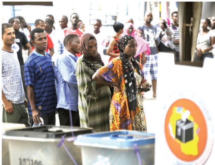
Ajenda ya uchaguzi na kupiga kura ni kupata maendeleo.

Anasema kwa mfano wapo wanaoitoa ili kushawishi kuteuliwa na vyama kugombea nafasi fulani. Lakini pia, inatolewa kwa baadhi ya wapigakura ili kupiga au kutopiga kura na huko ndiko kuwa ajenda ya maendeleo.