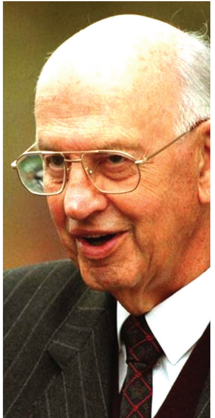
Pieter Willem Botha

Agosti 14, 1989 Pieter Willem Botha, alijiuzulu uraisi baada