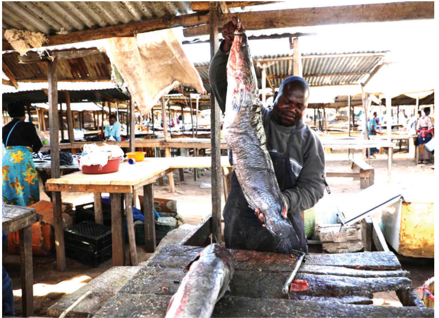
Uvuvi wa samaki katika Ziwa Tanganyika ni moja ya biashara inayoendelea baina ya wafanyabiashara wa Tanzania na Congo.

Baraza hilo linaelewa fika kuwa ziko changamoto za kisiasa kuhusu uanachama wa DRC, lakini kama ilivyo kwingine inaaminika