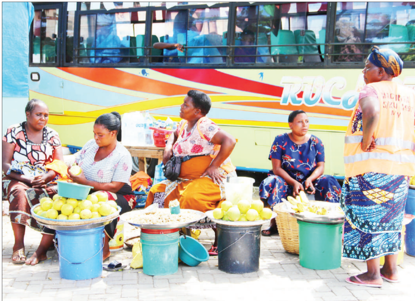
Wachuuzi wa matunda wakisubiri wateja katika kituo kikuu cha mabasi cha Mkoa wa Mbeya juzi, shughuli inayowapatia ujira wa siku.

Mwaijande alisema katika kipindi kilichopita alisimamia miradi mbalimbali ambayo ni ujenzi wa madaraja mawili, kituo cha afya, ujenzi wa zahanati na ujenzi wa madarasa yaliyokuwa yakiwasumbua wananchi.