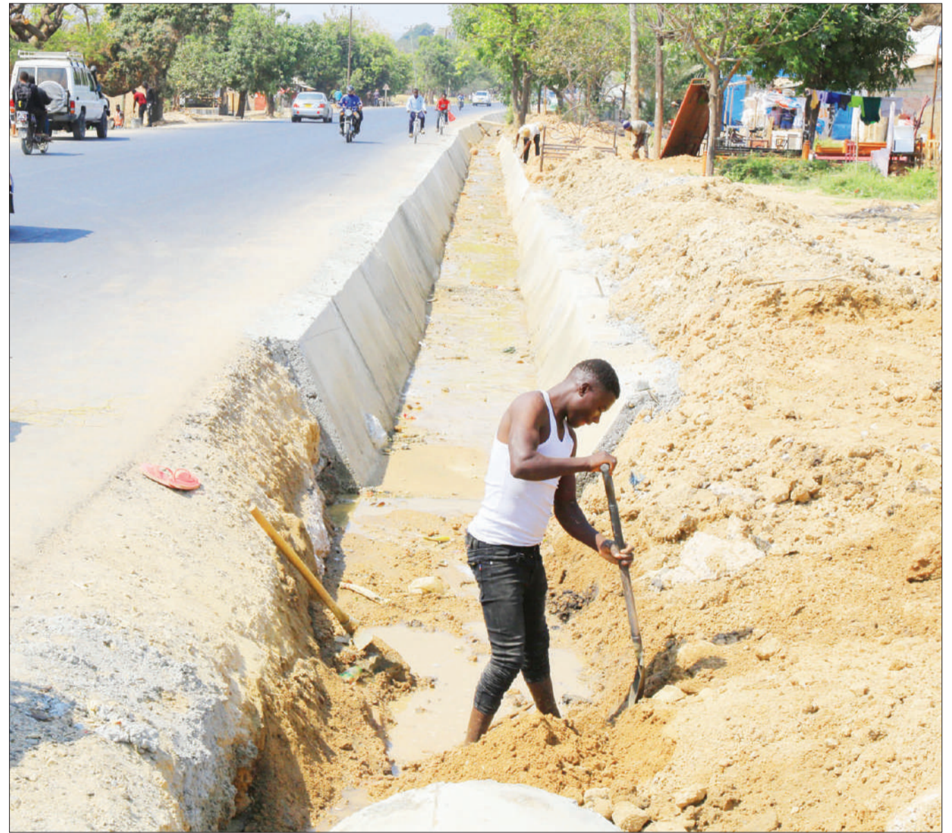
Mafundi wakiwa katika ujenzi wa mitaro ya maji katika Barabara ya Dodoma - Arusha, eneo la Mailimbili, jijini Dodoma jana. Eneo hilo, limekuwa na changamoto ya kujaa maji wakati wa msimu wa mvua na kusababisha barabara hiyo kuharibika.