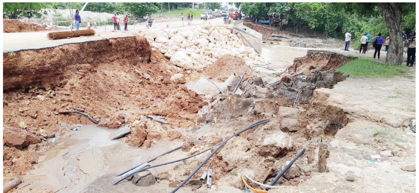
Sehemu ya daraja la mto Tegeta jijini Dar es Salaam lililobomoka kutokana na mvua kubwa iliyonyesha juzi likifanyiwa ukarabati jana.

Wakizungumza baadhi ya wananchi na wanafunzi wa vyuo vikuu, waliofika katika maonesho hayo na kutembelea banda lida hiyo walisema elimu waliyopatiwa na maofisa hao ni muhimu na itawasaidia kufahamu umuhimu wa kujikinga na madhara yatokanayo katika sehemu za kazi.