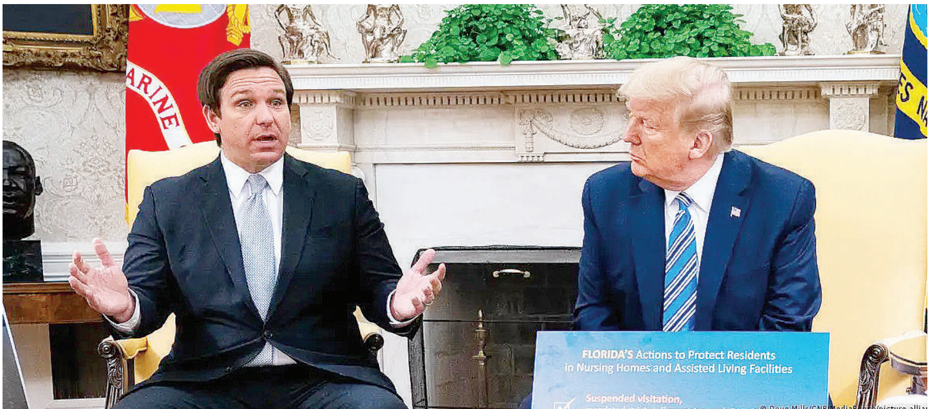
Gavana wa Jimbo la Florida Ron Desantis kushoto aliyekiunga kwenye kinyang'anyiro cha urais na kumuunga mkono Donald Trump.