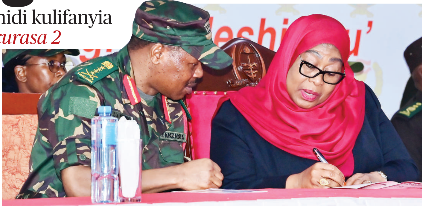
Rais Samia Suluhu Hassan akiteta jambo na Mkuu wa Majeshi ya Ulinzi ya Wananchi wa Tanzania Jenerali Jacob John Mkunda wakati wa mkutano wa CDF na Makamanda kwa mwaka 2023 ambao ulifanyika Lugalo Jijini Dar es Salaam jana.