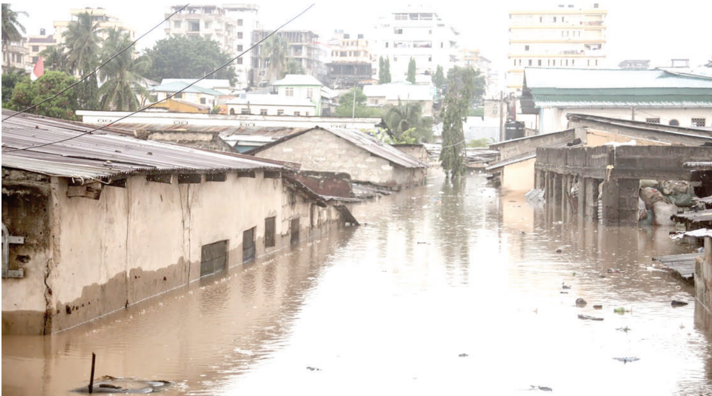
Mafuriko yanavyotishia maisha, mali na miundombinu..

M ABADILIKO ya tabianchi hayakwepeki. Mvua kubwa, vimbunga baharini, mtemeko ardhini na maporomoko ya milima kadhalika nayo hakuna namna ya kuyakimbia.