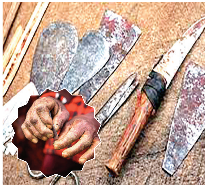
Baadhi ya vifaa vya ukeketaji vinavyotumiwa kuwaadhibu wanawake.

Inaitaja mikoa ya Manyara, Arusha na Mara kuwa kinara kwa kuwa na asilimia zaidi ya 30 ya wanawake waliofanyiwa ukeketaji, ikimaanisha kuwa katika wanawake 100 wa mikoa hiyo 30