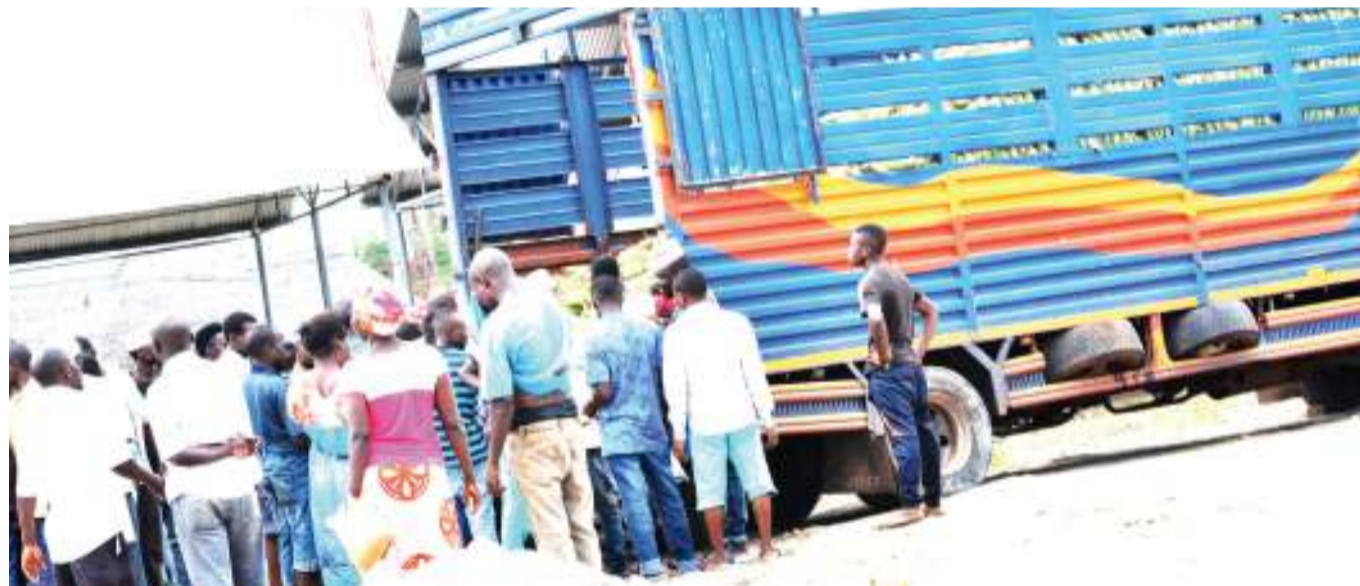
Wachuuzi wa mahidi ya kuchoma na kuchemsha wakiwa kwenye foleni ya kusubiri bidhaa hiyo, kushushwa toka kwenye lori, katika soko la Ubungo Mawasiliano, jijini Dar es Salaam wikiendi. Mhindi mmoja mbichi uliuzwa kwa bei ya 300