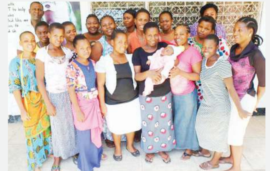
Kizazi kinachotarajiwa kuunda taifa bora baadaye.