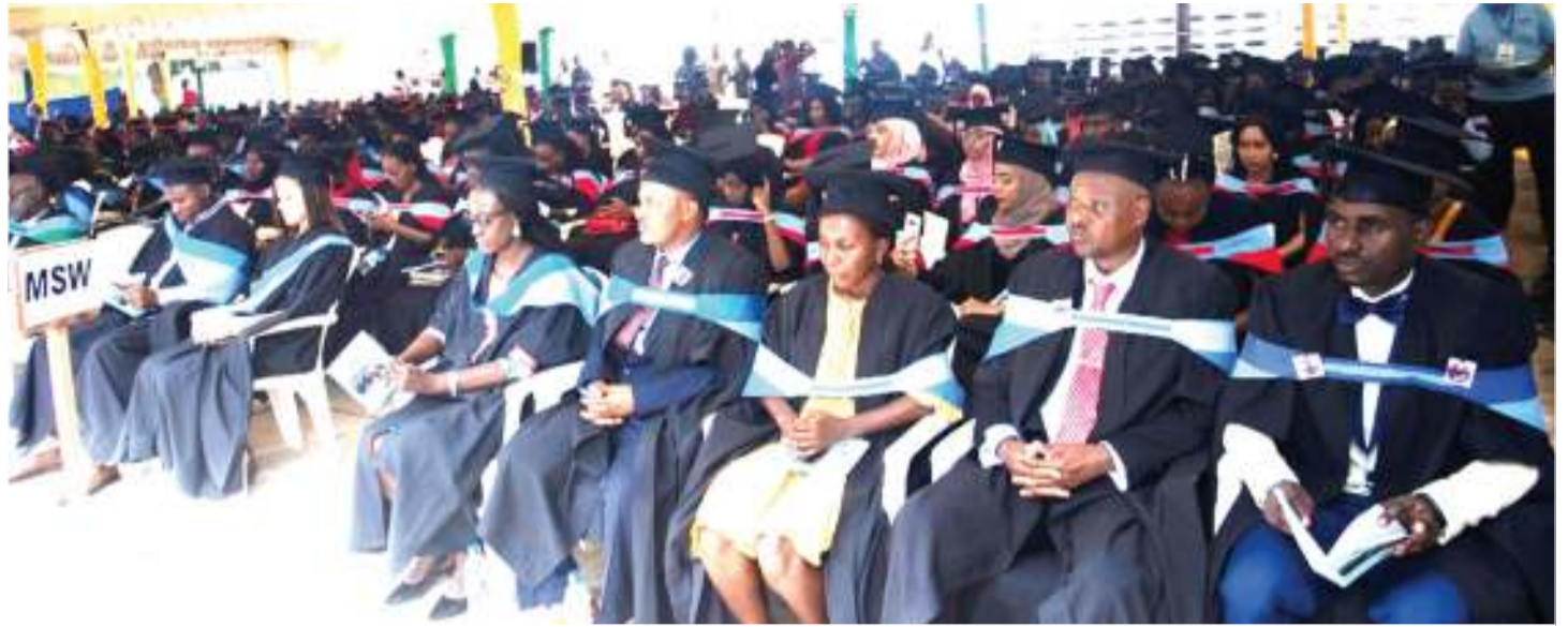
Baadhi ya wahitimu katika Chuo Kikuu cha Kumbukumbu cha Hubert Kairuki (HKMU), wakiwa kwenye mahafali ya 17 ya chuo hicho, yaliyofanyika jijini Dar es Salaam wikiendi. Waliohitimu ni wa fani za udaktari, uuguzi na ustawi wa jamii.