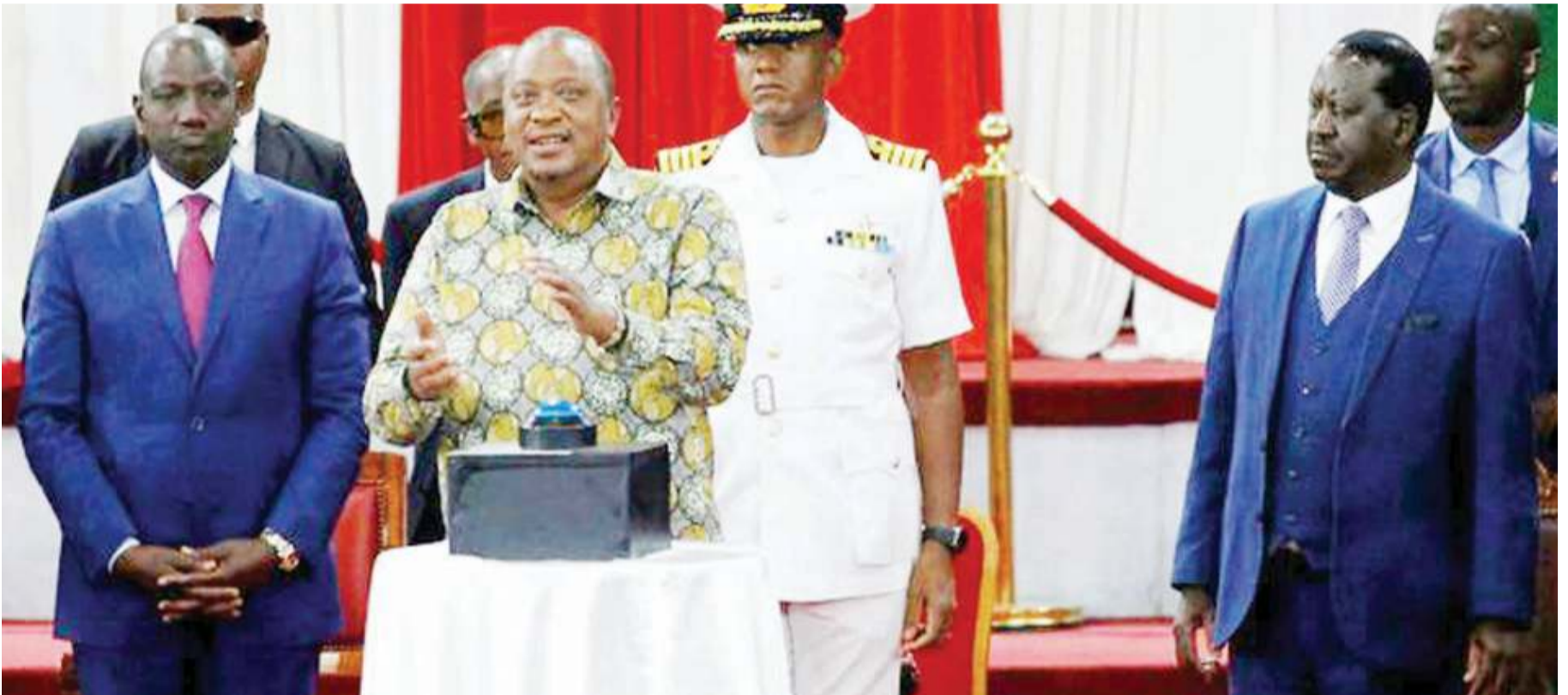
Rais wa Kenya, Uhuru Kenyatta akizindua ripoti ya maridhiano itwayo BBI, nchini humo.

Upande unaomuunga mkono Raila unataka nafasi ya Waziri Mkuu mwenye mamlaka kinyume na ilivyopendekezwa kwenye ripoti hiyo, ambapo atakuwa akichaguliwa na rais na anaweza akafutwa kazi wakati wowote na rais. DW