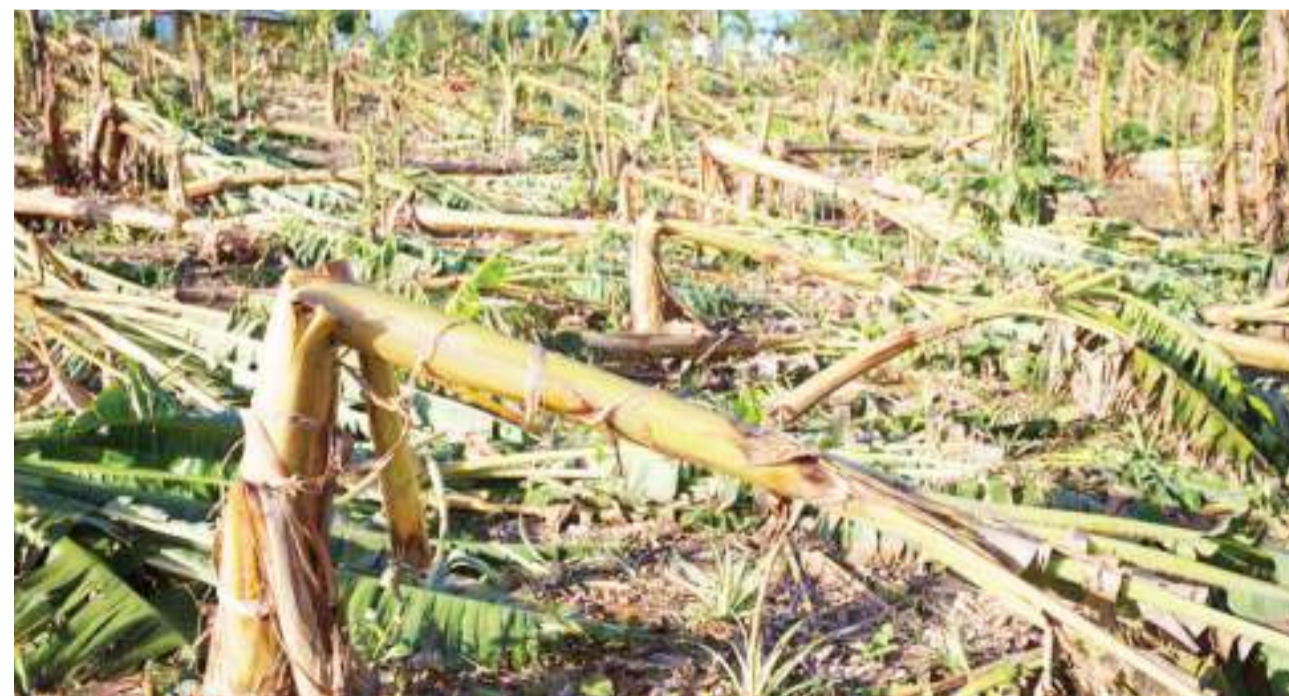
Athari za mabadiliko ya tabianchi, upepo mkali na mvua kubwa zimesababisha migomba kuanguka katika mashamba ya ndizi na kuwaletea wakulima hasara.

Kutokana na mabadiliko ya tabianchi kuathiri nchi nyingi zinazoendelea, Umoja wa Ulaya (EU), ulianzisha "Global Climate Change Alliance (GCCA)" mwaka 2007.