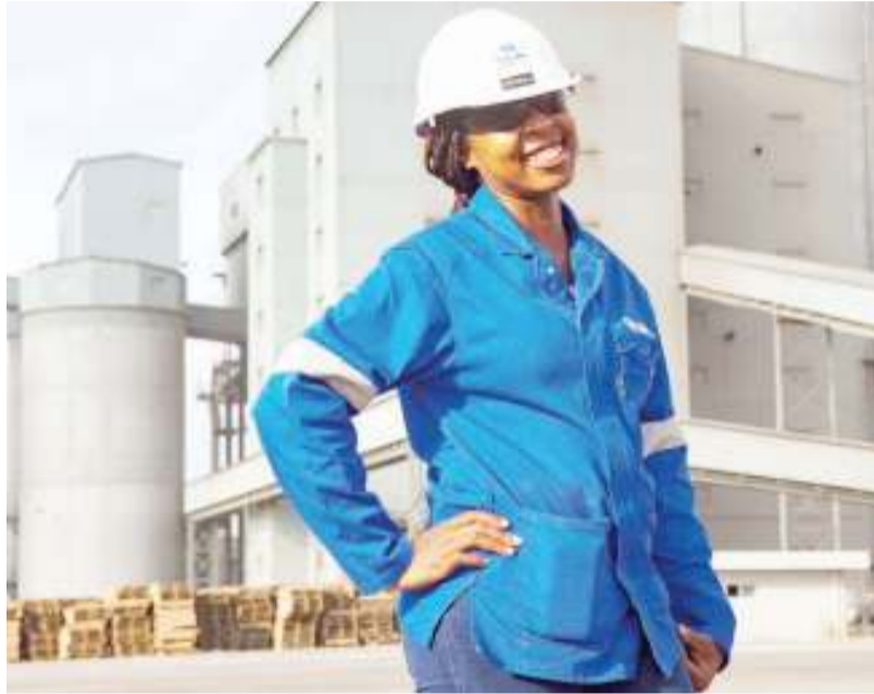
Tabasamu la mtumishi huyu ni kwasababu ya kuwa mwanachama wa chama cha wafanyakazi.

Kwa mujibu wa taratibu za chama hicho, endapo mtumishi atajiunga na kupata matatizo ya kiutumishi au mgogoro