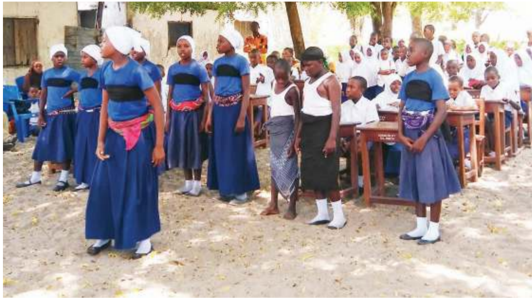
Watoto wa Shule ya Msingi Kilindoni, Mafia wakicheza ngoma kuhamasisha ulinzi wa mabinti dhidi ya ukatili wa kijinsia unaofanyika kupitia mradi wa SVAGs.

Hapo ushahidi unakosa nguvu kama binti ana mimba bila kupima nasaba (DNA) inakuwa vigumu kwa sababu hakuna ushahidi wa awali