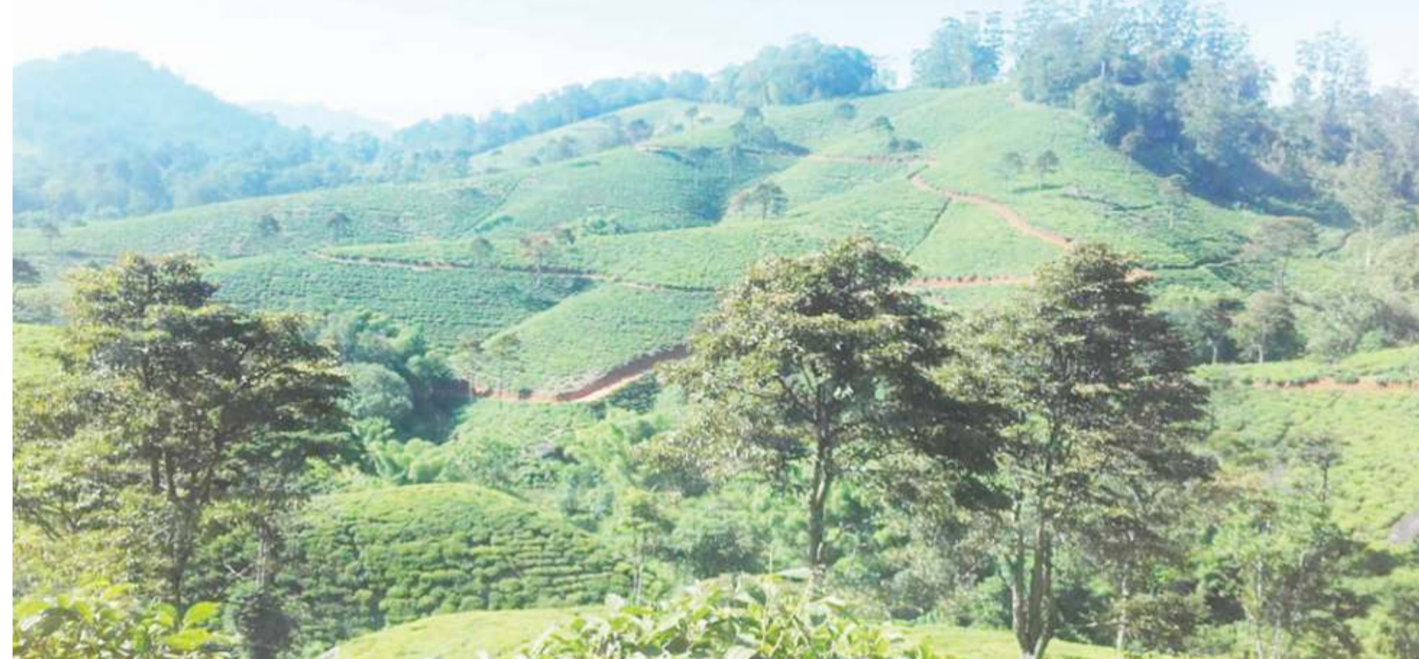
Moja ya maeneo yenye matumizi endelevu ya ardhi ikijumuisha kilimo na utunzaji wa uoto asili.

T ANZANIA imekuwa ikiathiriwa na athari za mabadiliko ya tabianchi kama ilivyo kwa mataifa mengine yanayoendelea. Athari hizo zinajumuisha kuongezeka kwa wastani wa joto, kina cha bahari, na majanga ya hali ya hewa ikiwamo ukame na mafuriko.