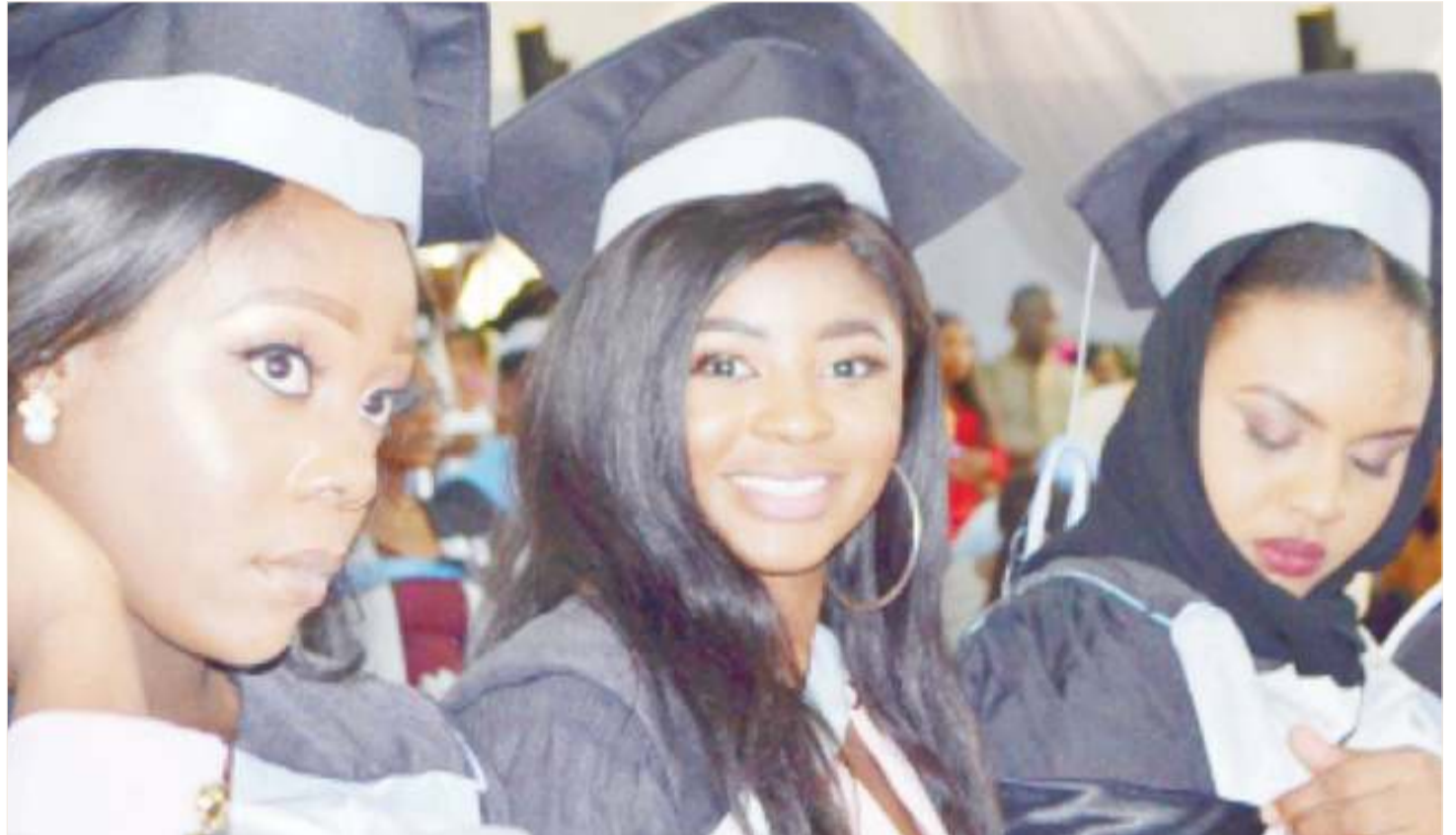
Watoto watafauluje kuwa na mafanikio na maisha bora katika zama hizi za utandawazi? Pengine kupitia malezi bora na familia imara.

Mtoto anayepata kila kitu atakacho anataka abaki nyumbani azurure au anakwenda shule kama sehemu tu ya kukutana na wenzie na kucheza. Anaweza kufaulu katika madarasa ya chini au elimu ya msingi ambapo inatosha kwa mtoto kwenda shule, lakini sekondari atatakiwa kujisomea hivyo ataanza kukwama, na chuoni hatafika kwa vile hata angeingia atakata tamaa kutokana na kasi ya masomo na mitihani.