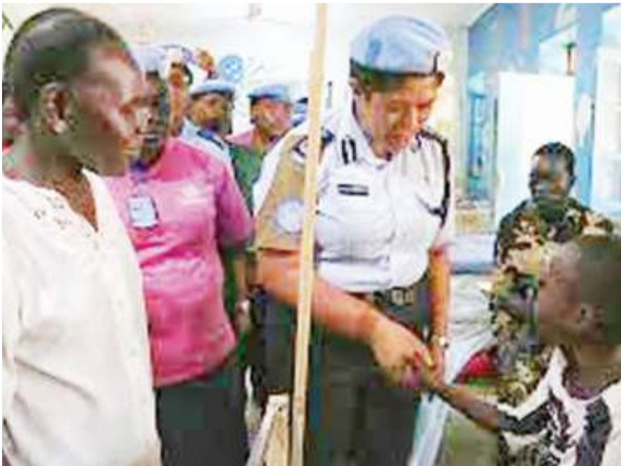
Polisi wakitoa huduma za kijamii kwa kuwajali watoto na wanawake katika matukio yanayoongeza uhusiano baina ya polisi na raia.