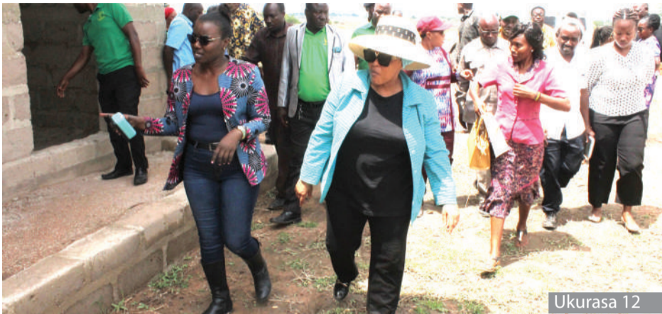
Wananchi wanavyoinua kijiji kielimu