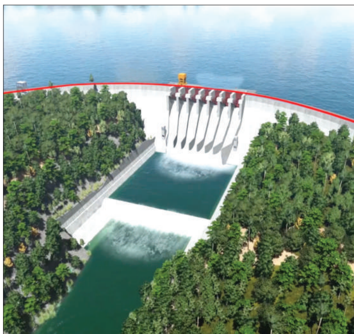
Mwonekano wa bwawa la kuzalisha umeme la Julius Nyerere.