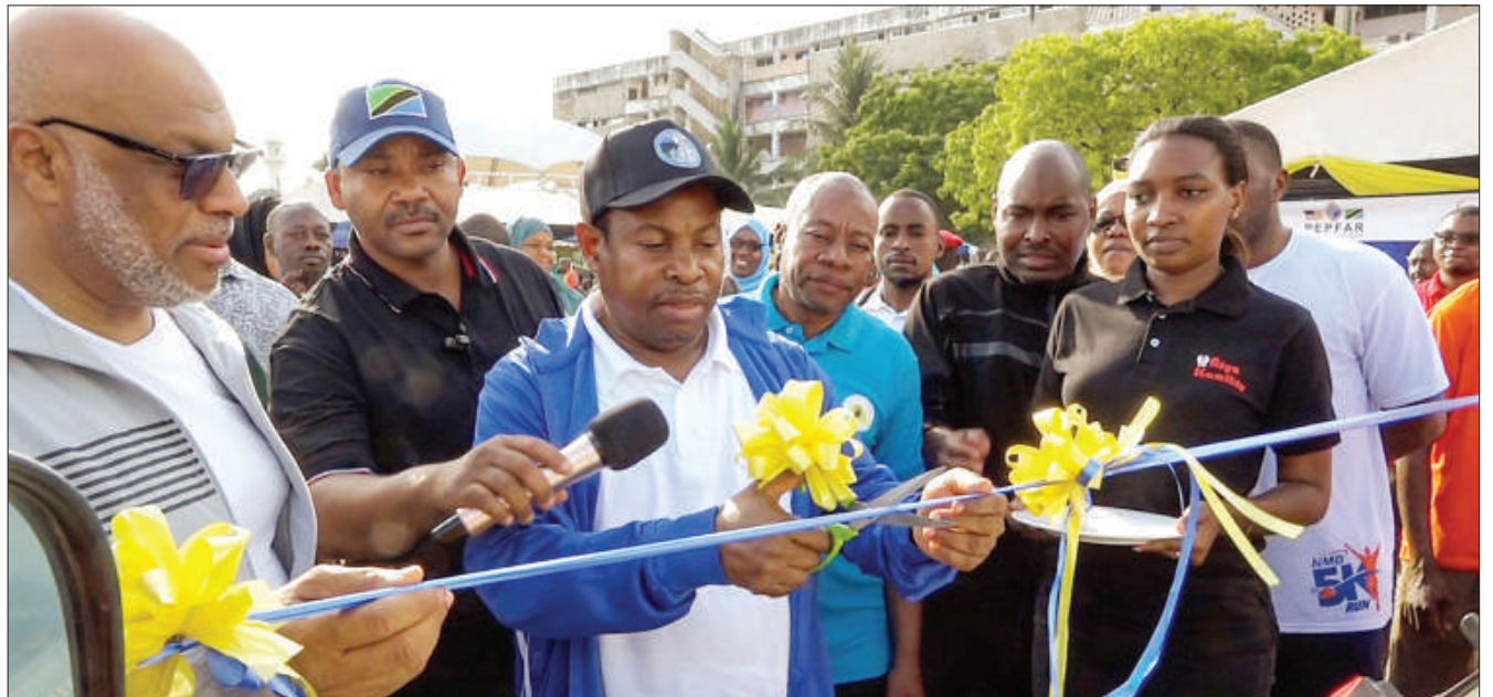
Makamu wa Kwanza wa Rais wa Zanzibar, Othman Msoud Othman (katikati), akikata utepe kuashiria uzinduzi rasmi wa kampeni maalum ya chanjo dhidi ya Uviko-19 uliofanayika Viwanja vya Kisonge Michenzani mjini Zanzibar. Kampeni hiyo inakwenda sambamba na maadhimisho ya Siku ya Kisukari Duniani. Kushoto ni Waziri wa Afya, Ustawi wa Jamii, Jinsia, Wazee na Watoto, Zanzibar, Nassor Ahmed Mazrui.

Kwa washiriki wa mafunzo, walisema kuwa watahakikisha mafunzo waliyopatiwa wanayafanyia kazi ili kuku-sanya takwimu zinazohitajika ikiwamo za udhalilishaji kwa wanafunzi.