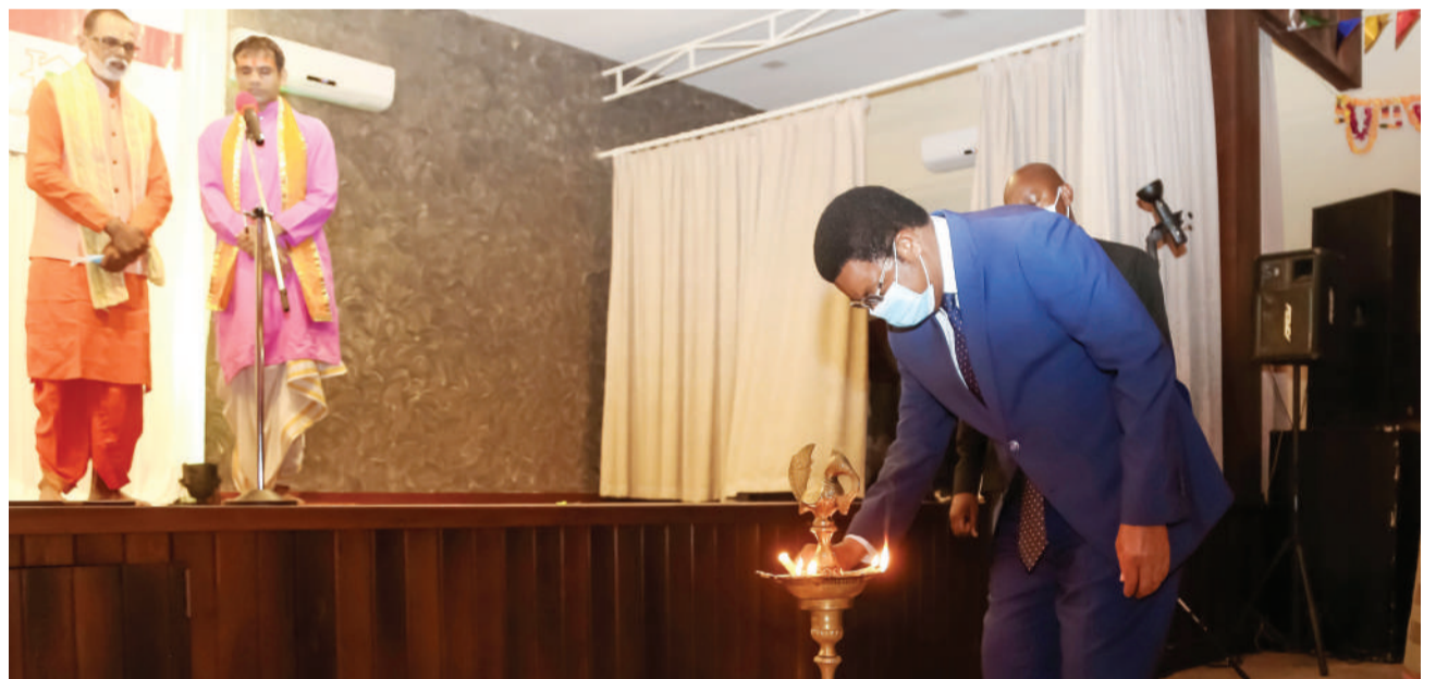
Waziri Mkuu, Kassim Majaliwa, akiwasha mshumaa, kuashiria kupokea mwaka mpya wa Kihindu, kwenye sikukuu ya Diwali na sherehe za mwaka mpya wa Kihindu, zilizofanyika, Kisutu jijini Dar es Salaam jana.

Akizungumzia safari yake hiyo, alisema: "Nina furaha kutembelea Tanzania, nitazindua jukwaa la biashara ikiwa ni alama ya kuanza kwa majadiliano yatakayojenga maelewano na mtazamo mmoja kwa nchi zetu. Wafanyabiashara wa Uingereza ni miongoni mwa wawekezaji Tanzania. Ni matamano yangu kuona waonaongezeka siku zijazo."