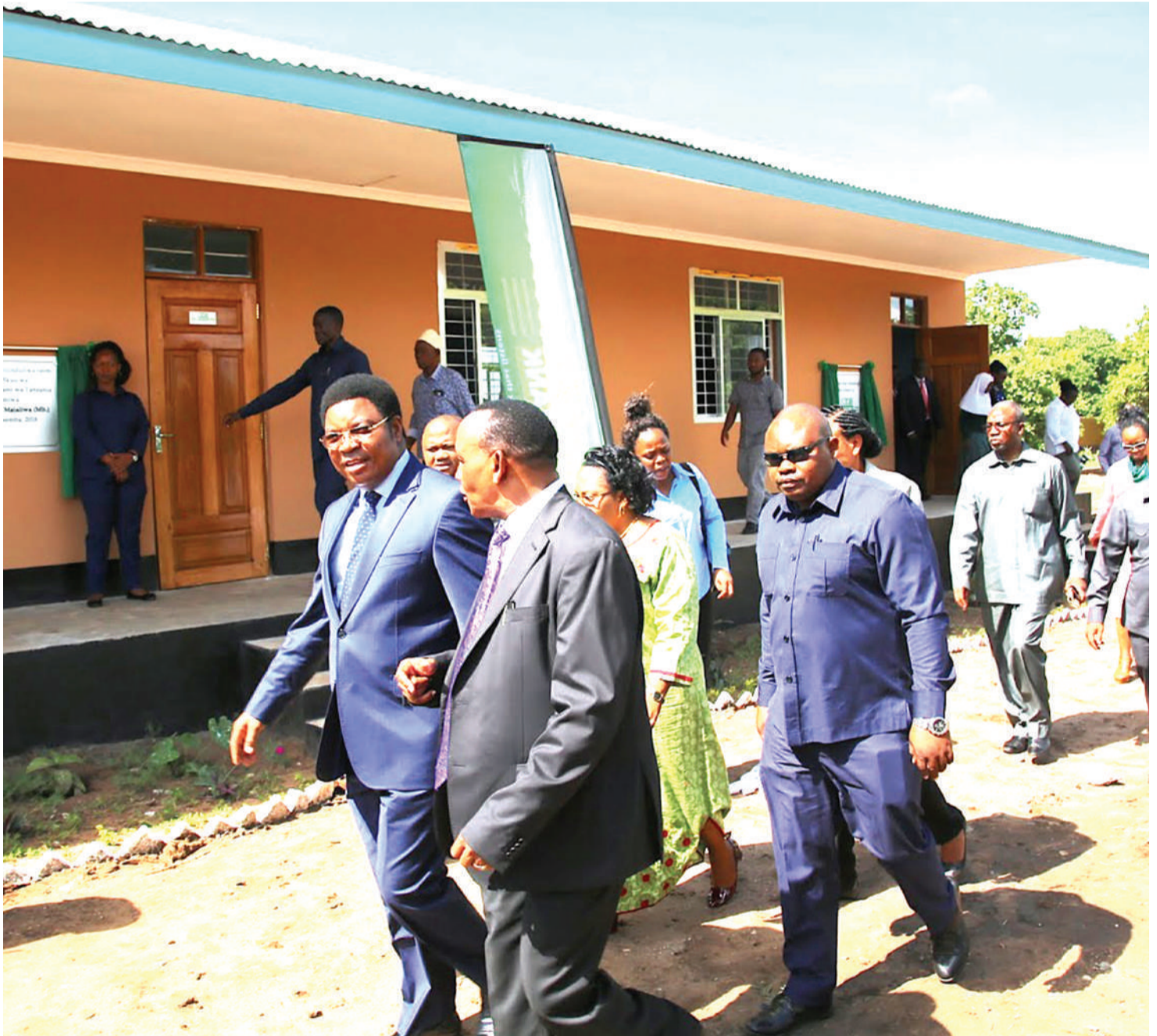
Waziri Mkuu, Kassim Majaliwa (kushoto), katika moja ya ziara za kukagua ujenzi wa madarasa ya sekondari.

Moja ya visababishi vinavyooneza au kusambaza kwa kasi maambukizi ya ugonjwa wa corona ni msongamano ndiyo maana wataalamu wa afya wana-shauri kuepuka misongamano isiyo ya lazima ili kupunguza kuenea kwa maradhi hayo, hali hiyo inadhahirisha kuwa msonga-