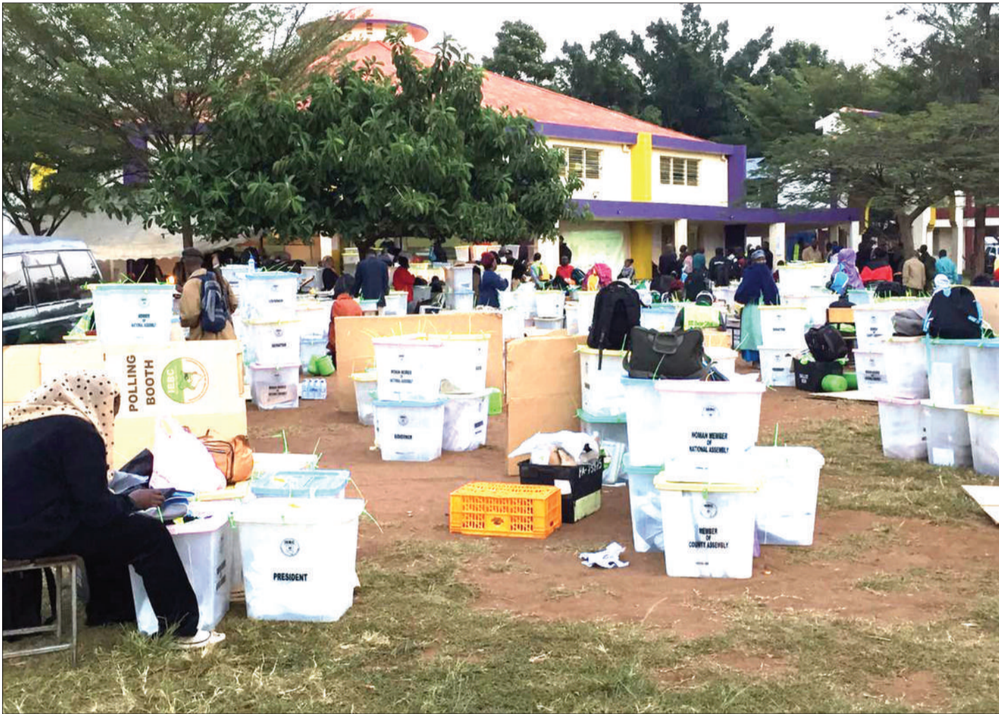
Mchakato wa uchaguzi ukiendelea katika moja ya vituo vya kukusanya na kuhesabu karatasi za kura.