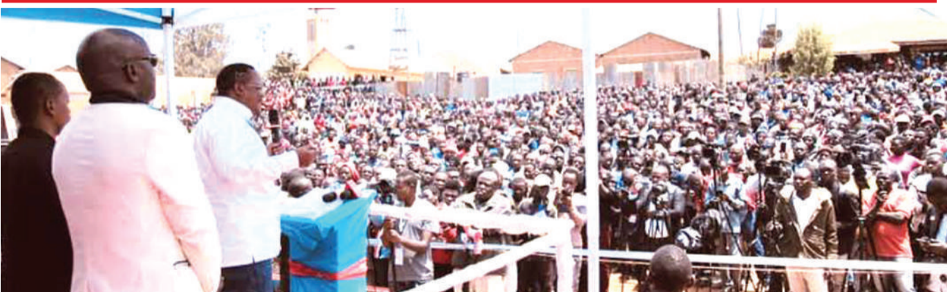
Mgombea urais kwa tiketi ya Chama cha Demokrasia na Maendeleo (CHADEMA), Tundu Lissu, akihutubia mkutano wa kampeni za uchaguzi mkuu, katika viwanja vya National Housing mjini Njombe jana.

AMGOMEA Tibaijuka kustaafu siasa, Lissu aliamsha Njombe, Membe ataja kinachomkwamisha... Endelea Ukurasa 2