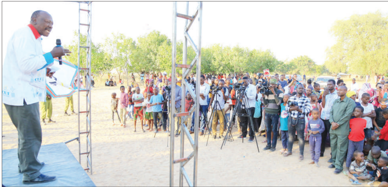
Mgombea urais kupitia Chama cha Wananchi (CUF), Prof. Ibrahim Lipumba, akihutubia mkutano wa kampeni za uchaguzi mkuu katika uwanja wa shule ya Medeli, jijini Dodoma juzi jioni.

Alisema kama taasisi hizi zinaendesha biashara ni vyema zikafuata taratibu za kisheria na uchunguzi unaendelea kwa ambao watakaidi watakatwa na kufikishwa mahakamani.