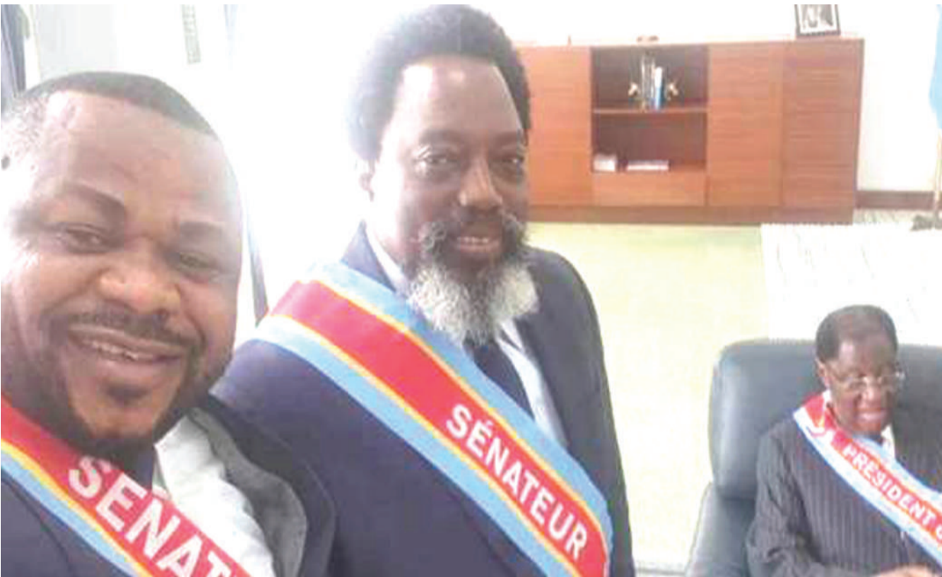
Rais mstaafu wa Jamhuri ya Kidemokrasia ya Congo (DRC), Joseph Kabila (wa pili kushoto), amekuwa seneta wa maisha, kulingana na katiba ya nchi hiyo.