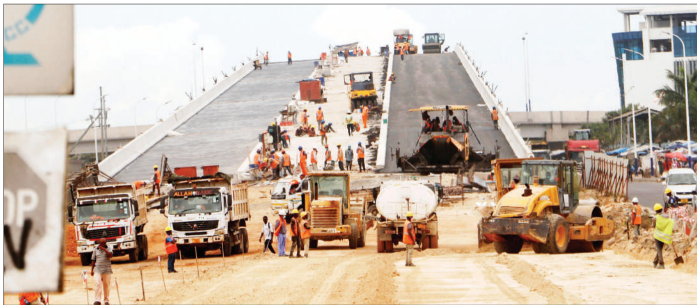
Mafundi wa kampuni ya CCECC, wakiendelea na ujenzi wa barabara za juu za mpishano katika makutano ya barabara za Morogoro, Sam Nujoma na Nelson Mandela, eneo la Ubungo, jijini Dar es Salaam jana.

“Mama Tibaijuka amesema amestaafu siasa, lakini kwangu mimi hajastaafu, hivyo ni faida ya kuwa na watu sehemu fulani ambao wanaweza kuisaidia serikali. Mimi ninamwambia kuwa profesa haujastaafu, hatuwezi kumwacha wakati kuna maeneo mengi anaweza kufanya kazi,” alisisitiza.