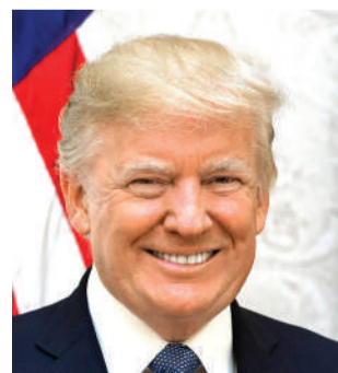
Marekani nchini Afrika Kusini ulipangwa kabla ya uchaguzi wa rais mwezi Novemba.

Ripoti ya vyombo vya habari nchini Marekani, zimenukuu maofisa ambao hawakutajwa majina, wakisema kuwa mpango unaodaiwa kupangwa na Iran wa kumuua balozi wa