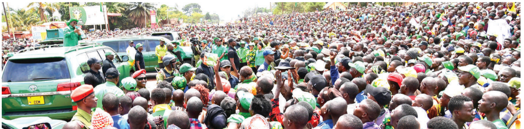
Mgombea urais kupitia tiketi ya Chama Cha Mapinduzi (CCM), DK. John Magufuli, akihutubia maelfu ya wananchi wa Wilaya ya Muleba, mkoani Kagera jana.