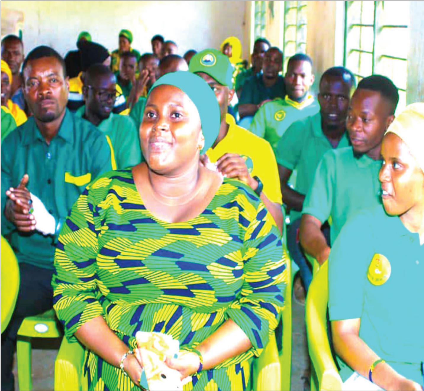
Baadhi ya viongozi wa CCM wakiwa kwenye kikao kilichohutubiwa na Mwenyekiti Mkoa, Twaiba Mpako.