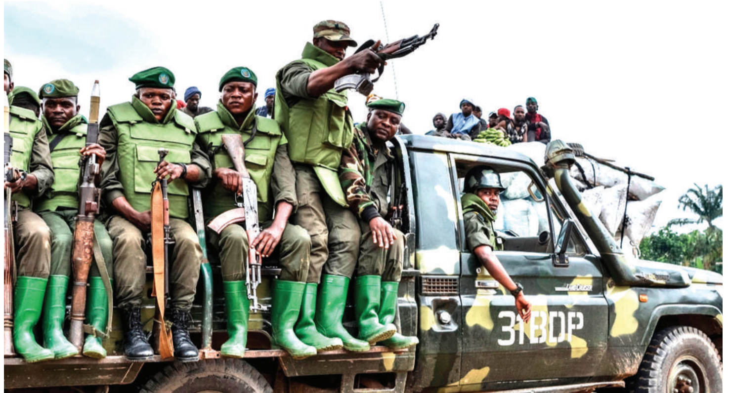
Ndivyo Congo ilivyojaa waasi, majeshi na silaha.

Katika shambulio hilo miili 20 ilibainika kwenye mauaji yanayofanyika wakati wananchi walifikiria kuwa vikosi vya muungano wa majeshi ya Kongo na Uganda vingesaidia, lakini wamebaki