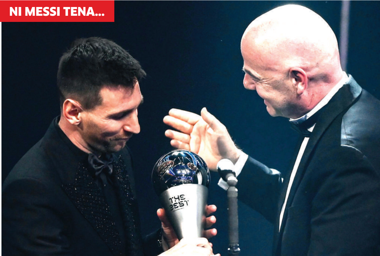
Mshambuliaji wa Argentina na Paris Saint-Germain, Lionel Messi (kushoto), akipokea Tuzo ya Mchezaji Bora wa Mwaka wa Fifa 2022 kwa Wanaume kutoka kwa Rais wa Fifa, Gianni Infantino, kwenye sherehe za utoaji wa tuzo za shirikisho hilo zilizofanyika jijini Paris, Ufaransa usiku wa kuamkia jana.