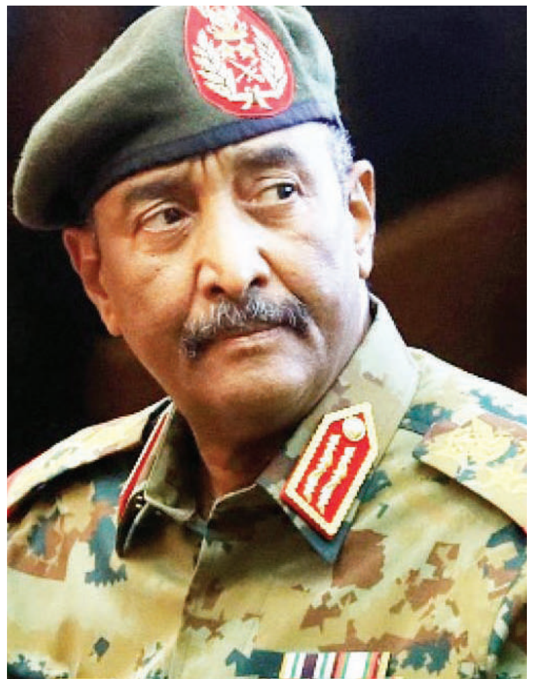
Jenerali Abdel Fattah al-Burhan, kiongozi wa kijeshi wa Sudan, ambaye ni rais na mkuu wa majeshi, anayetishiwa na RSF.

tangazwa na Jenerali al-Burhan akiwa anaona ulazima wa Sudan kutengemaa, kuwa hali ya kawaida.