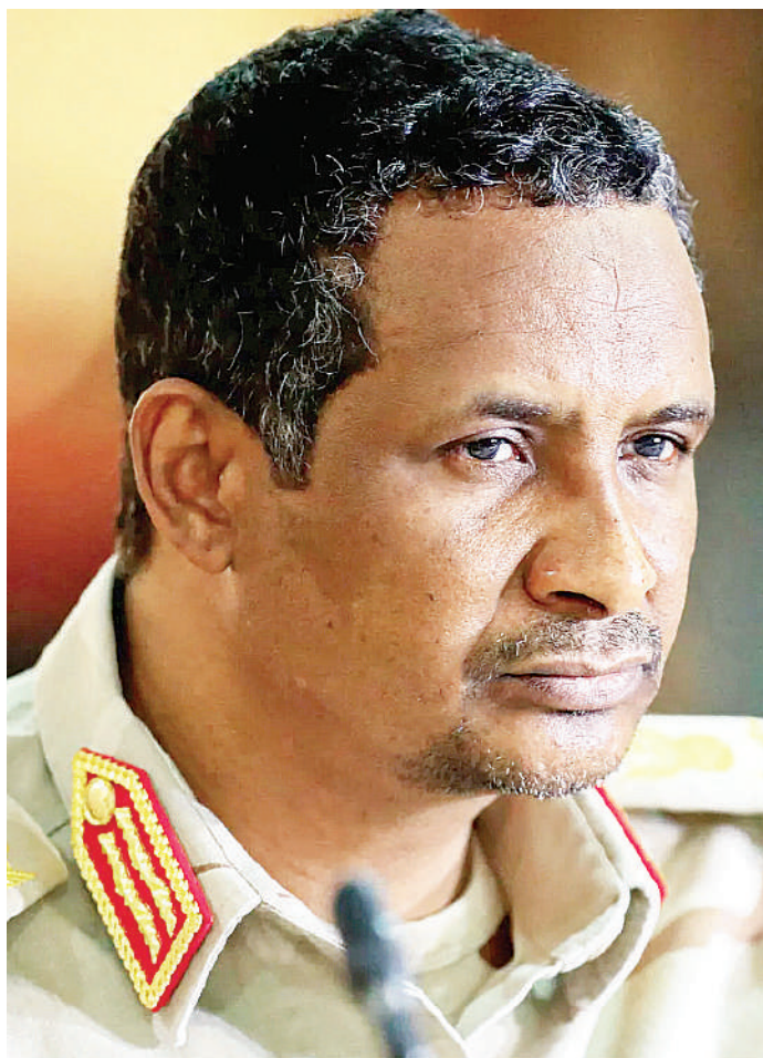
Mohamed Hamadan Dagolo, kamanda wa zamani wa Janjaweed, anayebeba hatima ya Sudan akiviongoza vikosi vya RSF vinavyoazimia kutwaa uongozi.

Tabaka la mamwinyi linataka utawala mkali wa kijeshi, na siyo 'weledi' wa jeshi la Sudan kuafikiana na Kamati ya Madak-tari wa Sudan ili kuelekea katika serikali halisi ya mpito, ilivyo-