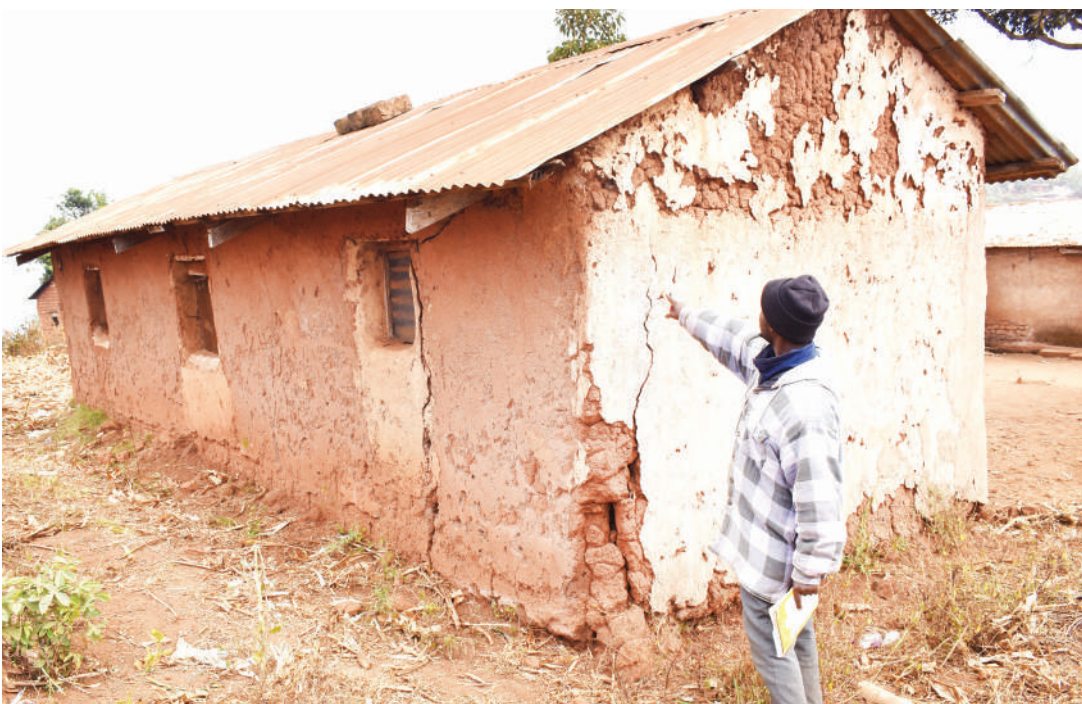
Moja ya nyumba za walimu katika Shule ya Msingi Kiboriani wilayani Mpwapwa. Fedha zilizo-tajwa na CAG kufujwa zingetumika kuboresha miundombinu ya shule za msingi nchini, ikiwamo shule hii.

Baba wa Taifa Mwalimu Julius Nyerere, wakati wa uongozi wake alisema maendeleo endelevu yanahitaji vitu vinne ardhi, watu, siasa safi na uongozi bora. Vyote kimsingi vipo, lakini ukinyatama na kulinganisha na hatua