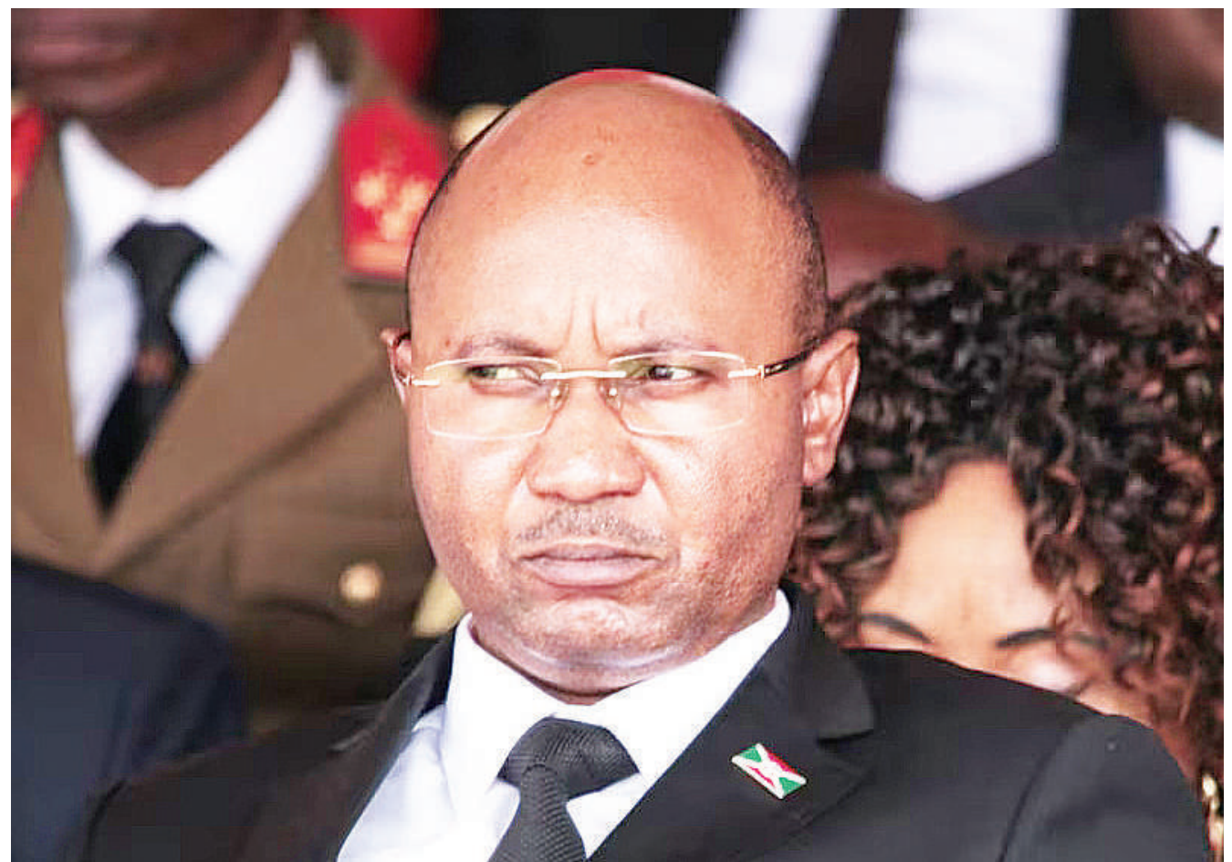
Waziri Mkuu wa zamani wa Burundi, Alain Bunyoni, anayedaiwa kuzuiliwa jela kwa tuhuma za kuhatarisha usalama wa taifa hilo.

Hata hivyo mapambano yanayoendelea mahakamani hayawezi kuzuia kuapishwa kwa Tinubu Mei 29. Tinubu ni mrithi wa aliyekuwa Rais wa Nigeria, Muhammadu Buhari aliyekuwa madarakani kwa mihula miwili. VOA