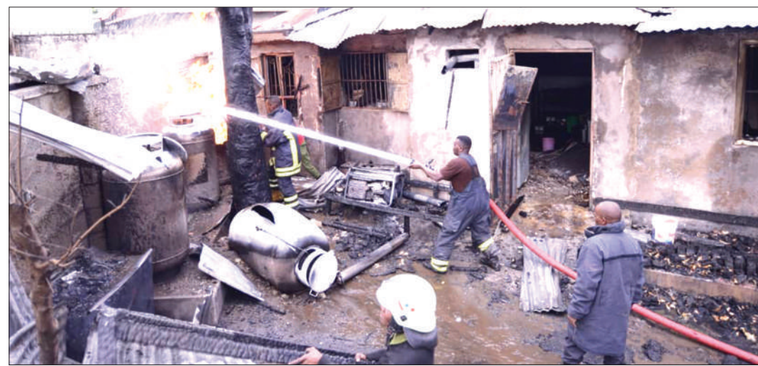
Askari wa Jeshi la Zimamoto na Uokoaji wa Jiji la Arusha, wakizima moto uliotokana na mlipuko wa mitungi ya gesi katika kiwanda kidogo cha mikate cha Haji's, katika Kitongoji cha Keranyi wilayani Arumeru jana. Watu wanne wali- jeruhiwa akiwamo mmiliki wa kiwanda hicho.