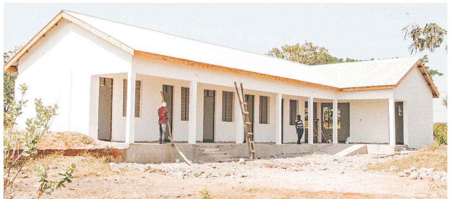
Zahanati ya Kijiji cha Mwamagunguli Manispaa ya Shinyanga, ujenzi unaendelea.