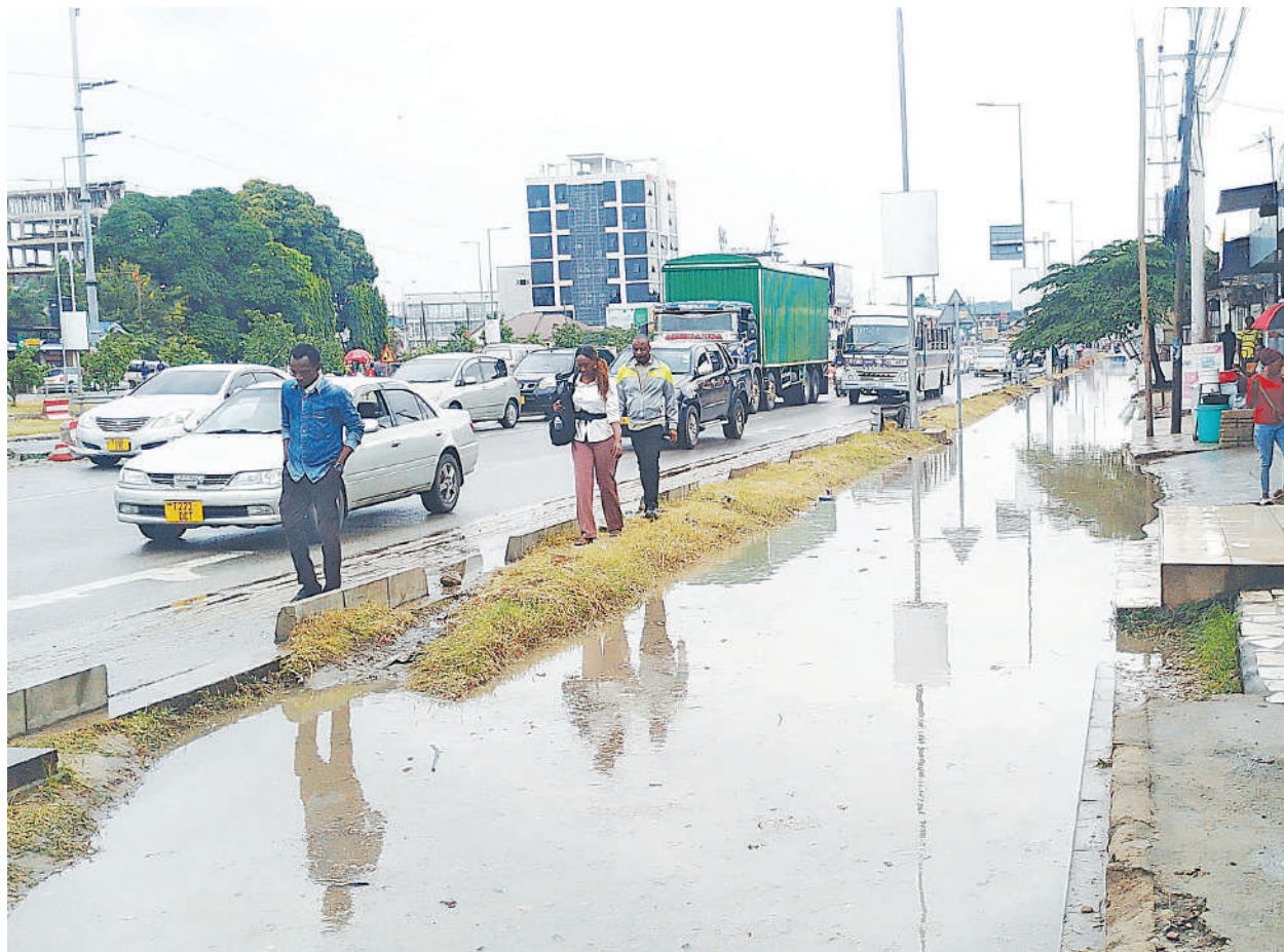
Wananchi wakipishana na magari, baada ya eneo la waenda kwa miguu kujaa maji kando ya Barabara ya Bagamoyo, eneo la Mwenge, kutokana na mvua kubwa iliyonyesha Dar es Salaam jana.

Wataalamu wa afya kutoka Hospitali ya Taifa, Rufani Kanda na mikoa nchini wamekutana na wenzao kutoka Hospitali Queen-Elizabeth ya Uingereza chini ya uratibu wa TUHEDA ili kujadiliana mbinu mbalimbali za uboreshaji wa tiba na huduma za afya nchini.