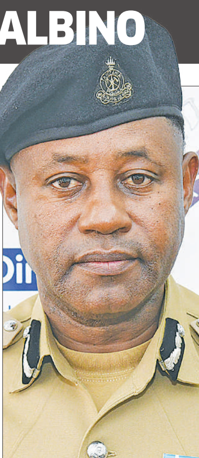
DCP David Misime

WADAIWA kukutwa na viungo waki-saka mteja... Endelea ukurasa 2