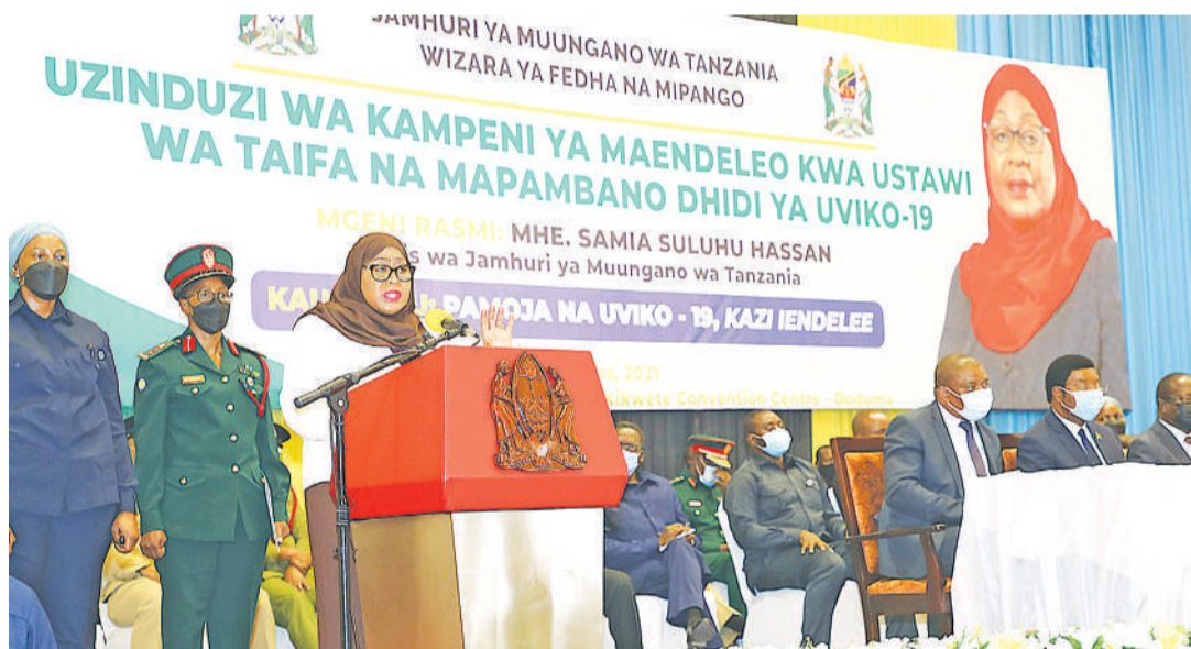
Rais Dk. Samia Suluhu Hassan, alipozindua kampeni ya kitaifa kukabili maradhi ya UVIKO 19.

Akaendelea: "Hapa nchini tumekuwa tukifuata miongozo kadhaa ya kinga inayotolewa na wataalamu na kwa kutumia njia zetu za tiba asilia tumeweza kwa kiasi kikubwa kushusha kiwango