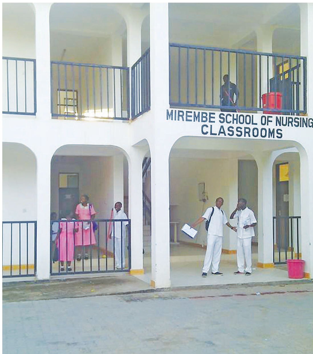
Chuo cha Tiba Mirembe, Dodoma, kunakoanzishwa masomo tiba afya ya akili, kama ilivyo Chuo Kikuu cha Afya na Sayansi Shirikishi cha Muhimbili (MUHAS), Dar es Salaam.

Waziri wa Afya, Ummu Mwalimu, anasema serikali hadi sasa imejitoshesha kwa vifaa vya kisasa na