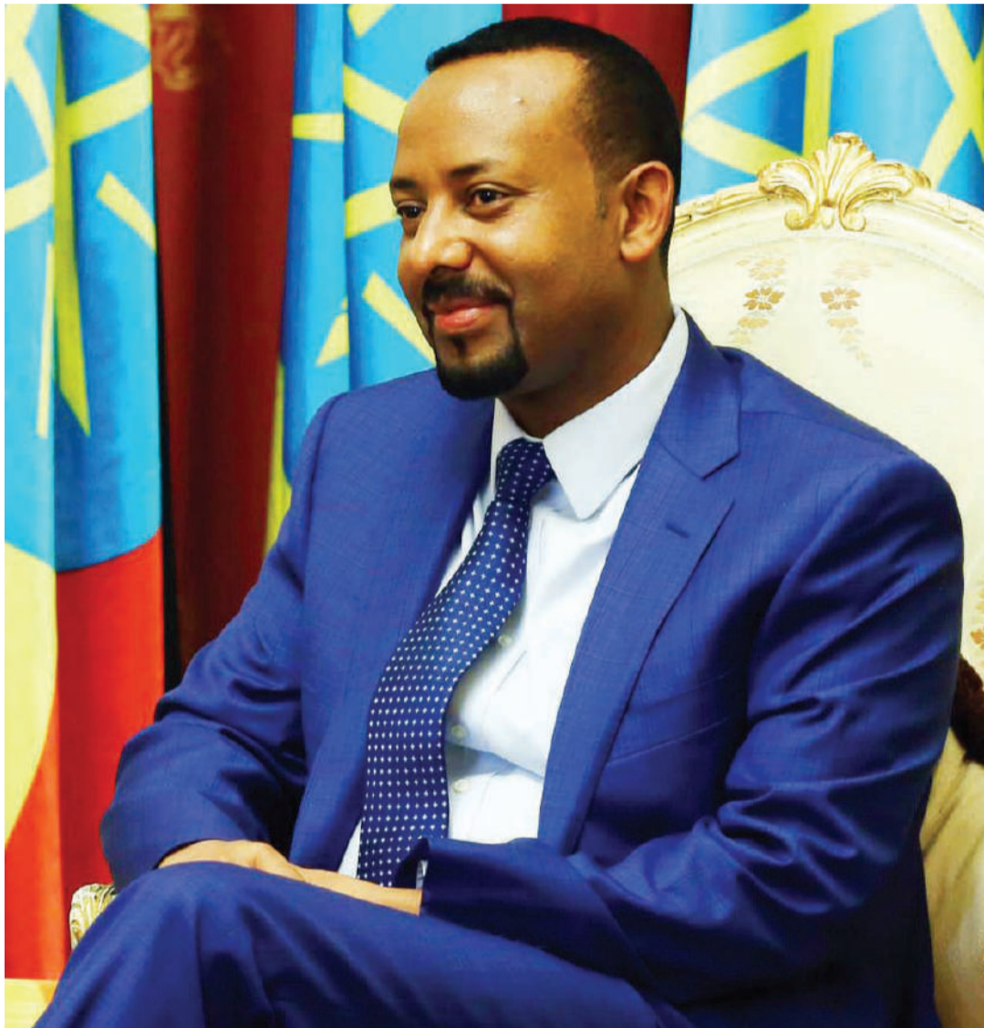
Waziri Mkuu wa Ethiopia, Abiy Ahmed.

Jitihada za kuweka Ethiopia katika mwelekeo wa kidemokrasia zilitumbukia nyongo wakati chama tawala jimbo la Tigray kaskazini ya nchi hiyo, ambao