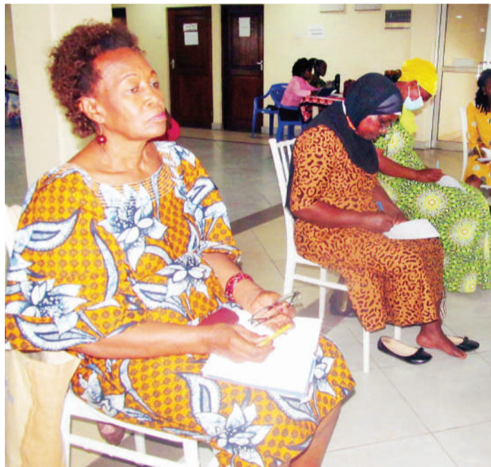
Baadhi ya washiriki wa kilinge hicho.

Tunahitaji kutumia mitandao ya kijamii ili ajenda yetu ifike mbali zaidi, lakini tunaweza kuitumia kuweka historia za wanawake wanaharakati wa Tanzania ambao wamechangia katika ukombozi wa nchi hii.