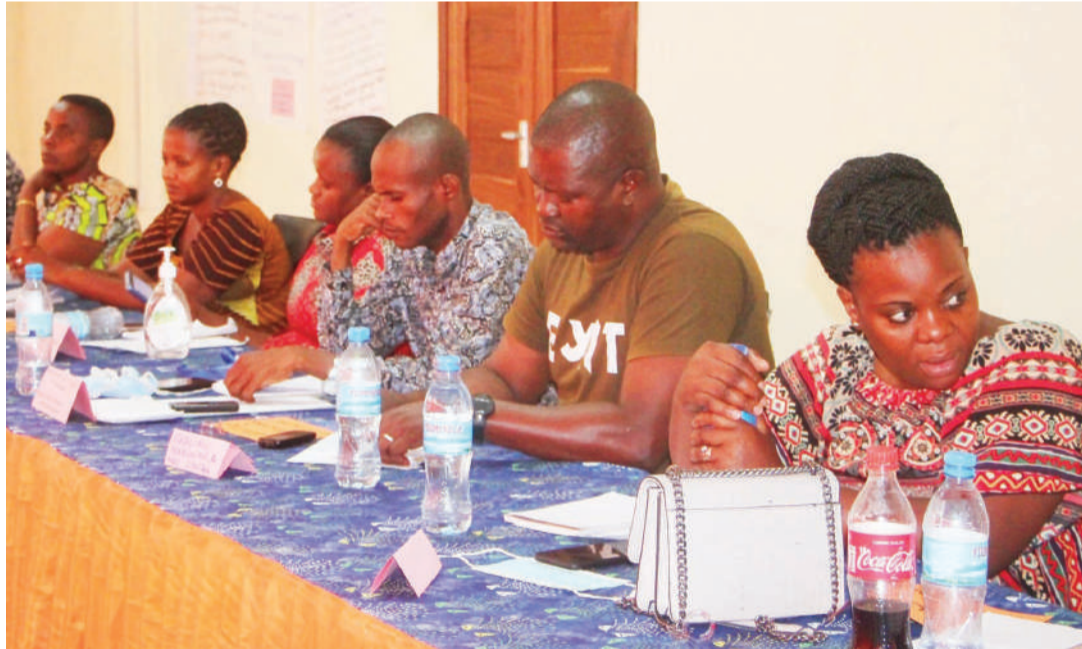
Baadhi ya viongozi wa Kata za Saranga na Mabwepande Dar es Salaam, wakishiriki mafunzo kuhamasisha kufikia usawa wa kijinsia.

Anataja dhana zinazowakwamisha kuwa ni mfumo dume, mawazo mgando na mgawanyo wa majukumu ya kijinsia kwenye jamii