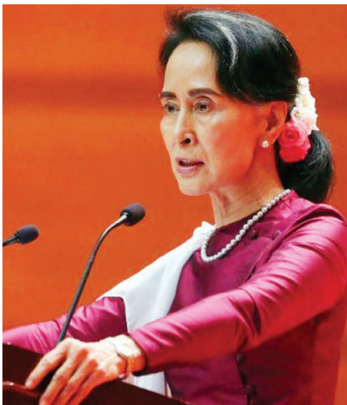
Kiongozi wa zamani wa Burma, Suu Kyi, washindi wa Tuzo ya Nobel wanaokwaza haki za binadamu.

Mengistu aliyeeongoza kupinduliwa Mfalme Haile Selassie, alitawala hadi 1991 alipokimbilia Zimbabwe, na uongozi uliomfuatia ulikuwa wa Meles Zenawi, aliyefariki Agosti 2012.