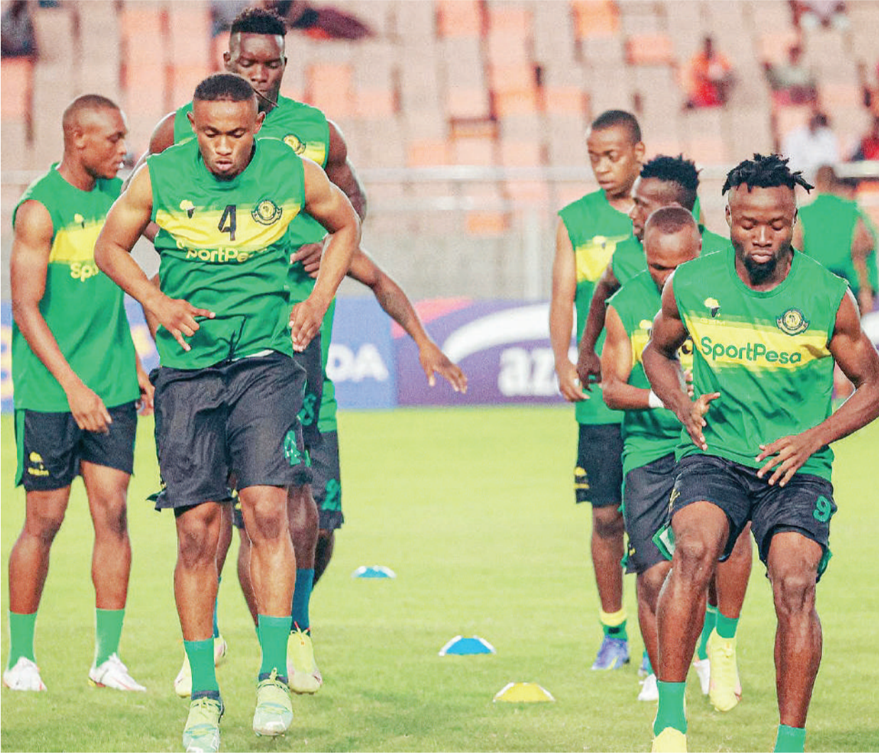
Wachezaji wa Yanga wakijinoa kuelekea mchezo dhidi ya Dodoma Jiji.