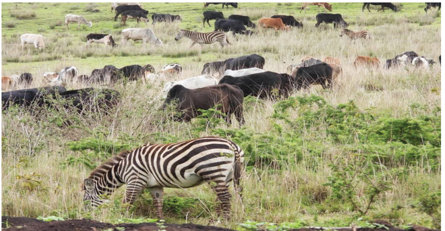
Sehemu ya mifugo na wanyamapori ndani ya Mamlaka ya Hifadhi ya Eneo la Ngorongoro.

Kiasi cha chumvi kilichoagizwa ni mifuko 2,000 yenye ujazo wa Kilo 20 kila mmoja ambayo kwa jumla ni sawa na tani 40 za chumvi yenye thamani ya Sh. milioni 40.