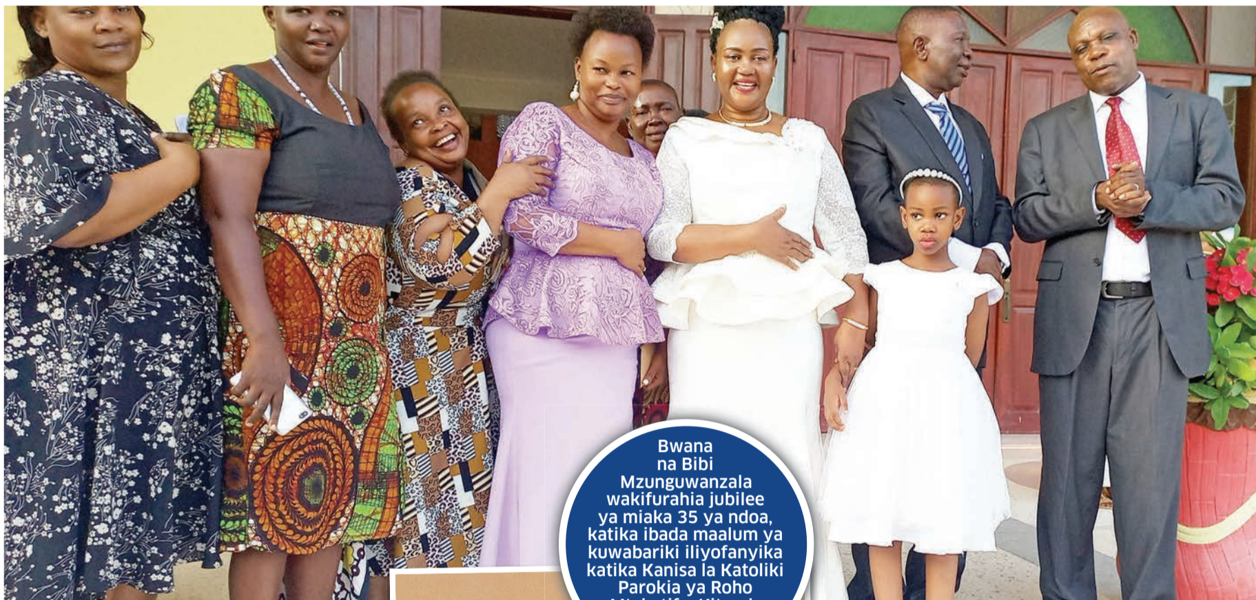
Bwana na Bibi Mzunguwanzala wakifurahia jubilee ya miaka 35 ya ndoa, katika ibada maalum ya kuwabariki iliyofanyika katika Kanisa la Katoliki Parokia ya Roho Mtakatifu, Kitunda Jijini Dar es Saalam jana.