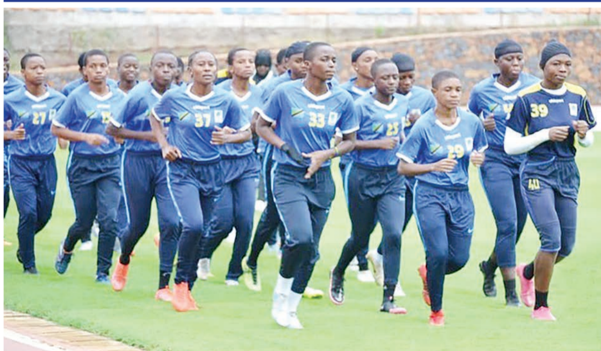
Timu ya Taifa ya Wasichana chini ya umri wa miaka 17, Serengeti Girls wakiwa kwenye mazoezi katika Uwanja wa Black Rhino, Karatu, Arusha kujiandaa na mchezo wa kufuzu Kombe la Dunia dhidi ya Cameroon utakaopigwa Mei 19 mwaka huu.

Baadhi ya watu wa karibu na klabu hiyo kwa siku za karibuni wamekuwa wakiweka video zake fupi kwenye mitandao ya kijamii, za wakati huo akiichezea, miaka miwili iliyopita, wakichombeza na maneno yanayoashiria kuwa na ukaribu naye.