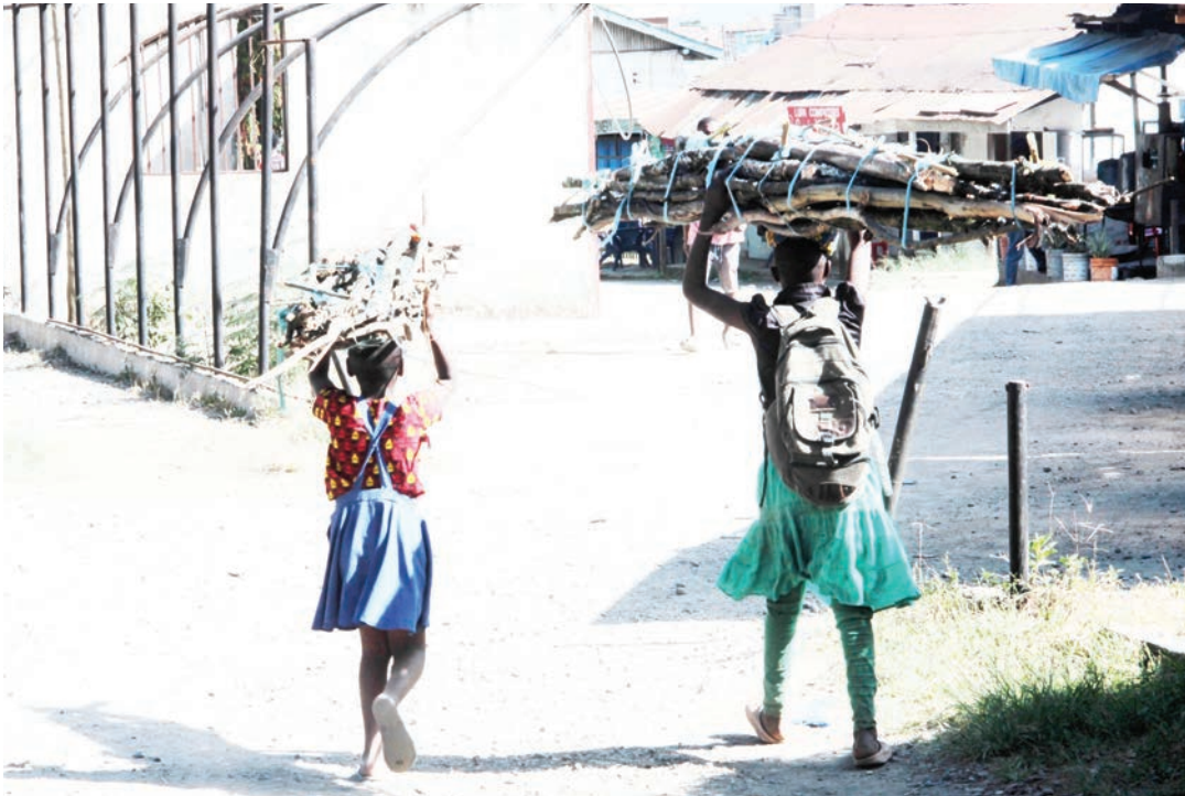
Watoto katika Jiji la Mbeya, wakiwa wametoka kukusanya kuni katika Barabara ya Mbalizi, jijini humo mwishoni mwa wiki, kwa ajili ya matumizi ya nishati ya kupikia nyumbani.

inzi na upendo, ninaamini kabisa mambo haya ya ukatili hayawezi kutokea,” alisema. Mkuu wa Mkoa alisema vitendo vingi vya ukatili dhidi ya watoto vinafanywa na wanafamilia wenyewe, hivyo akaitaka jamii kuhakikisha inachukua hatua kuhakikisha mambo hayo yanakomeshwa.