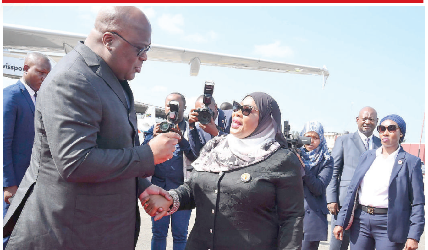
Rais Samia Suluhu Hassan akisalimiana na Rais wa Jamhuri ya Kidemokrasia ya Congo, Félix Antoine Tshisekedi Tshilombo, baada ya kuwasili Uwanja wa Ndege wa Kimataifa wa Julius Nyerere jijini Dar es Salaam jana.