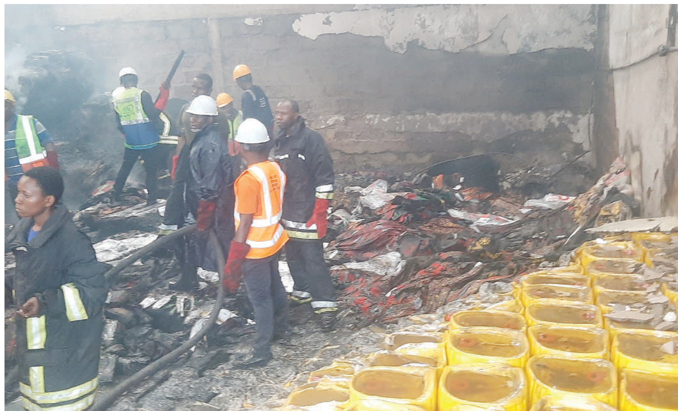
Askari wa Jeshi la Zimamoto na Ukoaji Mkoa wa Tanga wakizima moto kwenye ghala ya kuhifadhi bidhaa katika Bandari ya Tanga jana, ambalo lilikuwa na bidhaa za magendo zilizokamatwa hivi karibuni.