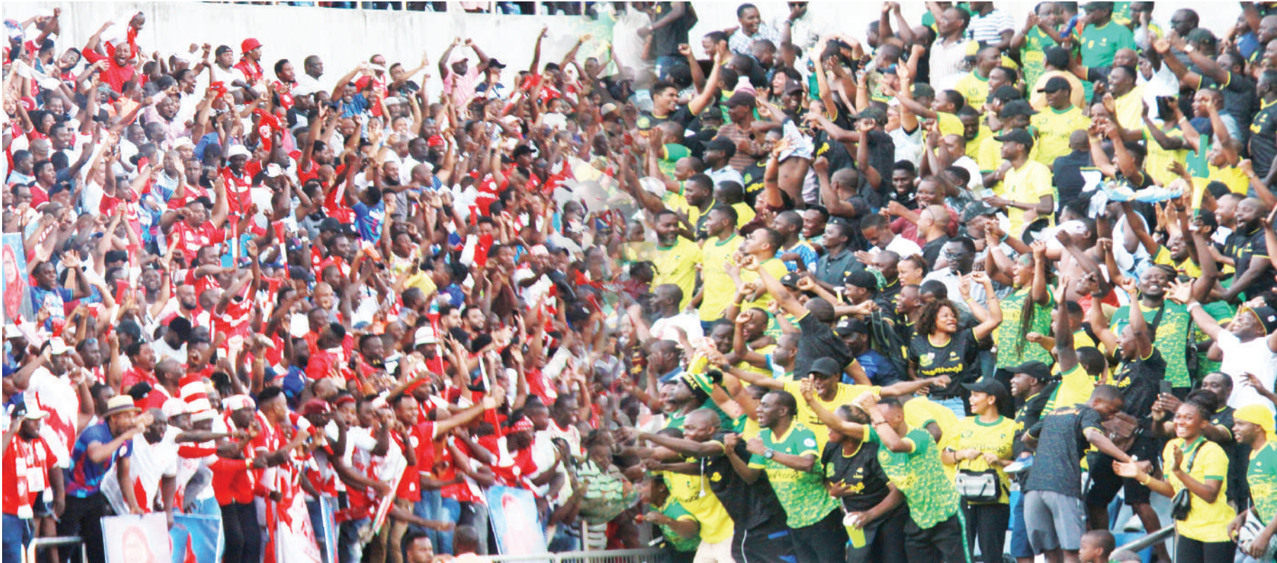
Mashabiki wa Simba na Yanga wakifuatilia mechi ya Ligi Kuu wakati timu zao zikitoka sare ya bao 1-1 katika Uwanja wa Benjamin Mkapa jana