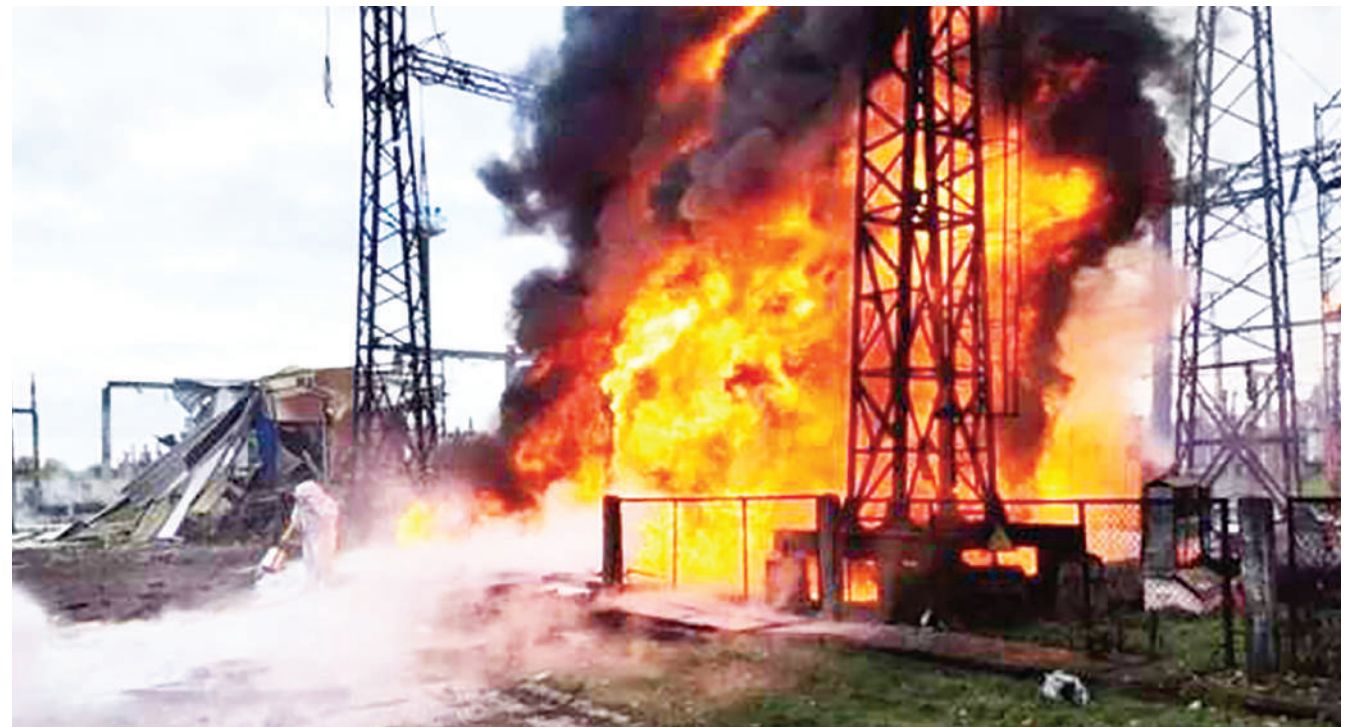
Moto ukiteketeza mtambo wa kuzalisha umeme baada ya kulengwa na makombora ya Russia juzi usiku.

Hapo awali katika mitandao ya kijamii, wataalamu na wanablogu wa kijeshi walipendekeza kuwa vikosi vya wanajeshi vya Ukraine vinaweza kutaka kujitenga na kisha kukomboa eneo la kaskazini mwa mkoa wa Luhansk. BBC