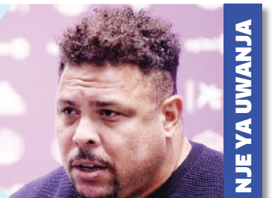
NJE YA UWANJA

Mshambuliaji wa zamani wa Brazil, Ronaldo Nazario: "Je, Messi anastahili (kushinda Kombe la Dunia)? Bila shaka, anastahili - lakini mimi simsapoti, labda kama uraia wake ungekuwa ni Muhispania. Brazil na Argentina ni mahasimu wa jadi, ninampenda na ataelewa na ninauhakika atajisikia hivyo hivyo".