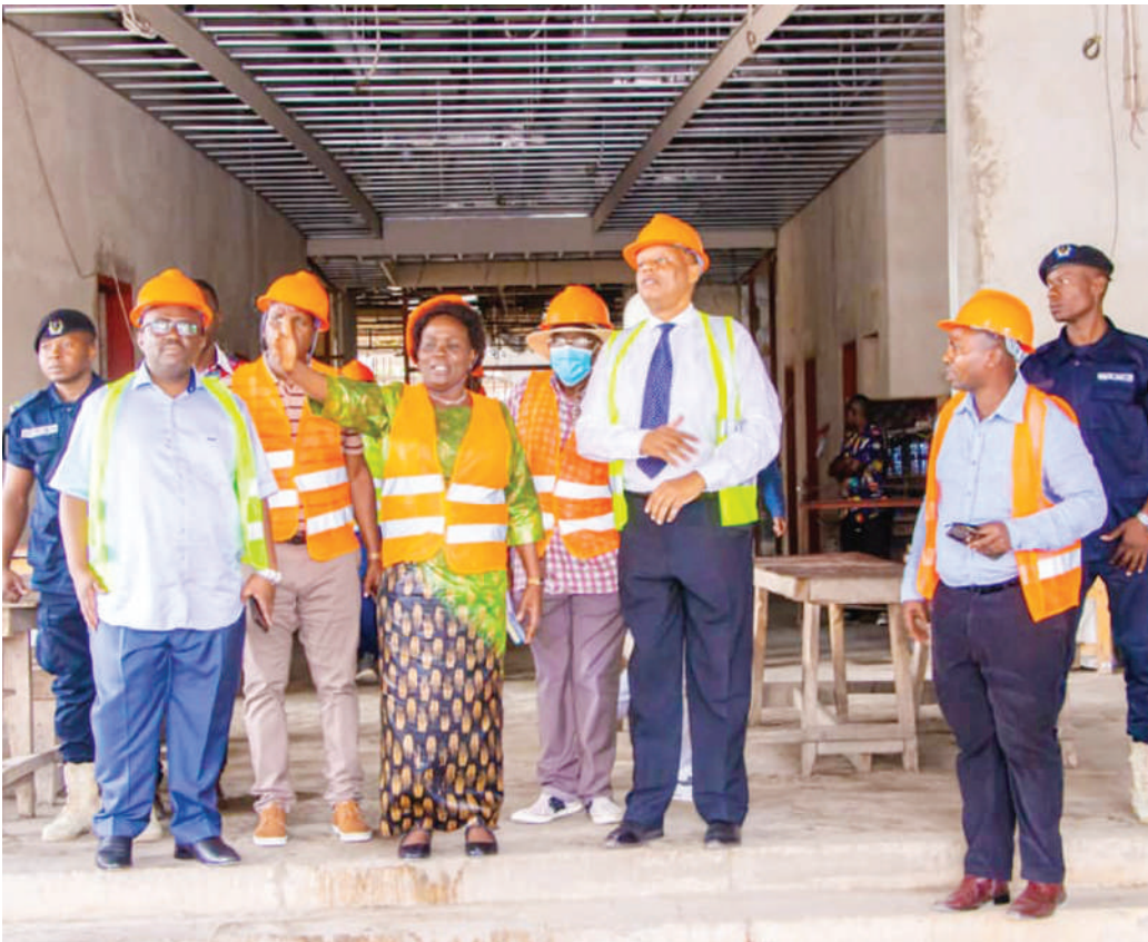
Waziri wa Nchi, Ofisi ya Waziri Mkuu, Kazi, Vijana, Ajira na Wenye Ulemavu, Prof. Joyce Ndali-chako (katikati), akikagua maendeleo ya ujenzi wa mradi wa uwekezaji wa jengo la Mzizima Tower jijini Dar es Salaam, linalomilikiwa na NSSF. HABARI UK 5.