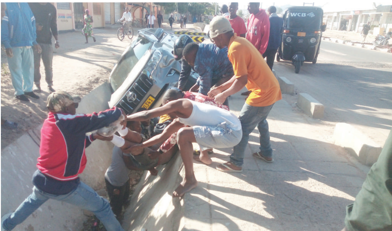
Wasamaria wema wakimwkoa mwendesha bodaboda uvunguni mwa gari baada ya kugongwa na kutumbukia kwenye mtaro wa barabara ya Meriwa jijini Dodoma jana.

Pamoja na faida za malipo, mfumo huu uliobuniwa na Vodacom sasa unatumika na serikali kupitia Wizara ya Kilimo na Mfuko wa Taifa wa Mbolea (TFRA), ili kusajili wakulima katika maeneo yote nchini waweze kupata mbolea ya ruzuku.