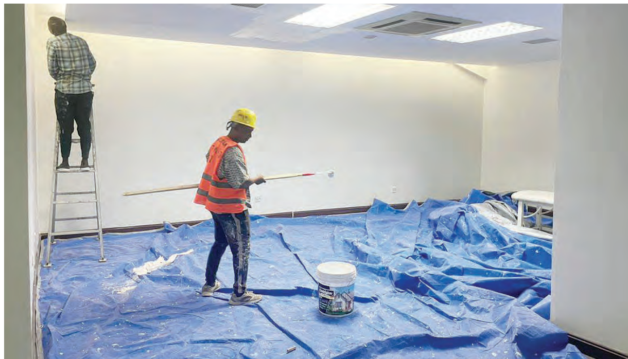
Mafundi ujenzi wakiendelea kupaka rangi Uwanja wa Benjamin Mkapa, Dar es Salaam jana.