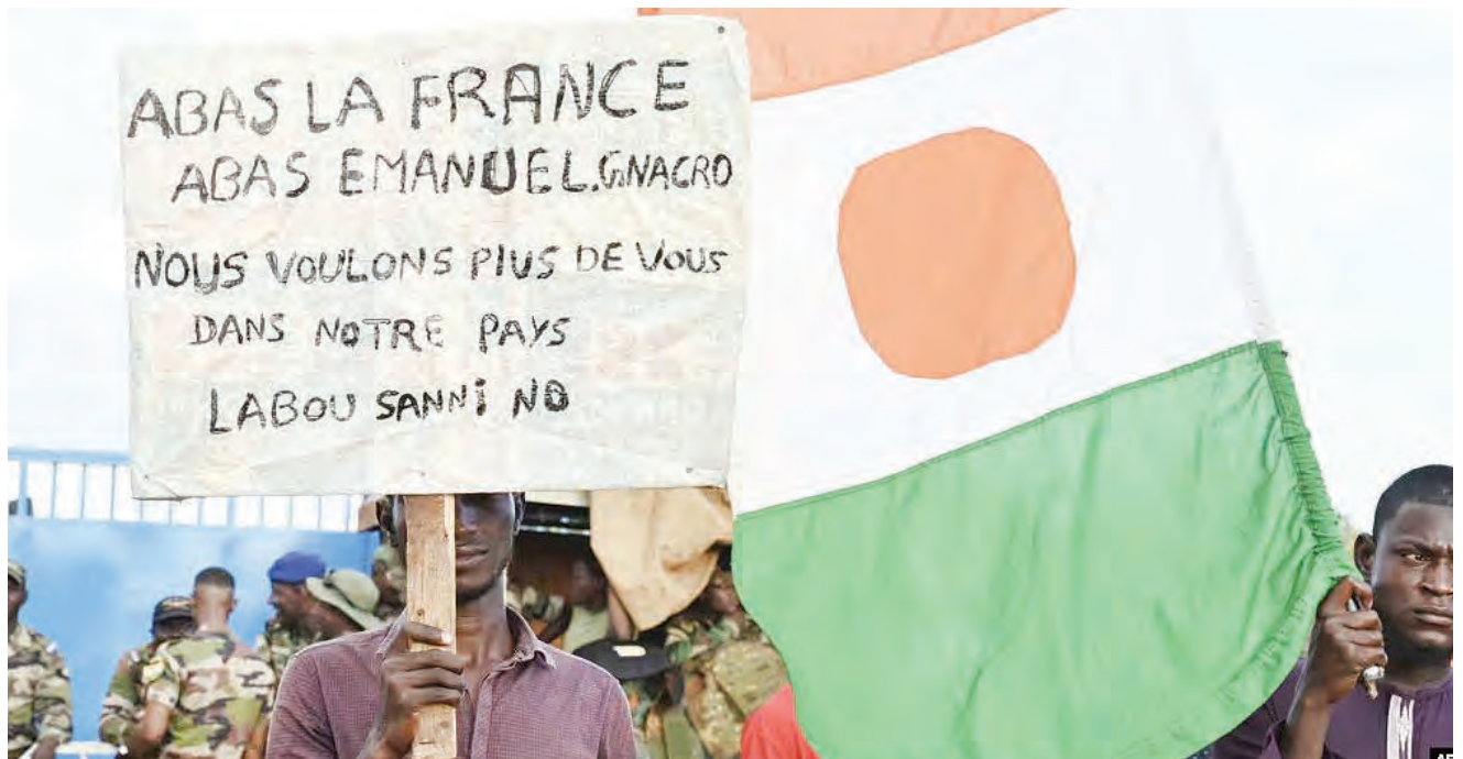
Waandamanaji wakionyesha mabango ishara ya kuwapinga wanajeshi wa Ufaransa kuendelea kuwapo nchini Niger.

Aliagiza serikali ichambue na kubainisha makundi mbalimbali ya wakulima walioathirika na mradi huo wa kuwakopesha matrekta ya Ursus na kuonyesha namna ya ku- wapatia unafuu waathirika hao.