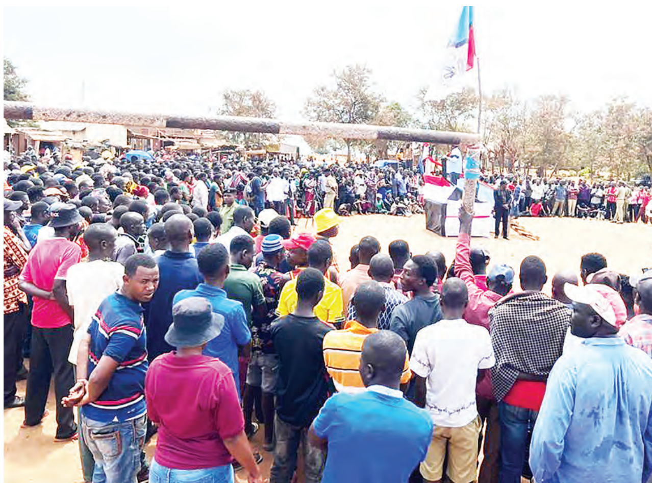
Wakazi wa Kijiji cha Busekera katika Jimbo la Musoma Vijijini mkoani Mara wakiwa kwenye mkutano wa hadhara uliohotubiwa na Makamu Mwenyekiti wa CHADEMA Taifa, Tundu Lissu jana.

Alisema shule jumuishi ziliwekwa ili kuondoa ile hali ya kuonyesha utengano kati ya wanafunzi ambao hawana ulemavu na kuweka ushirikiano na wenye ulemavu kwa kuwa wote wanafanana katika masomo yanatolewa shuleni.