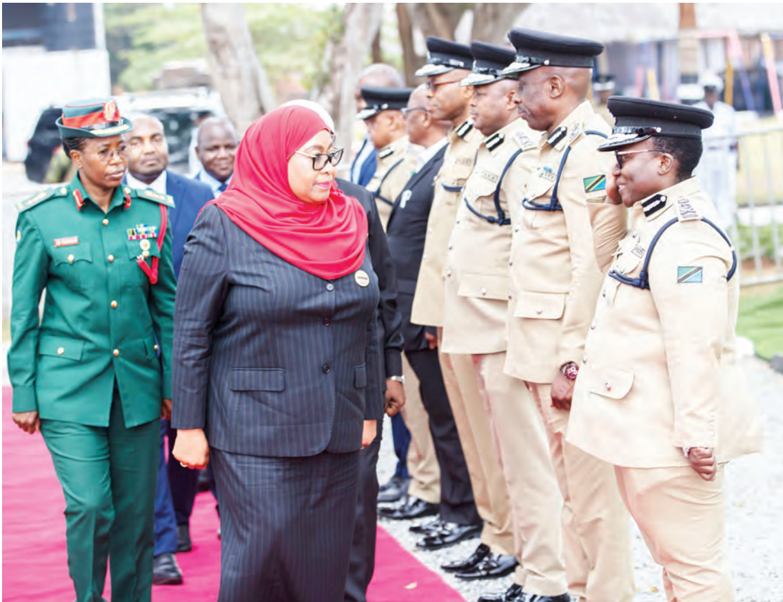
Amiri Jeshi Mkuu Rais Samia Suluhu Hassan, akisalimiana na viongozi wa Jeshi la Polisi baada ya kuwasili kwenye Bwalo la Maofisa wa Polisi (Police Officer's Mess) Oysterbay jijini Dar es Salaam jana.