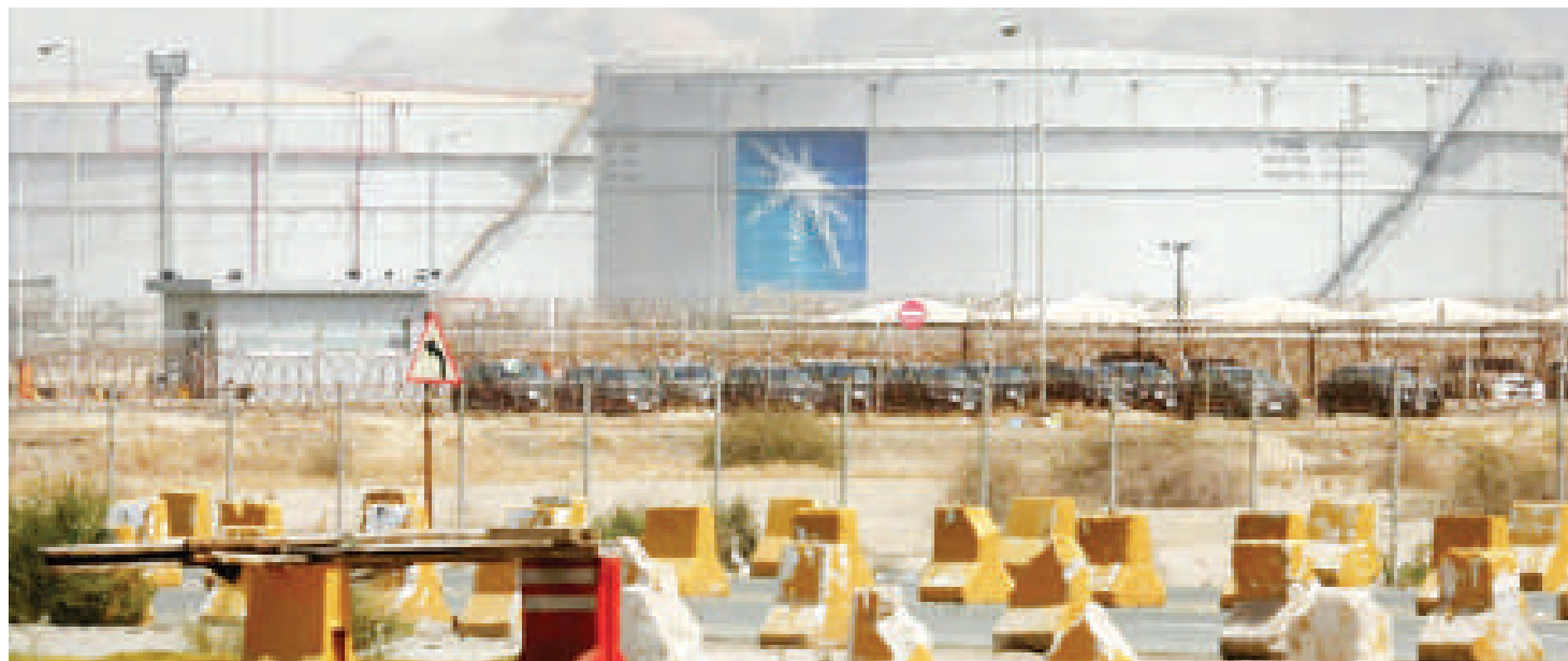
Mitambo ya mafuta ya ARAMCO huko Jeddah, Saudi Arabia mwaka 2021.

Lakini, ni mwathirika zaidi, mathalani, nchi za Kusini ya Sahara zinategemea kwa asilimia 95 kilimo cha mvua, ambacho ndicho kinachojiri mamilioni ya raia, ndilo tegemeo pato la taifa na chakula, hivyo uchafuzi wa