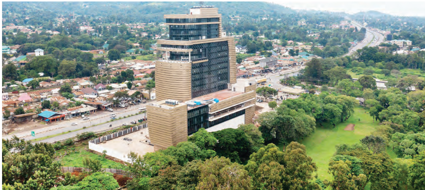
Jengo jipya Umoja Posta Afrika (PAPU).

R AIS Dk. Samia Suluhu Hassan, Septemba 2023 anaacha alama muhimu kwenye maendeleo ya sekta ya posta barani Afrika, pale anapofungua jengo la makao makuu ya Shirikisho la Umoja wa Posta Afrika -PAPU Tower, jijini Arusha.