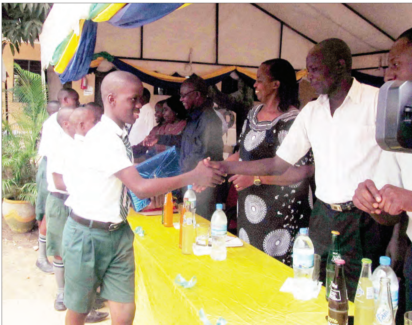
Baadhi ya wanafunzi wa darasa la saba wa Shule ya Msingi St. Veritas ya Kimara, jijini Dar es Salaam, wakipongezwa na walimu wao, katika mahafali iliyofanyika kabla ya kufanya mtihani wa taifa mwezi ujao.

Alisema ni dhahiri kuwa maji ni rasilimali muhimu katika kuchochea huduma za kibiashara pamoja na zile za majumbani na mamlaka ya maji Zanzibar (ZAWA) inafanya jitihada kubwa kusimamia huduma ambayo hadi sasa imewafikia wateja 1,161,915 visiwani Zanzibar.