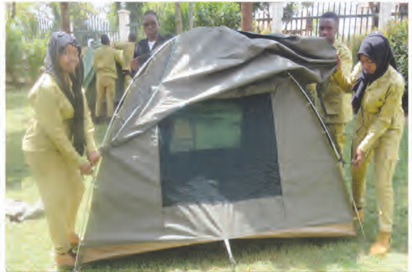
Wanafunzi wa kozi ya uongoza utalii (Tour Guiding) wakifunga Hema linalotumika kama malazi kwa watalii

Sifa ya VHTTI imeanza kupenya hata nje ya mipaka ya Tanzania kwa kuvutia wanafunzi kutoka mataifa jirani. Mataifa ambayo raia wake wanasoma au wamehitimu mafunzo hapa chuoni ni pamoja na: Uganda, Kenya, Zambia na Zimbabwe.