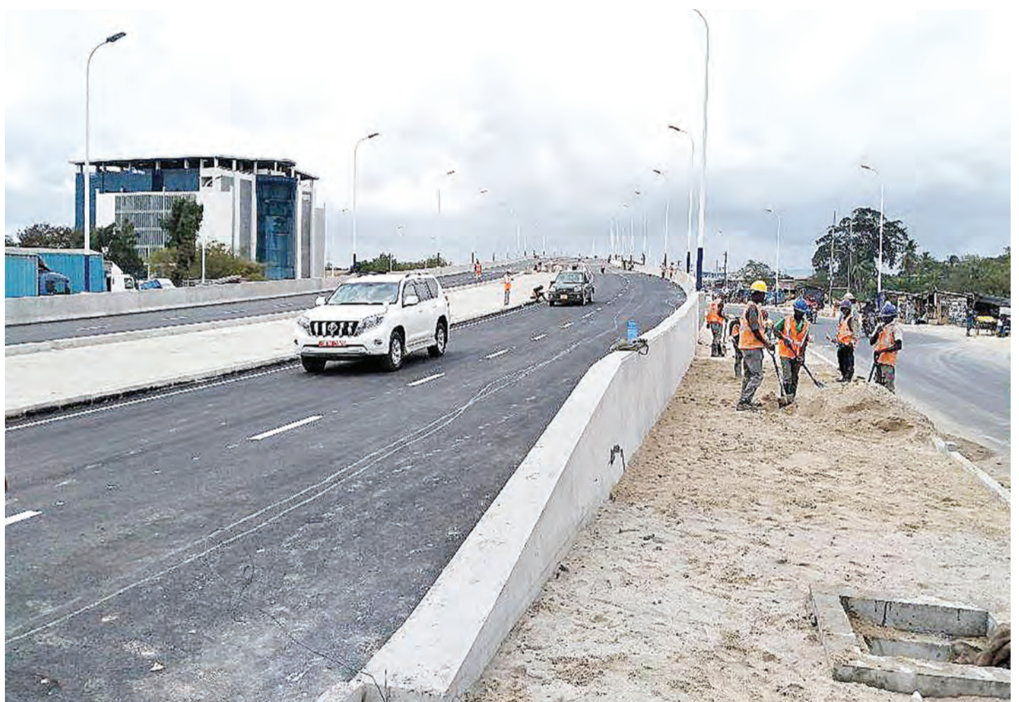
Wafanyakazi wa kampuni ya CCECC inayojenga barabara za juu za mpishano Ubungo, jijini Dar es Salaam, wakifanya ukarabati wa mwisho jana, kwa ajili ya kuruhusu magari kupita juu kutoka Barabara ya Sam Nujoma hadi ya Mandela.

Hakimu Visensia alimhukumu mshtakiwa kwa kupatikana na makosa yote matatu la kwanza la kuingia hifadhini bila kibali alimhukumu kulipa faini Sh. 300,000 ama kifungo cha mwaka mmoja jela, kosa la pili kupatikana na silaha za jadi ndani ya hifadhi, kwenda jela mwaka mmoja au faini ya Sh. 300,000 na kosa la tatu la kupatikana na nyara za serikali miguu miwili ya nyumbu, kwenda jela miaka 20.