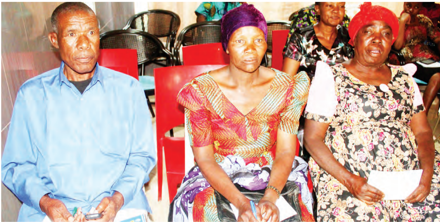
Wajumbe wa Baraza la Wazee wilayani Kahama wakiwa kwenye moja vikao vya kazi.

S ERA ya Wazee ya mwaka 2003 inamtambua mzee kuwa ni yule mwenye zaidi ya miaka 60, ambaye atakuwa amemaliza nguvu ya kufanya kazi na anahitaji kupumzika.