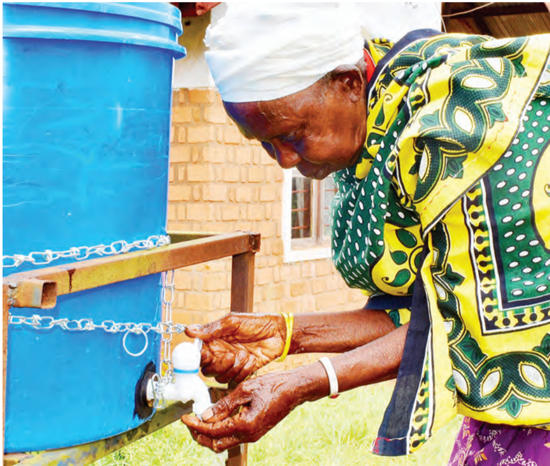
Kunawa na maji tiririka kunasaidia kujikinga na corona, liwe jambo endelevu ili watu wajiepusha na maradhi ya kuambukizwa yanayotokana na kula au kugusa.