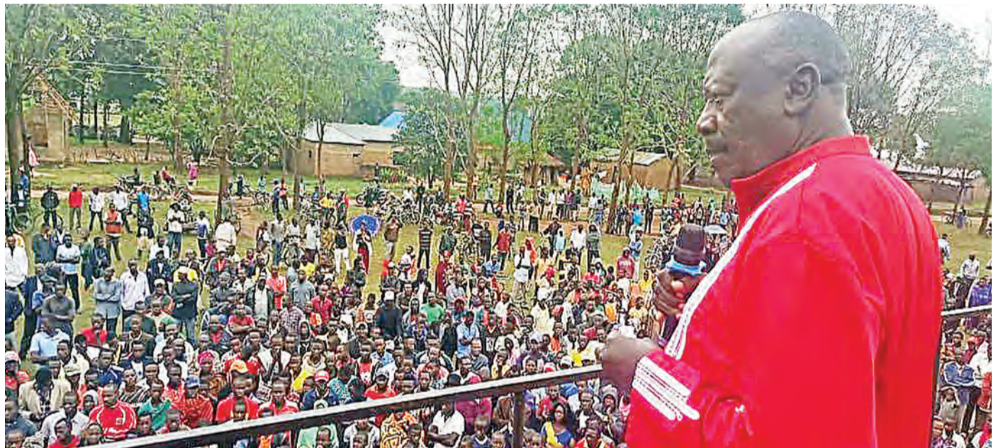
Mgombea urais kwa tiketi ya Chama cha Wananchi (CUF), Prof. Ibrahim Lipumba, akizungumza na wananchi katika mkutano wa kampeni za uchaguzi mkuu kwenye viwanja vya Mnyabuhimilwa, mkoani Geita juzi.

Kupitia ukurasa wake huo, Lissu aliandika kwamba; "Sijapokea malalamiko yoyote juu ya jambo lolote linalohusiana na kampeni za uchaguzi mkuu huu kutoka NEC. Sitarajii kuacha kampeni ili kuitika wito wa mitandaoni wa mtu yeyote," alisema katika tweet yake.