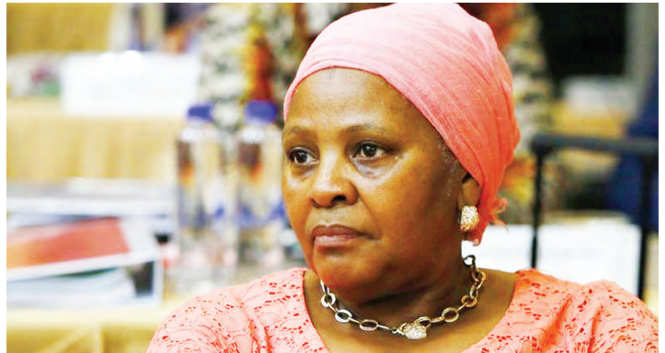
Mapisa-Nqakula, Waziri wa Ulinzi wa Afrika Kusini, amekatwa mshahara na fedha hizo, zitaelekezwa katika mfuko wa kukabiliana na virusi vya corona, baada ya kuruhusu maafisa wa chama tawala kusafiri kwa kutumia ndege ya jeshi hadi Zimbabwe.

Suala hilo huenda likajadiliwa zaidi bungeni huku kukiwa na wito wa waziri huyo kufutwa kazi. BBC