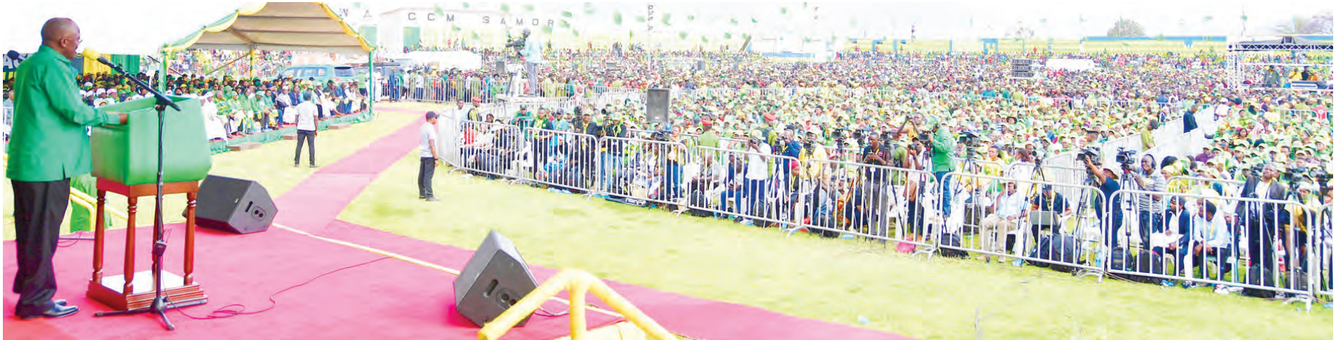
Mgombea urais kupitia Chama Cha Mapinduzi (CCM), Dk. John Magufuli, akihutubia wananchi katika mkutano wa kampeni kwenye uwanja wa CCM Samora, mjini Iringa jana.