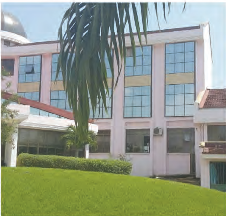
Jengo la hoteli "Application Hotel" inayotumika kwa ajili ya mafunzo kwa vitendo kwa wanachuo wa VHTTI

VHTTI imeweza kuitunza hoteli yake ya mazoezi kitaalamu na kuifanya kuwa na hadhi ya nyota tatu. Hadhi hii inatokana na uchunguzi uliofanywa na Wizara ya Utalii na Maliasili mwaka 2017.