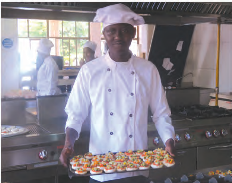
Mwanafunzi wa fani ya mapishi akiwa ameandaa kitindamio (Dessert) katika hoteli ya VHTTI