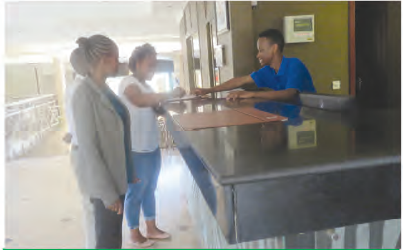
Mwanafunzi wa kozi ya mapokezi akiwa anapokea wageni katika hoteli ya VHTTI, Njiro

Kuanzia mwaka wa masomo wa 2018/2019 Chuo kilianza rasmi kutoa mafunzo ya muda mrefu yenye ithibati ya VETA.