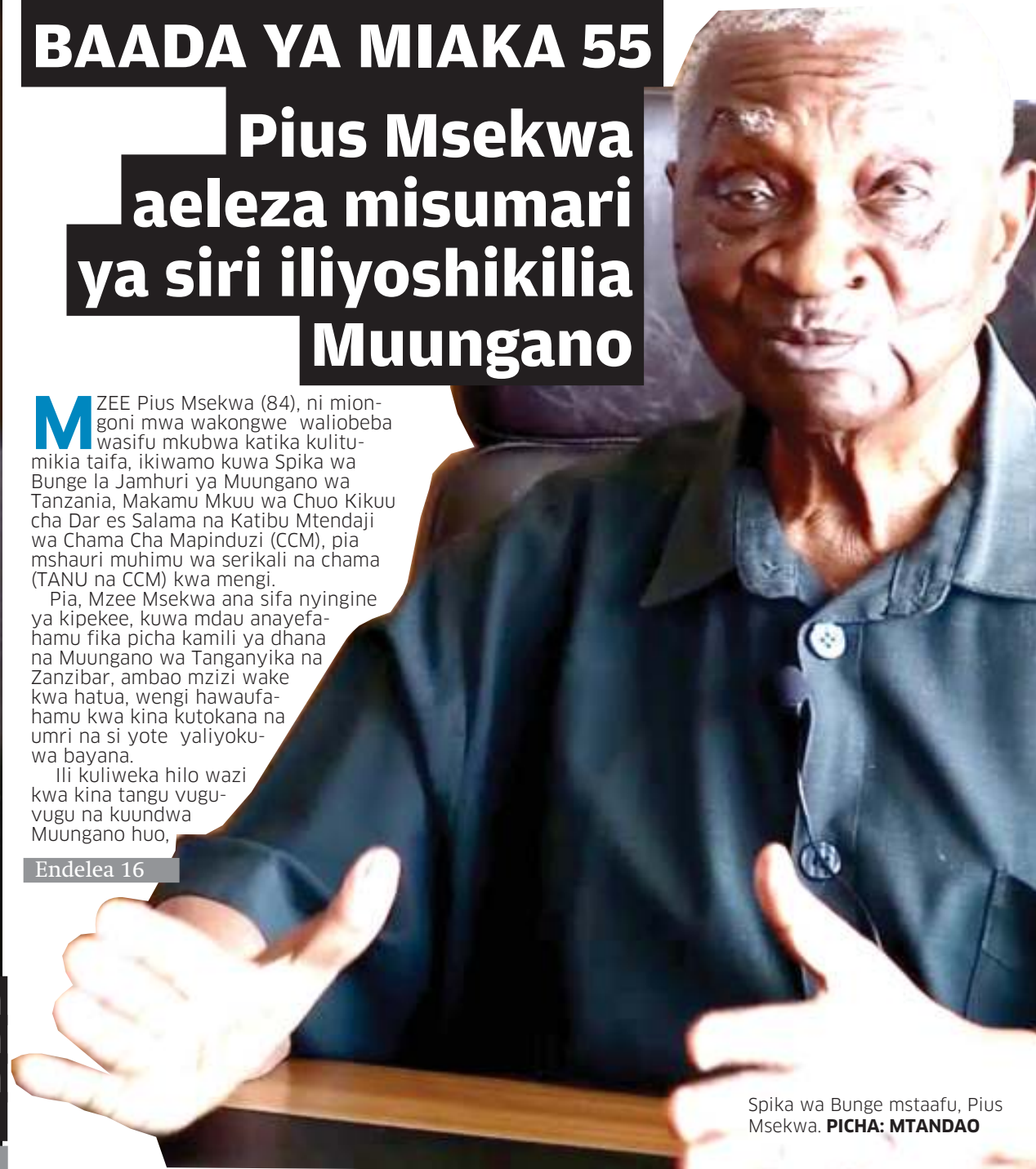
Spika wa Bunge mstaafu, Pius Msekwa.