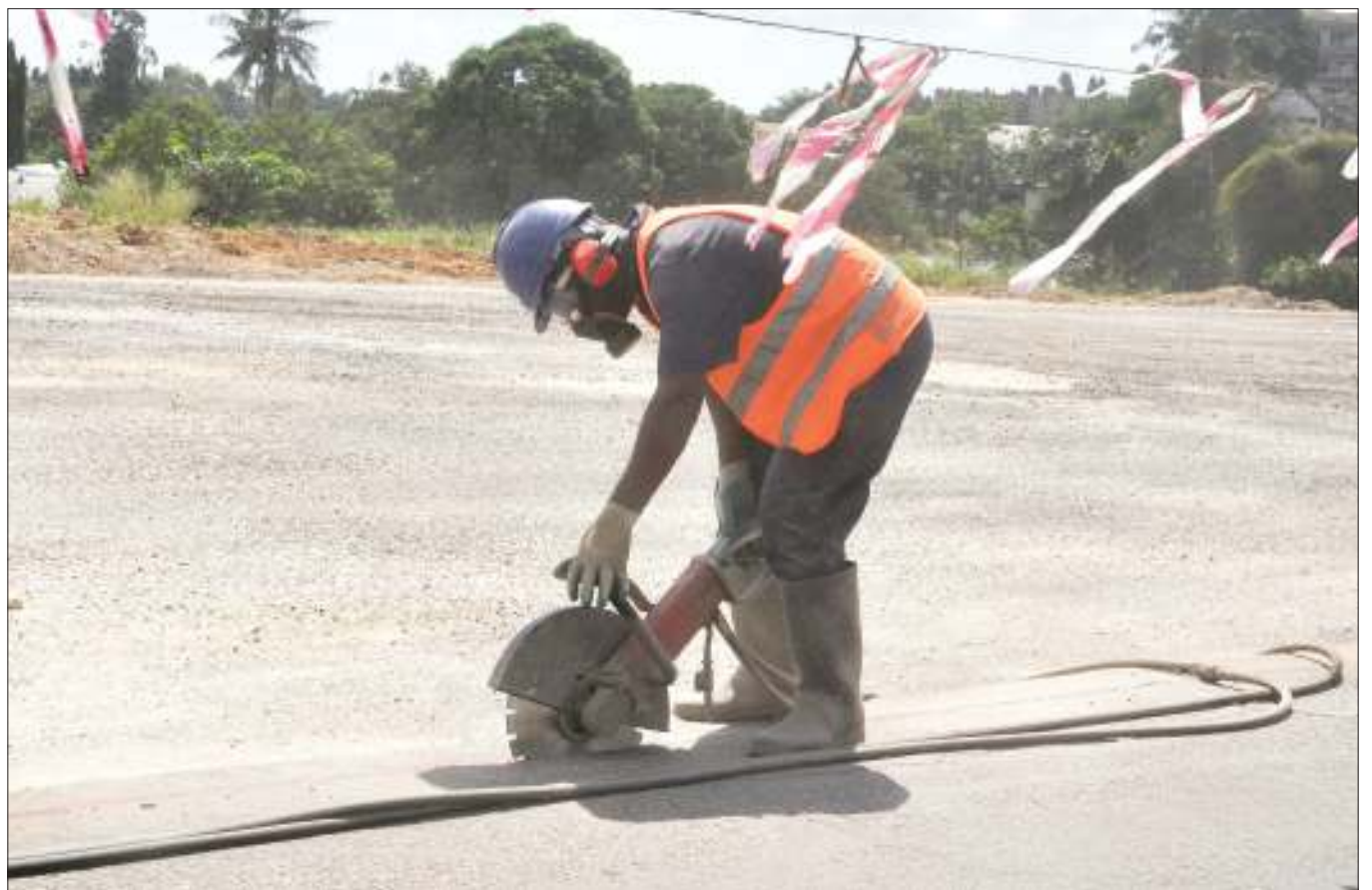
Fundi wa kampuni ya Estim, akiendelea na kazi ya awamu ya kwanza ya upanuzi wa Barabara ya Morogoro, katika eneo la Kimara Stop over, jijini Dar es Salaam jana, itakayojengwa kwa njia sita kuanzia Kimara hadi Kibaha mkoani Pwani yenye urefu wa kilomita 19.

Kuhusu ugonjwa wa kipindupindu mkoa wa Dar es Salaam, Dk. Ndugulile alisema takwimu zinaonyesha unapungua ambapo hadi mwezi huu wagonjwa ni 361 na waliofariki ni watu sita.