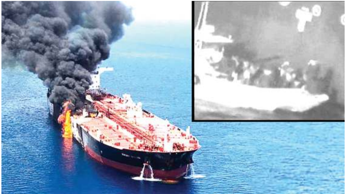
Moja ya meli ambayo Marekani inadai ililipuliwa na Iran.

Wanadiplomasia Ulaya na Mashariki ya Mbali wanataka suala la msingi litangulizwe, ambalo ni