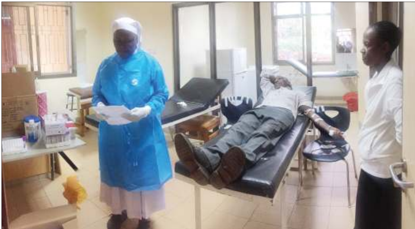
Mmoja wa wanachama wa vikundi vya vicoba vilivyo chini ya mradi wa kuwakomboa wanawake na watu wenye ulemavu kiuchumi katika Tarafa za Tarakea na Userri, wilayani Rombo mkoani Kilimanjaro, chini ya Shirika lisilo la kiserikali la AJISO, akishiriki uchaguzi damu kutatua tatizo la upungufu wa damu katika hospitali za wilaya hiyo. Vikundi hivyo vimewezeshwa na AJISO kwa ufadhili wa Shirika la Bread for the World la Ujerumani.

Mjumbe huyo wa kamati kuu alisema kila mara uchaguzi nchini unaendeshwa kwa uhuru, uwazi na haki na CCM imekuwa ikishinda kwa haki.