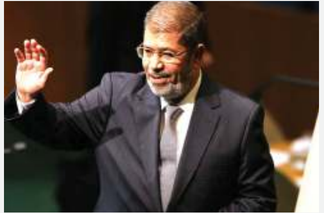
Rais wa zamani wa Misri, Mohammed Morsi aliyezikwa jana baada ya kufariki dunia juzi.