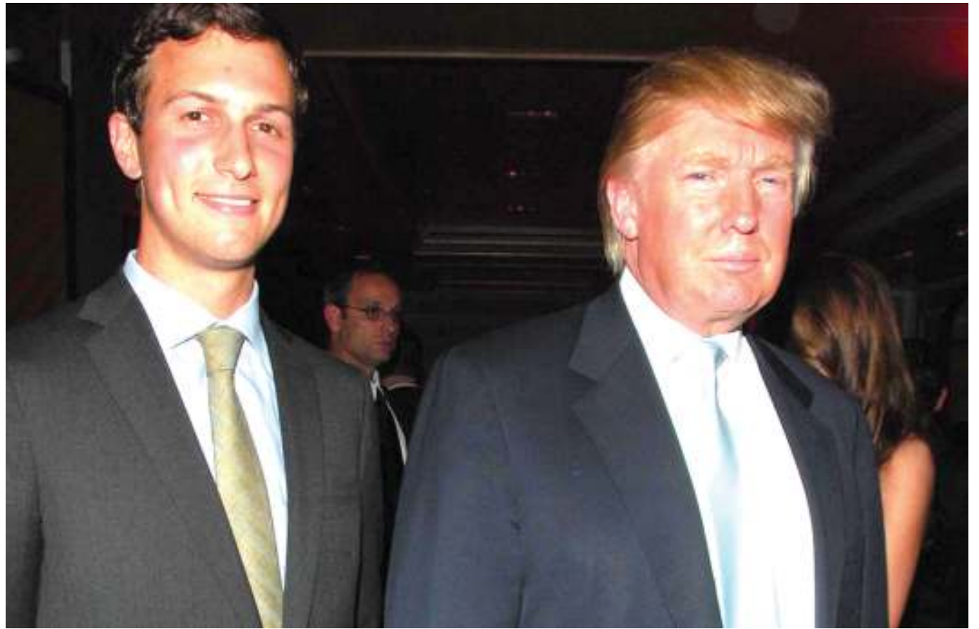
Rais wa Marekani, Donald Trump (kulia), akiwa na mshauri wake Jared Kushner ambaye pia ni mkwewe.

Kushner kwani uwezo wa kujitawala katika sheria za kimataifa ni pamoja na uwezo wa kuingia mikataba na kuitekeleza.