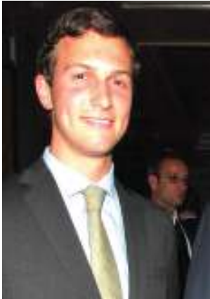
Mshauri Rais Marekani awasha moto eno la Mashariki ya Kati