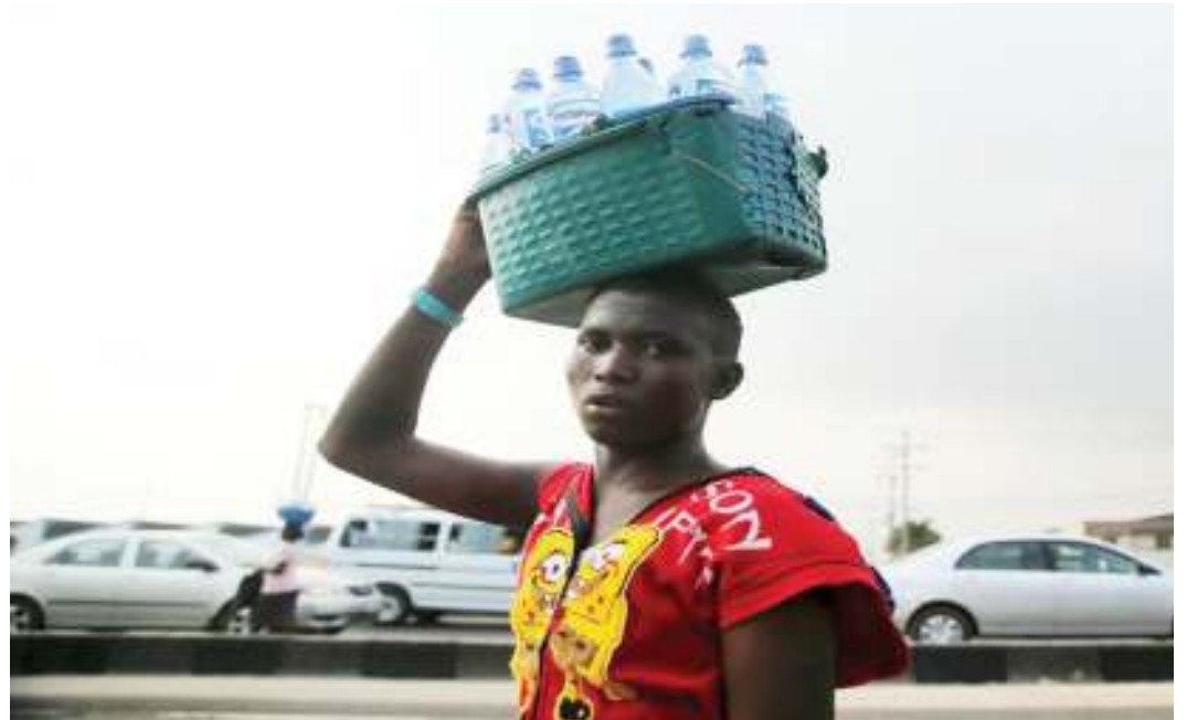
Binti akihangaika kutafuta maisha mjini pengine ni kutokana na changamoto alizozipata utotoni. PICHA MTANDAIO.

Taarifa hizi ni kwa mujibu wa takwimu za Utafiti wa Afya ya Jamii (DHS) uliofanyika mwaka 2018. Hali hii unapoitizama pamoja na kasi ya unyanyasaji mabinti ambao hupata mimba udogoni, inaelekeza kuwa kuna