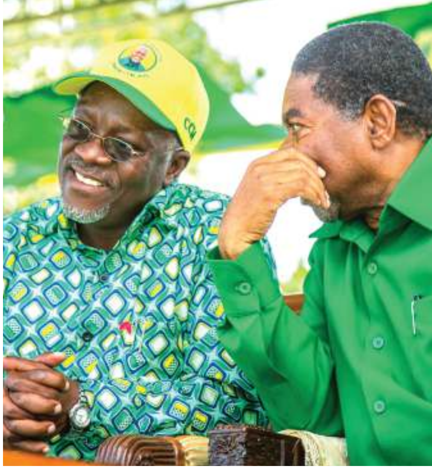
Rais John Magfuli ambaye pia ni Mwenyekiti wa CCM (kushoto) akiwa na Rais wa Zanzibar, Dk. Ali Mohamed Shein.

Yaani: Muundo wa Muungano ulikusudiwa kutoa majibu kwa changamoto nyingi walizokuwa nazo na tofauti za rangi, ukabila, udini, na tofauti za kisiasa. Ndiyo kusema kwamba, walikuwa na changamoto ngumu kama hizo zilizo-tajwa, ikiwa ni pamoja na tofauti ya lugha. Lakini, pamoja na changamoto hizo kubwa zilizoibana nchi hiyo, bado waliweza kukubaliana kuunga-na pamoja na kukubaliana kuwa na muundo huo wa serikali moja ulisaidiwa na kuunganishwa kwa vyama hili ina maelekezo yake mazuri tu, kama ifuatavyo: Neno "itifaki" ni tafsiri ya neno la