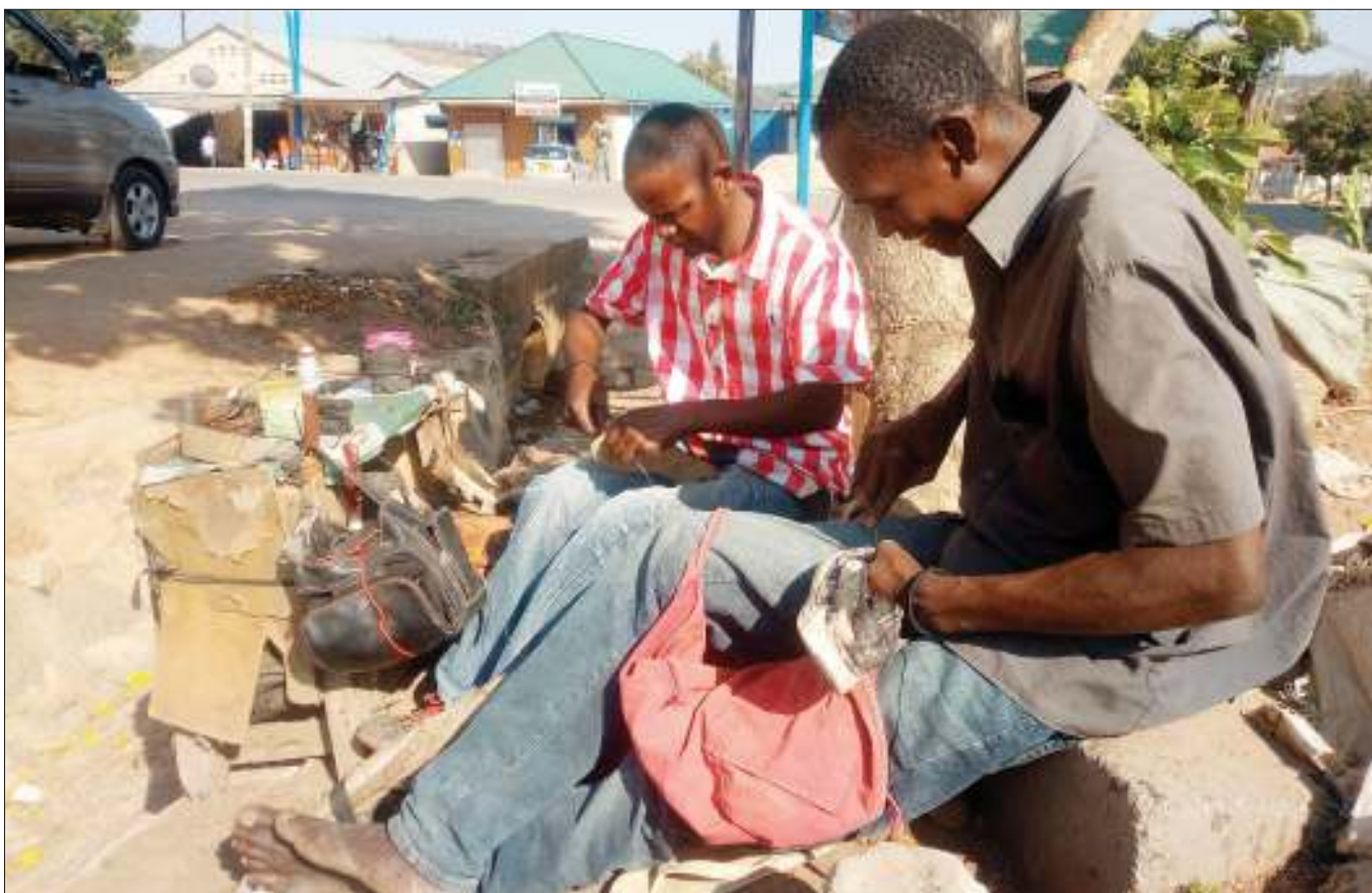
Wajasiriamali wakiendelea na kazi ya kukarabati na kushona viatu kama walivyokutwa na mpigapicha wetu mtaa wa Nyakato Sokoni, jijini Mwanza.