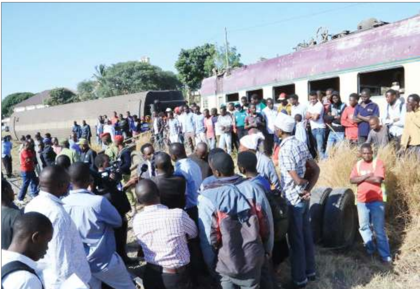
Wakazi wa Jiji la Dodoma wakiangalia mabehewa mawili yaliyodondoka baada ya kugongwa na lori lenye namba za usajili T 860 APW lililotokea makutano ya Barabara ya Hazina, jijini Dodoma juzi usiku majira ya saa tano usiku.

Aliishauri serikali kuboresha vyuo vya ufundi ili kuwawezesha vijana kujijirika.