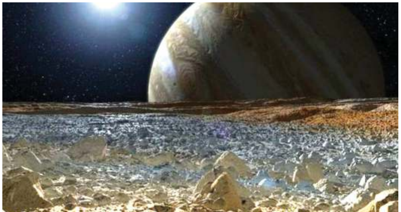
Bahari iliyoko mwezini, ambayo sasa imethibitika ina chumvi.