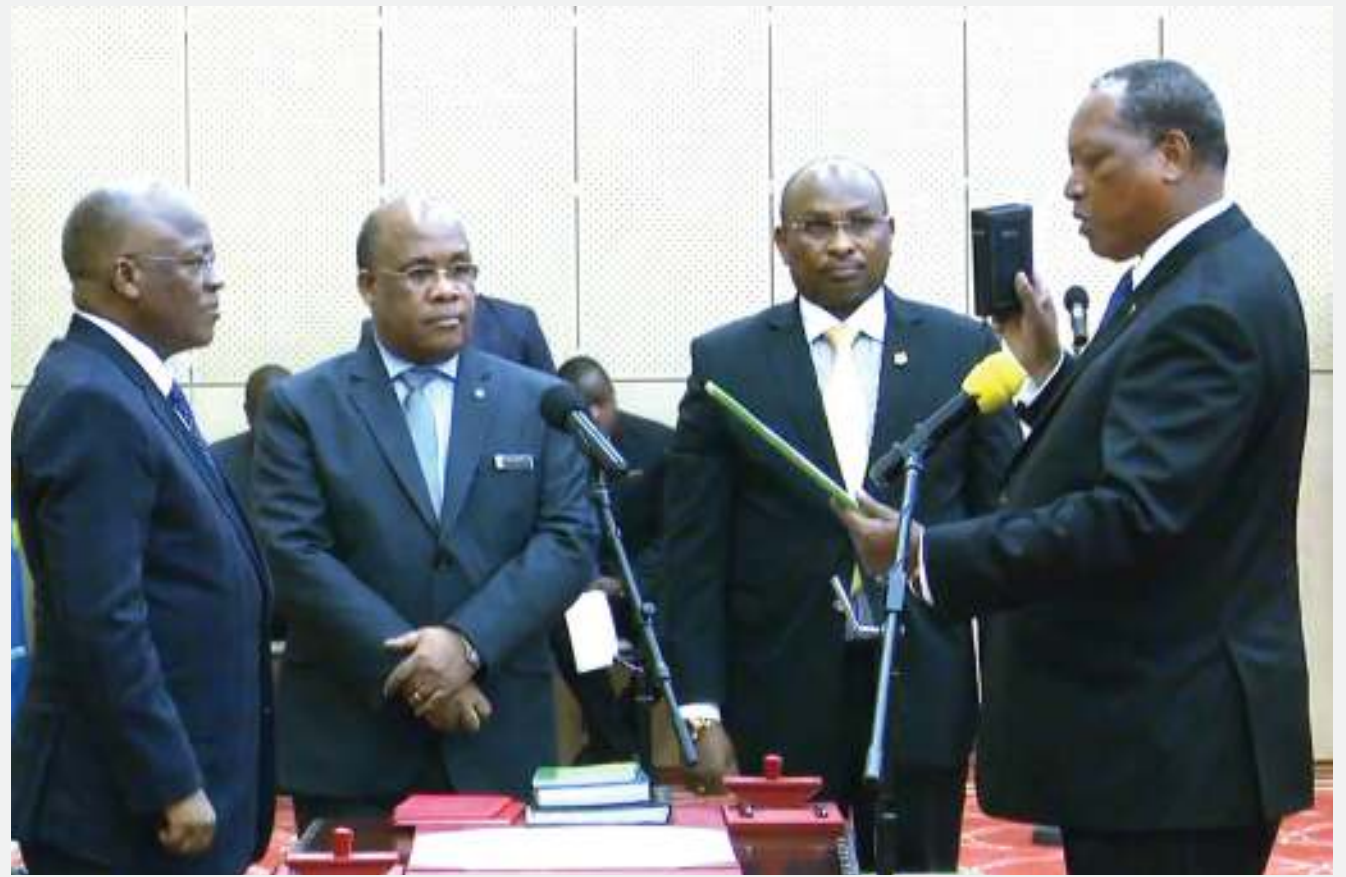
Rais John Magufuli akiwa katika shughuli ya kuapisha wateule wake.

Ilifikia hatua ya baadhi yao kuibu-ka na mbinu mbalimbali kwenye majimbo yao kuhamasisha wananchi kufanya mikutano ya kuwasafisha au maandamano.