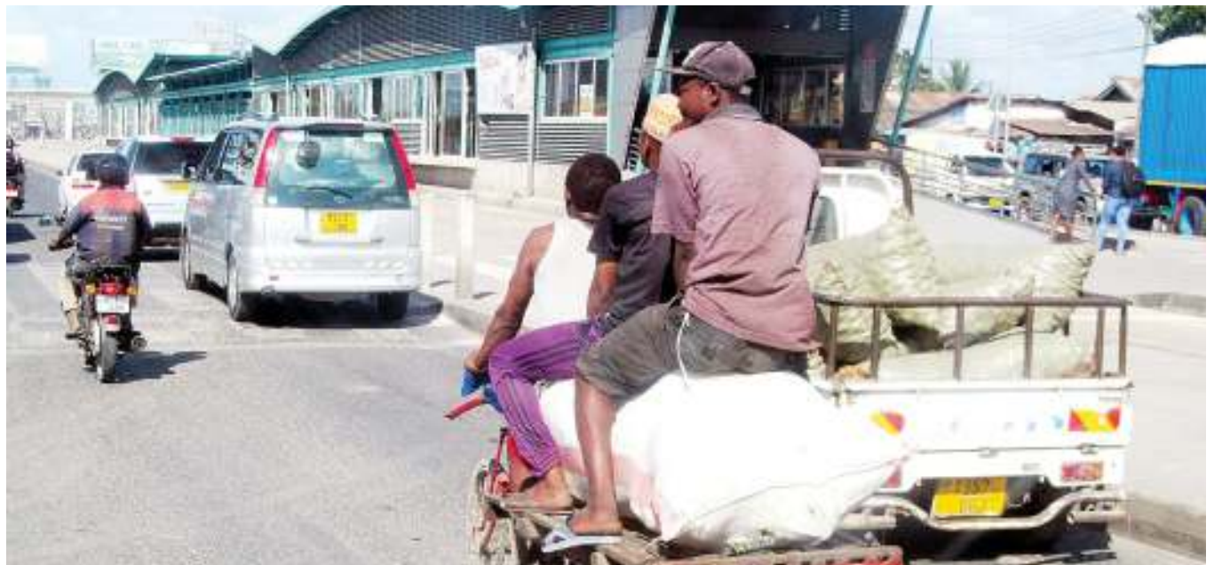
Mwendesha guta akisafirisha mzigo na abiria akiwa juu katika Barabara ya Morogoro, eneo la Manzese Tip Top, jijini Dar es Salaam juzi, kitendo ambacho ni hatari kwa usalama barabarani.

Kambaya alisema kuwa kongamano hilo sio tu litatoa mwelekeo mpya wa chama, lakini pia litatumika kuonyesha nguvu za CUF katika Jiji la Dar es Salaam na viunga vyake, na kwamba sera hiyo mpya inatarajiwa kujikita katika kutumia rasilimali na maliasili za Tanzania katika kuleta haki hizo na furaha kwa Watanzania wote.