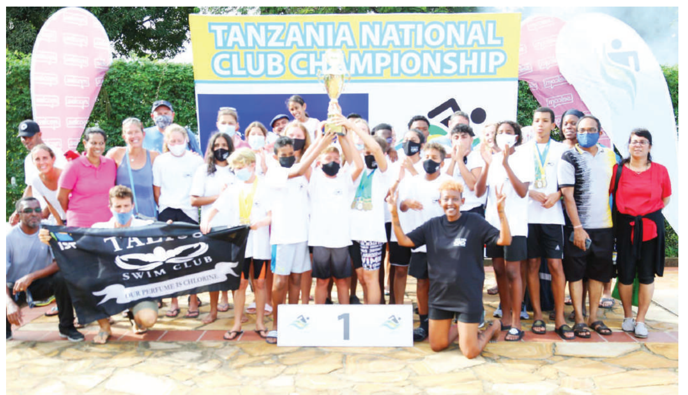
Waogeleaji wa Kluba ya Taliss, wakishangilia na kuonyesha kombe la ushindi wa jumla baada ya kushinda mashindano ya Taifa ya Kuogelea yaliyofanyika kwenye bwawa la kuogelea la Kluba ya Gymkhana, Dar es Salaam.

"Angalia wenzetu wale wa upande wa pili wamejiongeza, wana wachezaji ambao wana vitu vya ziada, ndiyo maana wamebadilika, huyu kocha wa sasa amekuja amekuta wachezaji wazuri, wenye uwezo na vitu vya ziada ya uwezo wa wachezaji wa kawaida, ndiyo umewafiki-sha hapa," alisema Mkuu huyu akiwazungumzia wapizani wao, Simba ambao wametinga robo fainali ya Ligi ya Mabingwa Afrika.