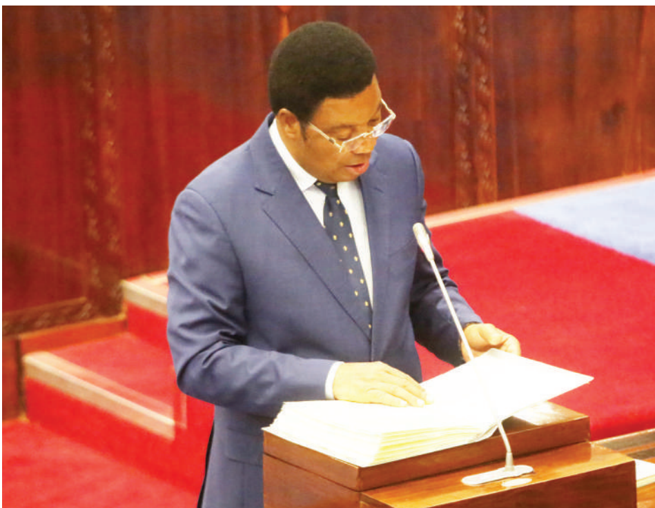
Waziri Mkuu Kassim Majaliwa, akisoma hotuba ya Makadirio ya Mapato na Matumizi ya Ofisi ya Waziri Mkuu kwa Mwaka wa Fedha 2021/2022, Bungeni jijini Dodoma, jana.