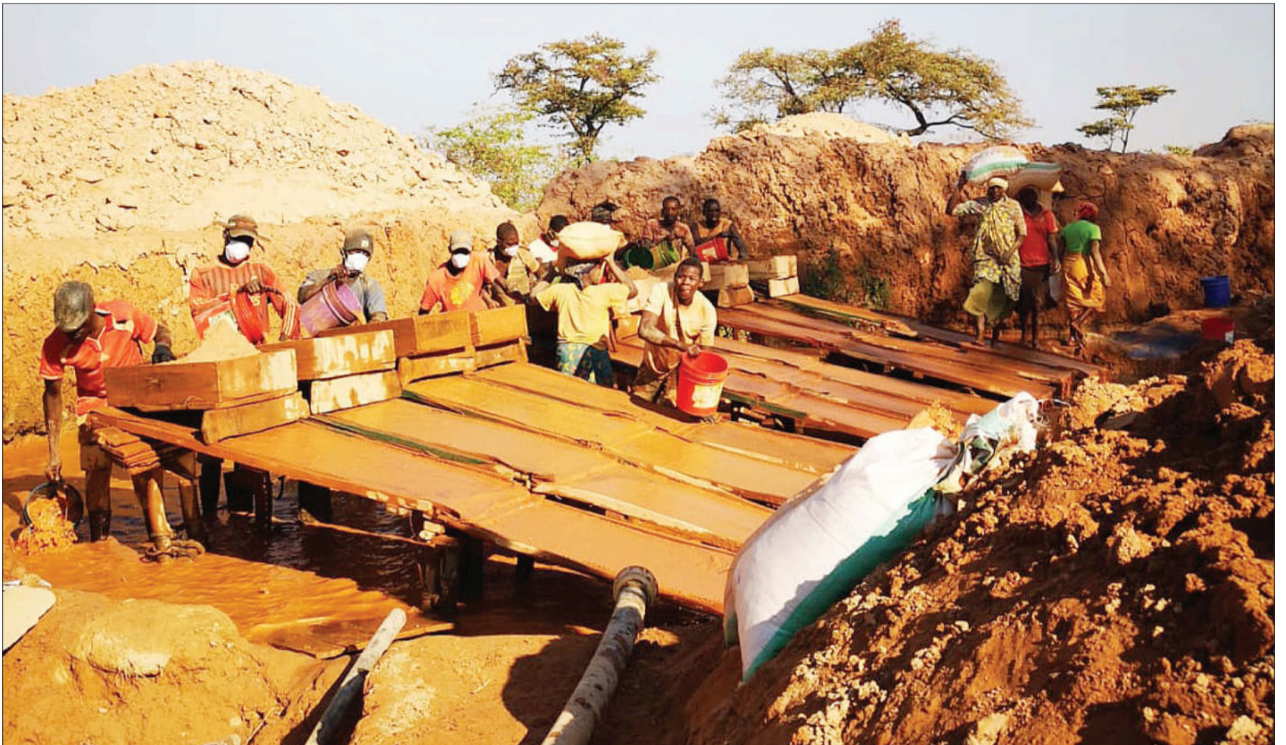
Uwekezaji kwenye madini uzisaidie jamii jirani na migodi kupunguza umaskini.