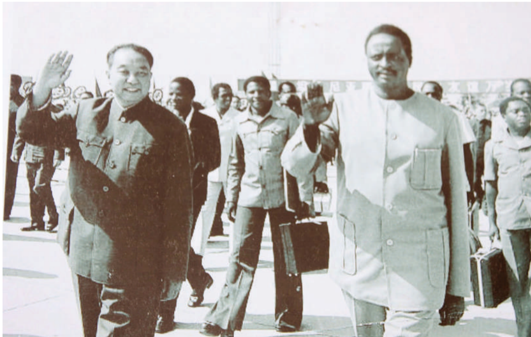
Waziri Mkuu Edward Sokoine, alipokuwa na mgeni wake kiongozi kutoka China.

Si hapo tu, bali pia katika utamaduni, mila na desturi, uzalendo, ku-