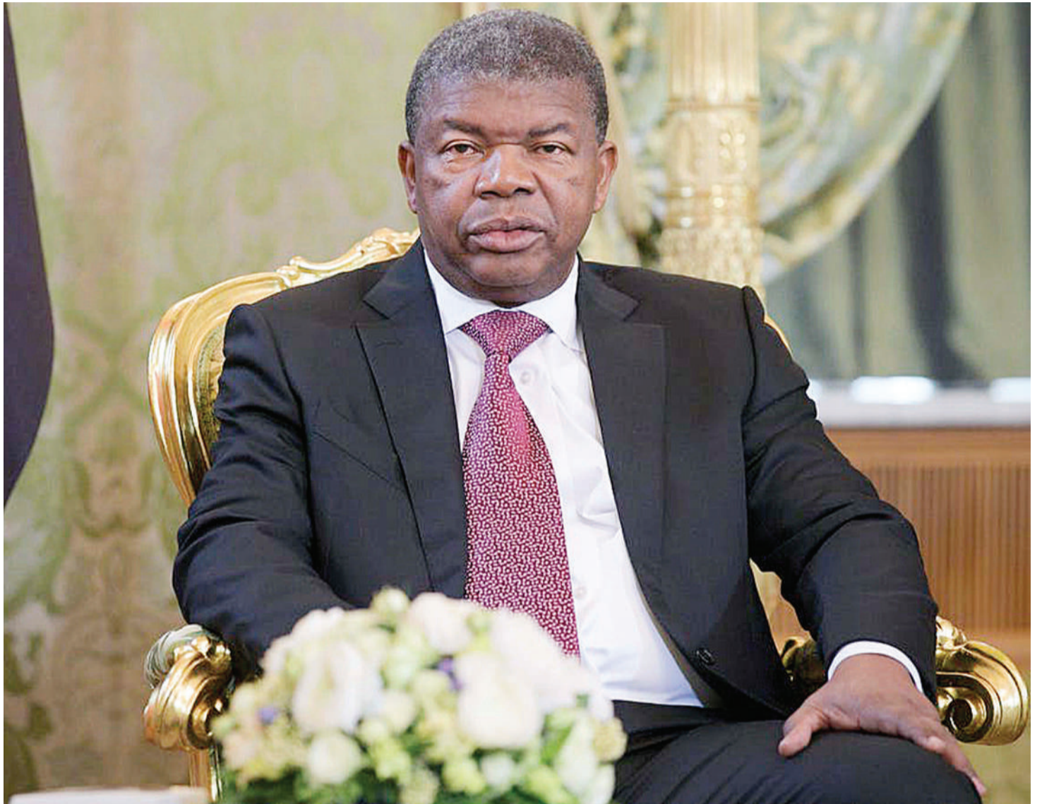
Rais Joao Lourenço wa Angola, anayetikisa familia ya mtangulizi wake kwa ufisadi.

Ndugu yake wa kambo alijikuta katika hatma kama hiyo kwa kuondolewa kama mkuu wa mfuko mkuu wa utajiri wa serikali na kuishi kizuizini na sasa anakabiliwa na kesi ya ku-