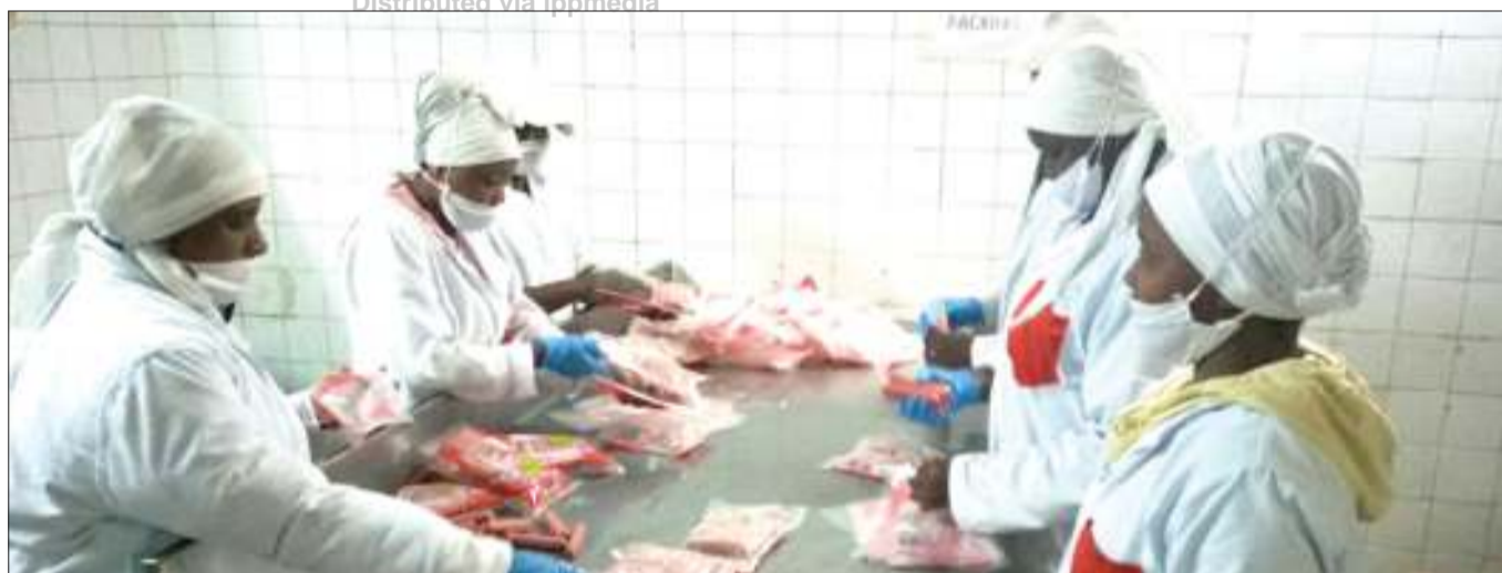
Wafanyakazi wa Kiwanda cha Happy Sausage, wakiendelea kupaki soseji kwenye mifuko, kwa ajili ya kwenda sokoni, jijini Arusha jana.

Alisema wameamua kushirikiana na serikali ya Tanzania, kuwapa mafunzo askari hao, kwa kipindi cha wiki tisa namna ya kufanya kazi na mbwa hao ili kudhibiti ujangili kwa kuwatumia mbwa hao.