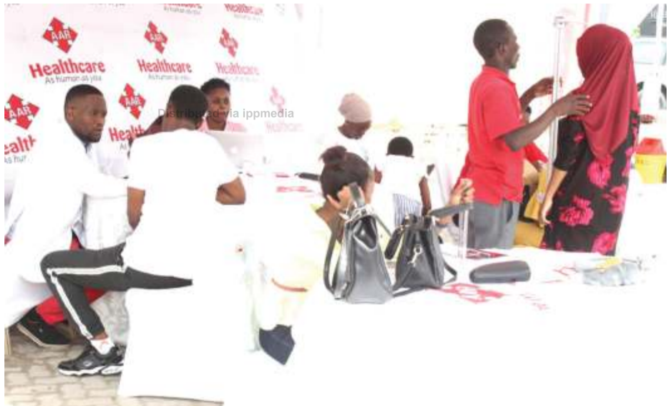
Wakazi wa Dar es Salaam wakipimwa afya bure na kupewa ushauri jijini humo, mwishoni mwa wiki.