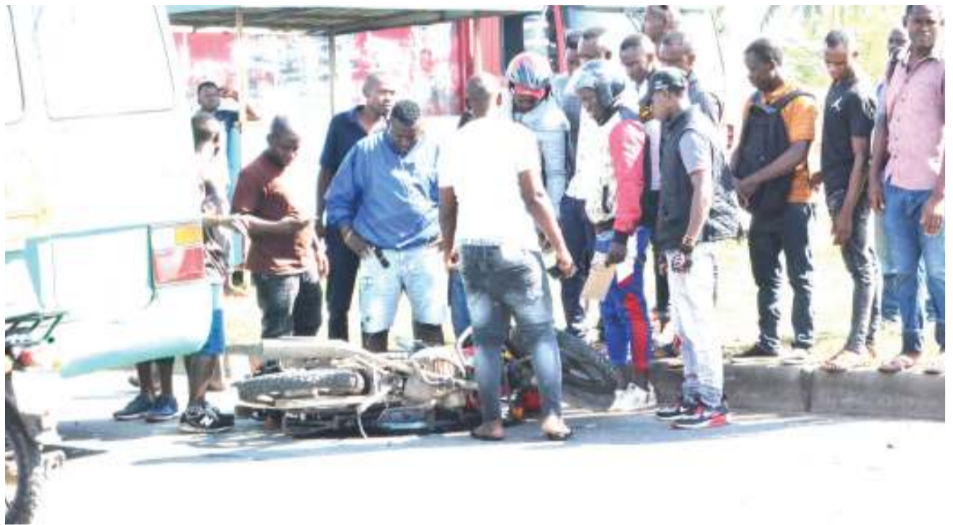
Vijana wakiangalia pikipiki ikiwa chini baada ya kugongwa na daladala, katika eneo la njia panda Goba, jijini Dar es Salaam juzi. Dereva wa pikipiki alipata majeraha.