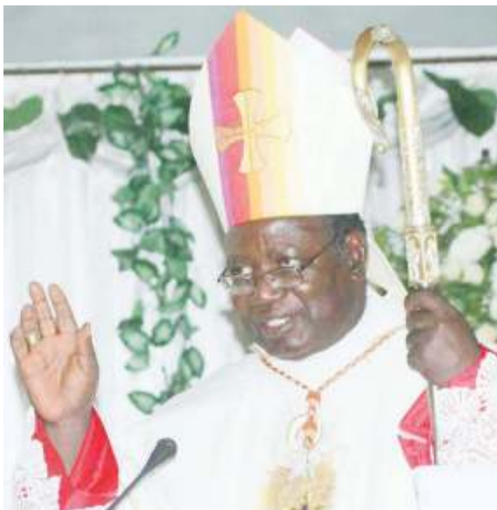
Askofu Mkuu Mstaafu wa Jimbo Kuu Katoliki la Dar es Salaam, Mwadhamu Polycarp Kardinali Pengo

Toka mwanzo Mwalimu alitoa kipaumbele katika masuala mazima ya usawa, haki, kutooneana katika jamii na alifanya hivyo akiongozwa na dhana ya upendo, nia yake ikiwa wote twende pamoja.