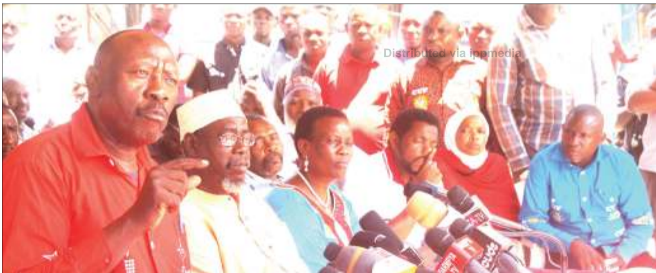
Mwenyekiti wa Chama cha Wananchi (CUF), Prof. Ibrahim Lipumba (kushoto), akizungumza na waandishi wa habari, jijini Dar es Salaam jana, wakati akitoa tamko la chama hicho, la kutokushiriki katika Uchaguzi wa Serikali za Mitaa, jijini Dar es Salaam jana.

"Nalishukuru gazeti la Nipashe kwa kumwibua kijana wangu, mimi ninaishi Mwanza, mwangu alikuwa akiishi Shinyanga na shaghazi yake pamoja na kaka yake, nilikuwa sijui chochote kile juu ya mwanangu kama anafanyika ukatili huo," alidai.