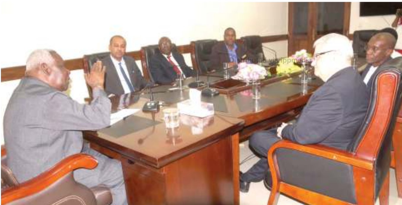
Makamu wa Pili wa Rais wa Zanzibar, Balozi Seif Ali Iddi (kushoto), akizungumza na Ujumbe wa Viongozi wa Kampuni ya Kimataifa ya Elimu na Sayansi kupitia Mfumo wa Kisasa wa Mtandao wa Teknolojia ya Habari na Mawasiliano (VM Ware), kutoka California nchini Marekani, mjini Zanzibar jana.

Alisema Serikali ya Mapinduzi ya Zanzibar imefanya jitihada za makusudi katika kukuza haki za watoto kwa kuanzisha dawati maalum la jinsia na watoto kuhudumia waathirika wa unyanyasaji wa watoto na unyanyasaji wa kijinsia ambayo yapo katika vituo vya polisi.