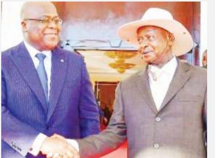
Rais Felix Tshisekedi wa DRC (kushoto), akisalimiana na mwenyeji wake Rais Yoweri Museveni wa Uganda.

Hii wameeleza viongozi hao itatoa fursa kwa wafanyabiashara kutoka pande zote mbili kuendesha shughuli zao na kwa hivyo kuchangia kwa amani, usalama na uthabiti eneo hilo.