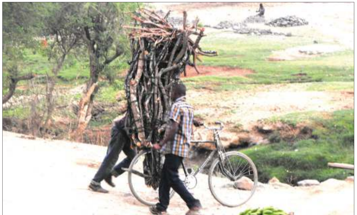
Wananchi wakisaidiana kusukuma mzigo wa kuni kwenye baiskeli katika daraja la Mto Mbalizi, Mamlaka ya Mji Mdogo wa Mbalizi, mkoani Mbeya jana. Matumizi makubwa ya mkaa ni moja ya chanzo cha uharibifu wa misitu na mazingira.

Alisema mafunzo hayo yatawaongezea walimu maarifa katika upimaji wa wanafunzi na kuimarisha ufaulu.