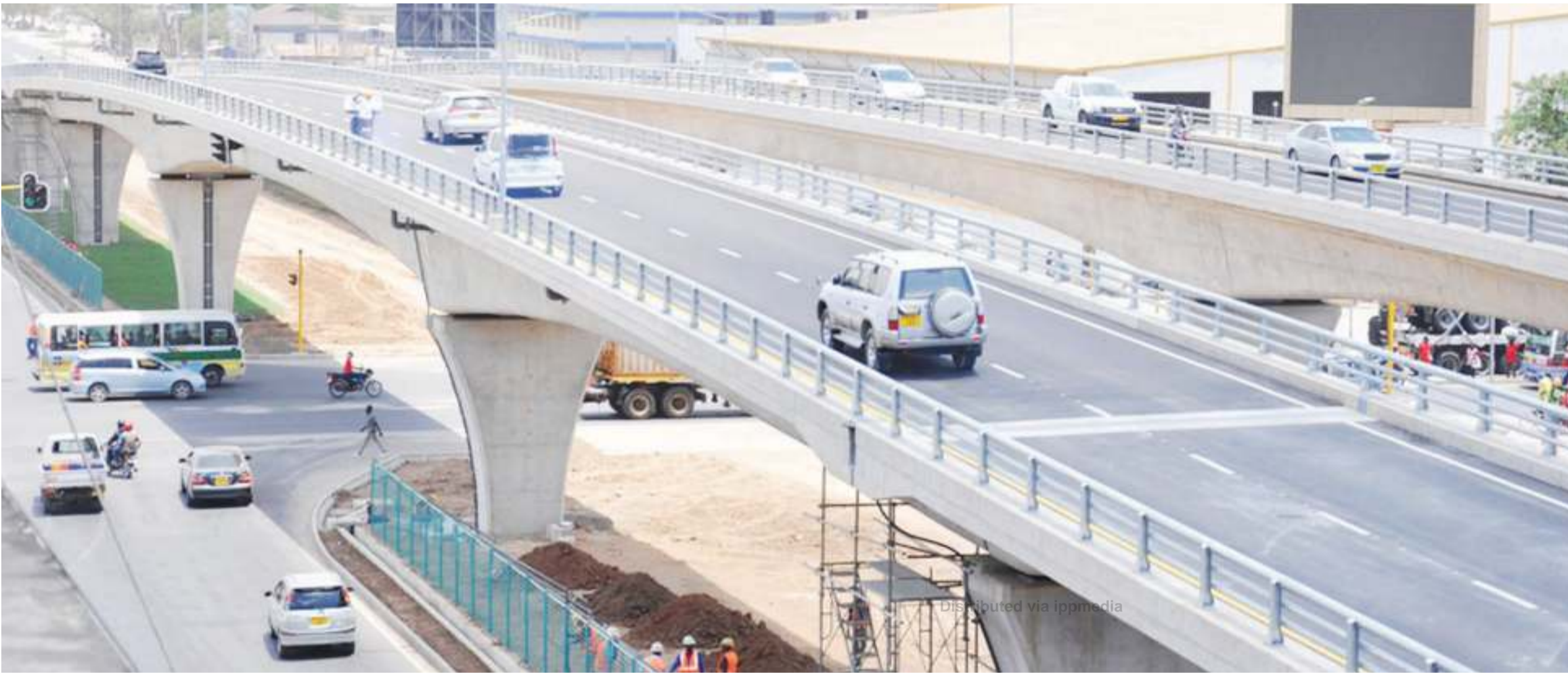
Mradi wa Daraja la Juu la Tazara (Flyover) uliojengwa chini ya Rais Magufuli.

“Hali ikiwa hivyo, makanika yaliyomsambua sana hayatapeleka tena nje ya nchi na hivyo kudhibiti