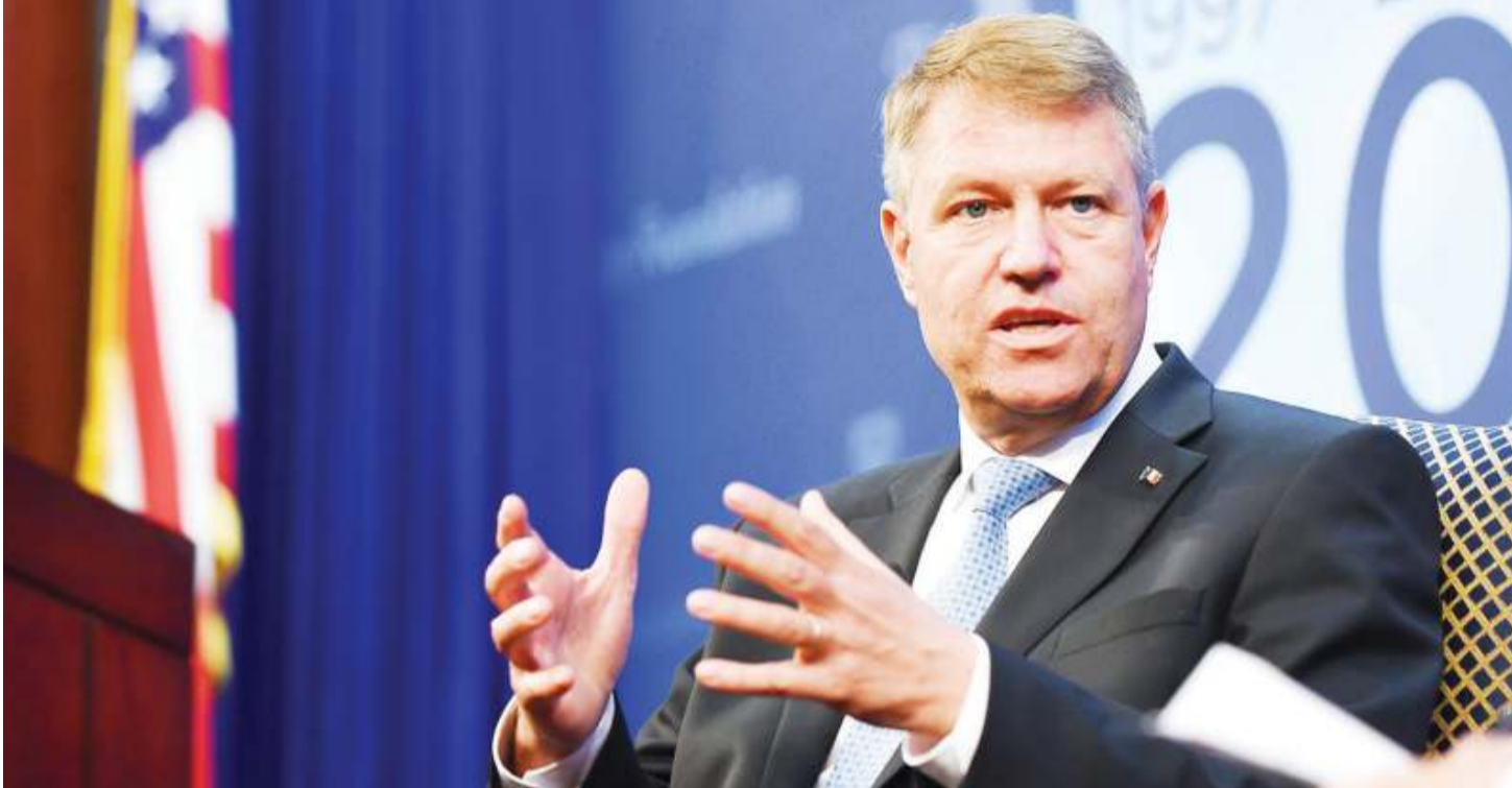
Rais Klaus Iohannis wa Romania.

• Ni ya tatu katika miezi saba, miaka 30 baada ya kuanguka kwa Ujamaa