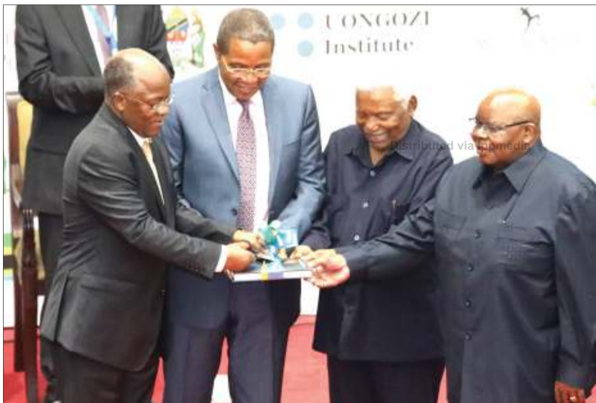
Rais John Magufuli akizindua kitabu cha Historia ya Maisha ya Rais mstaafu, Benjamin Mkapa (kulia), akishuhudiwa na Rais wa Zanzibar Dk. Ali Mohamed Shein na Marais wastaafu Ali Hassan Mwinyi, Jakaya Kikwete, katika Ukumbi wa Mikutano wa Kimataifa wa Julius Nyerere, jijini Dar es Salaam jana.