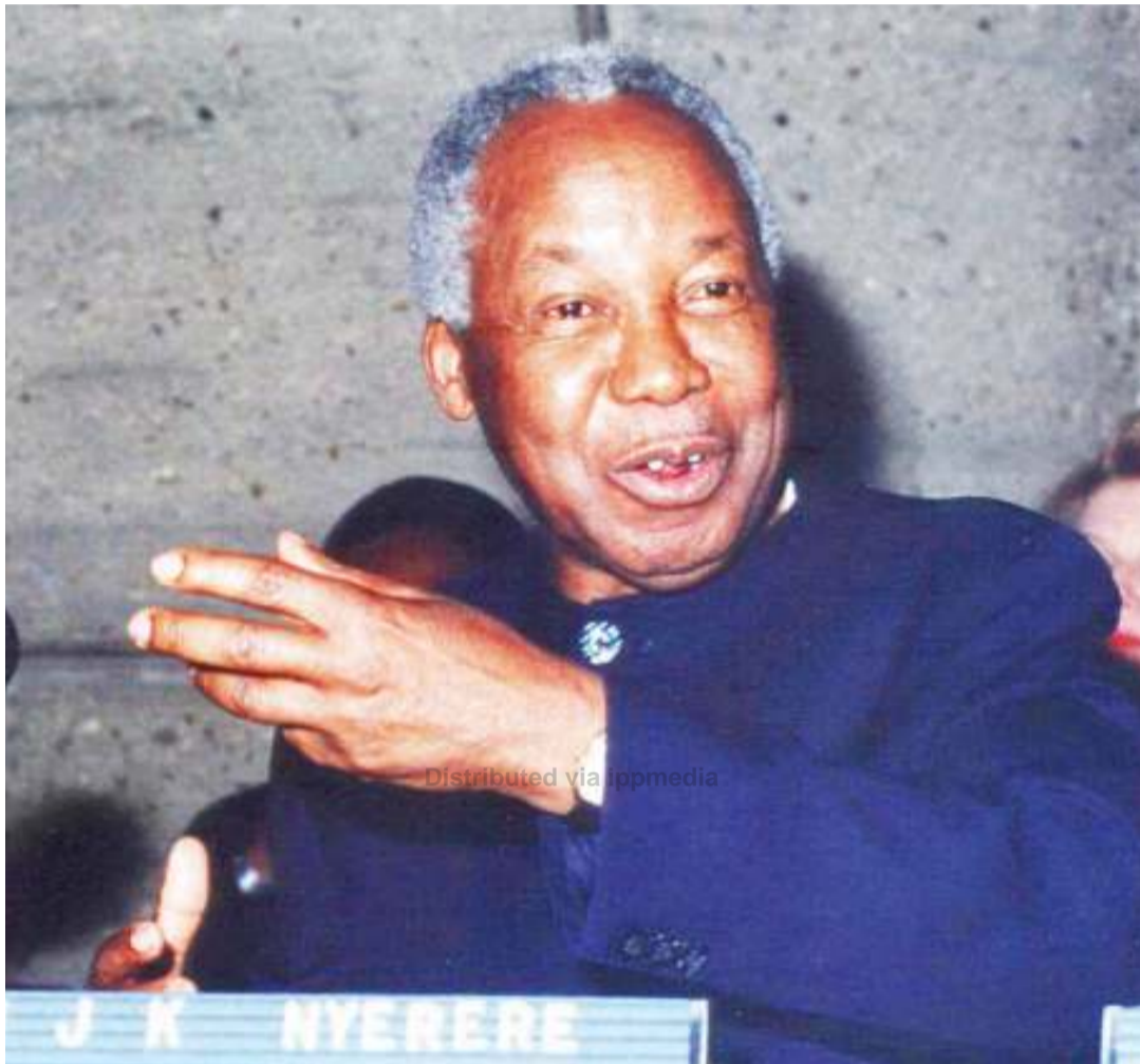
Baba wa Taifa Mwalimu Julius Nyerere.