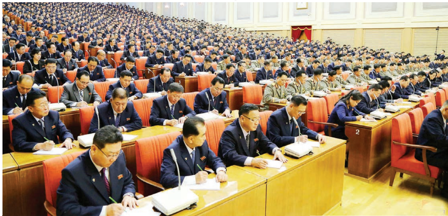
Wajumbe wa kikao cha kisiasa, ambacho kiongozi huyo alikiri.

Taarifa kupitia televisheni zinaonyesha wakiwa kwenye mkutano katika mji mkuu wa Pyongyang uliokuwa umejaa