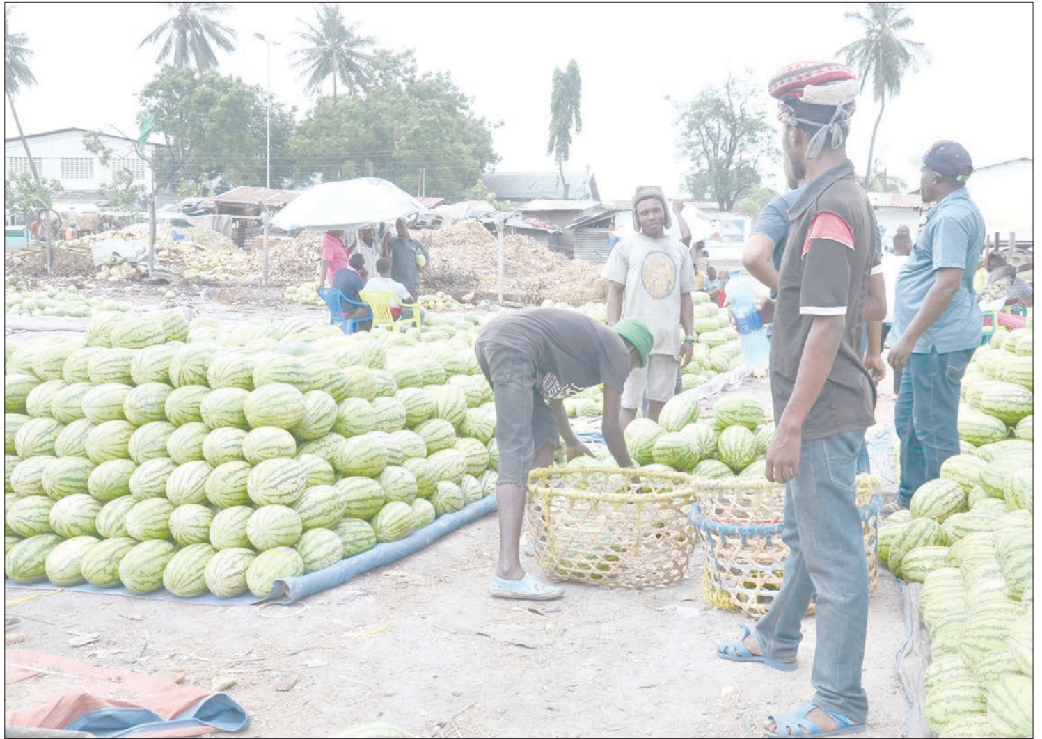
Wateja wakichagua matikiti katika Soko la Vetinari jijini Dar es Salaam jana, tikiti moja linauzwa kwa Sh. 3,000 hadi 2,500.