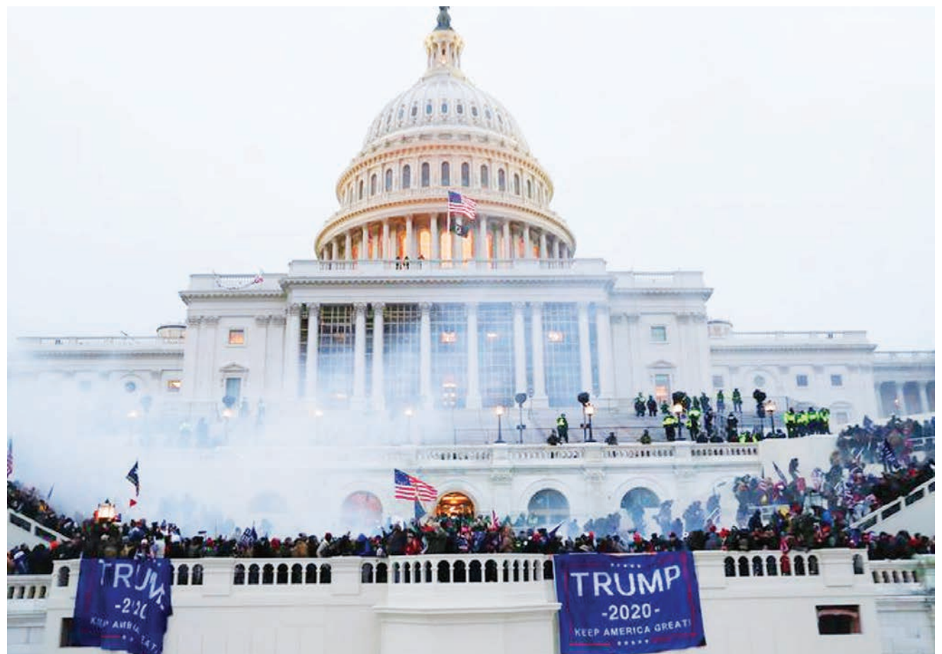
Wafuasi wa Rais Donald Trump wakiwa wamekusanyika mbele ya jengo la Capitol, jana, wakati Bunge la Congres likimwidhinisha Joe Biden na Kamala Hariss kama rais mtarajiwa na makamu wake nchini Marekani.

Taarifa kupitia televisheni ilionyesha wakiwa kwenye mkutano katika mji mkuu wa Pyongyang, uliokuwa umejaa maelfu ya wanachama na hakuna ambaye alikuwa amevaa barakoa walipokuwa wamesimama kupiga makofi wakimkaribisha wakati anaingia. BBC