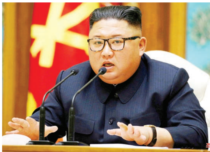
Kiongozi Mkuu wa Korea Kaskazini, Kim Jong-un.

maelfu ya wanachama na haku aliyekuwa amevaa barakoa walipokuwa wamesimama kupiga makofi wakimkaribisha Kim alipolingia mkutanoni.