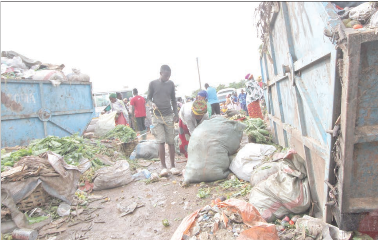
Wauza mboga wa soko la Sabasaba jijini Dodoma wakifanya biashara kwenye eneo linalohifadhiwa takataka bila kujali afya zao na wateja.