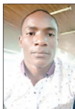
Na Maulid Mmbaga