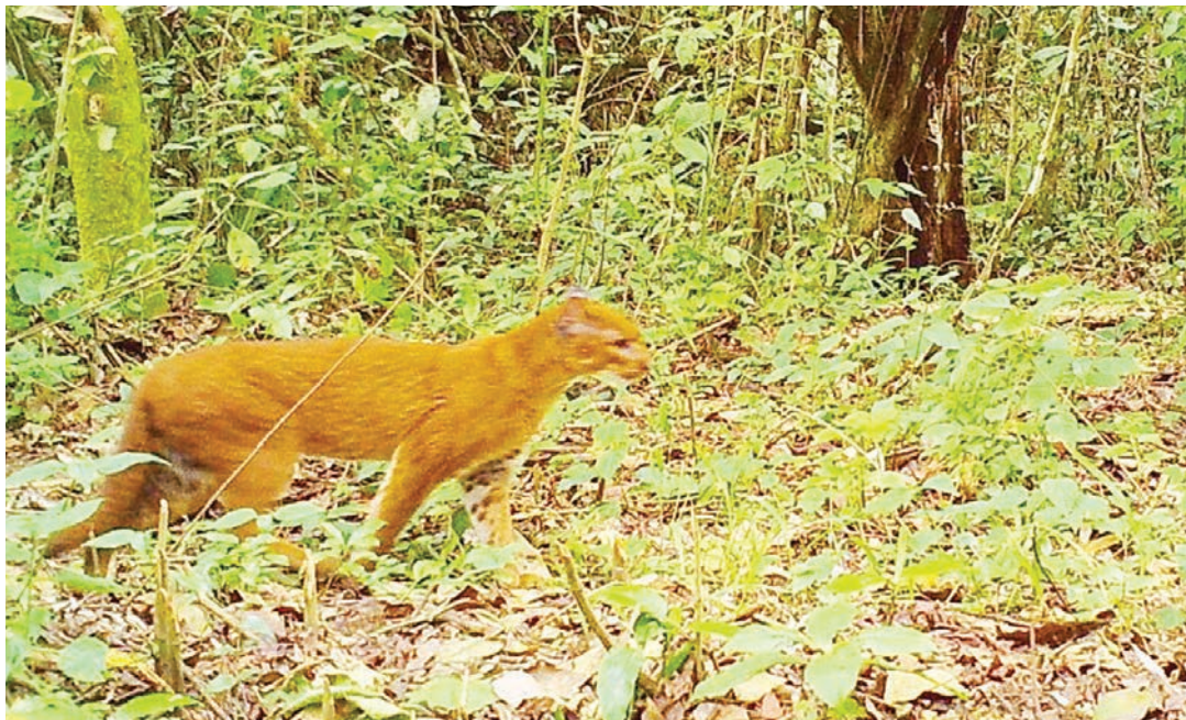
Namna wanyama wakiwa ndani ya Hifadhi ya Minziro.

Anasema, katika hifadhi hiyo kuna kilima kinachoitwa Kele, am-