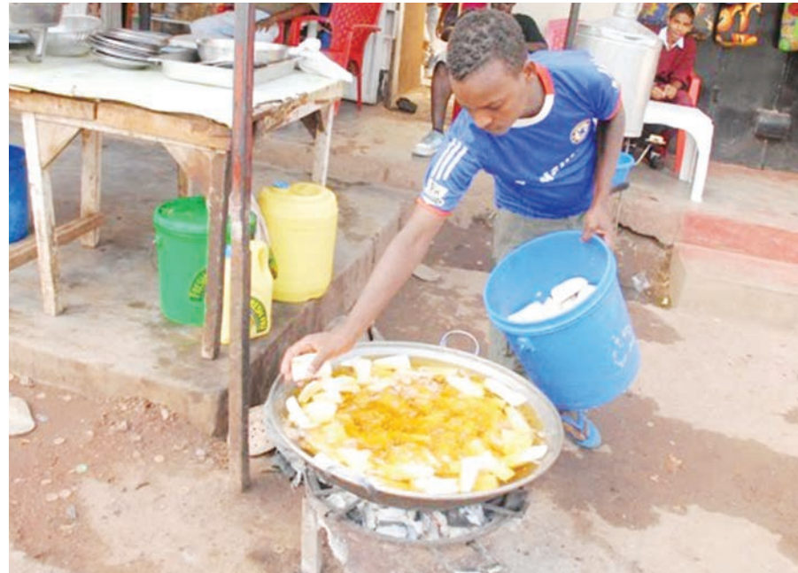
Muuza mihogo ya kukaanga akiandaa bidhaa zake.

"Ninanunua samaki ndoo ndogo kati ya Sh. 60,000 hadi 70,000 kutegemeana na siku. Wakiadi-