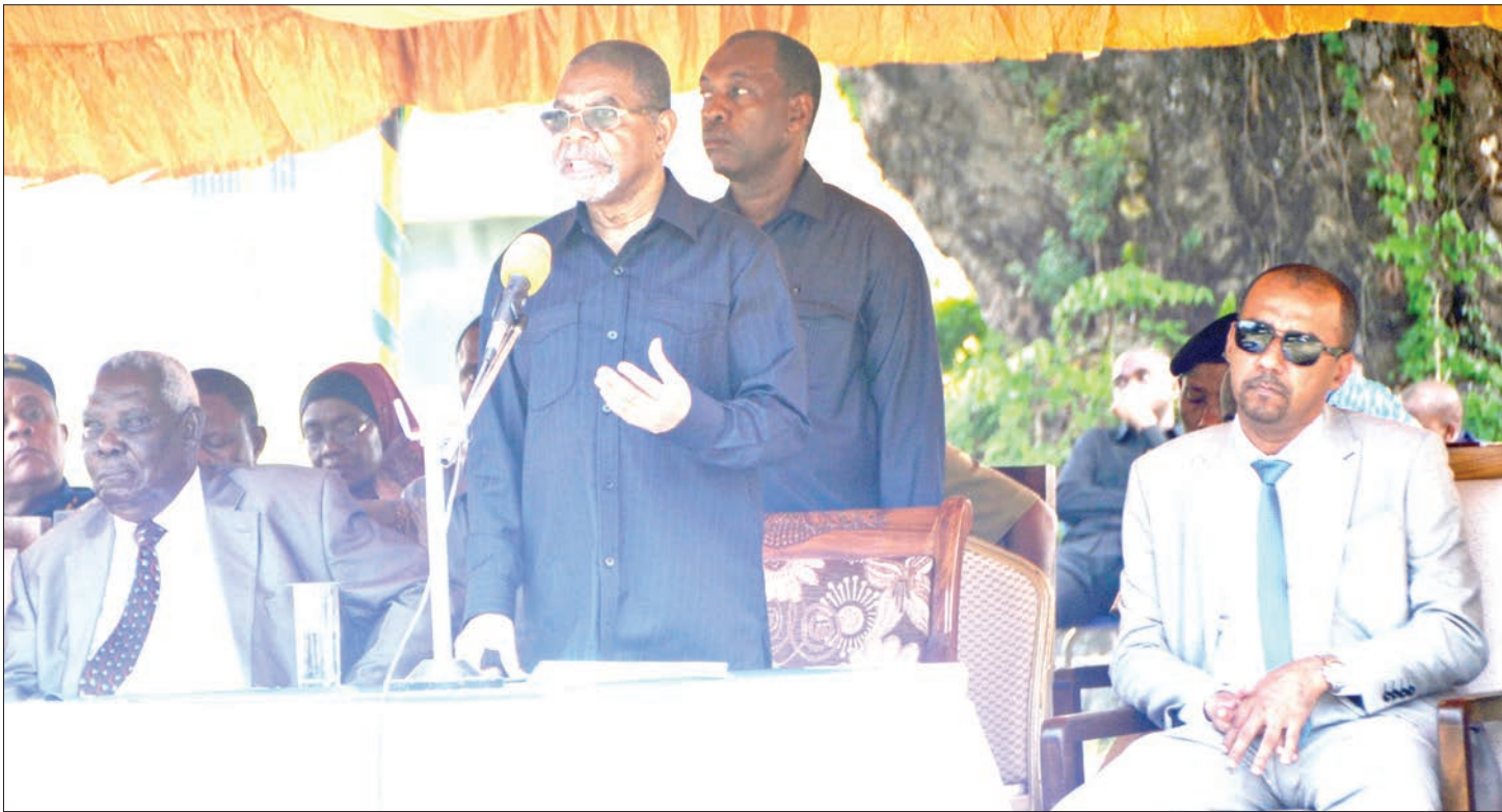
Rais mstaafu wa awamu ya saba, Dk. Ali Mohamed Shein, akitoa hotuba katika ufunguzi wa Chuo cha Utalii Maruhubi Wilaya ya Mjini Mkoa wa Mjini Magharibi Unguja. Ikiwa ni shamra shamra za miaka 57 ya Mapinduzi Zanzibar.