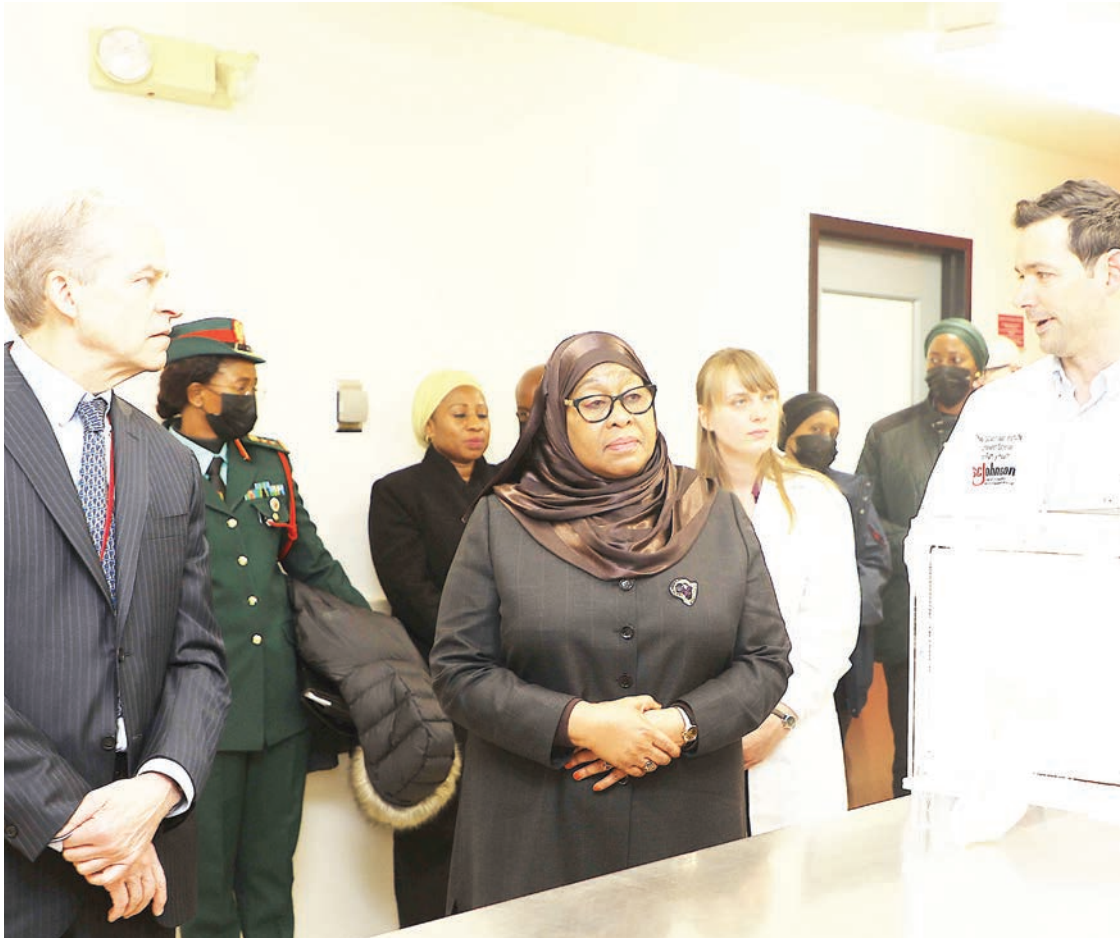
Rais Samia Suluhu Hassan, akipata maelezo kuhusu namna ya kudhibiti wadudu wanaodhuru waenezo magonjwa mbalimbali, alipotembelea moja ya Kiwanda kinachotengeneza viuatilifu kwa ajili ya kudhibiti wadudu hao cha SC Johnson Family, katika mji wa Chicago, nchini Marekani juzi. Kushoto ni Mwenyekiti na Mkurugenzi Mtendaji wa Kampuni ya SC Johnson Family, Dk. H. Fisk Johnson.