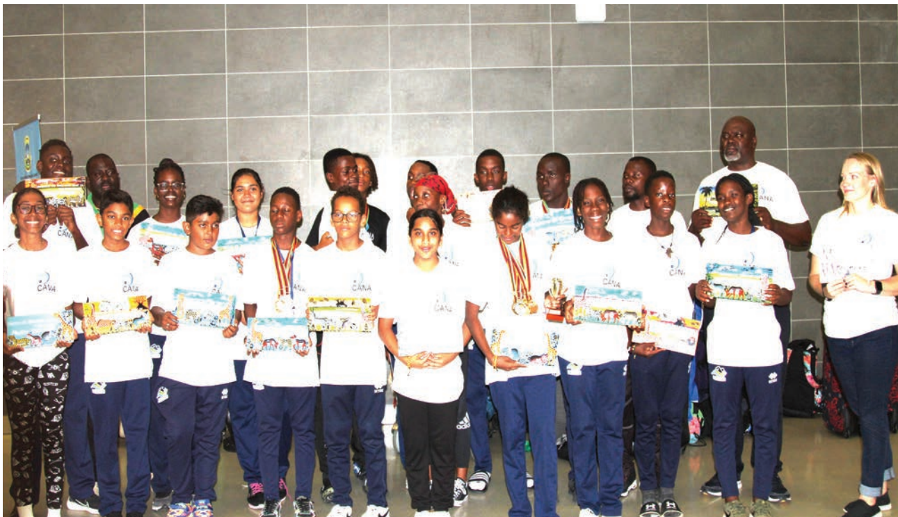
Waogeleaji wa Tanzania, makocha na viongozi wakiwa katika picha ya pamoja baada ya kuwasili Uwanja wa Julius Nyerere (Terminal -3), wakitokea Zambia ambapo walishiriki katika mashindano ya Kanda ya Nne ya Afrika na kushinda medali 13.

Alimanya alisema wanaamini kuwa muda si mrefu, waogeleaji wa Tanzania wataweza kufanya vema katika mashindano ya Dunia, Olimpiki na Jumuiya ya Madola.