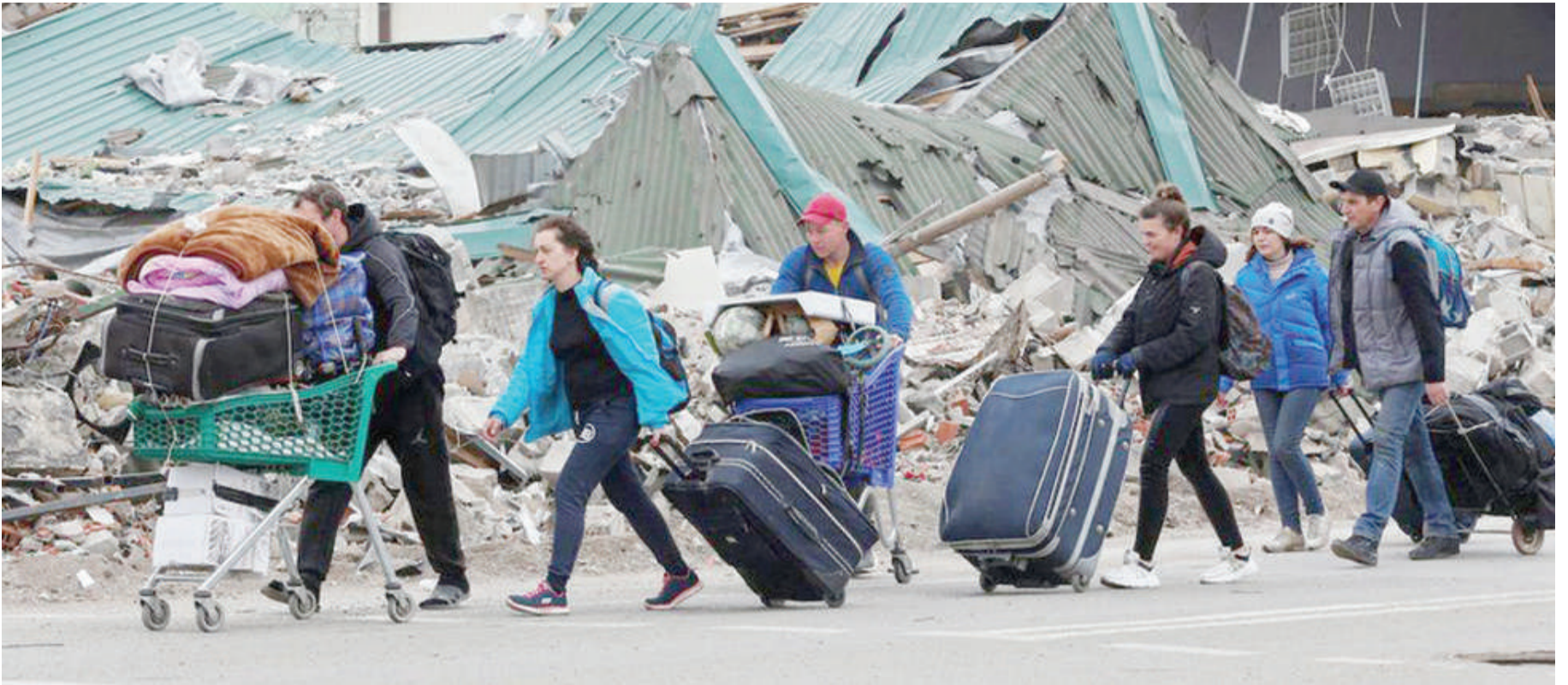
Baadhi ya raia wakiondoka miji yenye mashambulizi ikiwamo Mariupol, nchini Ukraine, baada ya nchi hizo zinazohasimiana kukubaliana kufungua njia za kiutu.