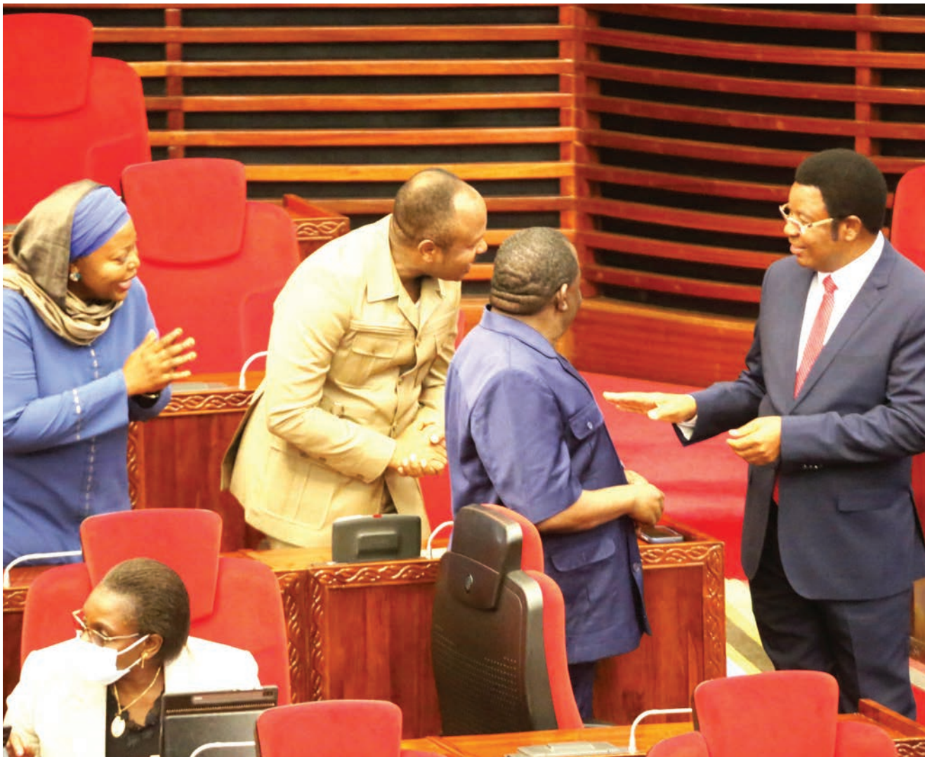
Waziri Mkuu Kasimu Majaliwa, akibadilishana mawazo na baadhi ya wabunge ndani ya ukumbi wa Bunge, jijini Dodoma jana.

Hata hivyo, alisema wizara inaendelea kuratibu namna ya kushughulikia barabara itakayopitisha mabomba kwenda kwenye mradi wa bomba la mafuta.