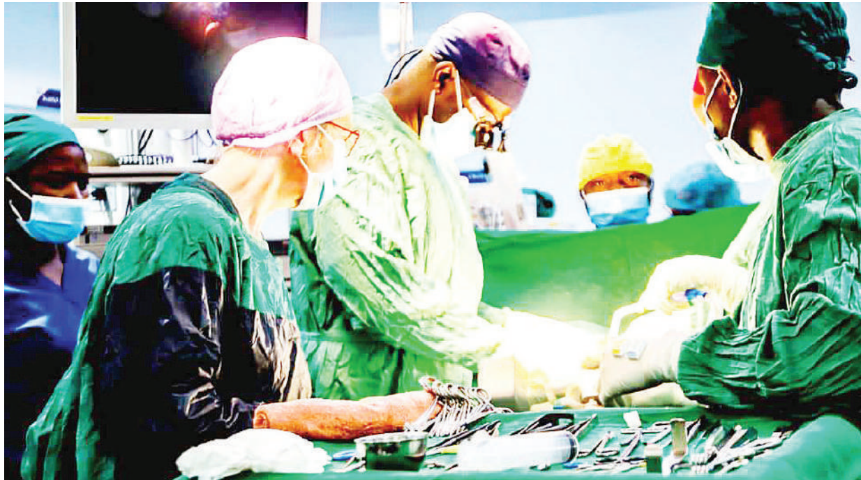
Madaktari Bingwa kutoka Hospitali ya Rufani ya Kanda ya Benjamin Mkapa (BHM), wakifanyia mgonjwa upasuaji wa moyo bila kufungua kifua, hospitalini hapo, jijini Dodoma juji.

Mradi huo ulipangwa kukamilika katika kipindi cha miaka minne (2016-2020). Hata hivyo, kutokana na kucheleweshwa kwa hatua za usanifu na ununuzi, tarehe ya kukamilisha mkataba kwa loti ya kwanza ilikuwa Mei 5, 2022 na kwa loti ya pili ilikuwa Februari 28, 2021.