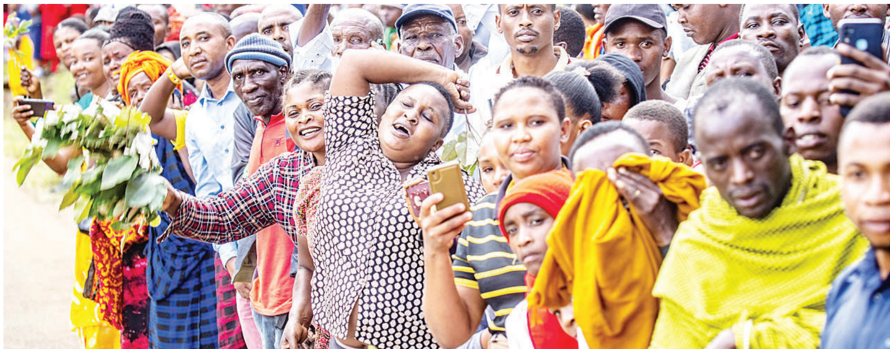
Sehemu ya wananchi waliojitokeza kando ya barabara kumuaga Waziri Mkuu mstaafu, Hayati Edward Ngoyai Lowassa katika eneo la USA River, mkoani Arusha jana, wakati msafara wake ukipita kuelekea nyumbani kwake, kijiji cha Ngarash wilayani Monduli.