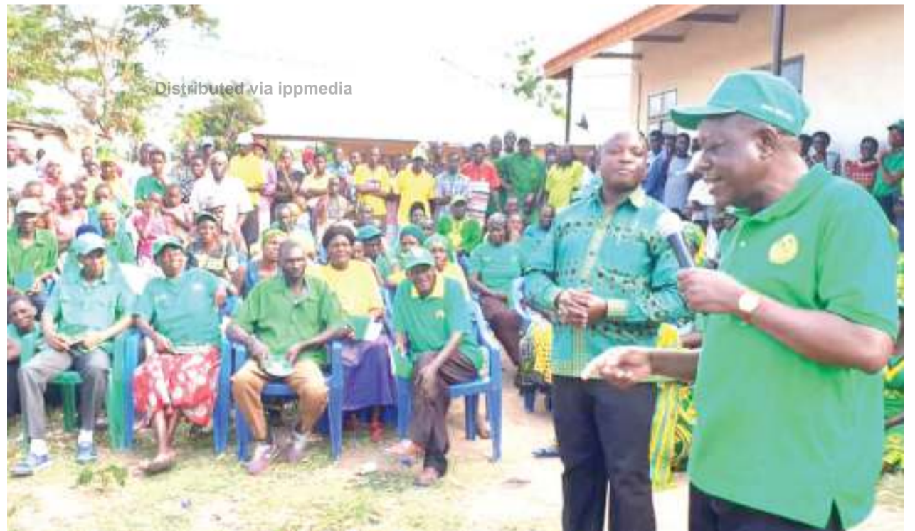
Mbunge wa Musoma Vijijini, mkoani Mara, Prof. Sospeter Muhongo (kulia) akizundua kampeni za Chama Cha Mapinduzi kwa ajili ya uchaguzi wa Serikali za Mitaa, katika Kata ya Kiriba, wikiendi.

"Waivune na endapo watahinda nitaivuna na kuitaifisha na kuwa mali ya shule na ndicho kilichotokea."