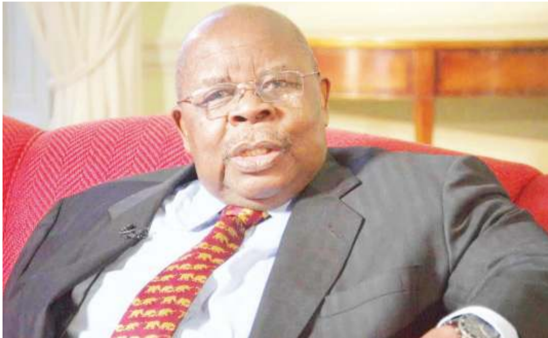
Msuluhishi Benjamin Mkapa.

Mkapa anasema wajumbe wa ODM na PNU wasingeweza kufikia makubaliano mpaka Odinga na Kibaki walipokutanishwa kwenye