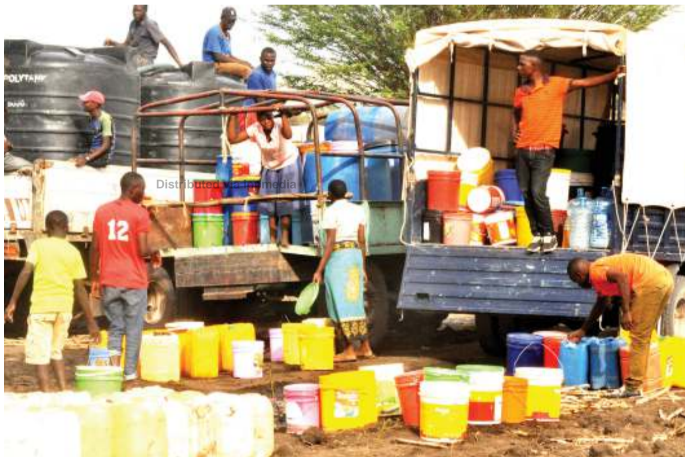
Baadhi ya magari likiwamo la Jeshi la Polisi, Wilaya ya Maetu, mkoani Simiyu, yakiwa yamebeba vyombo kuchota maji kwenye kisima kilichopo katika kijiji cha Mwangwila, nje ya kidogo ya mji wa Mhanuzi juzi, na kwenda kuyagawa kwa wananchi wa mji huo, ambao wamekumbwa na adha ya maji kwa zaidi ya siku 20 sasa.

Alisema lengo la kuja kwake Tanzania ni kuangalia utekelezaji wa miradi mbalimbali inayofadhiliwa na Benki hiyo ili kuona maendeleo yake.