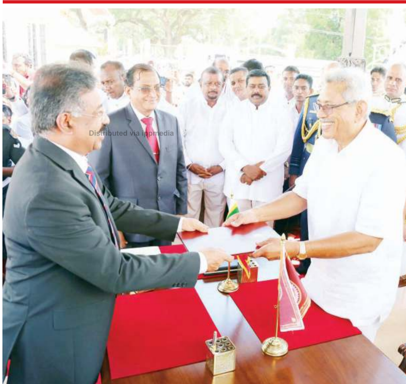
Rais mpya wa Sri Lanka, Gotabaya Rajapaksa (kushoto), akiapa baada ya kutangazwa kuwa mshindi wa uchaguzi kwa kupata kura zaidi ya asilimia 50.

Miale ya moto iliyotokana na mfululizo wa milipuko ilionekana kutoka ndani ya majengo pindi maafisa wa Jeshi la Polisi wa kutuliza fujo walipoingia kwenye viunga vya chuo hicho siku ya Jumatatu alfajiri.