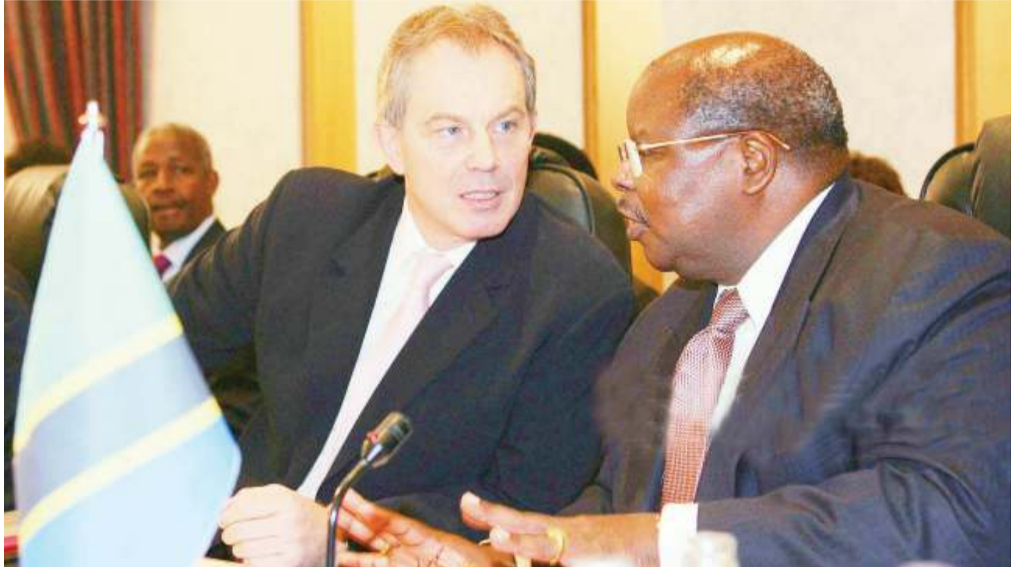
Mkapa na Waziri Mkuu wa zamani wa Uingereza, Tony Blair.

Ndivyo anavyosema katika sura ya 15 ya kitabu chake cha My Life My Purpose kuhusu kumbukumbu za maisha yake, kilichoizinduliwa wiki iliyopita jijini Dar es Salaam.