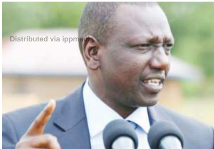
Makamu wa Rais wa sasa William Ruto.

Kwenye uchaguzi huo, Raila alishindana kwa karibu na Rais aliyekuwa anamaliza awamu ya kwanza ya utawala wa miaka mitano, Mwai Kibaki wa chama cha Party of National Unity (PNU).