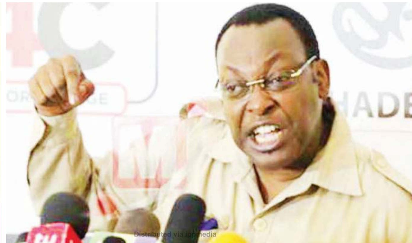
Mwenyekiti wa Chadema, Freeman Mbowe.