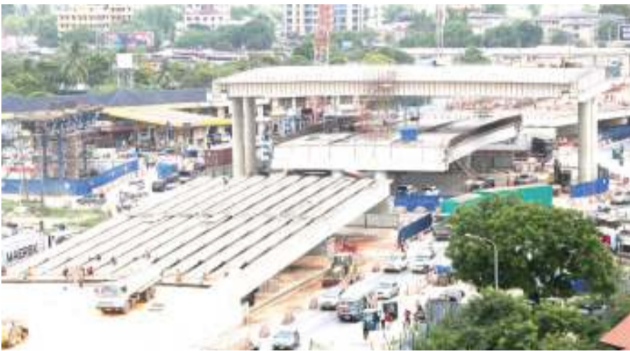
Ujenzi wa barabara za juu eneo la Ubungo jijini Dar es Salaam, unaendelea kwa kasi ambapo ukikamilika utarahisisha kupunguza foleni za magari kwenye makutano ya barabara za Morogoro, Sam Nujoma na Mandela.