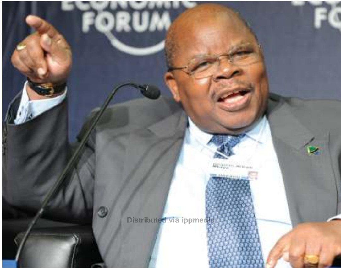
Rais mstaafu, Benjamin Mkapa.

• Upishi nyumbani; shuleni 'tatu bora' wa 'kudumu; kazini 'alimkosha' Nyerere