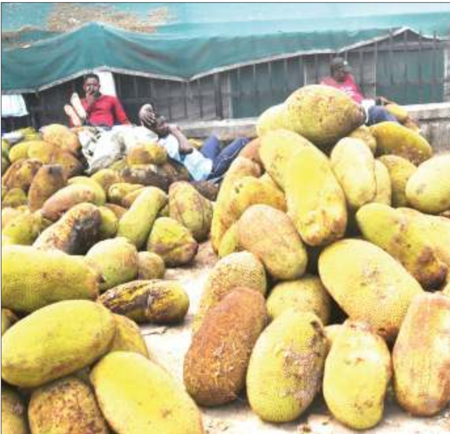
Wafanyabiashara wa mafenesi wakiwa wameyalundika kando ya barabara jirani na Kituo cha Afya cha Tandale, Manispaa ya Kinondoni, jijini Dar es Salaam jana, wakati wakisubiri wateja. Fenesi moja linauzwa kwa 2,500/- hadi 6,000/-.