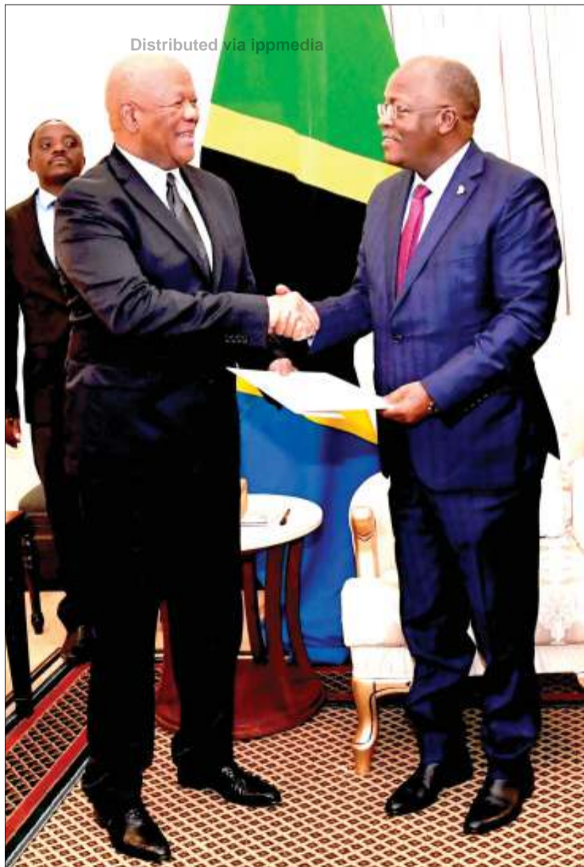
Rais John Magufuli akipokea barua yenye ujumbe maalum kutoka kwa Rais wa Afrika Kusini, Cyril Ramaphosa, iliyowasilishwa kwake na Mjumbe Maalum wa Rais huyo, Waziri wa zamani wa Nishati wa nchi hiyo, Jeffrey Radebe, baada ya kuwasili Ikulu jijini Dar es Salaam jana.