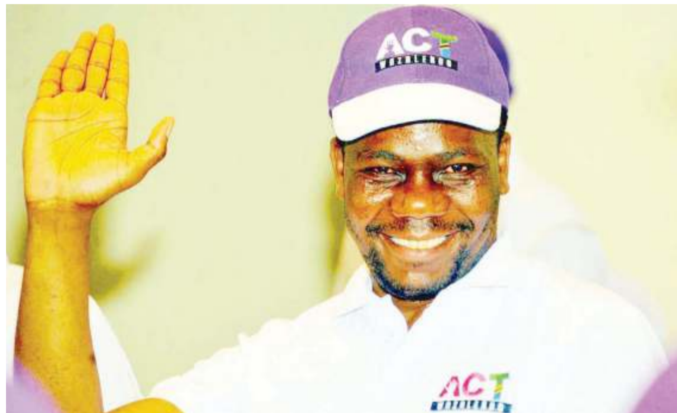
Kiongozi Mkuu wa ACT - Wazalendo, Zitto Kabwe.