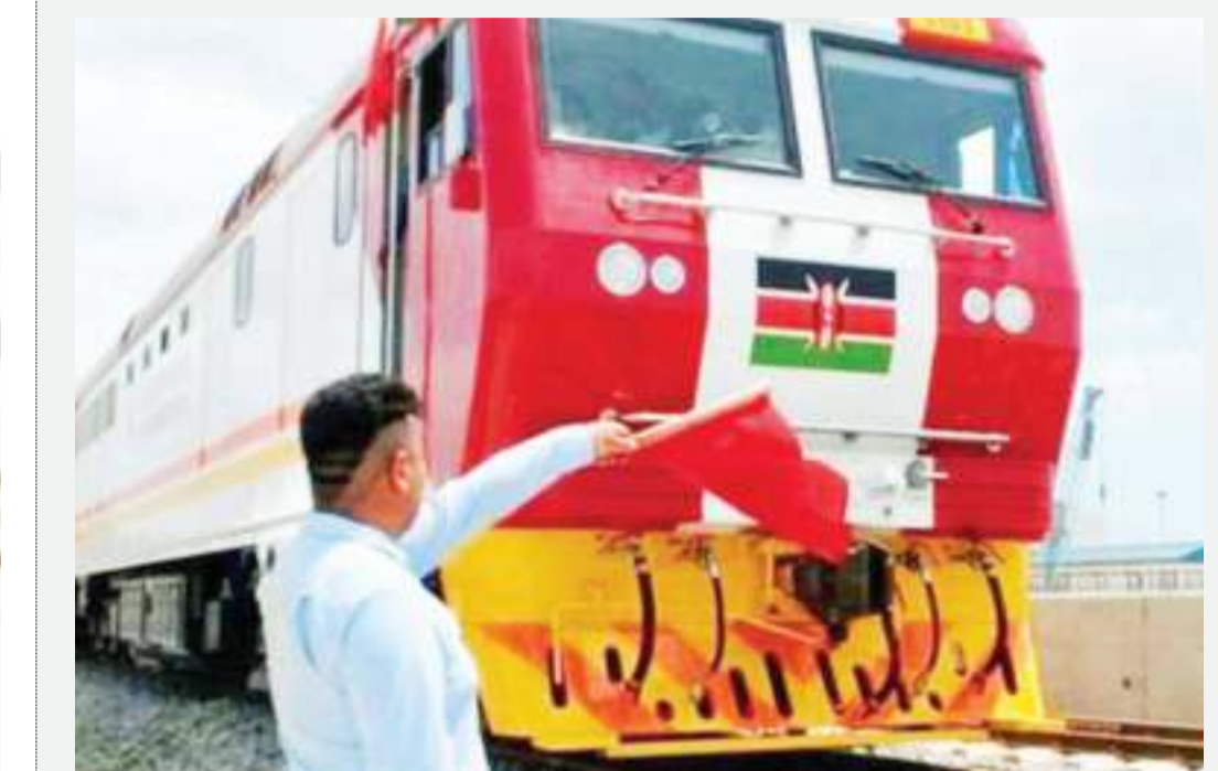
Muhandisi akiongoza treni ya kisasa Jijini Nairobi.