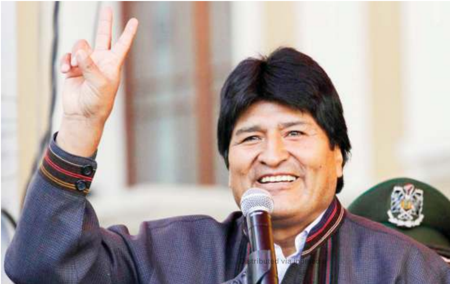
Evo Morales.