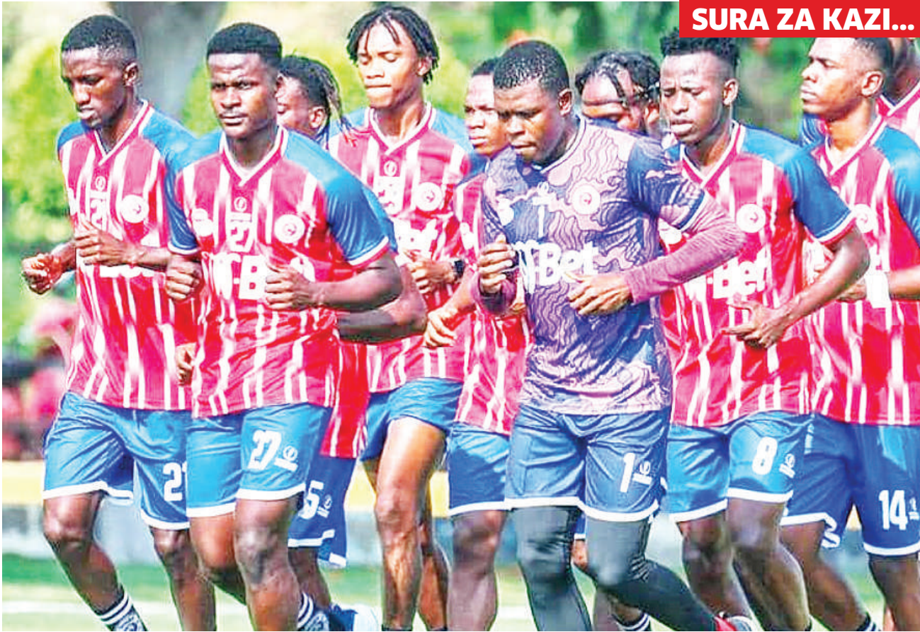
Wachezaji wa Simba wakiwa mazoezini huko Ismailia, Misri, kujiandaa na msimu mpya wa 2024/25.