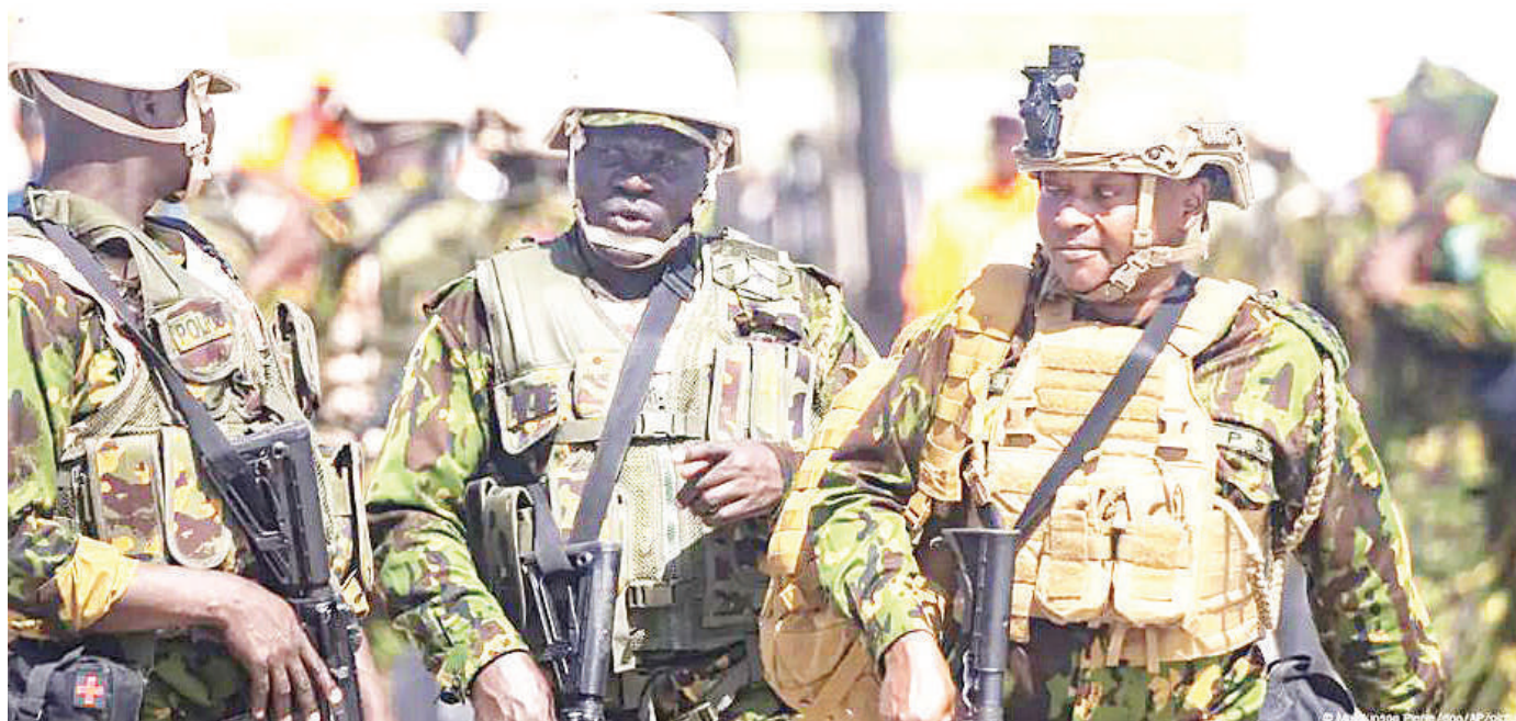
Baadhi ya polisi wa kikosi cha kwanza kutoka Kenya baada ya kutua uwanja wa ndege wa Toussaint Louverture nchini Haiti hivi karibuni.