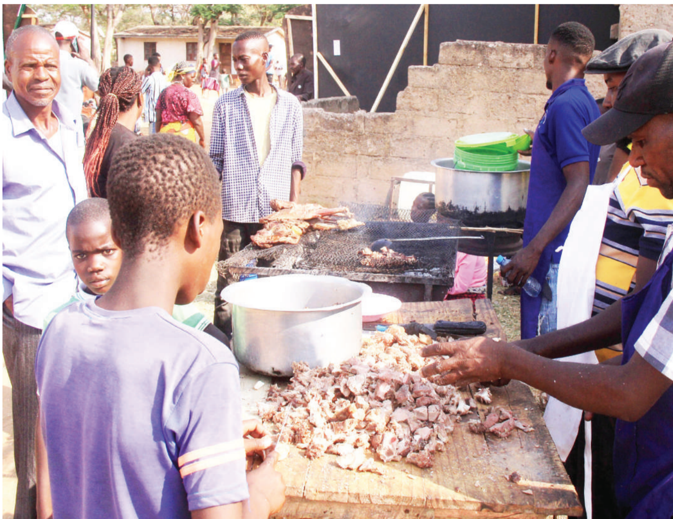
Wachuuzi wa nyama choma wakiandaa kwaajili ya wateja wao katika eneo maarufu kwa kitoweo hicho kwa gharama nafuu, mjini Bariadi hivi karibuni.

Alisema barabara ya Kolandoto hadi Mhunze imetengewa Shilingi bilioni moja kuanza ujenzi kilomita 20 na ya Oldshinyanga hadi Solwa upembuzi yakinifu umekamilika.