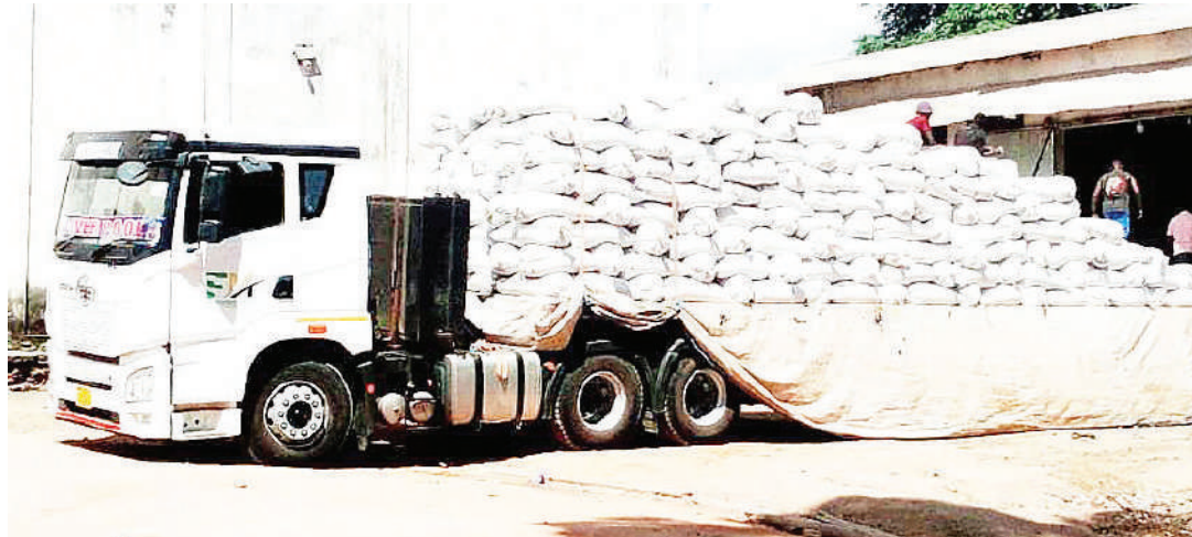
Gari likishusha ufuta katika ghala kwa ajili kuuzwa mnadani katika mkoa wa Pwani.

irika Mkoani Pwani (CORRECU), Hamis Mantawela, anasema huo ni mnada wa tano wa ufuta kufanyika hapo, ambako zaidi ya tani 1,000 za mazao zilikusanywa na kuuzwa.