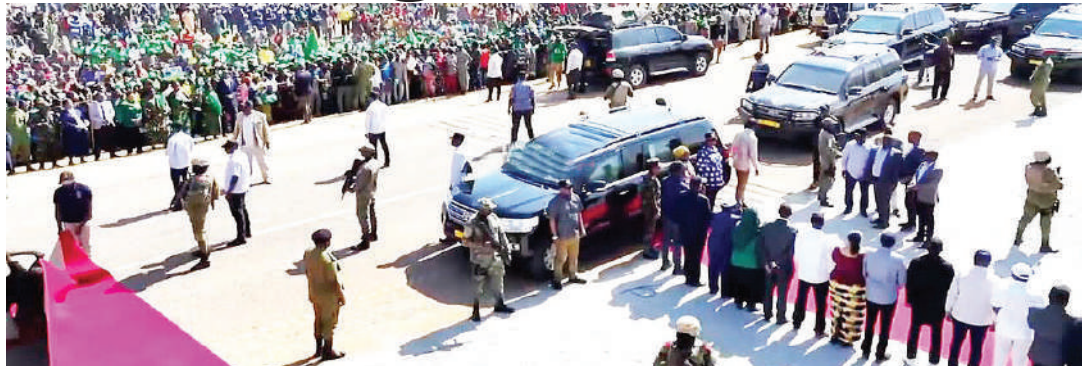
Dk. Samia Suluhu Hassan, alipozindua Barabara ya Sumbawanga - Matai hadi Bandari Ka-sanga.

Akaendelea: "Niwaombe Wa-nanchi na Kalambo (wilaya) na wasafirishaji wote kutunza mi-undombinu ya barabara, kwa kuacha kulima au kufukua fukua pembezoni mwa barabara kwani kufanya hivyo, kunasababisha