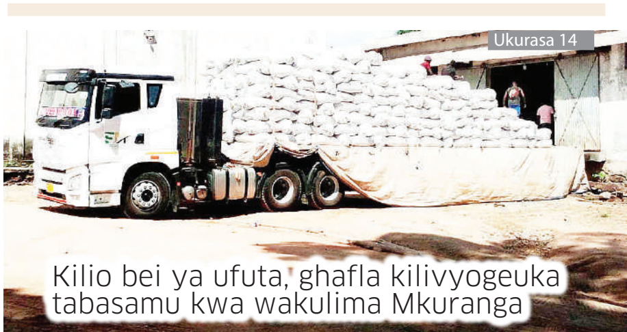
Kilio bei ya ufuta, ghafla kilivyogeuka tabasamu kwa wakulima Mkuranga