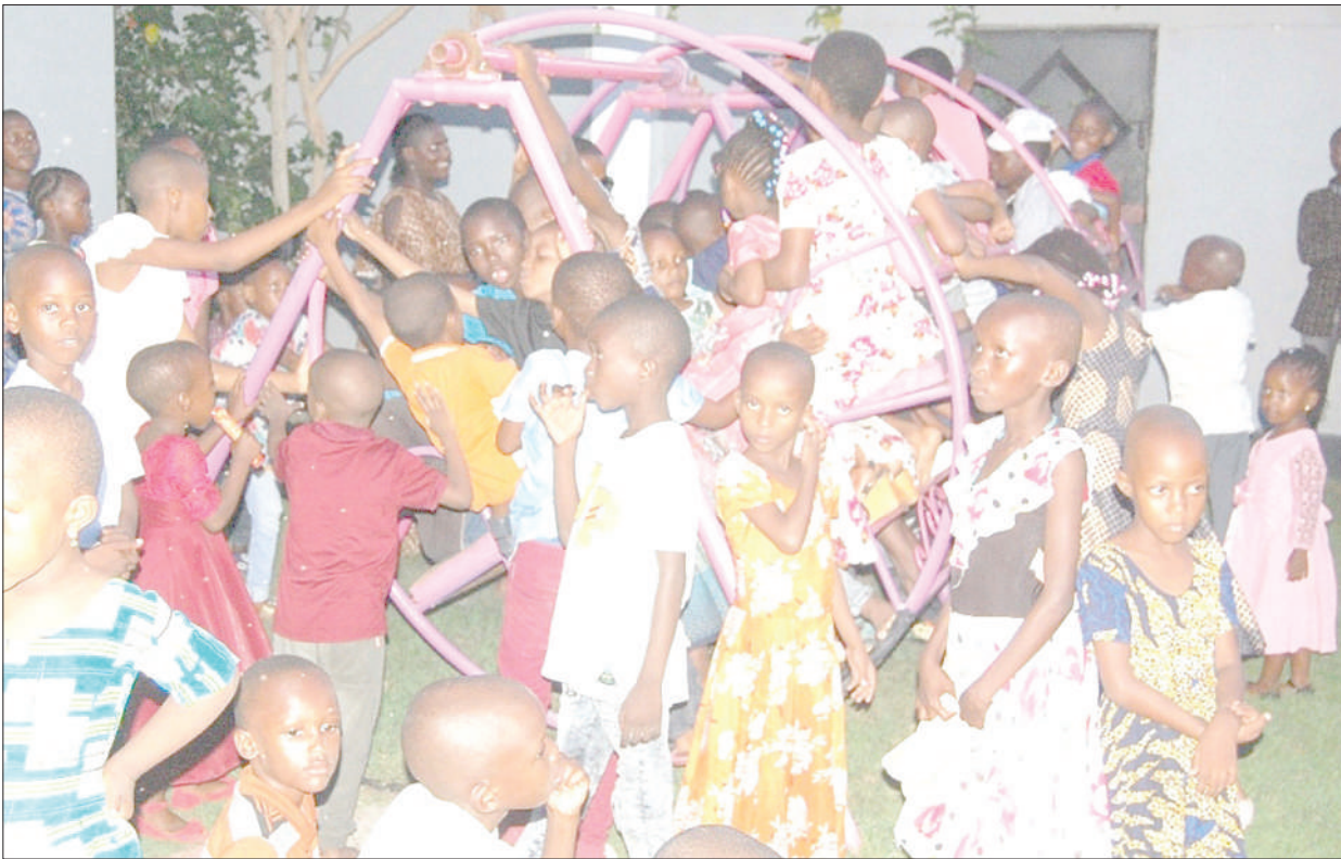
Watoto wakibembea kusherehekea Sikukuu ya Pasaka katika Ukumbi wa Yangeyange Kitunda, Kivule jijini Dar es Salaam juji.