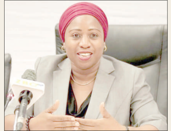
Waziri wa Nchi, Ofisi ya Rais, Tawala za Mikoa na Serikali za Mitaa (TAMISEMI), Ummu Mwalimu.