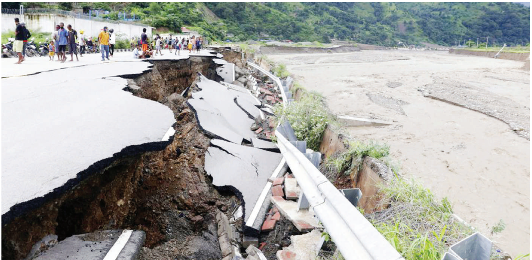
Wakazi wa Kisiwa cha Dili, wakishuhudia athari za mafuriko katika eneo la Mashariki mwa nchi ya Timor na Indonesia mwishoni mwa wiki, kukumbwa na mvua kubwa na kusababisha maporomoko ya udongo, maji kufurika na miundombinu kuharibika, huku watu 101 wakiripotiwa kufa hadi jana. PICHA: AP

Wakazi hao wa Palma walikimbilia mjini Pemba na wengi wao walisema wanaogopa kurejea tena nyumbani. RFI