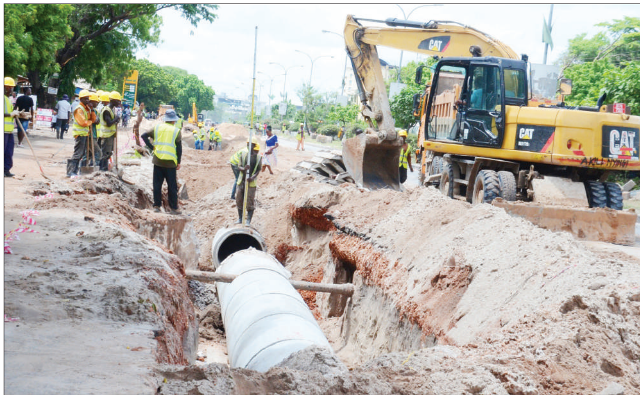
Mafundi wakiendelea na ujenzi wa barabara ya mabasi ya mwendo kasi (BRT phase 2) katika eneo la Ilala, jijini Dar es Salaam jana.

“Kesi ilipofutwa shamba la mpunga ekari 170 zilizokuwa zimepandwa zilikuwa zimeharibika na kusababisha hasara ya zaidi ya Sh. milioni 390 na milioni 70 ilitokana na vifaa walivyokamatwa navyo kuharibika,” alisema.