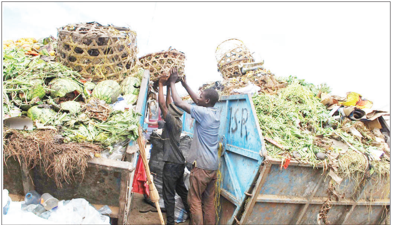
Wabebataka wa Soko la Sabasaba Jiji la Dodoma, wakimwanga taka kwenye makontena yaliyowekwa na Halmashauri ya Jiji jana, kwa ajili ya shughuli hiyo kwa wafanyabiashara na watumiaji wa soko hilo.