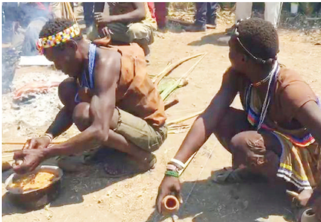
Watu wakiwa katika nyendo za kimila.

wazee kutoka jamii la kabila la Wabukusu waliamua kwenda kuifukua baadhi ya miili ya wapendwa wao na kuizika kwa wanachokiona 'njia inayofaa' kwa katika utamaduni wao.