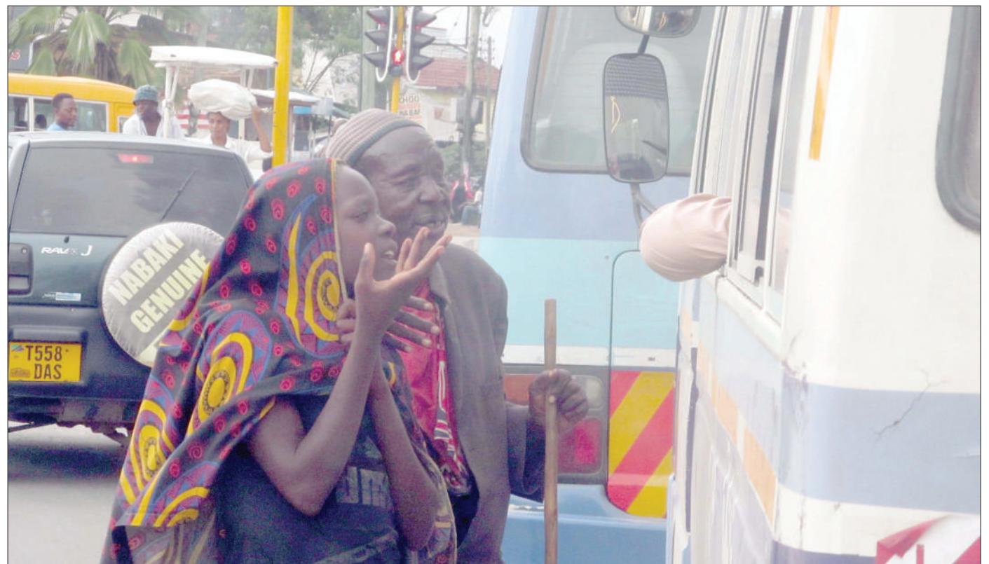
Binti akisaidia mzee mwenye ulemavu wa kuona, kuomba msaada kwa abiria wa daladala, eneo la Mwenge jijini Dar es Salaam juzi. Ingawa kumekuwapo na jitihada za kuwaondoa ombaomba mitaani, bado hazijazaa matunda.

"Muda huo ukifika hatutarajii walio na viwanda kuona kama tunawaonea ndio maana tunaawarifu mwezi mmoja umebaki, matumizi ya mifuko hii, iwe ni wauza miwa, yeyote, wajipange," alisema Dk. Gwamaka.