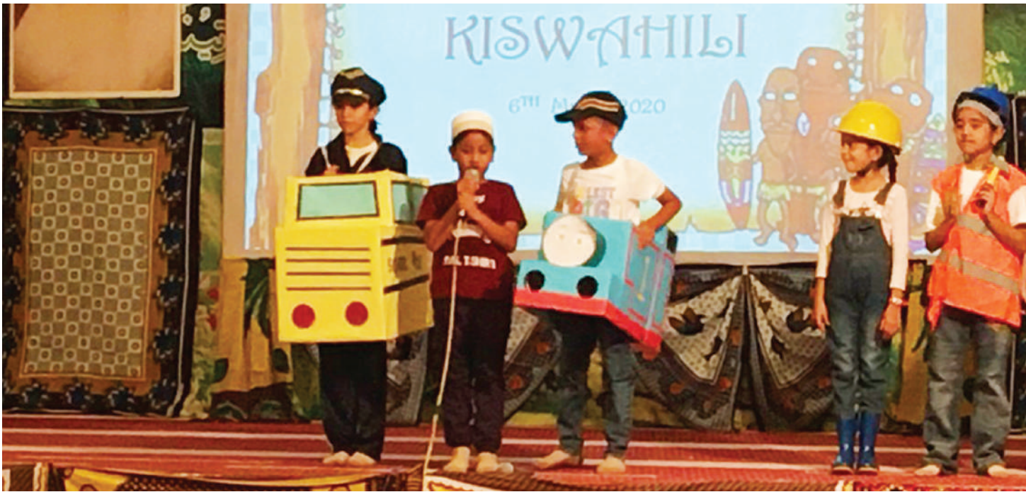
Sehemu ya maudhui ya tamasha linaloendana na kuadhimisha ustawi wa lugha ya Kiswahili.

K UNA sura moja lugha ya Kiswahili, kwamba kwa kiasi kikubwa imekuwa kwa kasi. Pia katika sura ya pili kuna pengo la baadhi ya maeneo yenye hali ya kusuasua, kuwapo mianya ya misamiati.