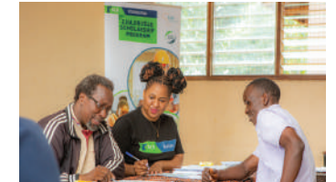
Hivi ndivyo usahili ulivyofanyika jijini Morogoro.