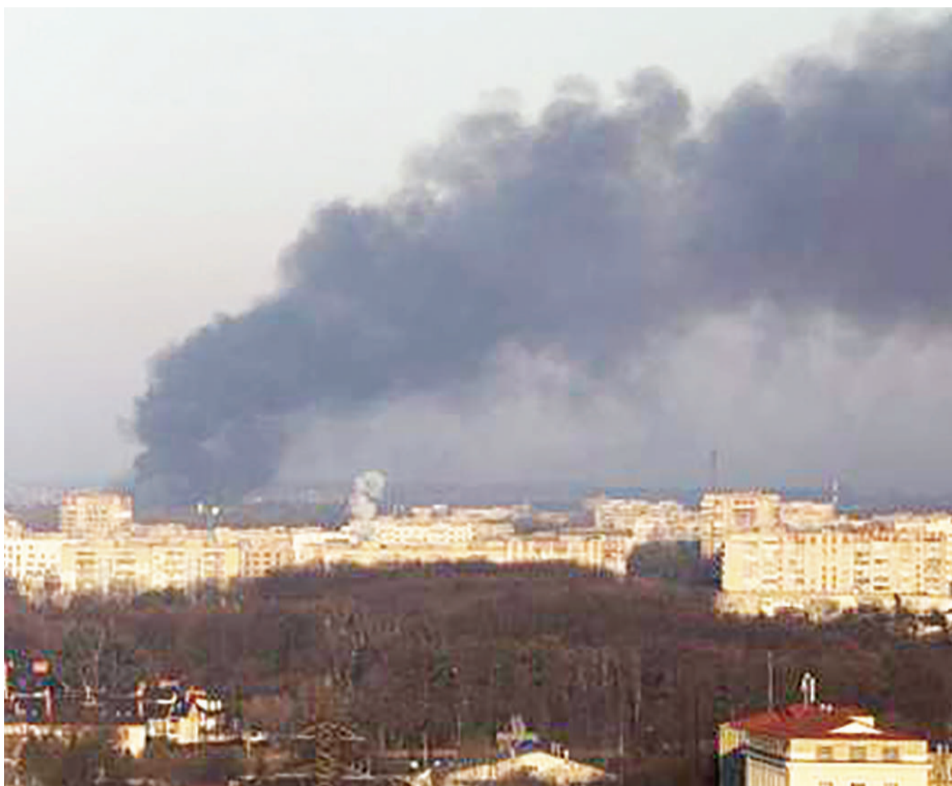
Moshi ukifuka katika kituo cha kijeshi eneo la Lviv nchini Ukraine baada ya kushambuliwa na makombora ya Russia jana.