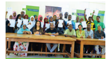
Wanufaika wakiwa na barua za kuchaguliwa rasmi kuanza masomo katika fani ya Ujenzi.