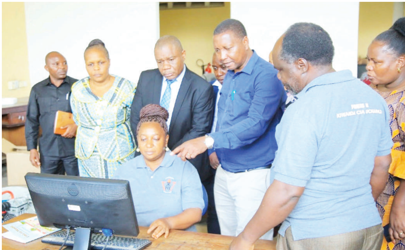
Waziri wa Elimu, Sayansi na Teknolojia, Prof. Adolf Mkenda akiangalia namna uchapishaji wa vitabu vya uono hafifu ukifanyika baada ya kufanya ziara ya kutembelea Kiwanda cha uchapaji wa vitabu cha Press A na Press B jijini Dar es Salaam.

Alisema watoto waliokamatwa karibia wote wana umri ambao waliitakiwa wawe wanasoma shule za msingi ama sekondari lakini wote hawasomi.