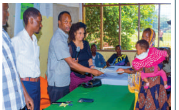
Mmoja wa wanufaika akikabidhiwa barua ya kujungua rasmi katika udhamini wa masomo