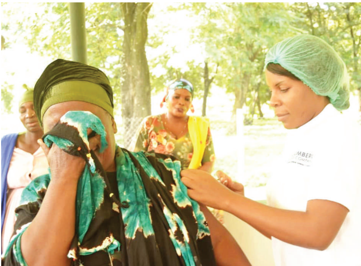
Muuguzi wa Kituo cha Afya cha Kampuni ya Sukari ya Kilombero, akitoa chanjo ya UVIKO-19 kwa mmoja wa wananchi waliojitokeza kupata huduma wakati wa upimaji afya na utoaji chanjo ulioandaliwa na kampuni hiyo katika kuadhimisha Siku ya Wauguzi Duniani, Mei 12, wilayani Kilombero, mkoani Morogoro.

Kituo hicho cha afya hutoa huduma bure kwa wafanyakazi wa kampuni na kutoza gharama ndogo kwa wakazi wanaoishi katika vijiji vina-vyozunguka kiwanda hicho.