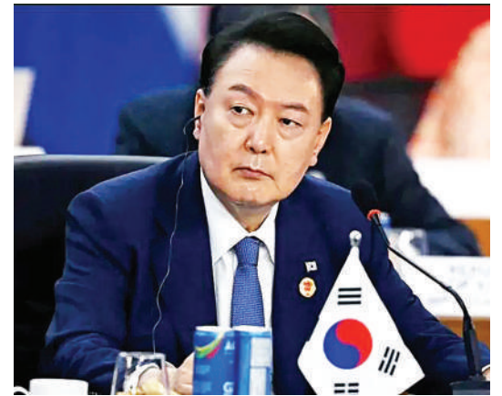
Rais Yoon Suk Yeol

jengo hilo kupitia lango kuu kutokana na walenzi wa rais kuwazuia.