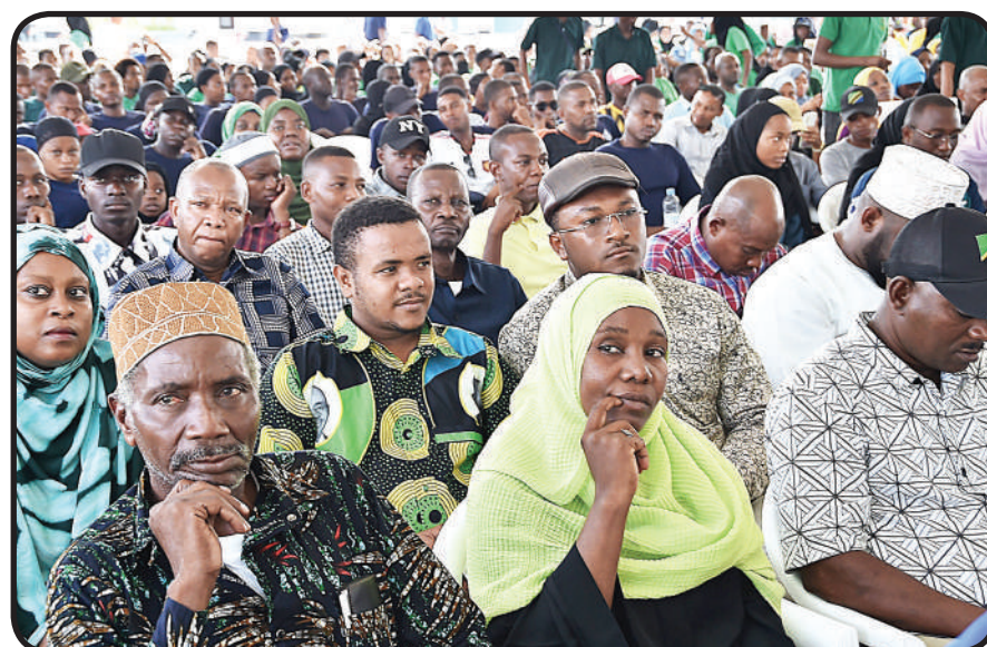
Wananchi wakifuatilia hotuba ya Rais.