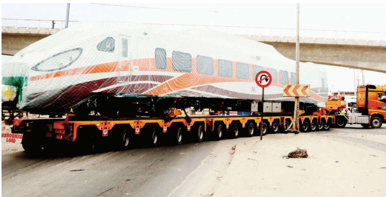
Kichwa cha treni ya mchongoko kikisafirishwa kwenye lori maalum kutoka Bandari ya Dar es Salaam kuelekea Stesheni ya Magufuli, Dar es Salaam jana.