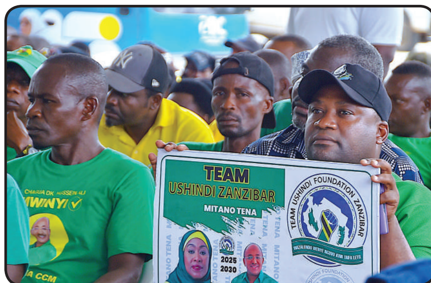
Wananchi wakimsikiliza Rais wakati wa ufunguzi wa kituo hicho.