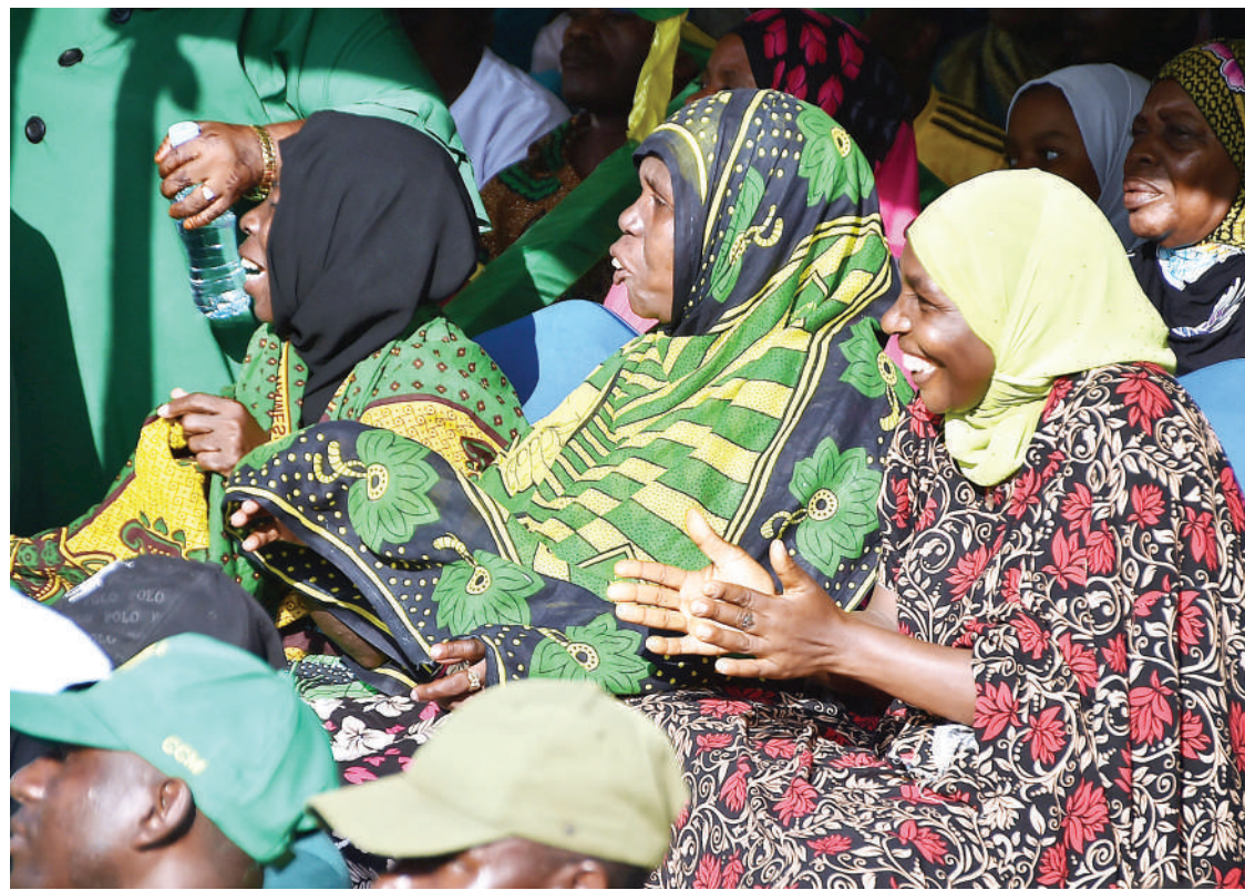
Wananchi wa Mkoa wa Kaskazini Unguja wakimsikiliza Rais wa Zanzibar, Dk. Hussein Ali Mwinyi (hayupo pichani), akizungumza baada ya kuweka jiwe la msingi la mradi wa ujenzi wa nyumba 370 zinazojengwa eneo la Bumbwini Kidazini, Mkoa wa Kaskazini Unguja, ikiwa ni Shmrashamra za Maadhimisho ya Miaka 61 ya Mapinduzi ya Zanzibar.

Hivi sasa Zanzibar inakisiwa kuwa na idadi ya vijana wapato 10,000 wanajihusisha na matumizi ya dawa za kulevya na kusababisha athari kubwa kwao binafasi, familia na jamii kwa jumla.