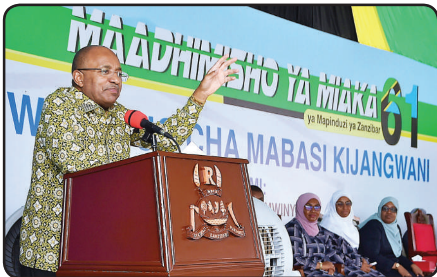
Rais wa Zanzibar, Dk. Hussein Ali Mwinyi, akihutubia katika hafla ya ufunguzi wa kituo cha kisasa cha mabasi Kijangwani Wilaya ya Mjini Unguja jana.