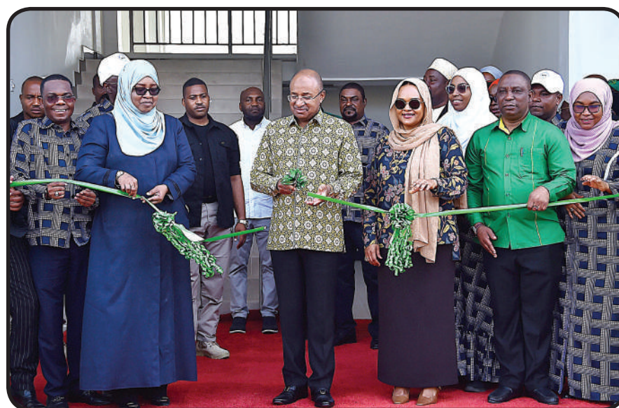
Rais wa Zanzibar, Dk. Hussein Ali Mwinyi, akikata utepe kuzindua kituo hicho, jana mjini Zanzibar.