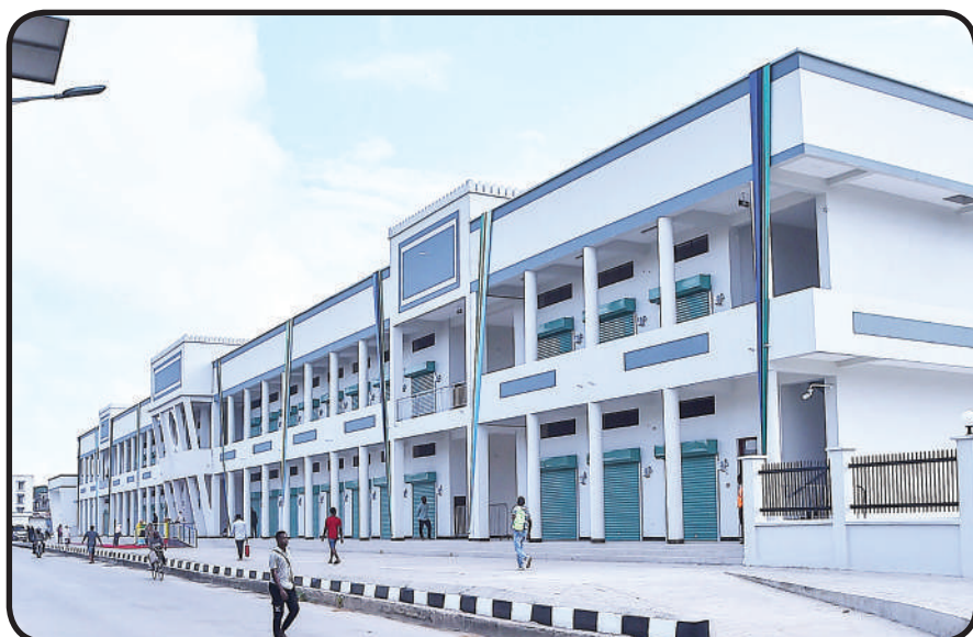
Mwonekano wa jengo la kituo cha kisasa cha mabasi Kijangwani Wilaya ya Mjini Unguja, Zanzibar kilichofunguliwa jana.