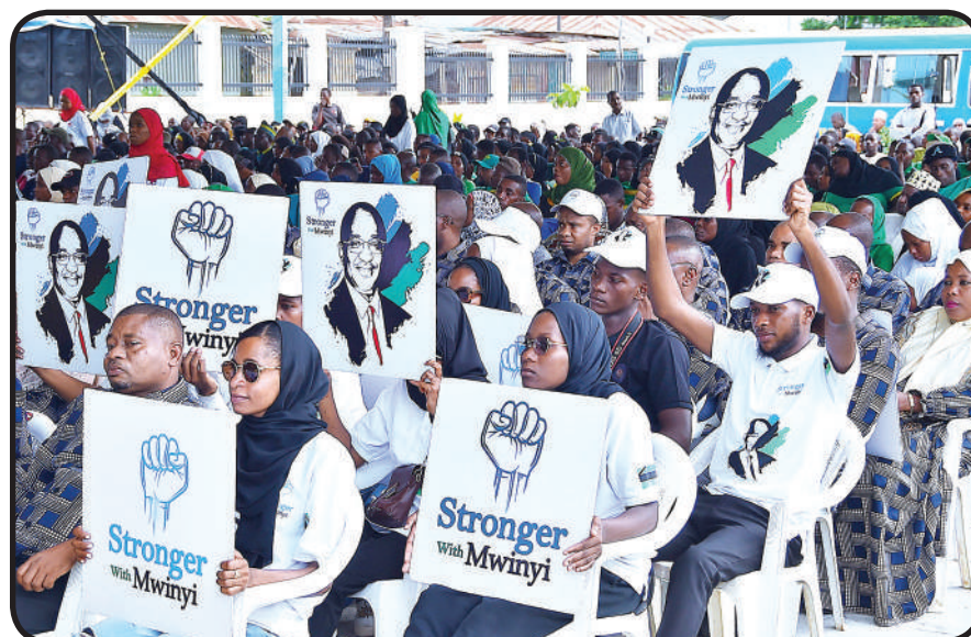
Wananchi wa Mkoa wa Mjini Magharibi Unguja na wageni waalikwa wakiwa na mabango yenye mchoro wa picha ya Rais wa Zanzibar.