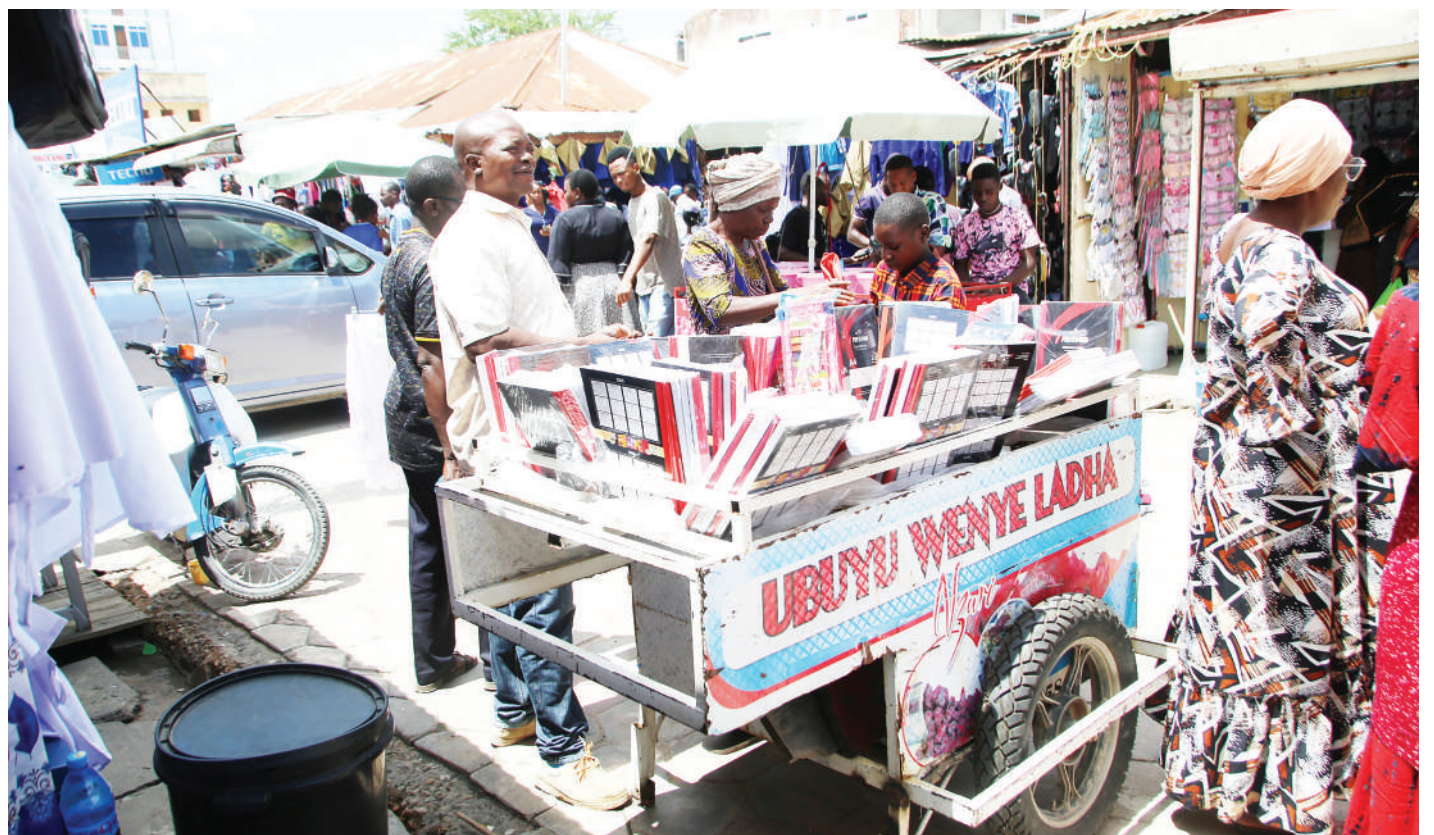
Baadhi ya wazazi na watoto wakinunua madaftari ikiwa ni sehemu ya maandalizi ya kuingia kwenye masomo katika mwaka 2025.