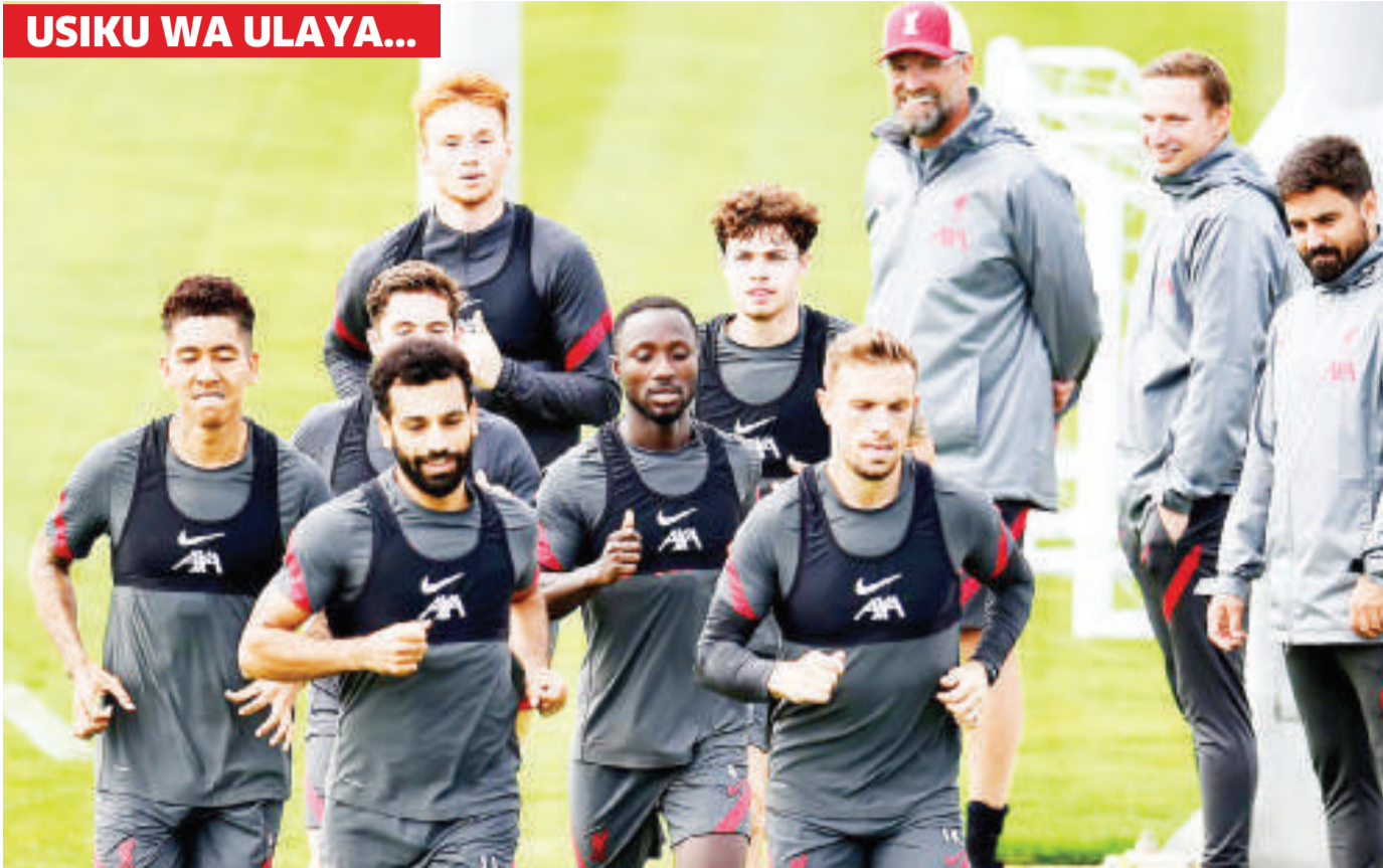
Wachezaji wa Liverpool wakijifua chini ya kocha wao, Jurgen Klopp (aliyevaa kofia), tayari kwa kuivaa Ajax kwenye mechi ya hatua ya makundi ya Ligi ya Mabingwa Ulaya itakayopigwa Amsterdam, Uholanzi leo.