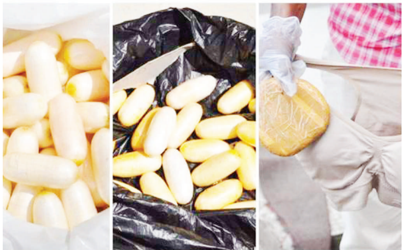
Dawa za kulevya aina ya cocaine zilizokuwa zimefichwa kwenye mabegi na nguo za ndani. Polisi nchini Ethiopia, inawashikilia raia wa kigeni 13 wa Nigeria na mmoja wa Brazil, baada ya kukamatwa kwenye uwanja wa ndege mjini Addis Ababa.

"Ndio, ni watu kutoka hapa, kutoka kijiji hiki. Mvulana aliyepoteza maisha hapa, baba yake bado yuko hapa." RFI