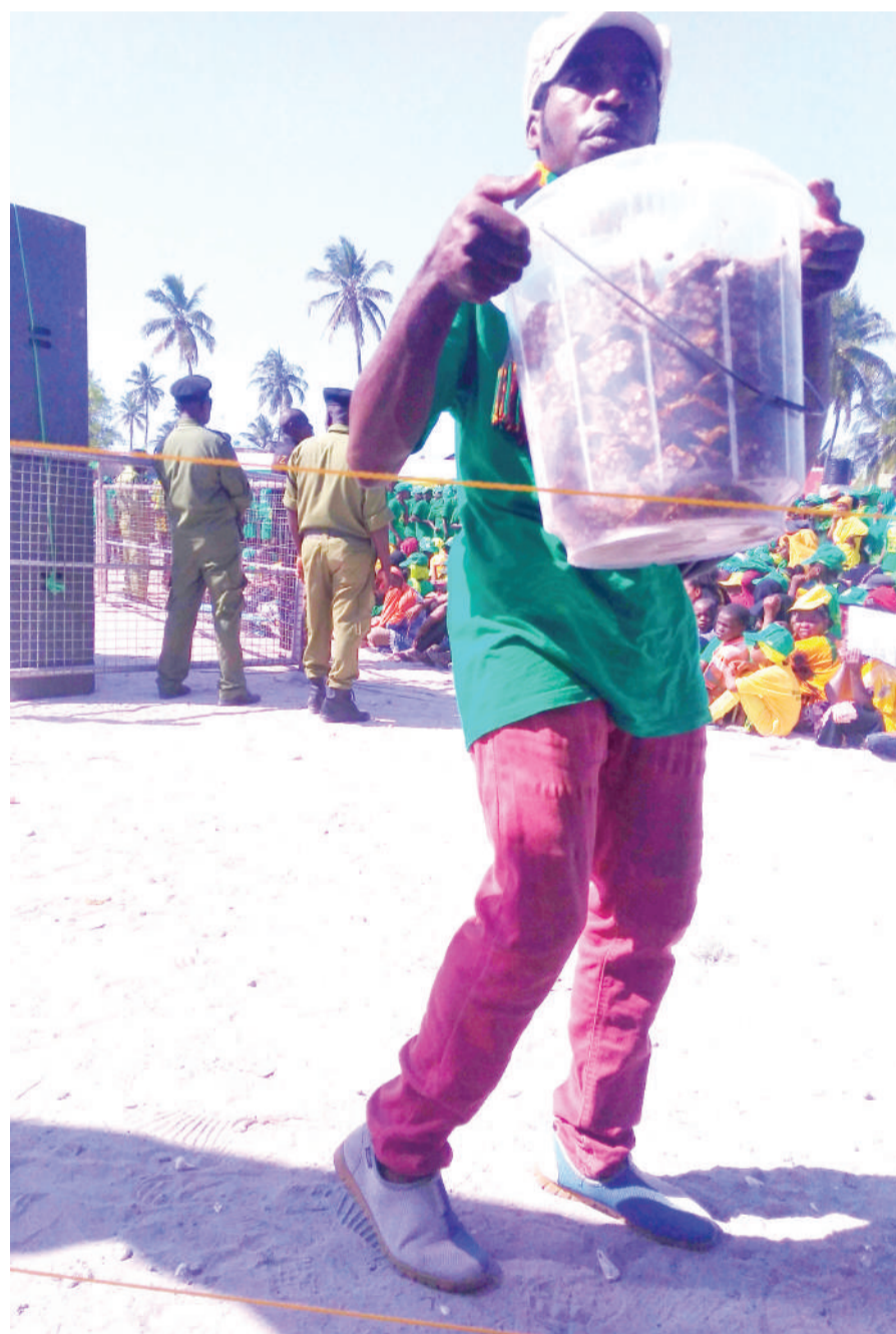
Kijana mchuuzi wa kashata akitumia mkusanyiko wa watu katika mkutano wa kampeni wa CCM, eneo la Paje, Mkoa wa Kusini Unguja jana, kama fursa ya kufanya biashara yake.

Kuna uchakavu wa majengo ya shule na uhaba wa walimu katika Mkoa wa Kusini Unguja, hivyo akiwa Rais atawekeza katika elimu ili wananchi kupata elimu bora.