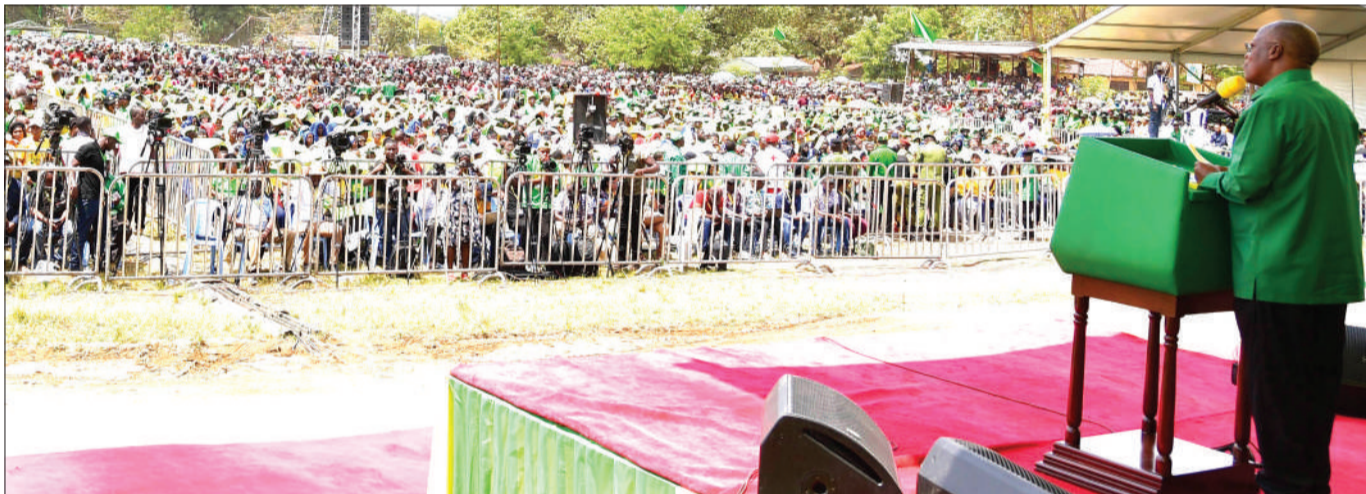
Mgombea urais kupitia CCM, Dk. John Magufuli akizungumza na wananchi katika mkutano wa kampeni kwenye viwanja vya Chuo cha Ualimu Korogwe, mkoani Tanga jana.

Uchaguzi wa Rais, wabunge na madiwani umepangwa kufanyika Oktoba 28 mwaka huu, ikiwa ni mara ya kwanza kufanyika siku ya kazi. Tayari serikali imesema siku hiyo itakuwa ya mapumziko ili wananchi wapate haki ya kuchagua viongozi wanaowataka.