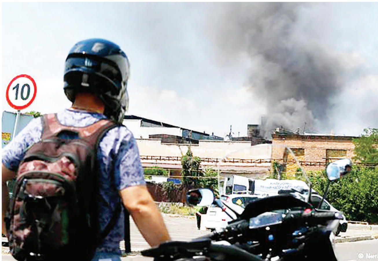
Mwendesha pikipiki raia wa Ukraine, akiwa anaangalia wingu la moshi unaotokana na mlipuko wa kombora katika Bandari ya Odesa juzi.

Makubaliano hayo yanaweza kupitiwa upya iki-wa pande zote mbili zitakubali. BBC