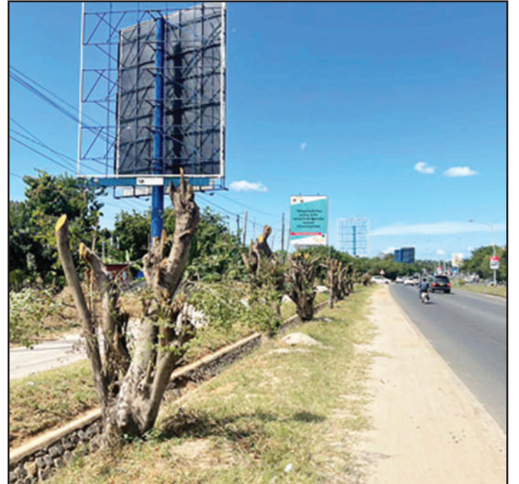
Hali ya miti kabla na baada ya kukatwa ili kupisha matangazo katika Barabara ya Ali Hassan Mwinyi, jijini Dar es Salaam.