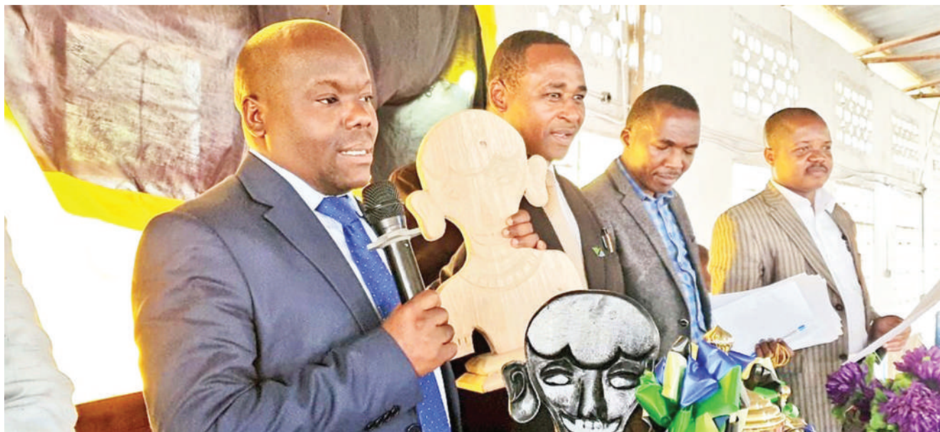
Mkuu wa Mkoa wa Mbeya, Juma Homera akiwa ameshika vinyago ambavyo vimeandaliwa kwa ajili ya kutolewa kama adhabu kwa halmashauri na kata ambazo zinashika nafasi za mwisho kwenye matokeo ya mitihani ya kitaifa, vinyago hivyo vilizinduliwa juu wakati wa utoaji wa tuzo mbalimbali za elimu kwa halmashauri, shule na walimu.

Aliwataka wadau mbalimbali wa elimu ndani ya mkoa huo kuendelea kushirikiana ili kufikia malengo ya juu zaidi kwenye elimu huku akiahidi kutoa zawadi ya Sh. 500,000 kwa shule 10 zitakazofanya vizuri mwakani na tano kati yake zitakuwa za msingi na zingine tano za sekondari.