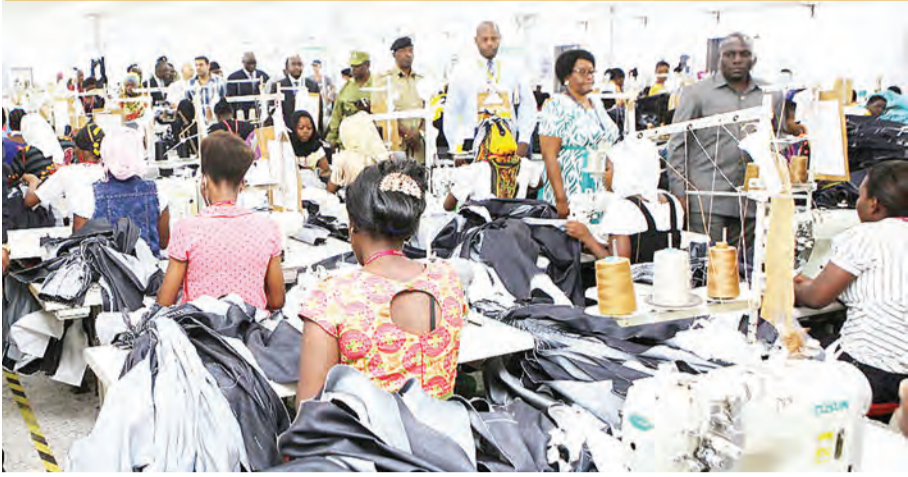
Mwajiri bora alivyo na anavyojihadhari dhidi ya sumu tano za mtumishi kazini