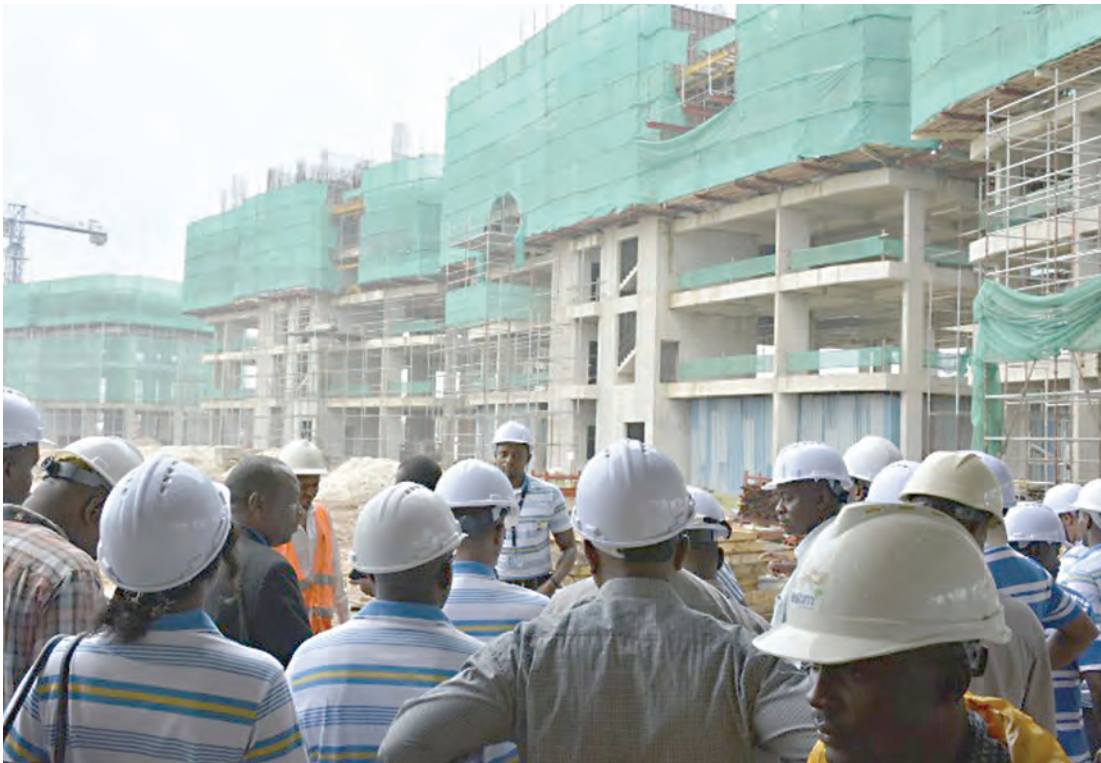
Sehemu ya majengo ya mradi wa mji mpya wa Kawe, Manispaa ya Kinondoni, mkoani Dar es Salaam.

“Ni ukweli usiofichika kipindi fulani miradi kama Morocco Square na ule wa Kawe 711 ilitetereka kwa mtindo wa pre-sell, watu wanaojitokeza kununua nyumba kabla haijakamilika, walipungua kwa sababu ulikuwa utamaduni mpya kwa Watanzania, huo ndio ukweli.