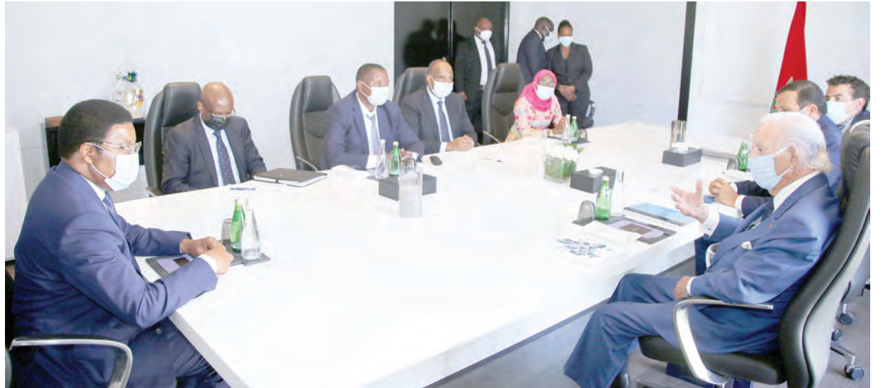
Waziri Mkuu, Kassim Majaliwa, akizungumza na Rais wa Benki ya Afrika, Othman Benjelloun (kulia), kwenye hoteli ya Sofitel jijini Rabat, nchini Morocco, juzi. Habari Uk. 8.