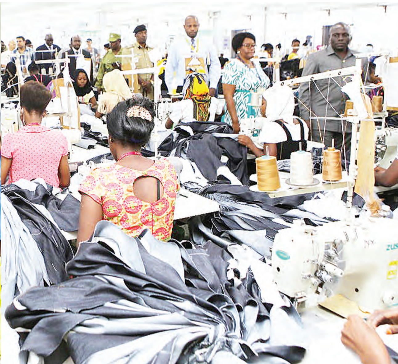
Namna ilivyo watumishi wakiwajibika katika sehemu za kazi.

ya kazi, kwa mfanyakazi badala ya kujenga nyendo ya kujitahidi kusaka majibu yenye ufumbuzi katika mazingira yake binafsi na yanayomzunguka, anaisukuma katika kulalamika.