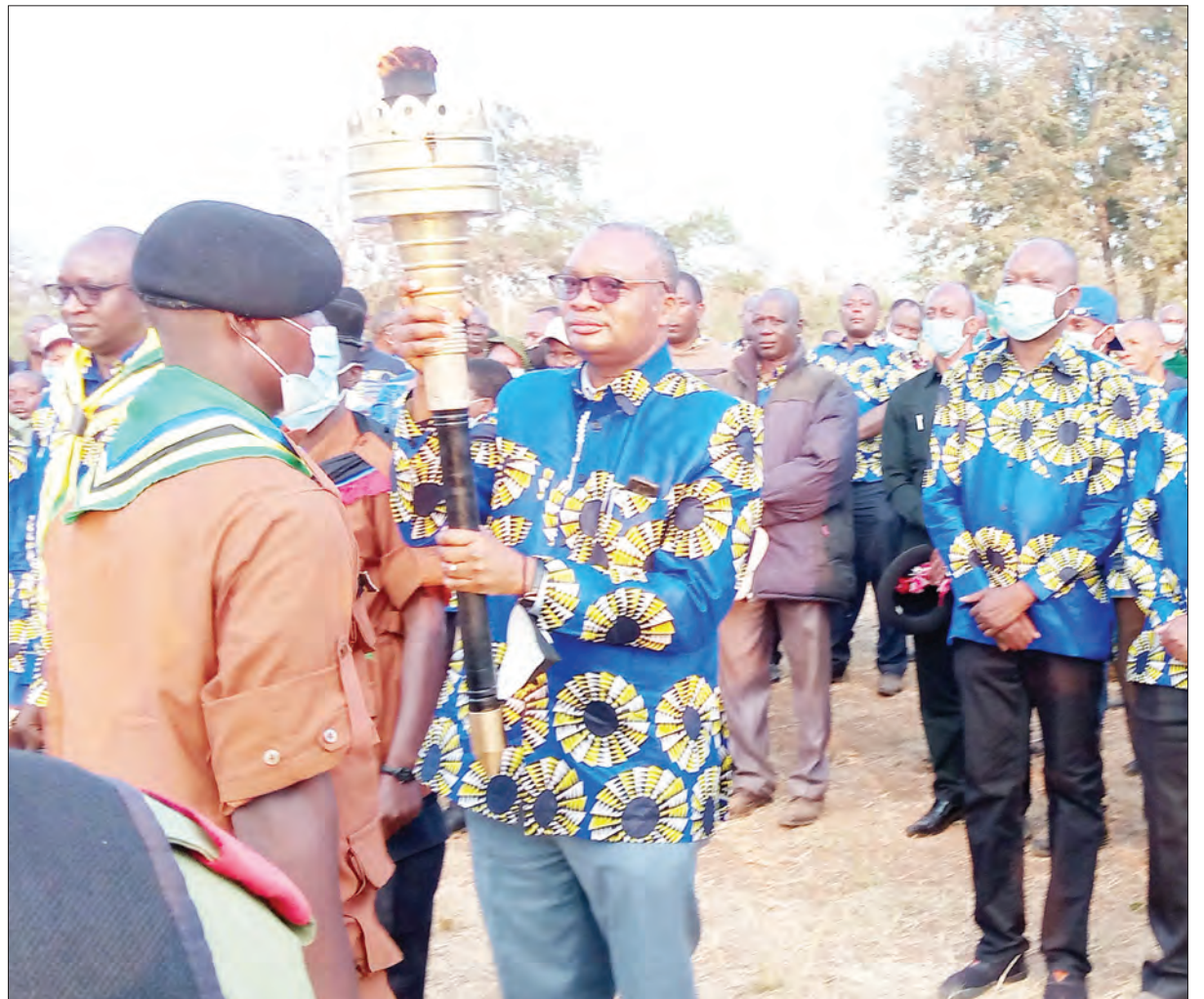
Mmoja wa wakimbiza Mwenge wa Uhuru Kitaifa akiukabidhi kwa Waziri wa Ulinzi na Jeshi la Kujenga Taifa ambaye ni Mbunge wa Jimbo la Ushetu, Elias Kwandikwa, wakati wa makabidhiano baina ya mkoa wa Shinyanga na Tabora, katika Kata ya Kashishi, wilayani Kaliua, mkoani Tabora juzi.