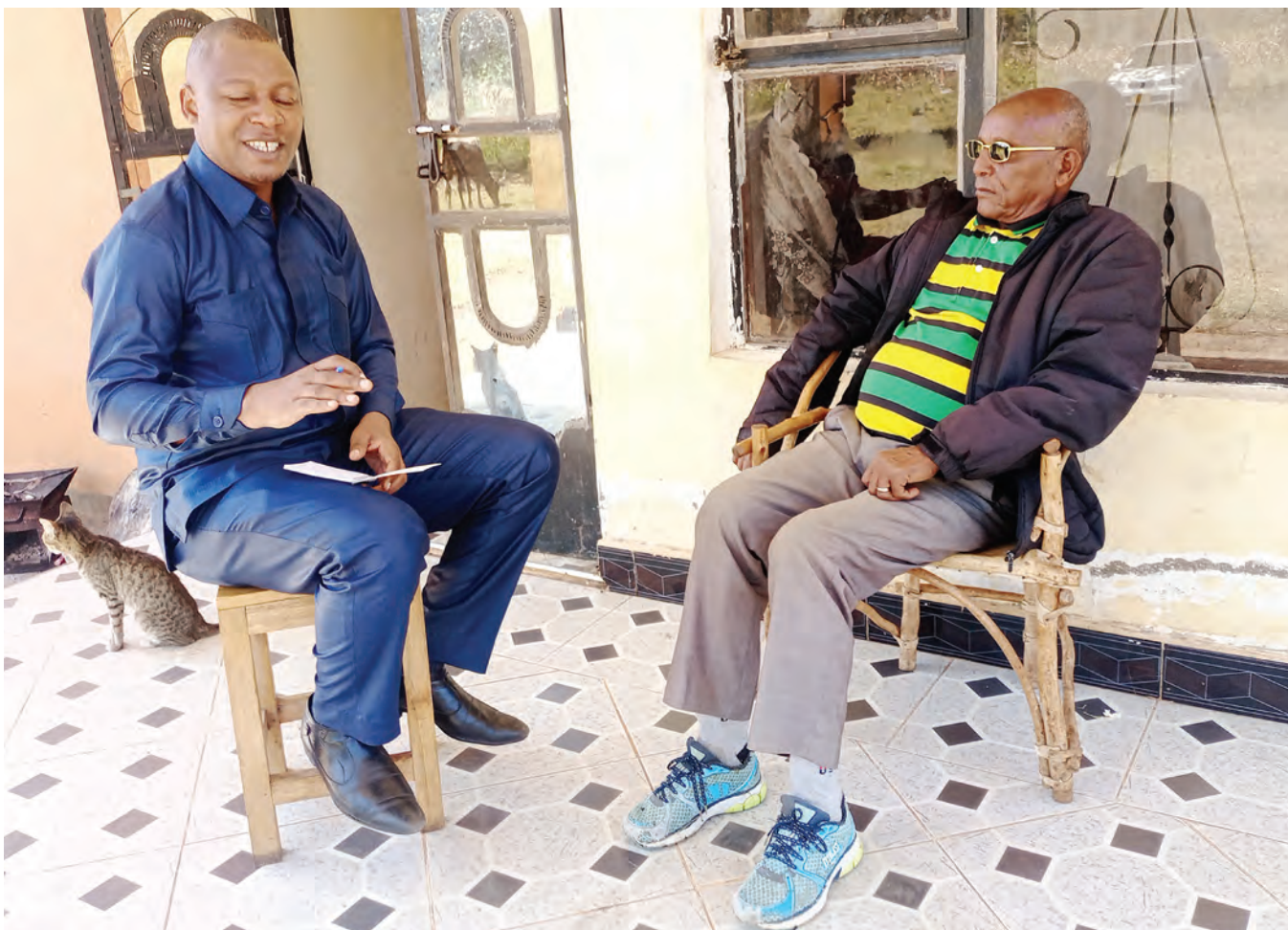
Mwanariadha John Stephen Akhwari akifanya mahojiano na mwandishi wa gazeti hili.