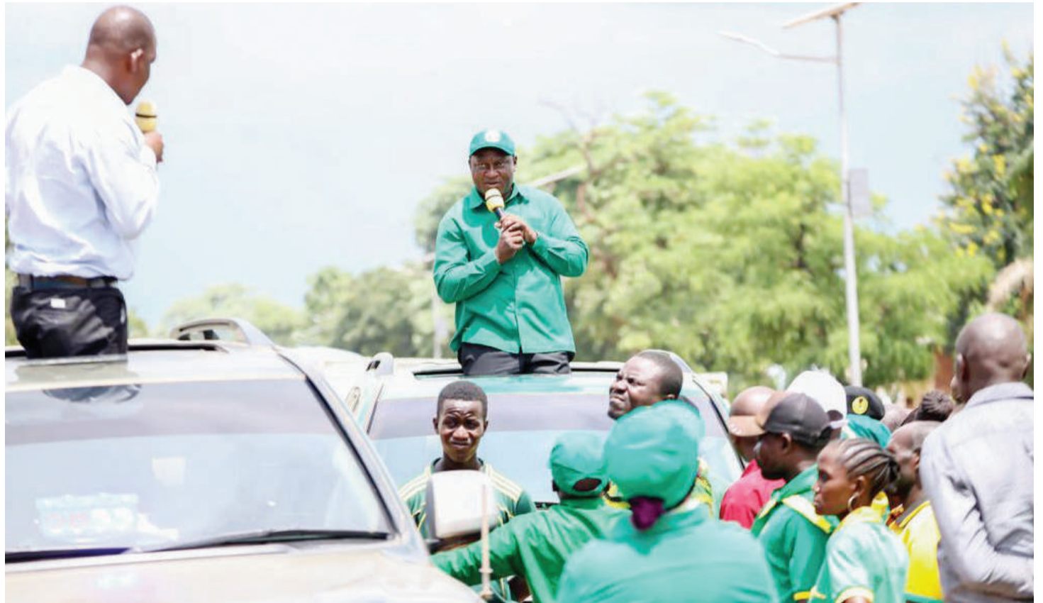
Katibu Mkuu, Daniel Chongolo, akisikiliza na kutafutia majibu kero za maji wakati wa ziara yake Morogoro.

Anaeleza kuwa fedha zilishatengwa na kuwaonya wasimamizi watakao kaidi maelekezo hayo ya chama.