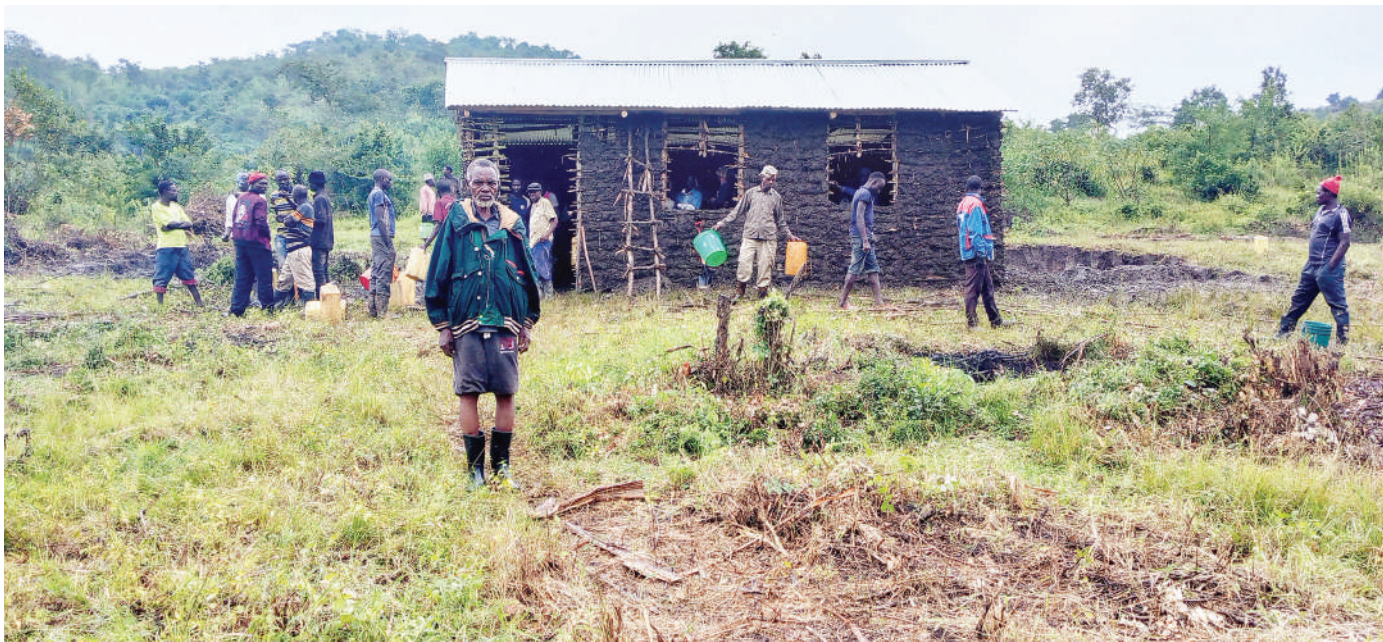
Baadhi ya wakulima na wafugaji wakishiriki kwenye ujenzi wa chumba kimoja cha darasa la wanafunzi wa shule ya awali kwenye Kijiji cha Kashanda, kata ya Nyakahanga, wilayani Karagwe, mkoani Kagera hivi karibuni.