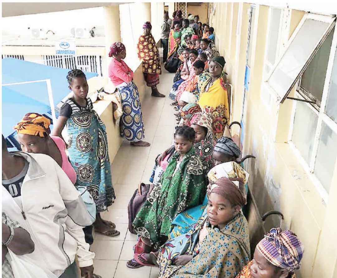
Huduma kama matibabu ni kitendawili kigumu, vyama pinzani visaidie mikakati na mbinu za kubadilisha hali duni kuwa bora.

Wakati Tanganyika au Tanzania Bara, inapata Uhuru Desemba 9, 1961 kilikuwepo Chama cha Tanganyika African National Union (TANU), wakati huo Zanzibar ilikuwapo