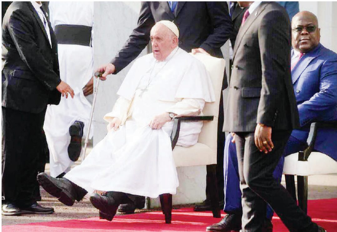
Papa Francis alipotua DRC wiki iliyopita kuhimiza amani na kuacha vita vinavyoua maelfu ya watu.

Baada ya ziara ya mafanikio nchini DRC, Papa anawasili Juba, Sudan Kusini na kulakiwa na