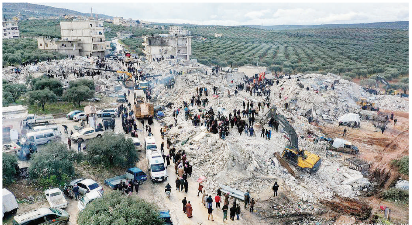
Mwonekano wa vifusi vya nyumba zilizoporomoka baada ya kukumbwa na tetemeko la ardhi nchini Uturuki juzi.