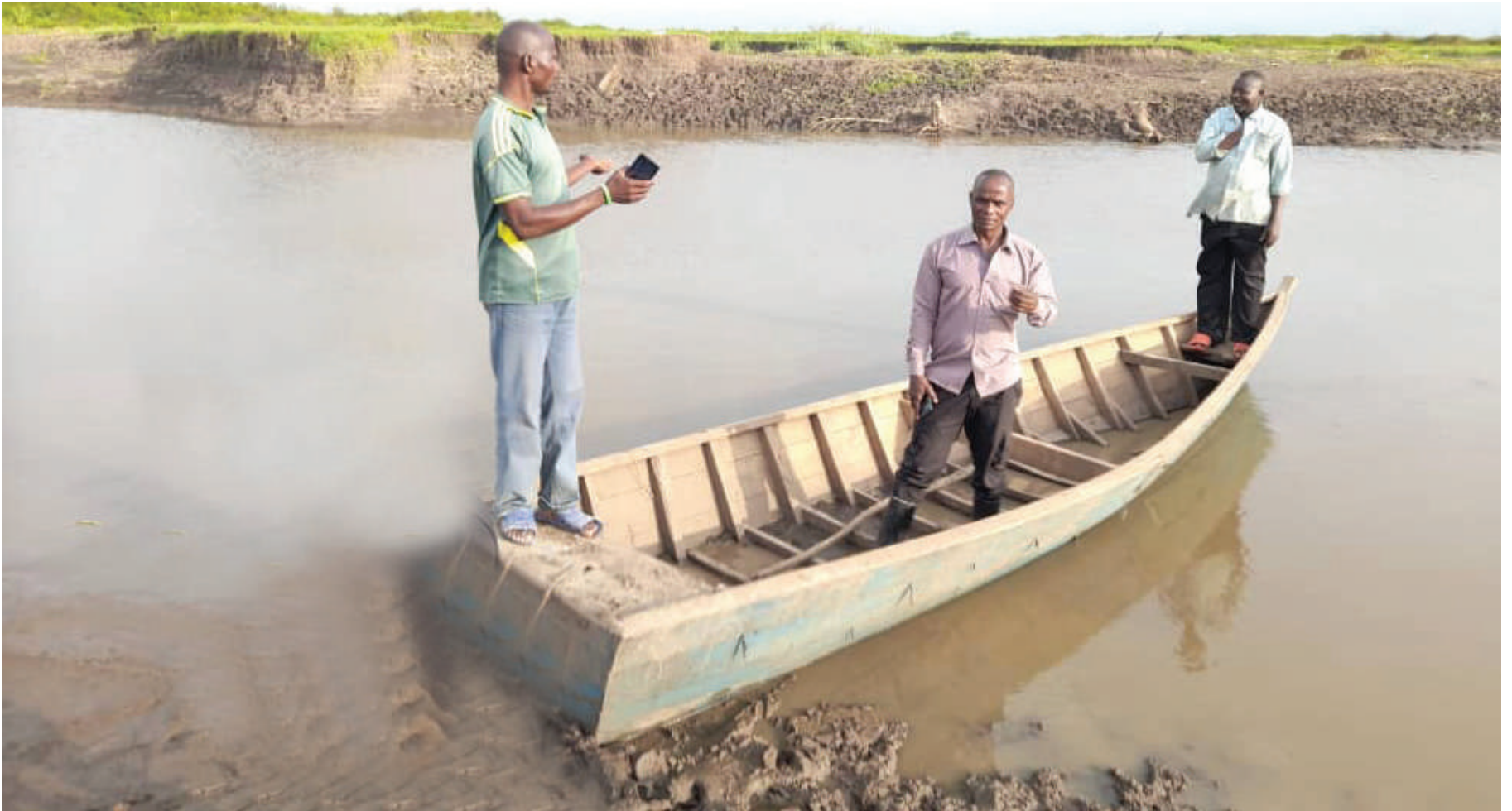
Sehemu ya Mto Mara wilayani Tarime ambayo mwanzoni mwa mwezi huu maji yake yalichafuliwa.

● MAGONJWA YASIYOELEWEKA, MIFUGO NA SAMAKI WAFA