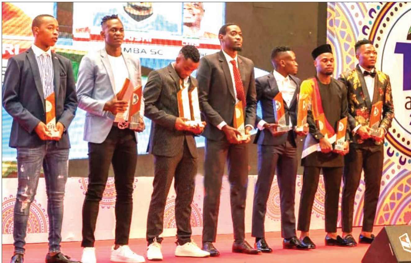
Baadhi ya wachezaji waliounda kikosi bora cha Ligi Kuu Tanzania Bara msimu uliopita wa mwaka 2020/2021. Kutoka kushoto ni Feisal Salum, Mukoko Tonombe, Dickson Job, John Bocco, Mohammed Hussein 'Zimbwe Jr', Shomari Kapombe na Aishi Manula.

Mechi nyingine ya Ligi Kuu Tanzania Bara itakayochezwa leo kwenye Uwanja wa Shule ya Sekondari Nyanakumu itakuwa ni kati ya wenyeji Geita Gold FC dhidi ya Mbeya City kutoka jijini Mbeya.