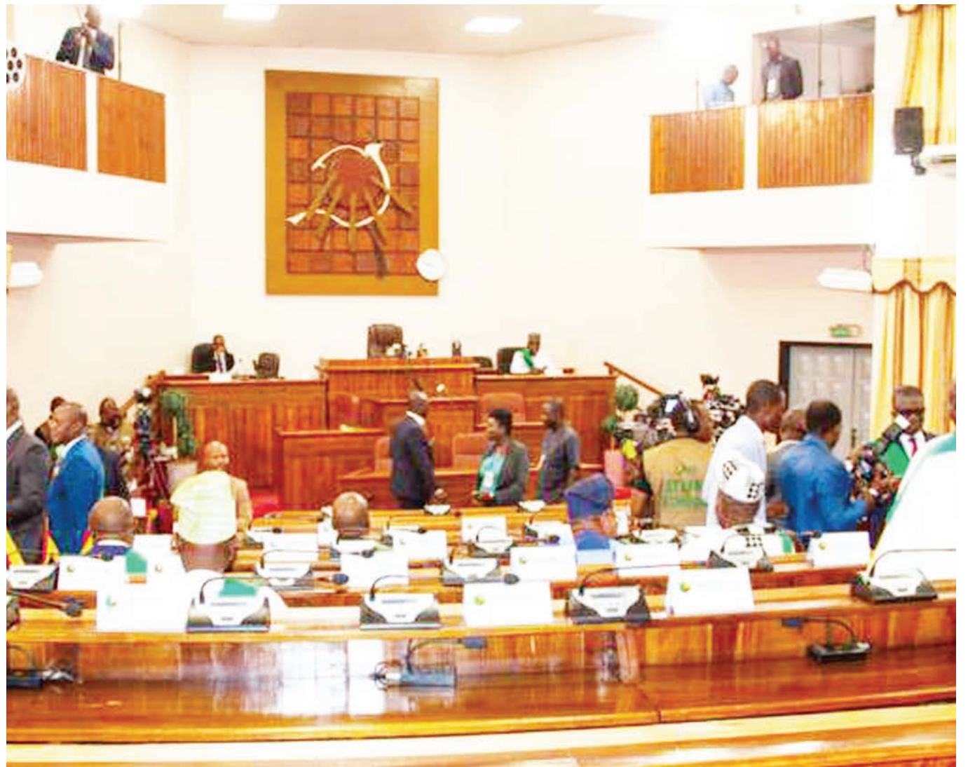
Wabunge nchini Benin wakiwa bungeni wakati wa upigaji kura kuhalalisha utoaji mimba.