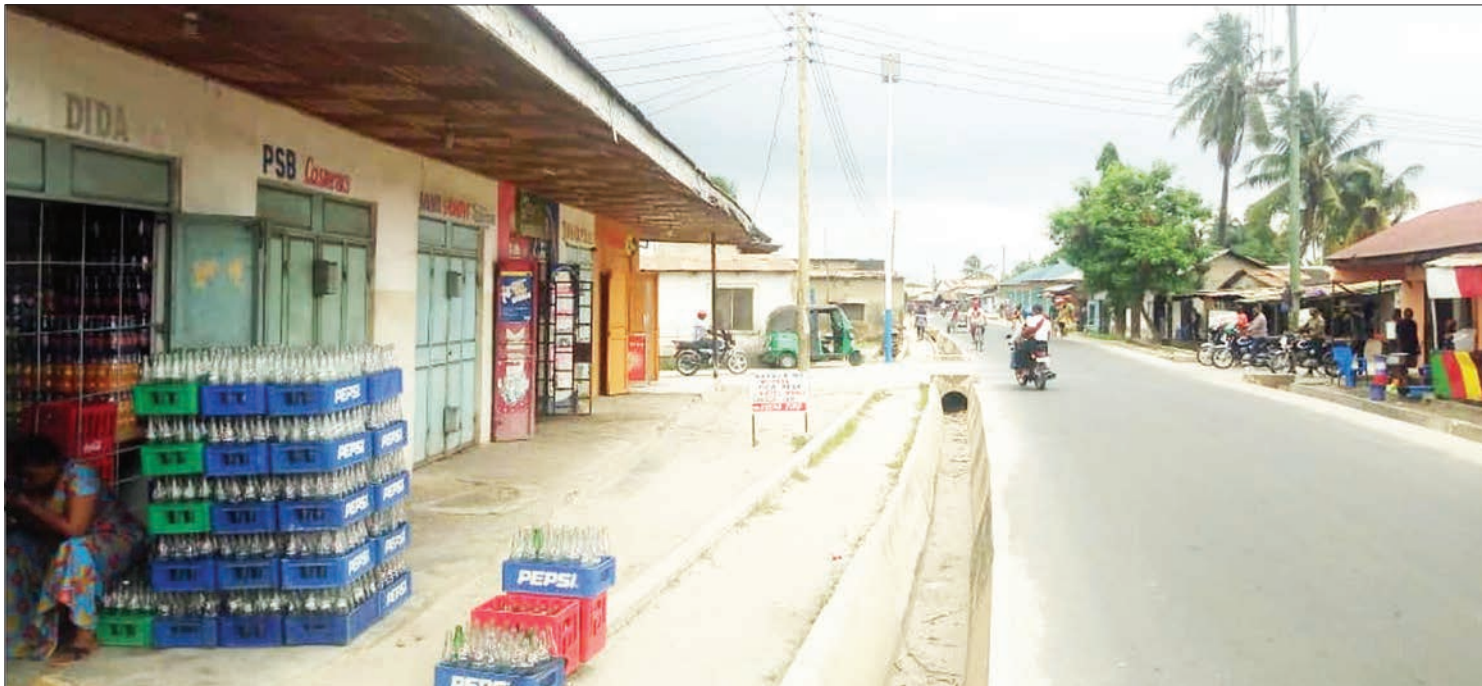
Sehemu ya mitaa ya Yombo Buza, Dar es Salaam, ikiwa katika maendeleo, miongo minne iliyopita ilikuwa pori.

mitaa marufu unaoitwa 'Maandazi Road' zao la foleni ndefu ya vibatari vya wauiza maandazi mahali hapo usiku, hata pakajijengea umaarufu na leo ni jina rasmi, sasa ikitimu zaidi ya miaka 40.