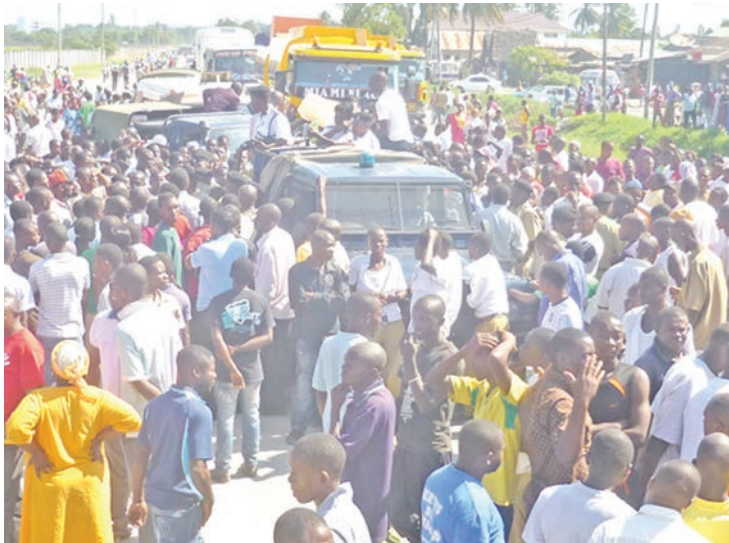
Eneo kongwe la Majumba Sita, kipande cha Ukonga ambacho kimedumu kuwa mjini miaka mingi.

Mara moja kwa jumla, mahali hapo pakawa maarufu, ikaongezwa na mabasi mapya aina ya Ikarus yenye tela, kama ya sasa kwenye Mwendokasi, kukapafanya hapo mahali pa kugeuzia.