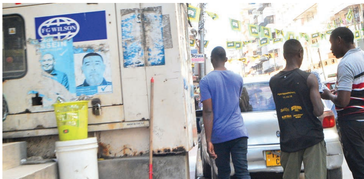
Wananchi wakipita kwa shida kutokana na jenereta kubwa lililowekwa katikati ya njia ya waenda kwa miguu katika Mtaa wa Livingstone na Mchikichini, jijini Dar es Salaam jana.

Kesi hiyo imeahirishwa hadi Novemba 4, mwaka huu, kwa ajili ya kutajwa. Mshtakiwa amerejeshwa mahabusu.