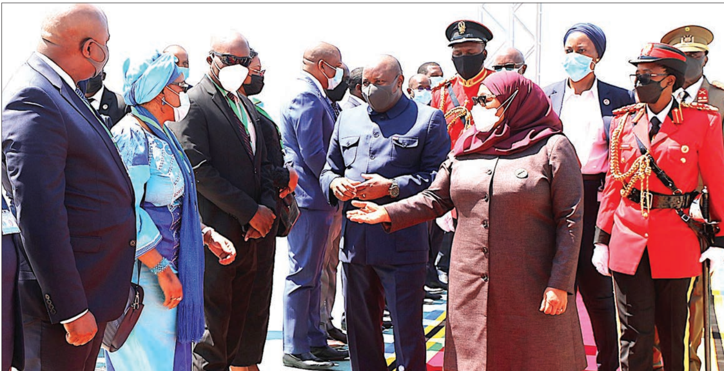
Rais wa Samia Suluhu Hassan, akimtambulisha mgeni wake, Rais wa Jamhuri ya Burundi, Évariste Ndayishimiye kwa viongozi mbalimbali wa Serikali, baada ya kuwasili katika viwanja vya Ikulu Chamwino, mkoani Dodoma jana.

DAWA ya meno nayo yahusishwa iwapo... Endelea ukurasa 2