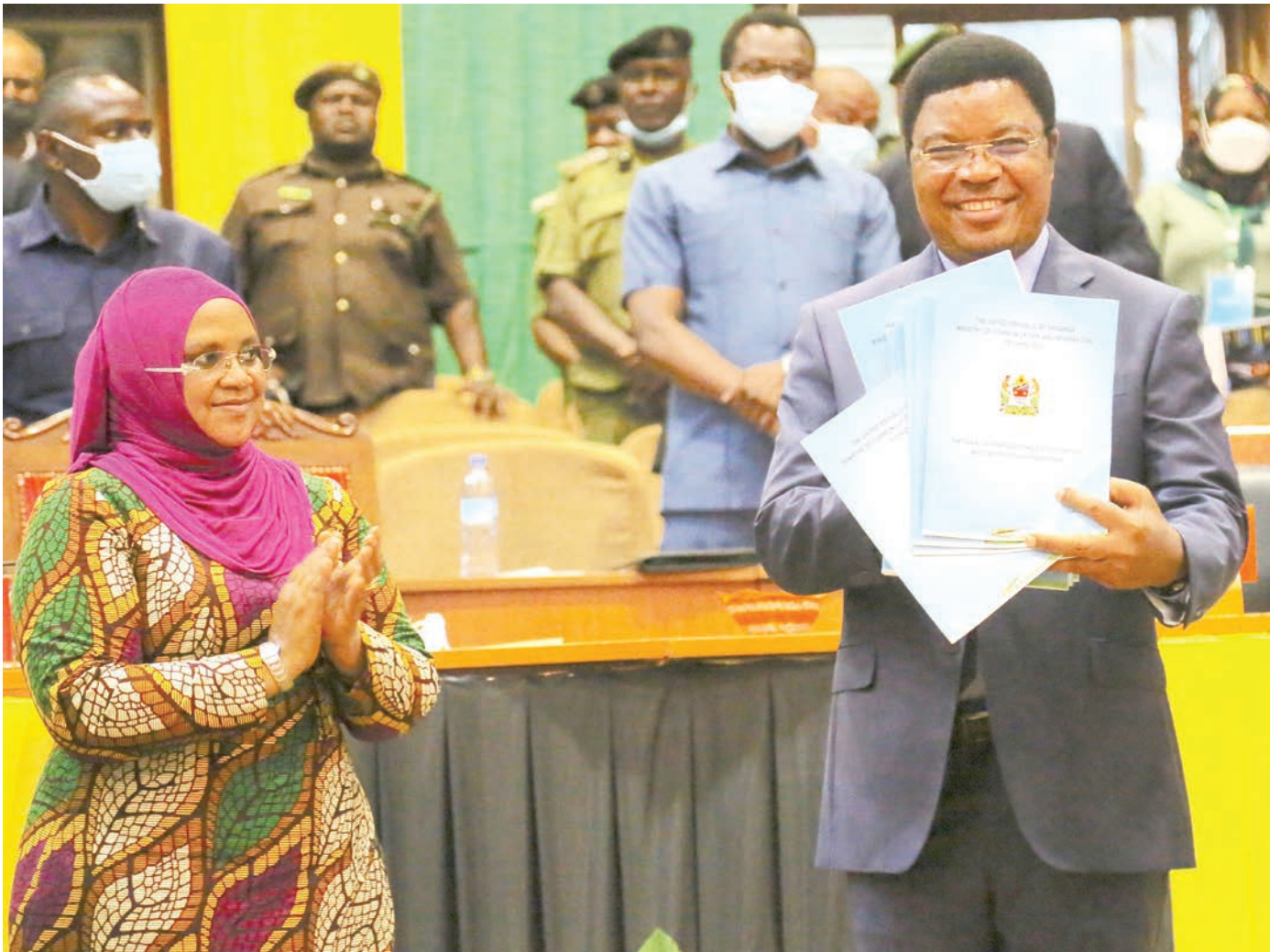
Waziri Mkuu Kassim Majaliwa akionyesha nakala za mwongozo wa usajili wa wataalamu wa TEHAMA baada ya kuuzindua, katika Mkutano wa Tano wa Mwaka wa TEHAMA Tanzania, jijini Arusha, jana. Kushoto ni Waziri wa Habari, Mawasiliano na Teknolojia ya Habari, Dk. Ashatu Kijaji.