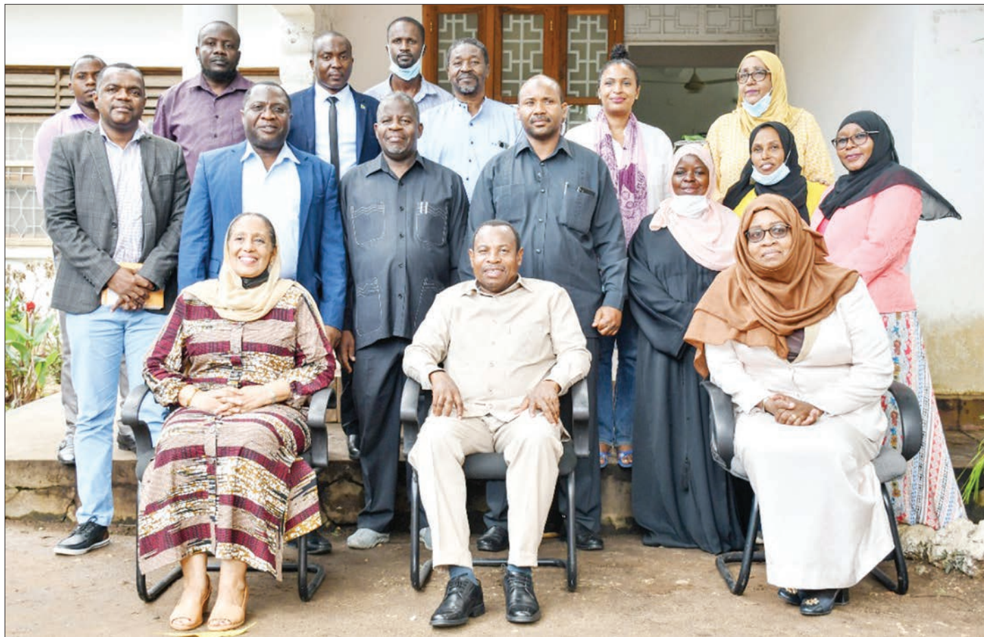
Makamu wa Kwanza wa Rais Zanzibar, Othman Masoud (katikati aliyekaa) akiwa katika picha ya pamoja na viongozi wa jumuiya ya kupambana na dawa za kulevya na UKIMWI (ZAYADESA), alipoitembelea jumuiya hiyo, Mazizini Mjini Unguja jana.

Alisema uwazi aliouweka Rais wa Zanzibar, Dk. Hussein Ali Mwinyi, wa kulipiga vita suala la udhalilishaji, uimesaidia jamii kupata uelewa na mwamko wa kwenda kuripoti kesi hizo katika vyombo vya sheria.