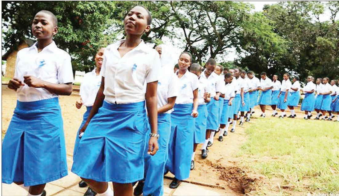
Wasichana, kundi linalohitaji uangalizi maalum kufikia malengo yao, ikiwamo jamii kuwalinda kimasomo. Pichani, wakiwa katika nyendo tofauti zinazoendana na maisha yao ya shule.