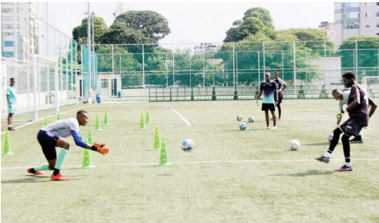
Vijana wanaolelewa katika kituo cha michezo cha Jakaya Kikwete jijini Dar es Salaam wakifanya mazoezi kwenye uwanja huo jana.

“Tunaomba Serikali kutuachia eneo hili, michezo ni afya na inaleta umoja viongozi wetu tunawaomba sana,” alisema Muhunzi.