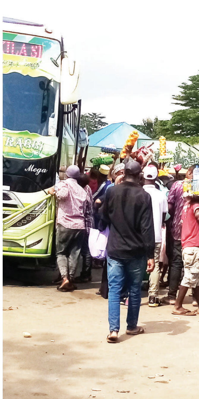
Abiria wakisongwa na wafanyabiashara wadogo wakati wa kupanda basi katika stendi kuu ya mabasi wilayani Muheza mkoani Tanga, kitu ambacho ni kero kwa abiria.

“Wamo vilevile wanafunzi wa vyuo vikuu, ambapo kwa Kilimanjaro, tuna vyuo kama Chuo Kikuu Kishiriki cha Tumaini cha Sayansi ya Tiba na Uguzi cha KCMC, Chuo Kikuu cha Ushirika Moshi (MoCU), Chuo Kikuu cha Kikatoliki Mwenge (MWECAU), Chuo Kikuu cha Kumbukumbu ya Stephano Moshi (SMUCo) na Chuo Kikuu Huria cha Tanzania (OUT).