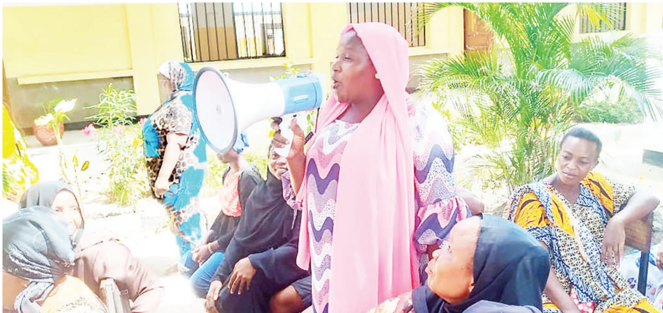
Mmoja wa wazazi wa mwanafunzi wa Shule ya Sekondari Urafiki Dar es Salaam, akichangia mada katika kikao cha kujadili malezi bora na namna ya kupambana na rushwa ya ngono, ukatili wa kijinsia na ndoa za utotoni. Kikao hicho kiliandaliwa na Shirika la Usawa wa Kijinsia Tanzania (SUKITA) juzi.