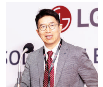
video kwa ujumla wake ikiwamo kwenye mahoteli ukanda mzima wa eneo hili la Afrika Mashariki," alisema.

"Hiki ni kitengo maalum ambacho kinashughulikia bidhaa kama vile skrini za kidijitali, OLED, miundombinu za kuonyesha sinema kwa njia za