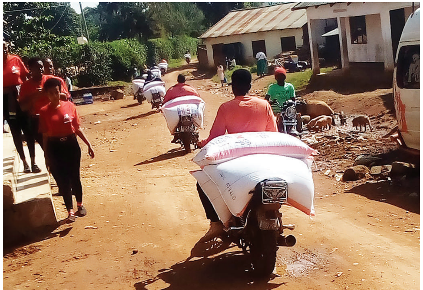
Madereva bodaboda wa Tarafa ya Sirari mkoani Mara wakisafirisha mahindi ya wafanyabiashara yaliyozuiwa mpakani mwa Tanzania kuingia nchini Kenya kwa ajili ya kuuza.

Lengo kuu ni kuendelea kutoa huduma ya usajili wa vyeti vya kuzaliwa na kutoa elimu juu ya mirathi, kuandika na kuhifadhi wosia.