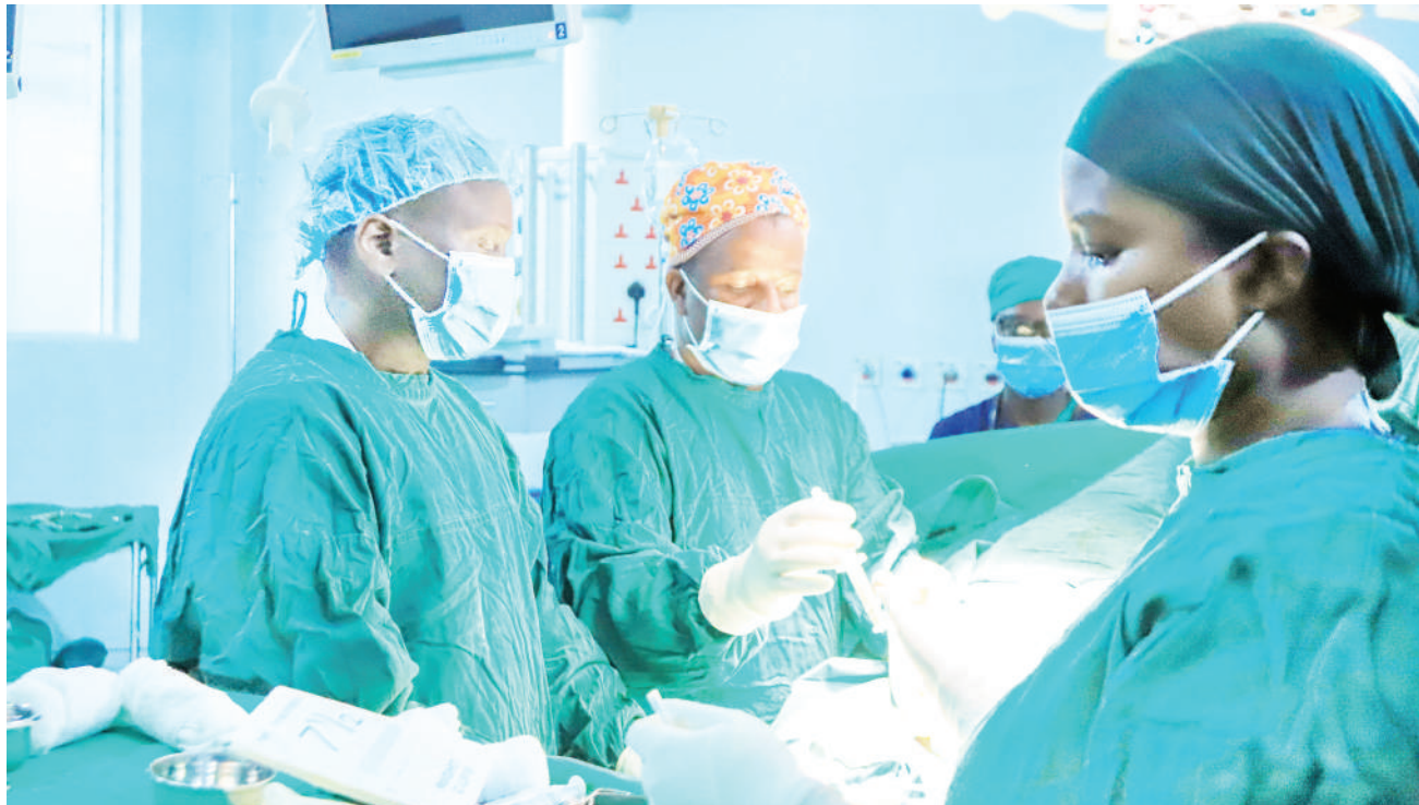
Madaktari Bingwa wa Hospitali ya Benjamin Mkapa (BMH) walipopandikiza uume kwa wahitaji wawili hospitalini hapo Jumatano ya wiki iliyopita. Ni upandikizaji wa kwanza kufanywa nchini.

• Madaktari bingwa wafafanua ufanisi, wasema ni suluhisho wenye shida ya nguvu za kiume... Ukurasa 2