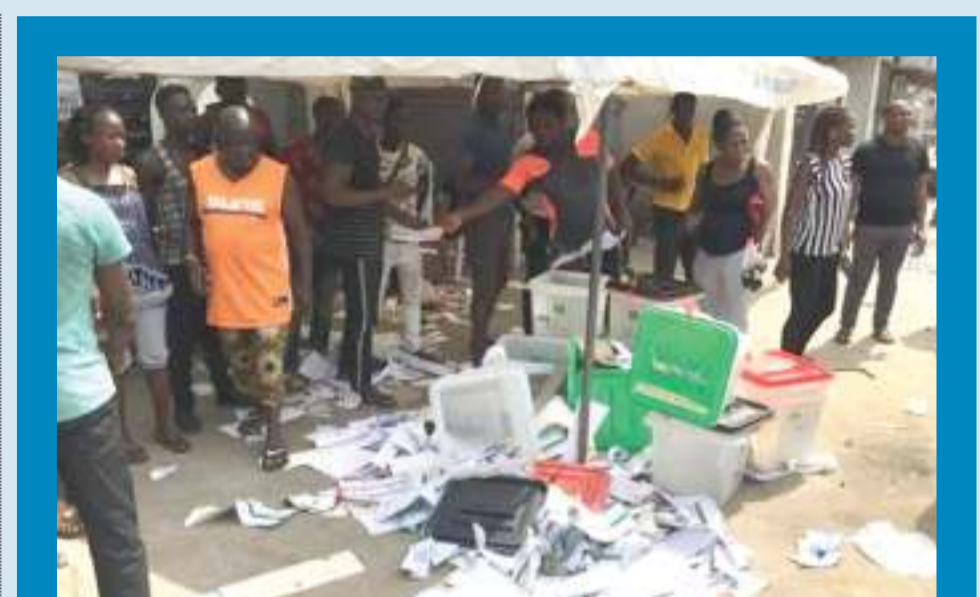
Maboksi ya kupigia kura yalitelekezwa katika Wilaya ya Isolo huko Lagos. PICHA ZOTE: MTANDAO

Kutokana na hitilafu ya mambo, kutokumilikiwa kwa mipango na vurugu katika baadhi ya maeneo uchaguzi umesogeza mpaka hapo baadaye.