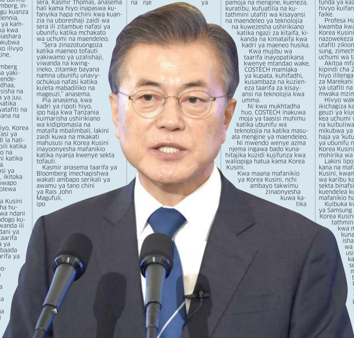
Rais wa Korea Kusini, Moon Jae-In.

Kuibuka kwa kampuni ya Samsung kulikoifanya Korea Kusini iongoze katika tathmini ya Bloomberg kwa mwaka jana, kunaweza kutoa ishara ya umuhimu wa ushirikiano usiotiliwa shaka kati ya serikali na sekta binafsi, na mwisho wa siku, taifa litapiga hatua hasa katika maendeleo ya kiuchumi na kwa kutegemea zaidi ubunifu kwenye sayansi na teknolojia.