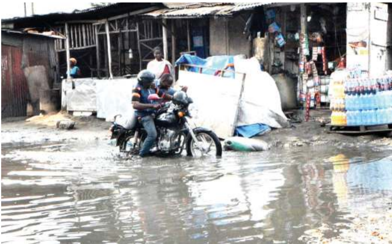
Wakazi wa jiji wakipita kwa shida kutokana na bomba la maji kupasuka na kusababisha dimbwi kubwa barabarani, katika Mtaa wa Jitegemee Mabibo, jijini Dar es Salaam jana.

Ushauri huo ulipokelewa na Ofisi ya Makamu wa Rais walihidi kuufanyia kazi.