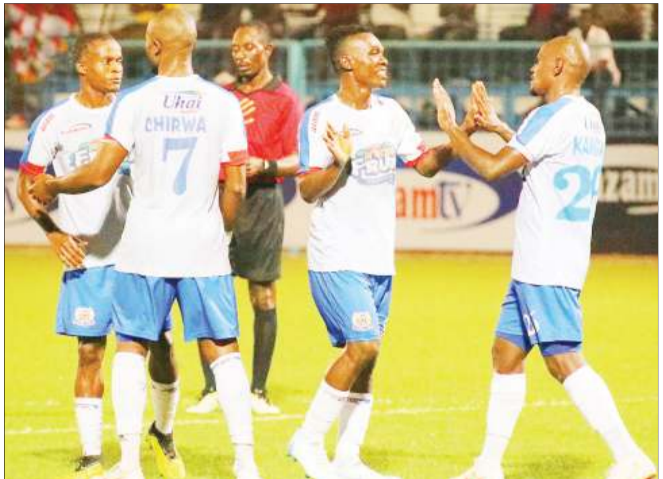
Wachezaji wa Azam FC, wakipongezana wakati wakishangilia moja ya mabao 3-0 waliyoshinda dhidi ya Rhino Rangers kwenye Uwanja wa Azam Complex, Chamazi jijini Dar es Salaam juzi na kutinga robo fainali ya Kombe la Shirikisho maarufu FA Cup.

Wakati, Aiyee akiwaongoza washambuliaji wengine kwa kufikisha mabao 13, Makambo anamfuata akiwa na mabao 12 huku Kagere akipachika mabao 11 wakati Bocco mwenyewe amefunga mabao saba kabla ya mchezo wao wa jana ambao Simba walikuwa wakiumana na Lipuli FC ya Iringa kwenye Uwanja wa Samora, Iringa.