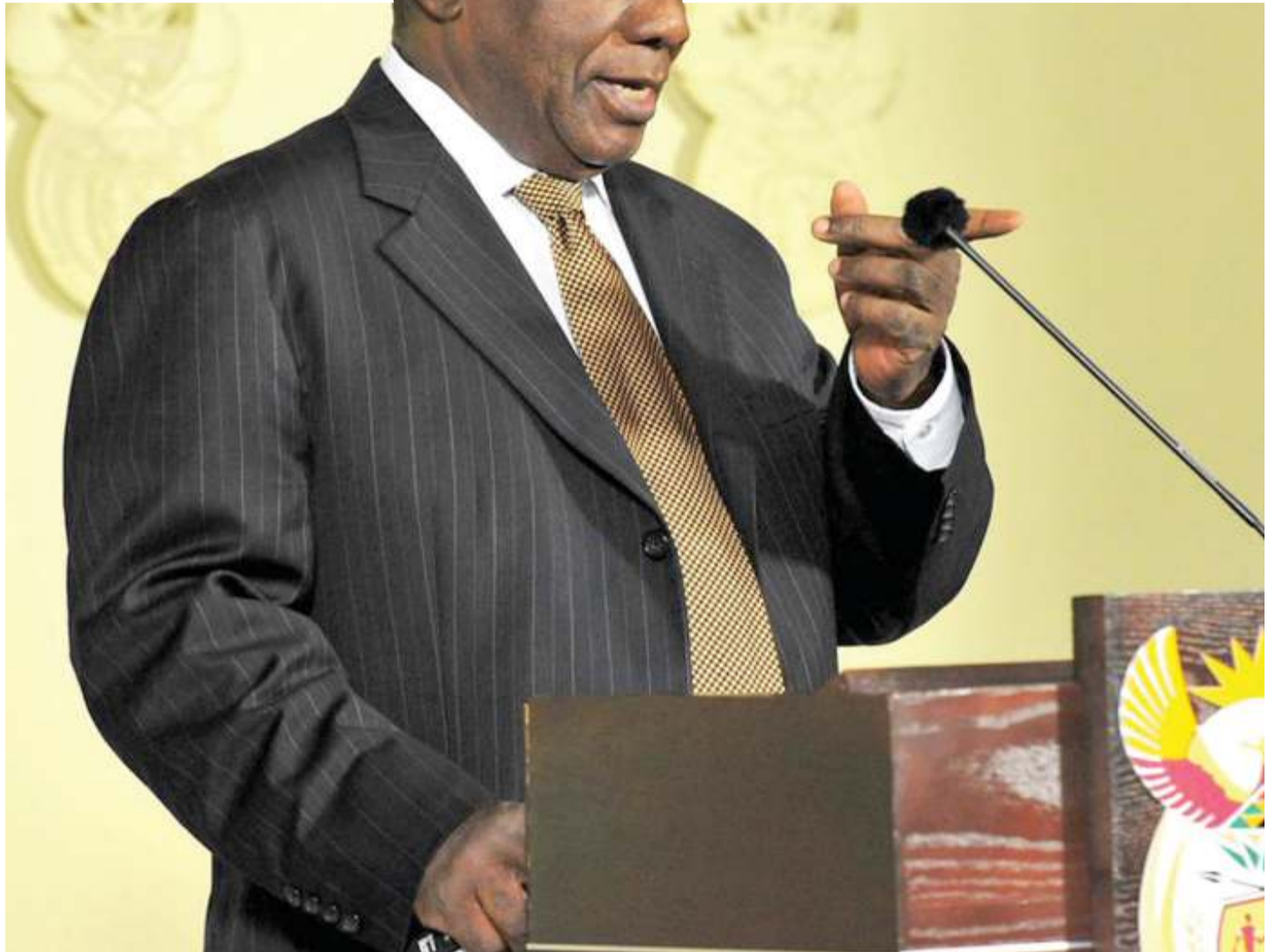
Rais Cyril Ramaphosa wa Afrika Kusini.

Wataalamu wa fedha wanasema ukubwa wake katika kulipa ni kiasi cha asilimia 80 ya pato la taifa ikiongezewa na madeni mengine yanayoikabili seri-