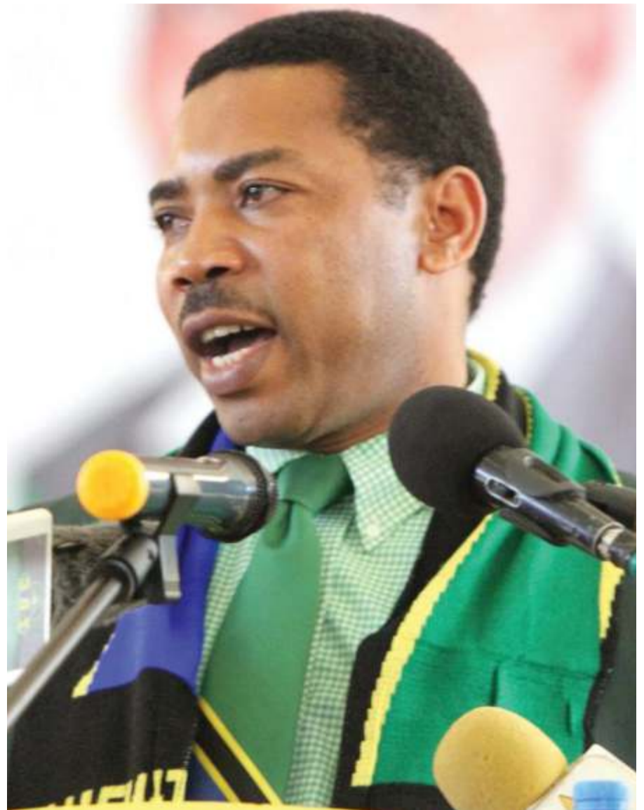
Mbunge wa Iramba Magharibi, Dk. Mwigulu Nchemba.