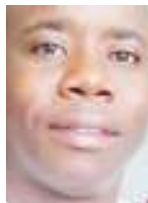
Na Mashaka Mgeta