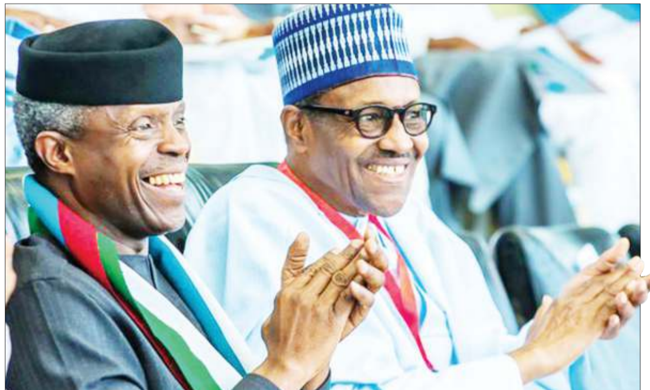
Rais wa Nigeria, Muhammadu Buhari (kulia), akiwa na makamu wake Yemi Osibanjo.

Nalo kundi la waangalizi kutoka Marekani limesema ucheleweshaji wa uchaguzi huo kwa wiki nzima umeharibu imani ya umma katika mchakato huo na imepunguza uitikaji wa wapigakura. DW