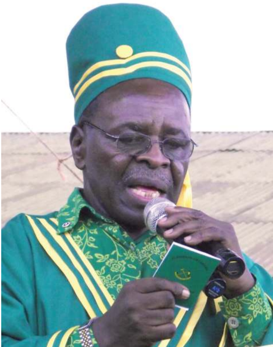
Makamu Mwenyekiti wa CCM Taifa, Philip Mangula.