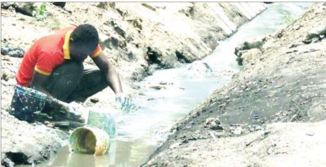
Mkazi wa jiji akiosha makopo ya rangi kwenye mtaro wa maji ya mvua, katika eneo la Kariakoo, jijini Dar es Salaam jana, kitendo ambacho ni uchafuzi wa mazingira.

Pamoja na mambo mengine, ilibainishwa kuwa wahusika wataunda mtandao wa kubadilishana uzoefu katika fani mbalimbali.