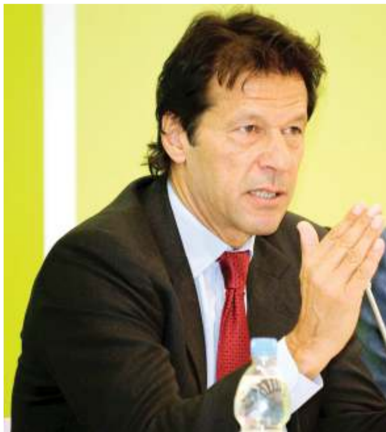
Waziri Mkuu wa Pakistani, Imran Khan.

Ndiyo maana India inapendelea zaidi kuleta mazingira mapana ya kutengwa kwa Pakistan kimataifa, huku ikigwaya kuchukua hatua za wazi za kijeshi dhidi ya jeshi la Pakistan au kambi yoyote ya kigaidi.