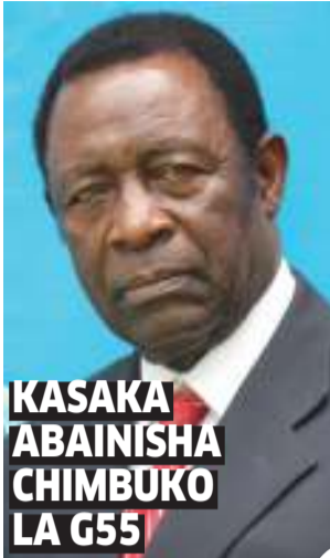
KASAKA ABAINISHA CHIMBUKO LA G55