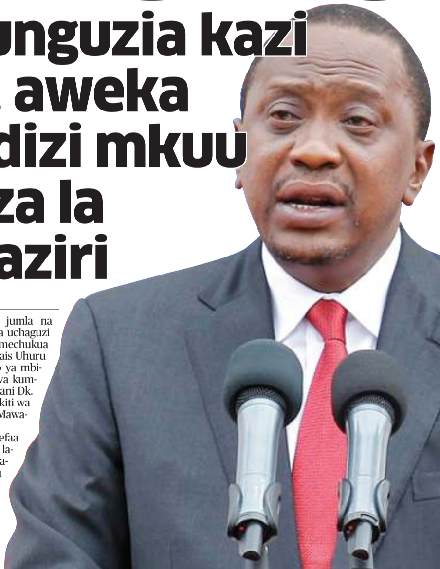
Rais Uhuru Kenyatta wa Kenya.

Tatizo ni kuwa akili yote ya Dk. Ruto (aliyetunukiwa shahada ya uzamivu mahafali za mwaka jana) iko kwenye