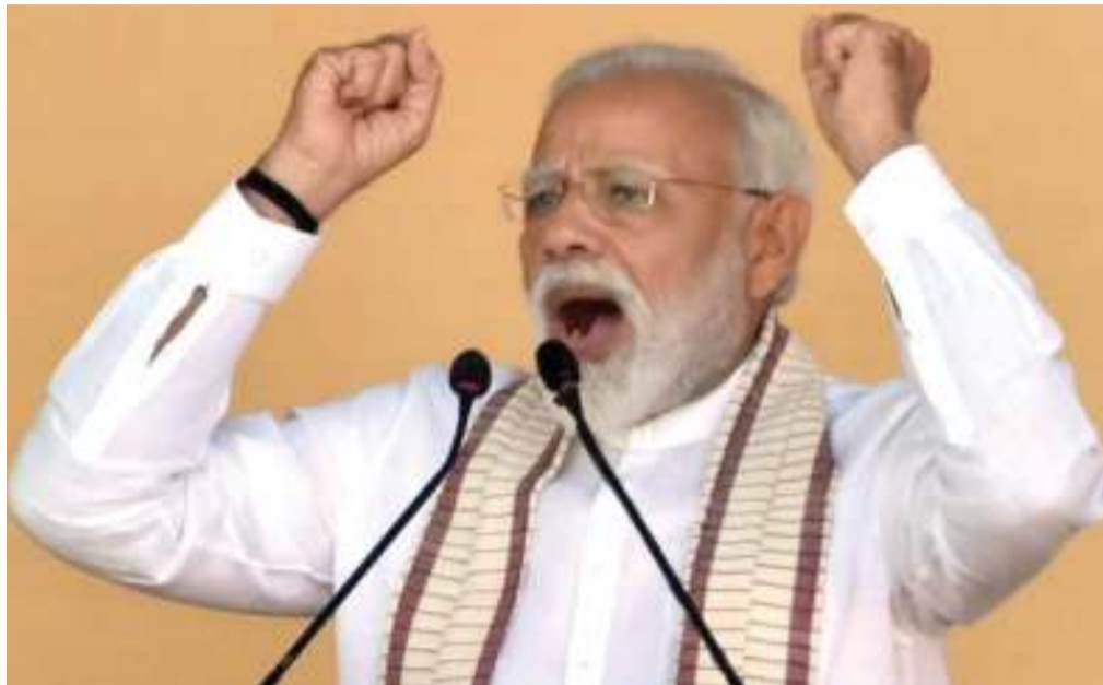
Waziri Mkuu wa India, Narendra Modi.

Ingekuwa ni kundi hilo limefanya shambulio kivyake na hakuna ushahidi kuwa jeshi au taasisi tanzu zilihusika, India ingeangalia kama inaweza kufanya shambulio la anga dhidi ya maskani ya vikundi vya kigaidi karibu na mpaka wa Jammu na Kashmir, kama ilivyopata kufanya awali.