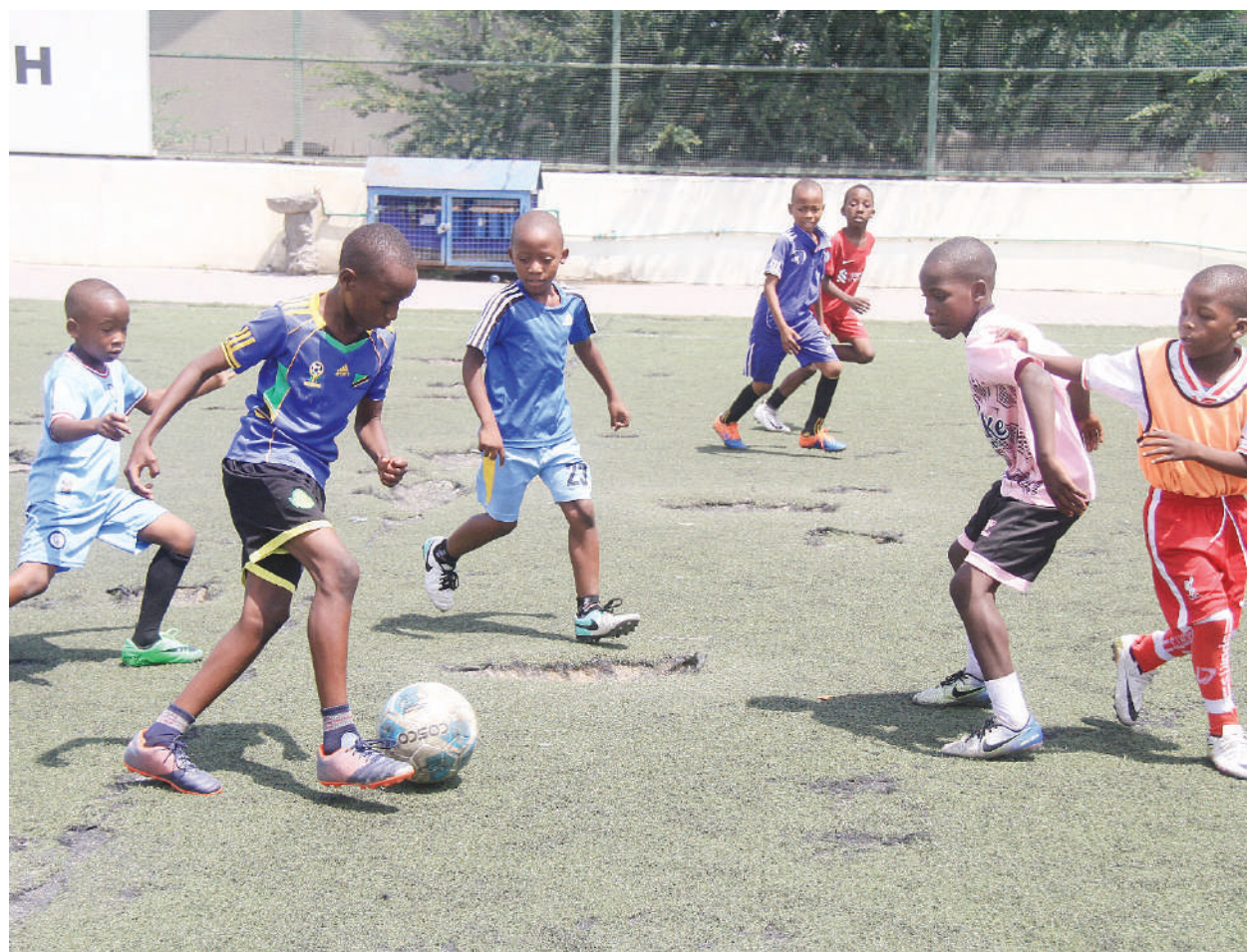
Wachezaji wa soka vijana kutoka sehemu mbalimbali jijini wakifanya mazoezi ya kujiimarisha kwenye Uwanja wa JMK Park, Dar es Salaam juzi.

Aliongeza anafahamu mechi inayofuata dhidi ya Mashujaa FC ya Kigoma haitakuwa rahisi kwa sababu ya ubora wa wapinzani wao.