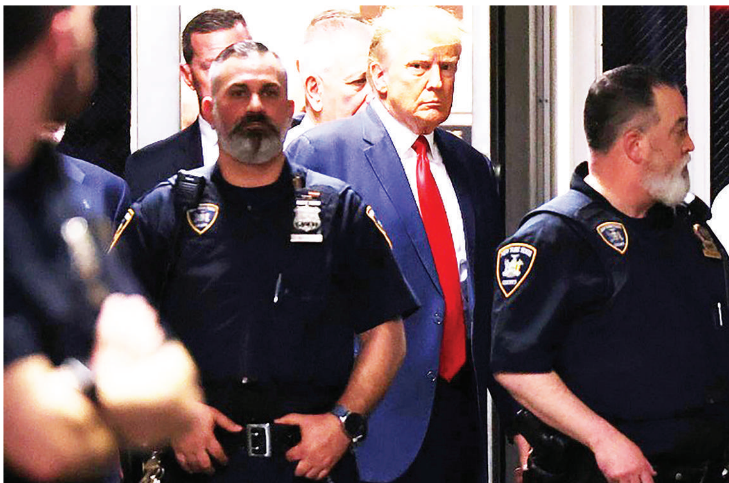
Rais wa zamani wa Marekani, Donald Trump akizungukwa na polisi baada ya kujisalimisha katika gereza la Georgia nchini Marekani jana.