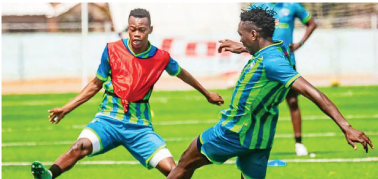
Wachezaji wa Namungo FC ya Lindi wakifanya mazoezi kwa ajili ya kujiandaa na mechi za Ligi Kuu Bara zitakazoendelea tena baada ya kalenda ya kimataifa kumalizika.