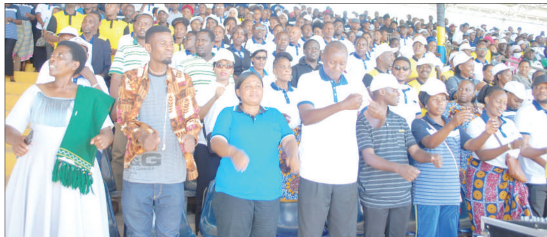
Wafanyakazi kutoka sekta mbalimbali za umma wakiimba wimbo wa mshikamano kwenye Maadhimisho ya Mei mosi yaliyofanyika mkoani Dodoma katika uwanja wa Jamhuri juji.