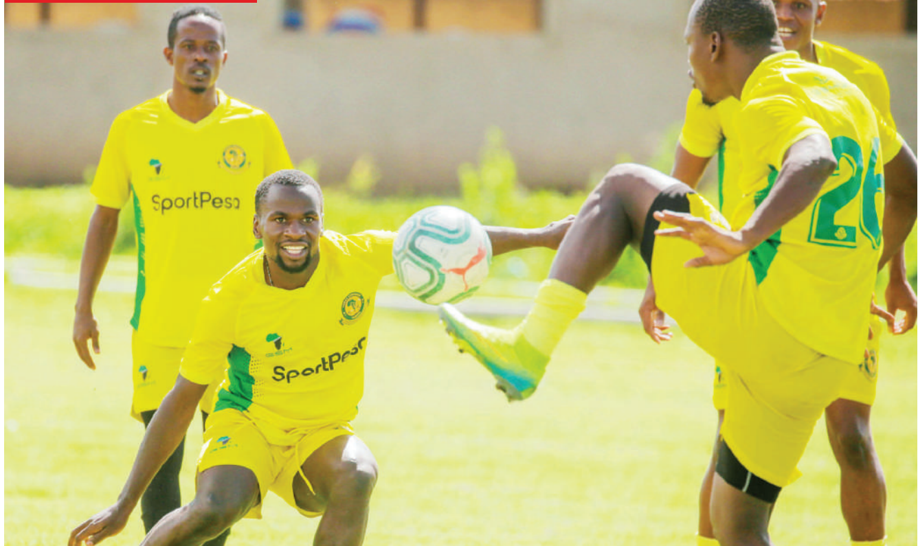
Wachezaji wa Yanga wakiwa mazoezini, wakati huu timu hiyo ikitarajiwa kushuka Uwanja wa Benjamin Mkapu Juma-mosi kuvaana na watani wao wa jadi, Simba, kwenye mechi ya mzunguko wa pili wa Ligi Kuu Bara.