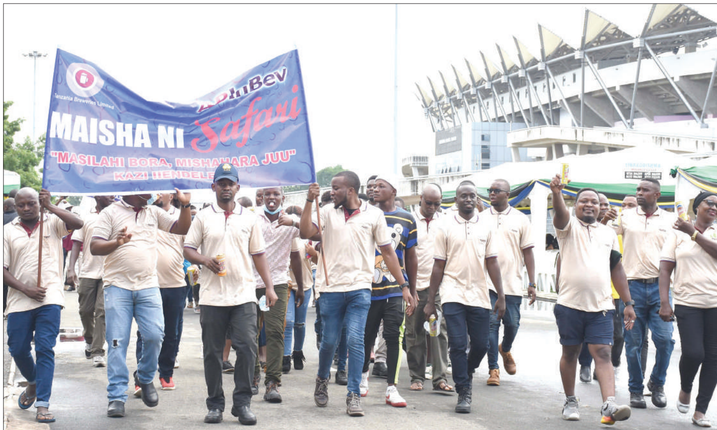
Wafanyakazi wa Tanzania Breweries Ltd Plc wakishirikia katika maadhimisho ya Mei Mos yaliyofanyika katika vuanjwa wa Uhuru jijini Dar es Salaam.