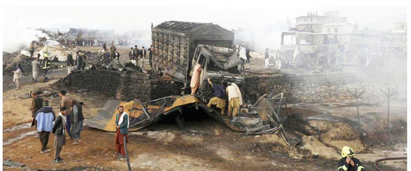
Wakazi wa mji wa Kabul nchini Afghanistan, wakishuhudia malori kadhaa ya mafuta yaliyoungua na kua watu saba, Kaskazini ya mji huo, huku watu 14 wakipelekwa hospitalini baada ya kujeruhiwa, jana.