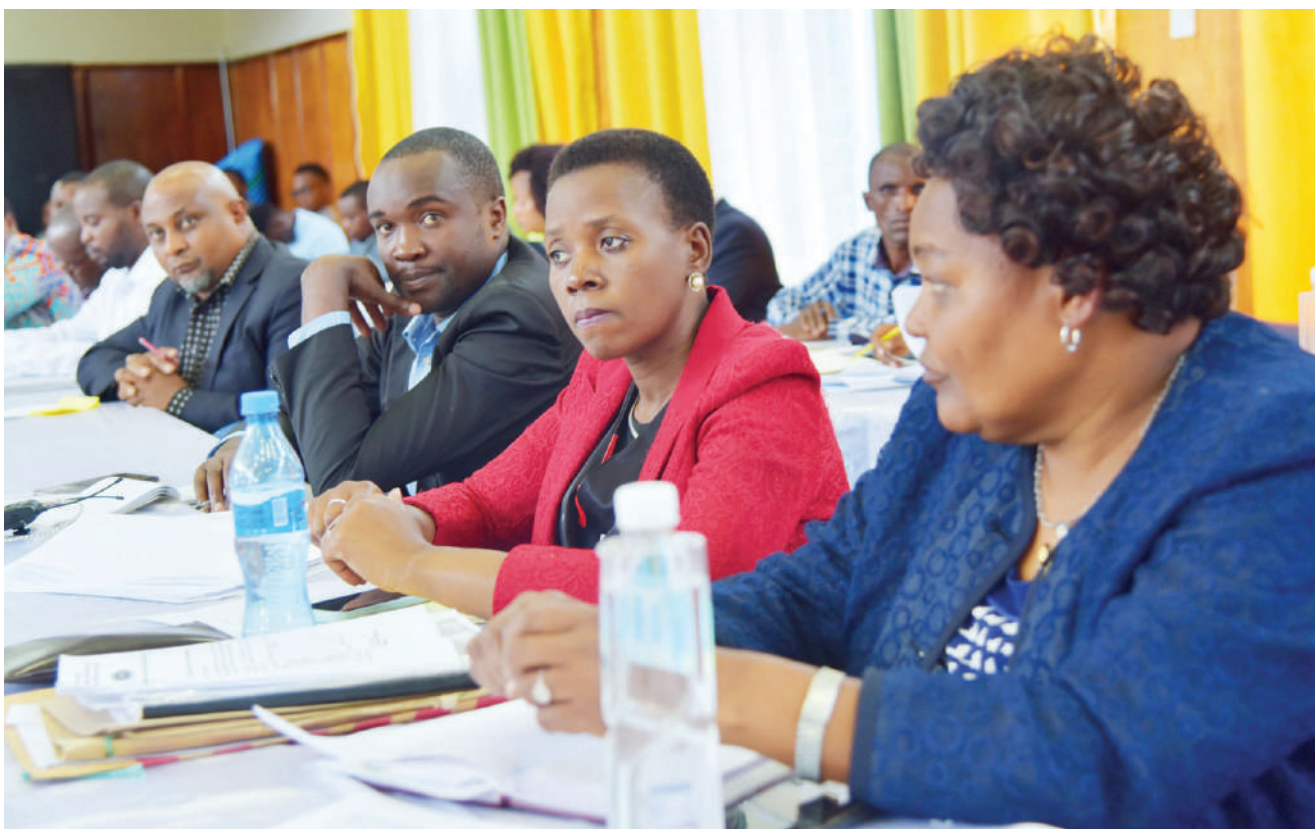
Baadhi ya wataalam mbalimbali wa Halmashauri ya Wilaya ya Iringa, mkoani Iringa wakifuatilia mkutano wa Baraza la Madiwani wa halmashauri hiyo.

Kikao hicho pia, kimemuagiza mkurugenzi kufanya mchakato kwa ajili ya kupata mtu mwingine wa kuziba nafasi yake.