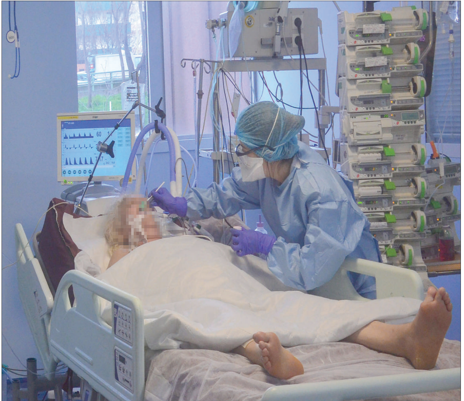
Teknolojia ya kisasa ya vifaa vya kusaidia upumuaji inayotumia kuhudumia wagonjwa wenye maambukizi ya COVID-19. Mashine hizo na chanjo ni matokeo ya utafiti wa hali ya juu ambao ni nadra kupatikana kwenye nchi maskini.

Hivyo panapotokea magonjwa ya milipuko haki ya kuishi kwa watu maskini inaondoka kwa vile hawana fedha za kutafiti tiba wala kununua dawa kutoka kwenye mataifa yenye