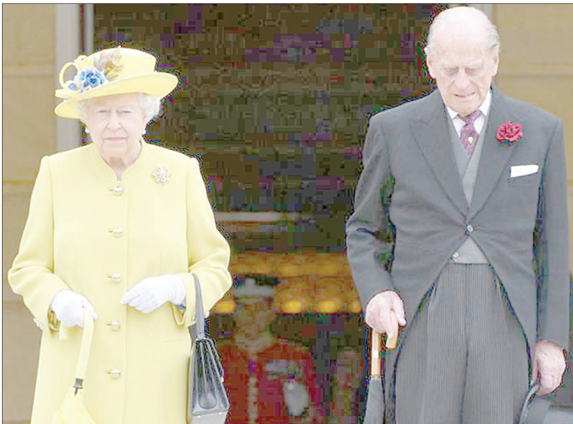
Malkia wa Uingereza, Elizabeth II, akiwa na marehemu mumewe, Mwanamfalme Philip, wakati wa uhai wake, akisimama kwa dakika moja mwanzoni mwa sherehe ya bustani huko Buckingham Palace, Mei 23, mwaka 2017 kwa heshima ya wale waliouawa kwenye tamasha la Ariana Grande huko Manchester.