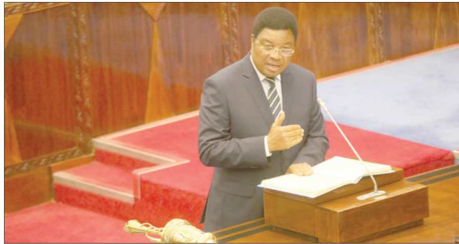
Waziri Mkuu Kassim Majaliwa, akizungumza wakati akihitimisha hoja ya Bajeti ya Ofisi ya Waziri Mkuu, Taasisi zake na Ofisi ya Bunge, Bungeni jijini Dodoma jana.

Alisema serikali itaendelea kusimamia eneo la ajira watu wenyewe ulemavu na kutoa wito kwa waajiri kuendelea kuwaamini kwa kuwa uwezo wanao.