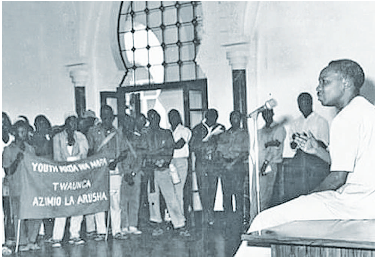
Tukio moja wapo la Azimio la Arusha lilivyokuwa.

uligusa kuingiwa mfumo wa chama kimoja cha siasa, ikitafsiri aina ya kisiasa ya nchi, inayoangukia mlengo wa kushoto, itikadi ya kijamii, kitaifa kukitumia falfasa ya Ujamaa na Kujitegemea. Maudhui ya kiuchumi ya mpango huo miaka mitano, pia yaliegemea kusudio la kijamaa, mali na uchumi mkuu wa nchi kumilikiwa na serikali.