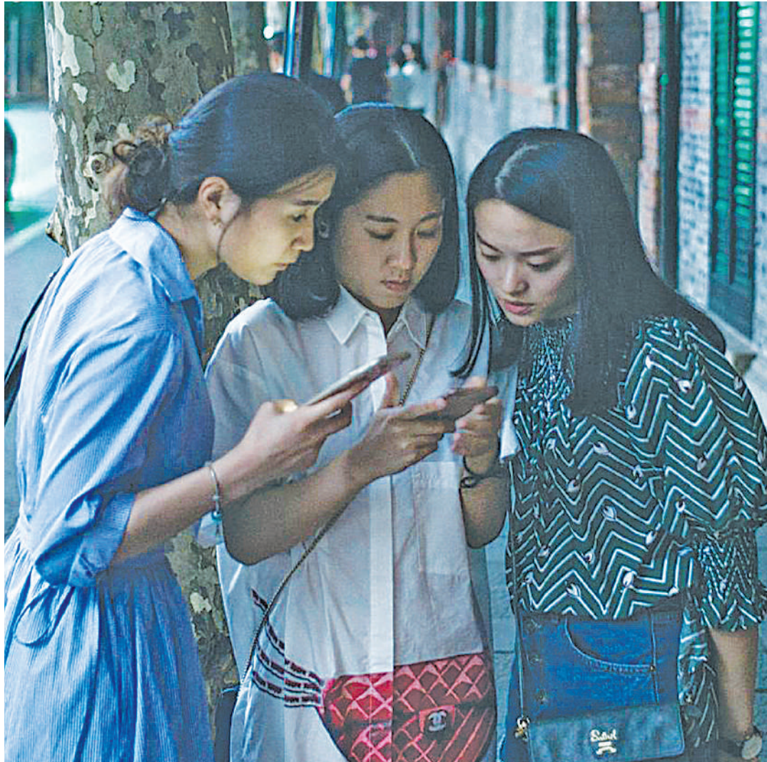
Wachina wakiwa katika mijumuiko yao.

Kuongezeka haja ya watu binafisi kuweka akiba, kutafanya iwe vigumu zaidi kwa China ku-