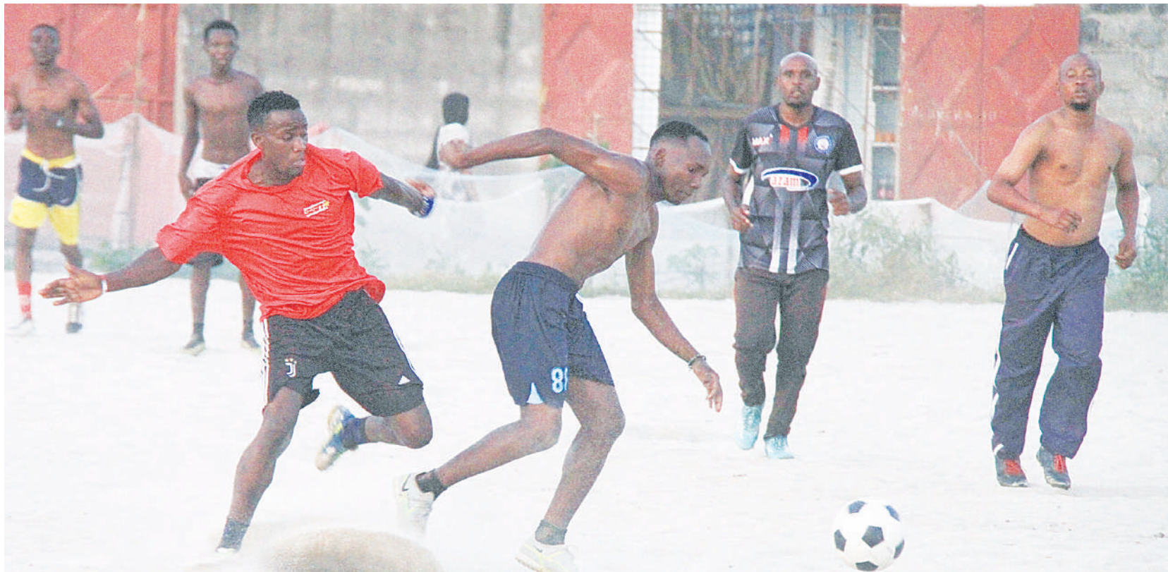
Wachezaji wa Timu ya Kitunda FC, wakiwania mpira wakati wa mazoezi ya timu hiyo kwenye Uwanja wa Shule ya Msingi Kitunda juzi.