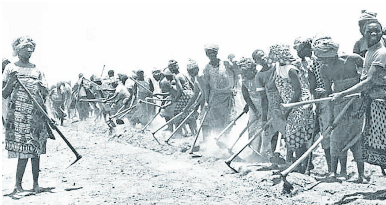
Kilimo cha Ujamaa kikiendelea katika zama hizo.

kigeni. Aidha, shirika la umma lililoitwa Msa-jili wa Majumba, majengo yake mengi yakivi maghorofa mijini, makazi na ofisi yatokanayo na utafishwaji wa Azi-