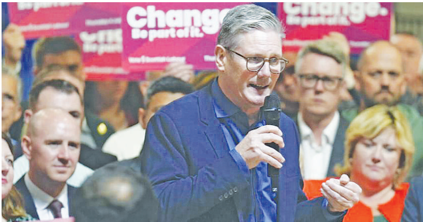
Kiongozi wa Chama cha Labour nchini Uingereza, Keir Starmer, akijibu swali baada ya kufanya kampeni katika uwanja wa michezo wa Caledonian Gladiators katika eneo la East Kilbride, Scotland juzi.