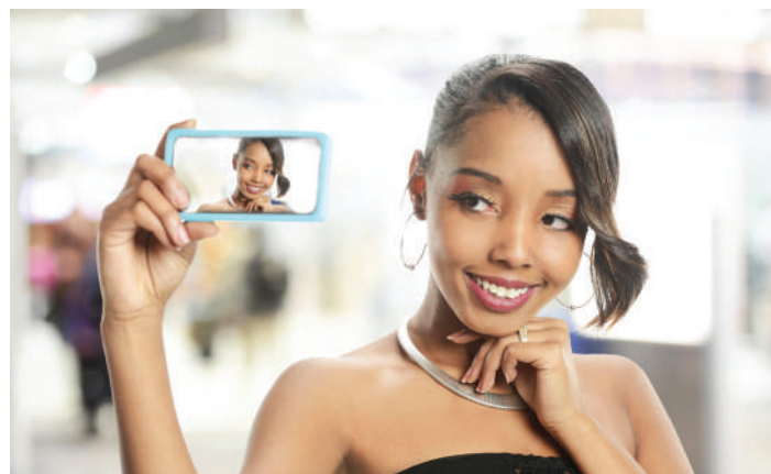
Mrembo akijipiga picha mwenyewe na simu ya mkononi maarufu kama 'selfie' na kuonyesha jinsi binadamu walivyotoka kwenye teknolojia ya kupiga picha na kusubiri mwezi mzima, hadi kujipiga mwenyewe ikionekana hapo hapo.

watoto wake, anawalishe nguo mpya au zile za kuenda safari, atawapaka mafuta na manukoto ili tu waende studio wakapige picha.