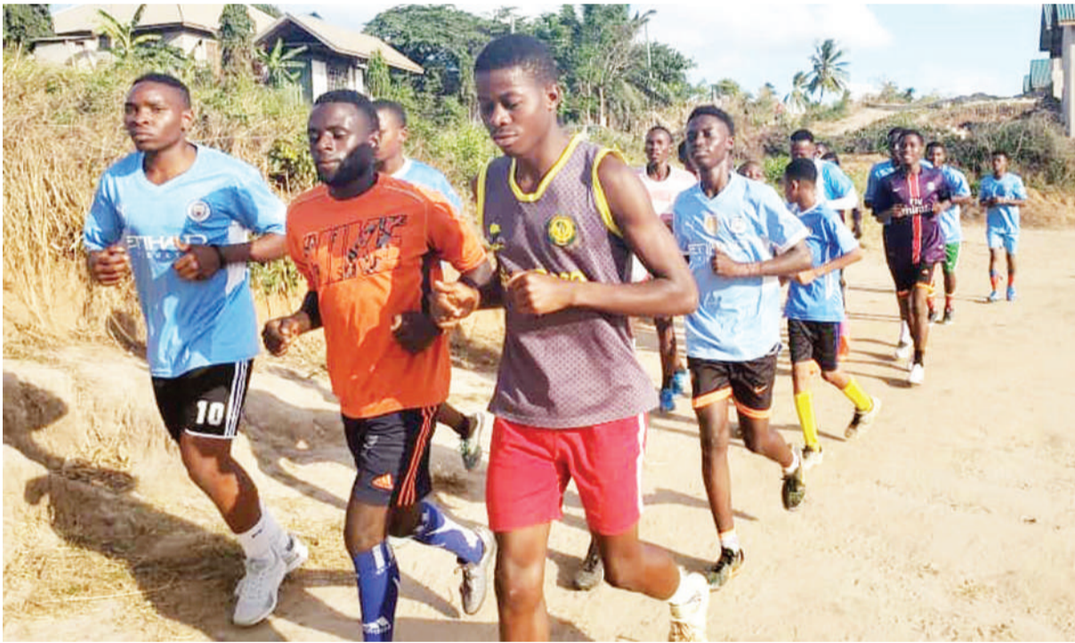
Baadhi ya wachezaji wa Timu ya Soka ya Planet Sports Club ya Luguruni Dar es Salaam, wakiwa mazoezi katika uwanja wao juzi.

Aidha alisema waamuzi ambao hawatafanya vizuri katika mtihami yote miwili ikiwamo ya uwanjani na sheria za soka hawataruhusiwa kucheza Ligi Kuu, Ligi Daraja la Kwanza na Kombe la FA.