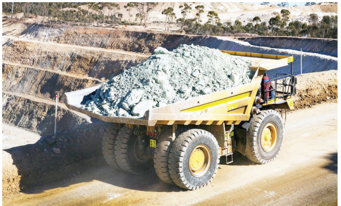
Uwekezaji wa pamoja unaweza kuwa katika migodi mikubwa ya madini.

“Hisa zinalipa hasa pale mwekezaji anapokuwa hana haraka, ili kuzipa nafasi ya kukabiliana na changamoto za kupanda na kushuka kwa thamani kwa kampuni fulani au kwa soko lote la hisa. Kimsingi uwekezaji kwenye hisa kama uwekezaji kwenye sehemu nyingine unahitaji utaalumu na wakati mwingine uvumilivu ni muhimu,” anasisitiza.