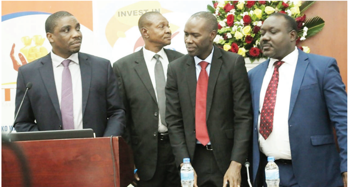
Viongozi wa Mfuko wa Uwekezaji wa UTT-AMIS.

Mbagi anasisitiza kwamba, faida za jamii kuungana na kufanya uwekezaji kwa ajili ya lengo fulani ni nyingi, ikiwamo kupunguza gharama za uwekezaji.