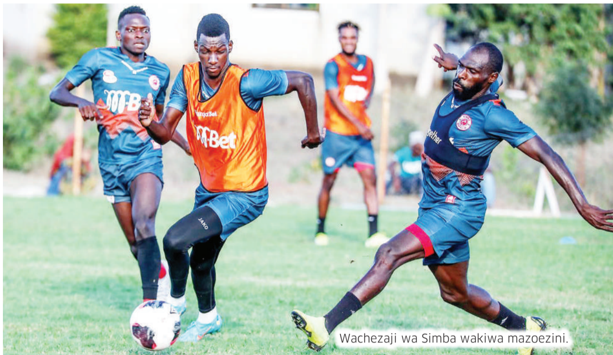
Wachezaji wa Simba wakiwa mazoezini.