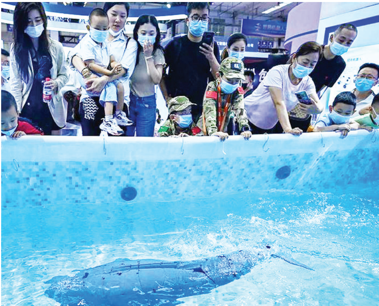
Watu wakiangalia roboti iliyoundwa katika umbo la samaki katika maonyesho ya teknolojia ya roboti duniani yaliyofanyika Beijing, China juu.