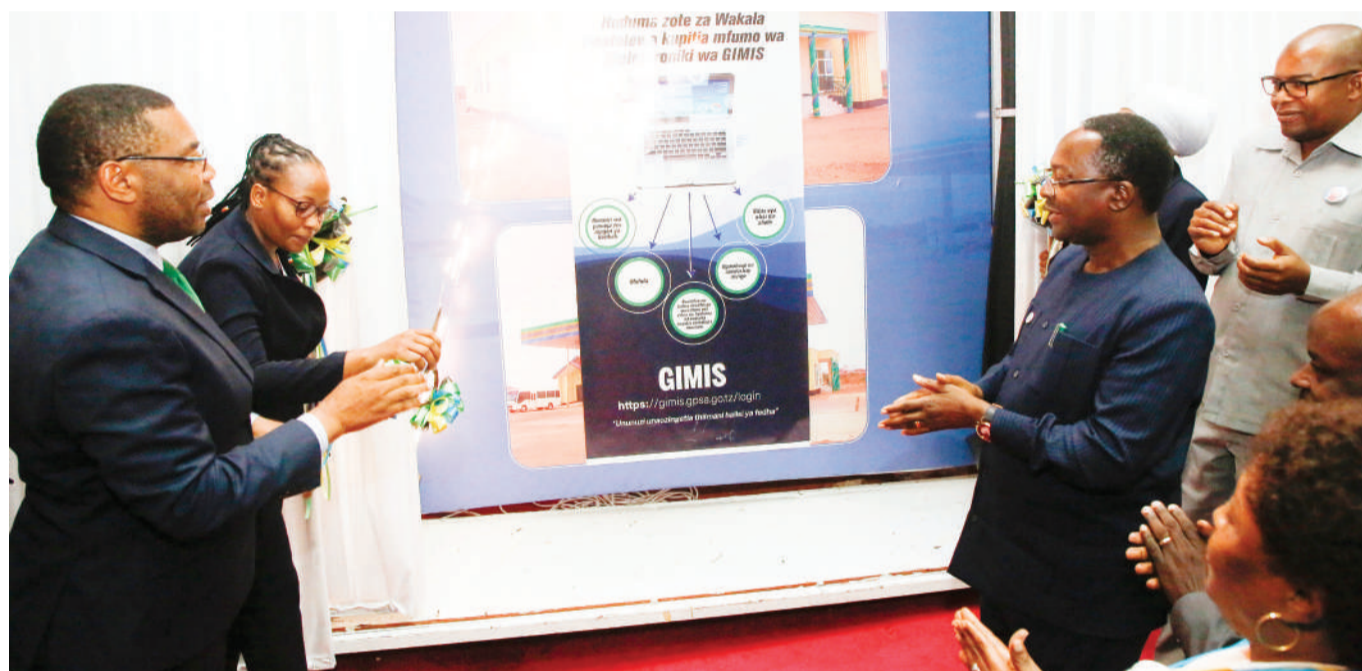
Waziri wa Nchi, Ofisi ya Rais Menejimenti ya Utumishi wa Umma na Utawala Bora, George Simbachawene (kulia), akishirikiana na Waziri wa Fedha, Dk. Mwigulu Nchemba (kushoto), kuzindua mfumo wa kielektroniki wa ukusanyaji mapato na ufuatiliaji matumizi ya serikali ujulikanao GIMIS, uzinduzi huo ulifanyika jijini Dodoma mwishoni mwa wiki.

Aliziagiza bodi zinazosimamia mipangomiji, upimaji ardhi na uthamini kuchukua hatua dhidi ya watalaamu na kampuni zilizokuika maadili ya taaluma zao.