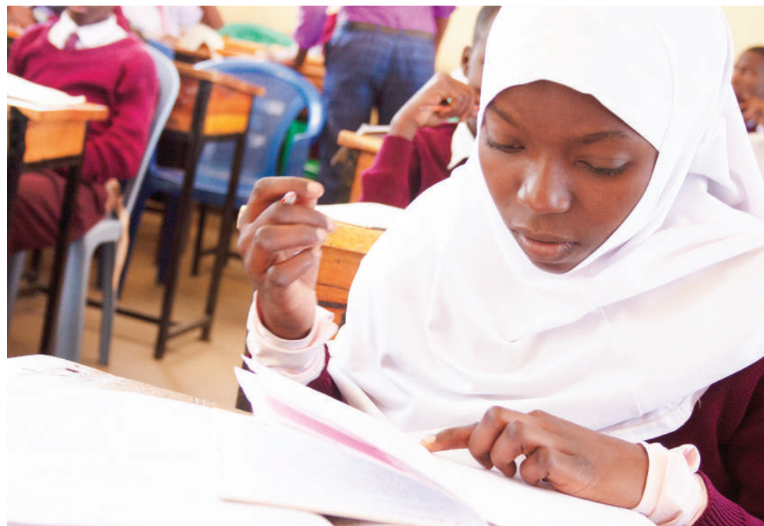
Mwanafunzi wa Shule ya Sekondari Lutozo iliyoko Katoro mkoani Geita, akiwa darasani.

eneo la Katoro iliyopo shule hii ni kitovu cha biashara na shu-ghuli nyingi za kiuchumi yaki-wamo madini, hivyo kuwa rahisi wanafunzi kushawishika na kupo-toshwa.