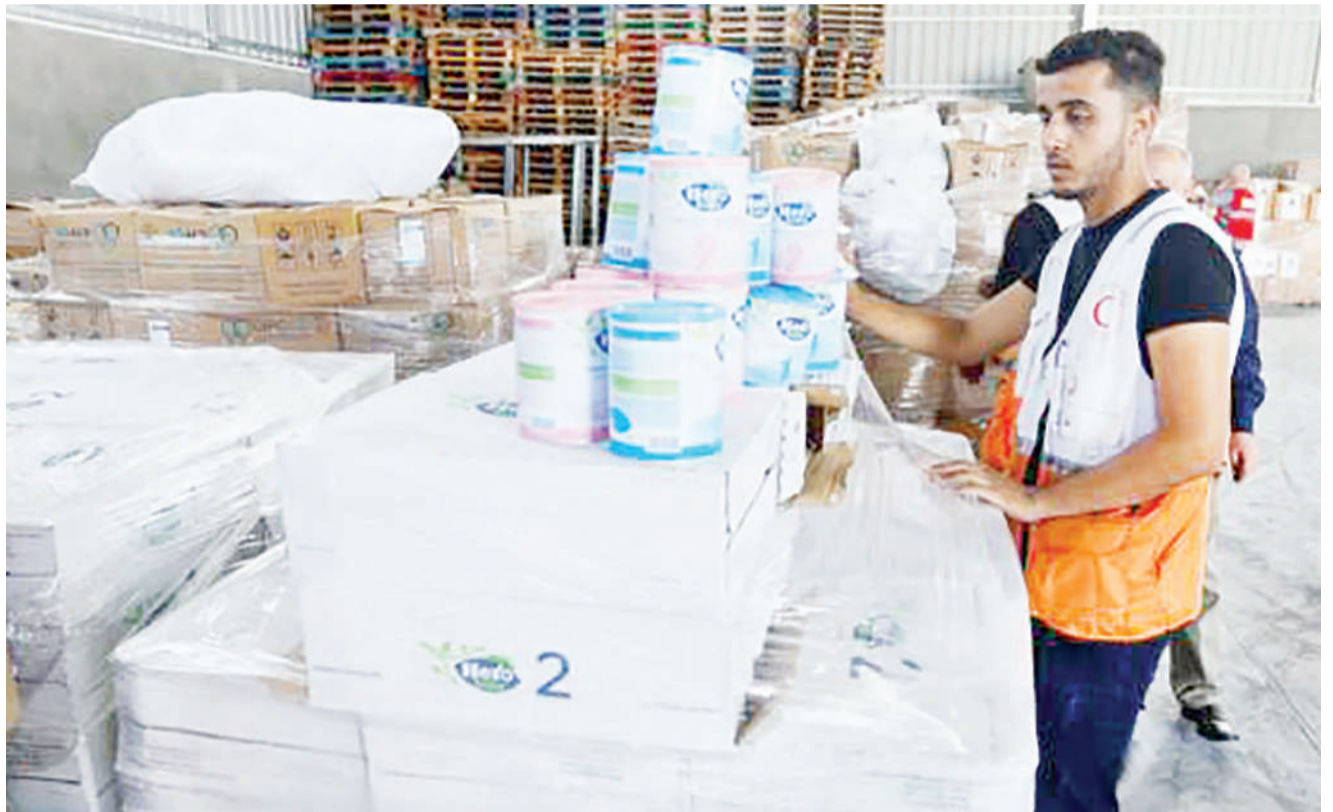
Sehemu ya misaada ya kibinadamu iliyoingizwa ukanda wa Gaza hivi karibuni.

Ilibainishwa kuwa Rais Biden alijadili vita kati ya Hamas na Israel kwa njia ya simu juzi na Rais Macron, Justin Trudeau wa Canada, Olaf Scholz, Giorgia Meloni na Rishi Sunak. RFI