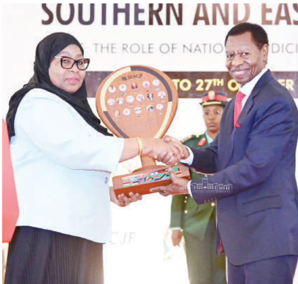
Rais Samia Suluhu Hassan akipokea picha ya Majaji Wakuu wa Nchi za Kusini na Mashariki mwa Afrika kutoka kwa Mwenyekiti wa Jukwaa lao, ambaye ni Jaji Mkuu wa Namibia, Peter Shivute, katika mkutano uliofanyika jijini Arusha jana.