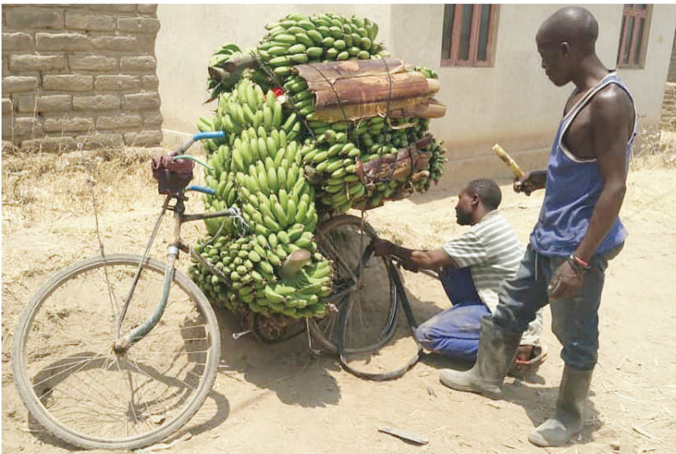
Vijana wa Mamlaka ya Mji Mdogo wa Mbalizi mkoani Mbeya wakishirikiana kutengeneza baiskeli yenye mzigo wa ndizi baada ya kuharibika njiani jana, walipokuwa wanasafirisha ndizi hizo kutoka kwenye mashamba ya Kiten- gule.