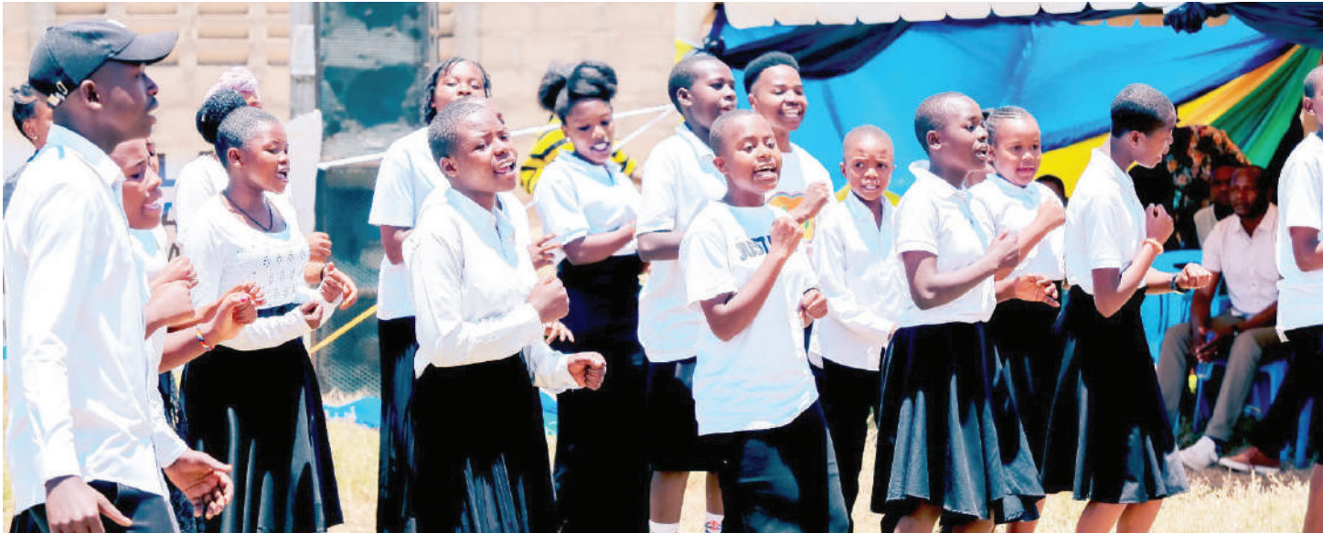
Wanafunzi wakiimba katika uzinduzi wa kampeni ya 'Ulinzi na Usalama wa Mtoto' katika mji mdogo wa Ilula.

W ATOTO wenye umri wa kuwa darasani hawasomi. Wamekuwa waathirika wakubwa wa ukatili, vitendo hivyo vikiongezeka kwa watoto wanaoishi katika mazingira magumu kwenye mji mdogo wa Ilula ulioko wilayani Kilolo Mkoa wa Iringa.