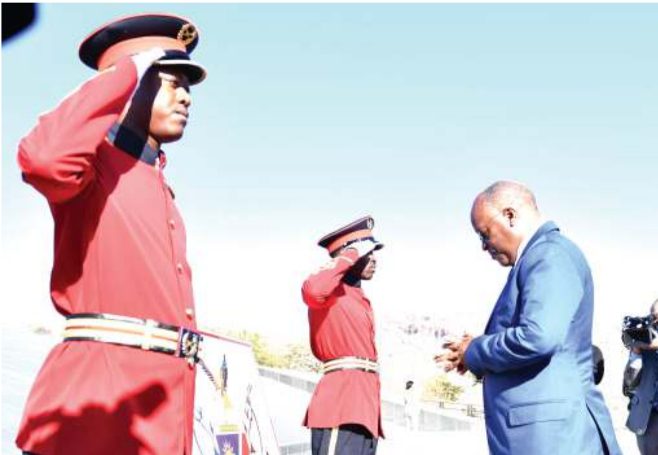
Rais Dk. John Magufuli akisali mbele ya makaburi ya mashujaa wa Namibia yaliyopo katika eneo la Heroes' Acre, nchini humo jana, baada ya kuweka shada la maua.