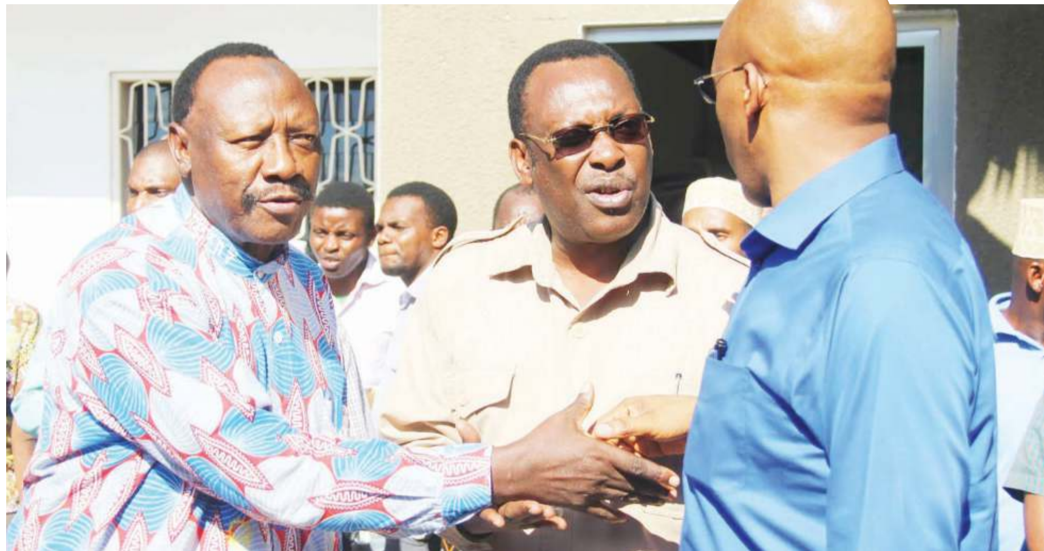
Baadhi ya viongozi wa upinzani nchini, Mwenyekiti wa CUF, Prof. Ibrahim Lipumba (kushoto), Mwenyekiti wa Chadema, Freeman Mbowe (katikati), na Mwenyekiti wa NCCR-Mageuzi, James Mbatia.