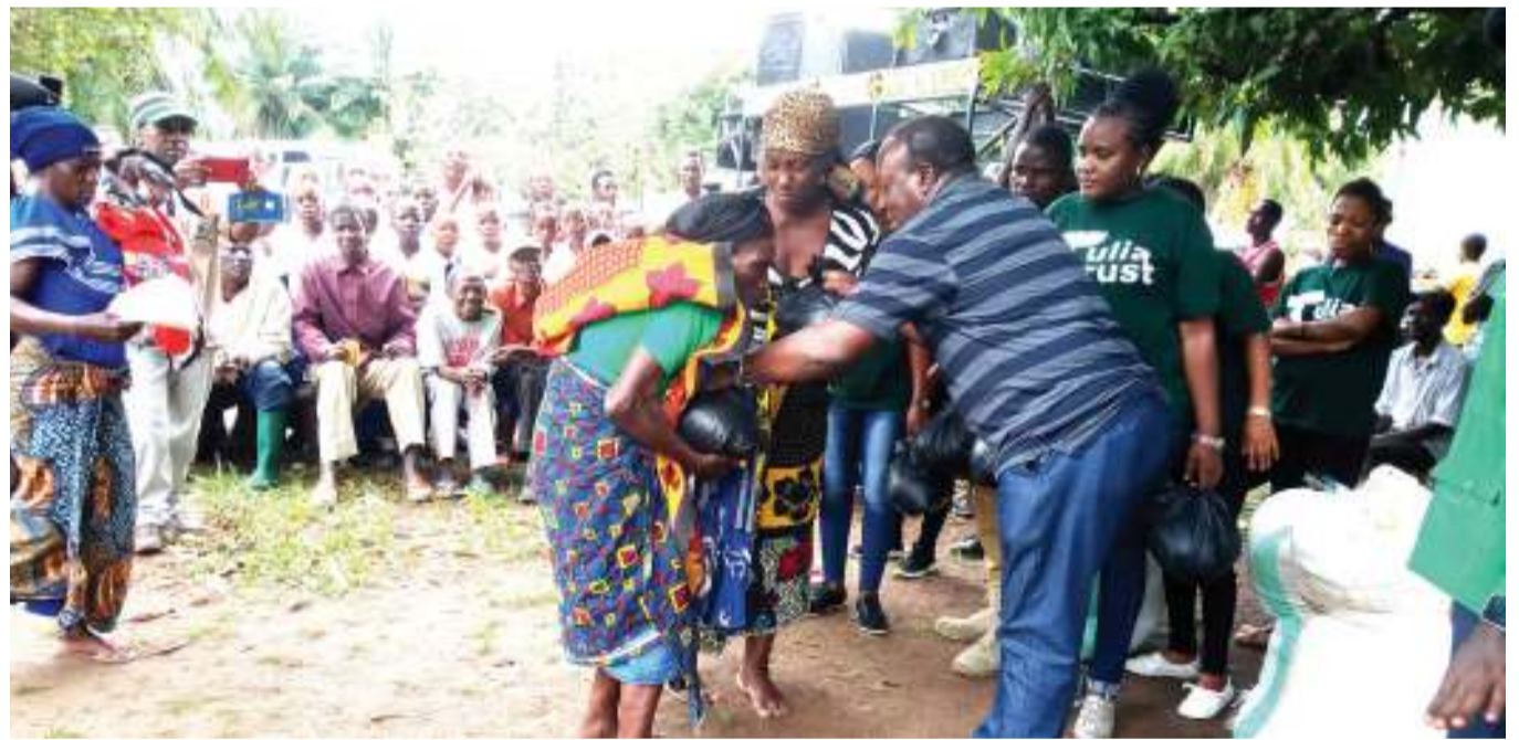
Waziri wa Habari, Utamaduni, Sanaa na Michezo, Dk. Harrison Mwakyembe (kulia), akimkabidhi msaada wa chakula mmoja wa wazee wa Kijiji cha Malungu, wilayani Kyela katika Mkoa wa Mbeya walioathiriwa na mafuriko ya hivi karibuni.

Kuanzia Aprili 29, mwaka huu mpaka katikati ya mwezi Mei, wananchi wa kata nane za Wilaya ya Kyela walikumbwa na mafuriko yaliyosababishwa na mvua zilizokuwa zinanyesha katika Wilaya ya Rungwe hali iliyosababisha watu watano kupoteza maisha na wengine 2,570 kukosa makazi.