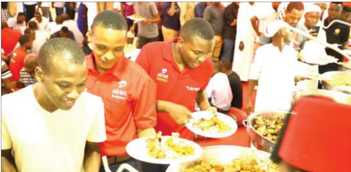
Wafanyakazi na baadhi ya wadau wa kampuni ya simu za mkononi Airtel Tanzania, wakichukua chakula kilichoandaliwa na kampuni hiyo kwa ajili ya futari katika Mwezi Mtukufu wa Ramadhani, hafla iliyoifanyika jana katika ofisi za Airtel Makao Makuu Morocco jijini Dar es Salaam.