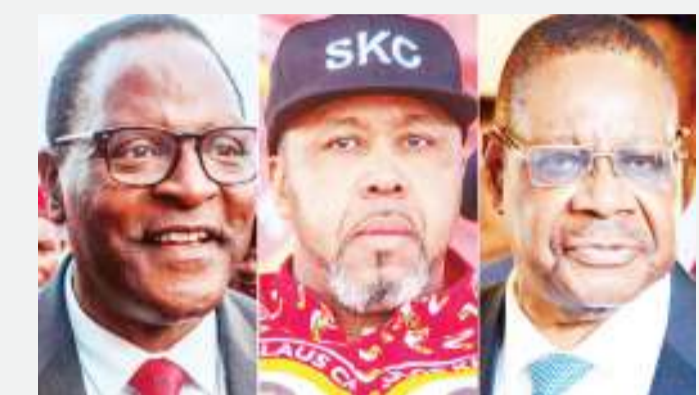
Wagombea urais Lazarus Chakwera (kushoto) na Saulos Chilima (katikati) waliokuwa wakichuana na Rais Mutharika (kulia).

Malawi ilipata uhuru wake kutoka kwa Mwingereza mwaka 1964. Huu ulikuwa ni uchaguzi wa sita wa urais nchini humo toka utawala wa