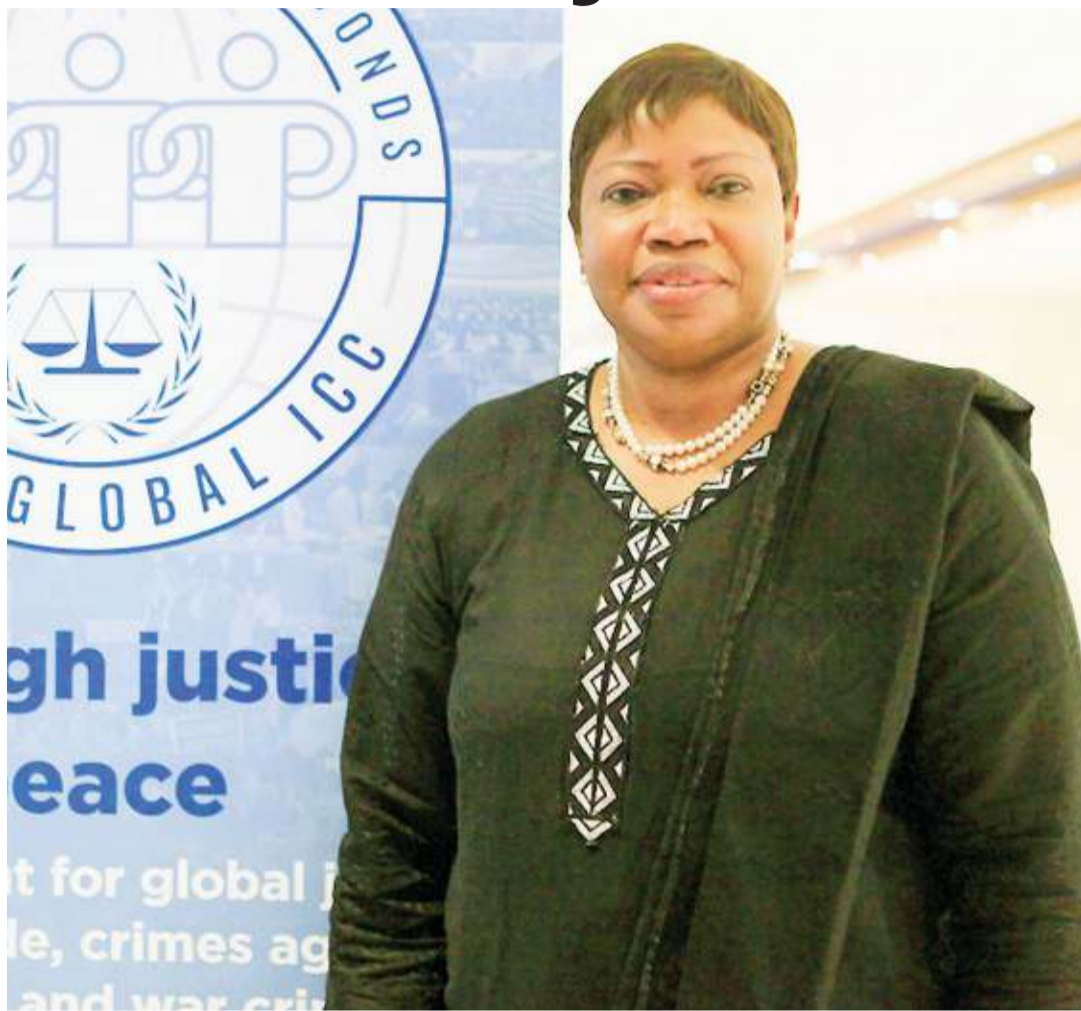
Mwendesha Mashtaka Mkuu wa ICC, Fatou Bensouda ambaye amepigwa marufuku kuingia Marekani.

Iliaminika kwamba kama Kenyatta na Ruto wangehukumiwa na kufungwa kutokana na tuhuma zilizowakabili huko ICC zikiwamo mauaji, kujeruhi na uharibifu wa