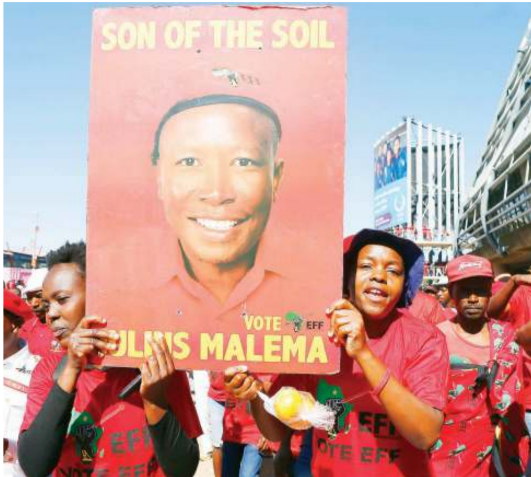
Kiongozi wa Chama cha Economic Freedom Fighters (EFF), Julius Malema (picha ikiwa imebebeba), ambacho kimepata asilimia 10.8. katika uchaguzi mkuu nchini Afrika Kusini ambapo ANC ilishinda kwa asilimia 57.5.

Zuma alikabiliwa na kashfa mbalimbali zilizohusiana na masuala ya ufisadi, akafikia hatua ya 'kuachia ngazi' na nafasi yake kuchukuliwa na aliyekuwa Makamu wa Rais na