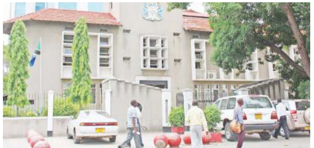
Mahakama Kuu ya Tanzania, Kanda ya Dar es Salaam. PICHA: MTANDAO

ACT-Wazalendo: Ukawa ni wenzetu lakini... Ukurasa 19