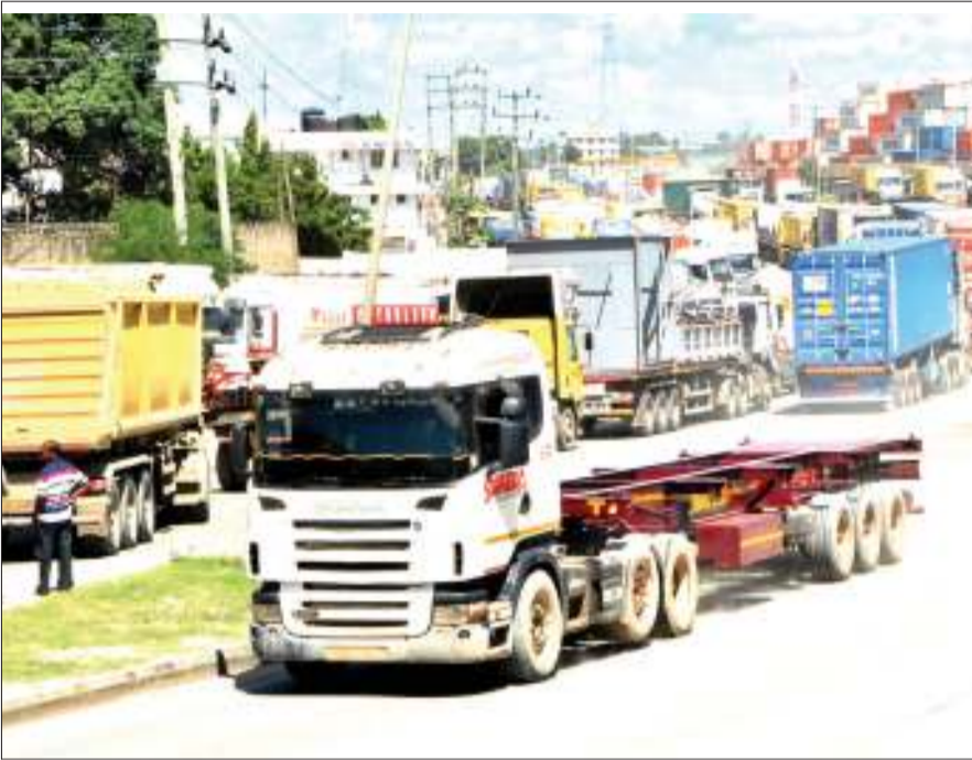
Baadhi ya malori ya mizigo yakiwa kwenye foleni yakisubiri kupimwa kwenye mzani Barabara ya Mandela, eneo la Kurasini jijini Dar es Salaam jana. Wamiliki wa ofisi jirani na mzani huo, wamelalamikia usumbufu na kushindwa kuingia kazini kwa wakati kutokana na foleni hiyo.