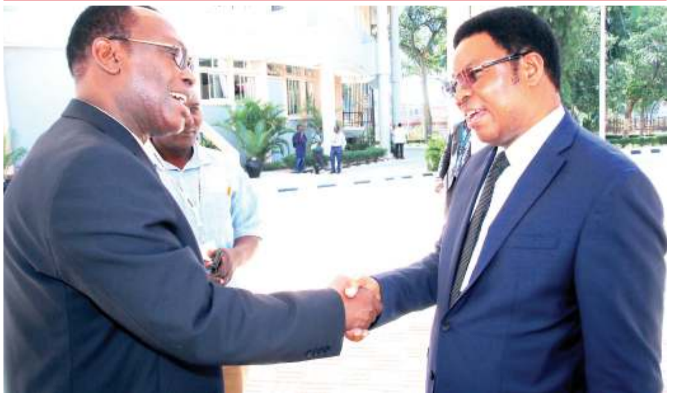
Waziri Mkuu, Kassim Majaliwa, akisalimiana na Kiongozi wa Upinzani Bungeni, Freeman Mbowe, kwenye viwanja vya Bunge, jijini Dodoma jana.

"Lazima serikali izingatie mgawanyo wa rasilimali fedha kwa sekta mbalimbali nchini kwa sababu kurundika rasilimali nyingi kwenye miradi michache kunaweza kusababisha kudumaa kwa miradi mingine ya maendeleo," alisema.