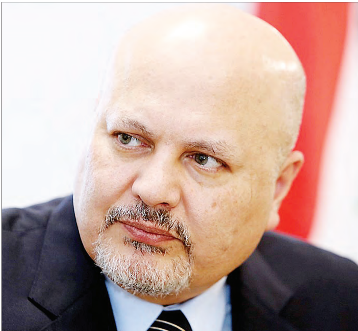
Mwendesha mashitaka mpya wa Mahakama ya Kimataifa ya Uhalifu wa Kivita (ICC), Karim Khan.

Hata hivyo, viongozi hao walipe- wa dhamana na wanatarajiwa kufika mahakamani tarehe 5, Machi mwaka huu. BBC.