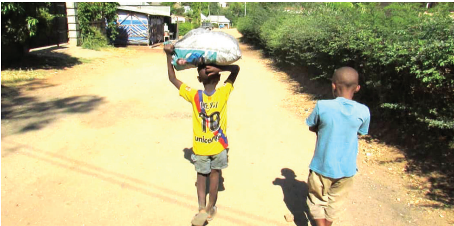
Wadogo wa Christina katika umachinga wa mkaa, mitaani Mpwapwa.

•Mdau elimu: Ninawanusuru kila wanapoelemewa