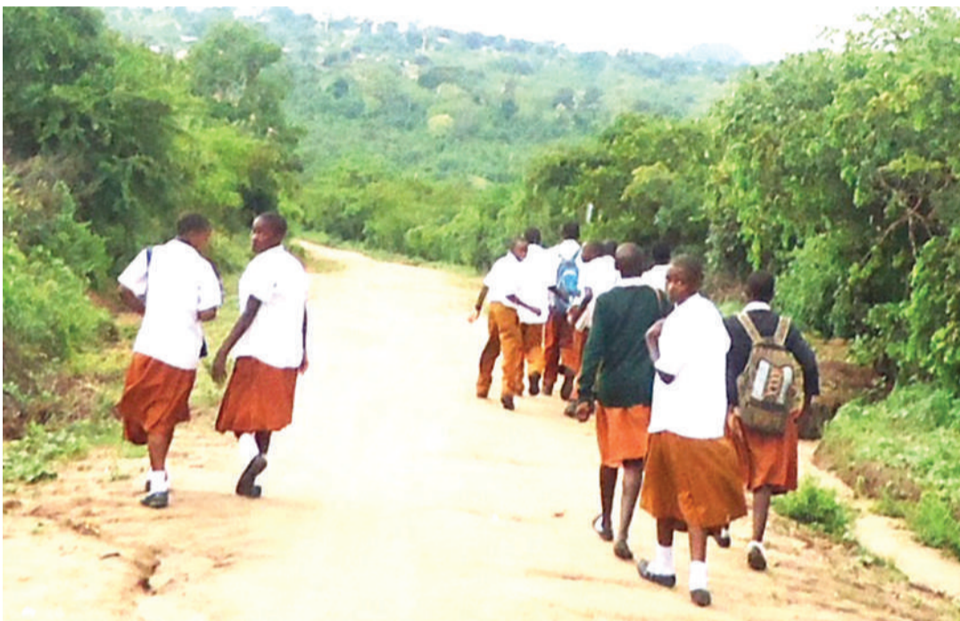
Wanafunzi wa sekondari za kata wilayani Handeni, wakitembea kuelekea shuleni.

N I wikiendi iliyopita nchini kulikuwapo madhimisho ya Miaka 60 ya Uhuru wa Tanzania Bara, Sekta ya Elimu ikiwa miongoni mwa maeneo yaliyopata mafanikio makubwa.