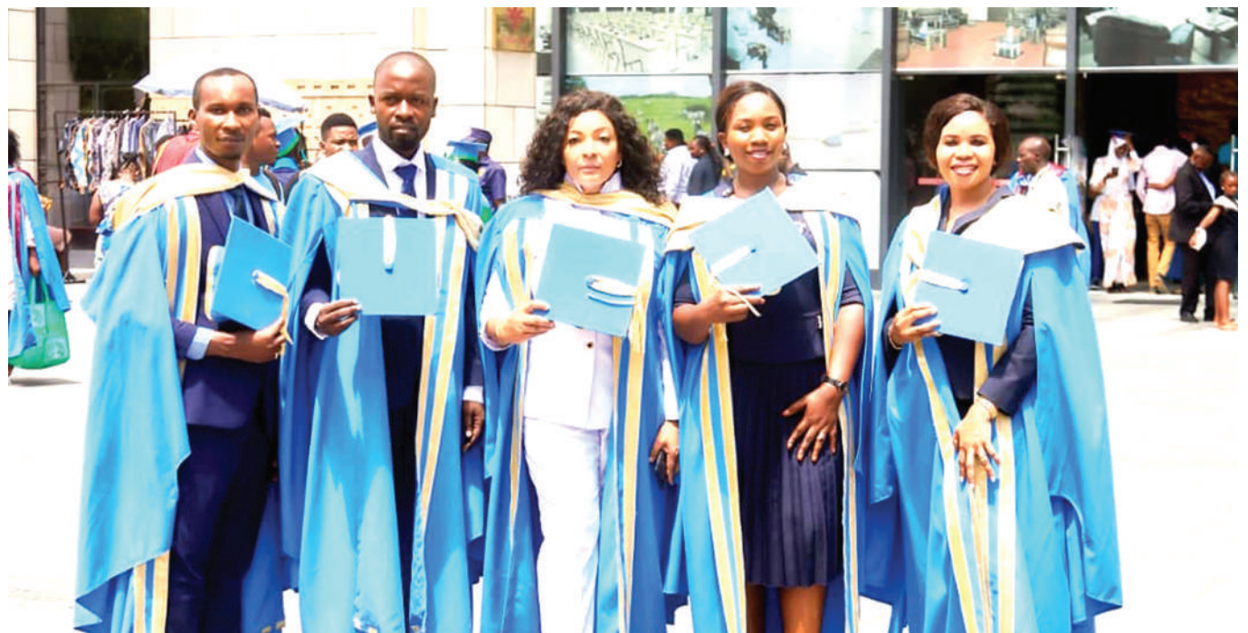
Wahitimu wa Chuo cha Diplomasia waliotunukiwa Stashahada ya Uzamili katika Kudumisha Amani na Utatuzi wa Migogoro na Menejimenti ya Uhusiano wa Diplomasia, wakiwa pamoja baada ya kutunukiwa vyeti katika mahafali yaliyofanyika jijini Dar es Salaam, mwishoni mwa wiki.

“Ninashauri mafunzo haya yasiishie kwetu, bali TGNP mwangalie uwezekano wa kupanua shughuli zetu, badala ya kuitisha mafunzo kama haya, mjaribu kwenda hata kule ambako mnaona kuna shida ili kuelimisha,” alisema Kyara.