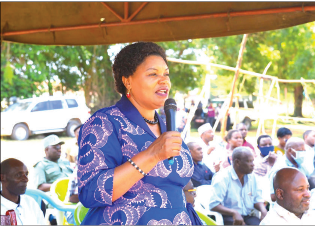
Jenister Muhagama Waziri wa Sera, Bunge, Kazi, Vijana, Ajira na Walemavu, ametangaza kasi ya maambukizi VVU kwa vijana kufikia asilimia 40.