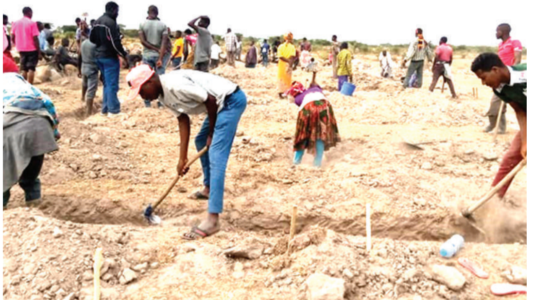
Kazi ya ujenzi wa shule ya sekondari ya kata ikiendelea, kwa kutumia mchango wa nguvu za wananchi, mkoani Mara.

Fedha za kutekeleza mradi huo zinatolewa na serikali kupitia mkopo wa takribani Sh. trilioni 1.1 kutoka Benki ya Dunia (WB).