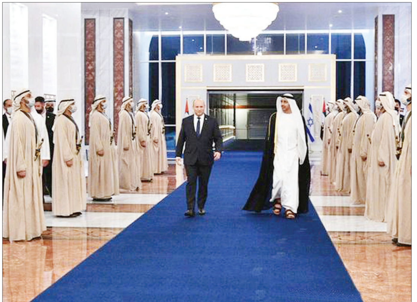
Waziri Mkuu wa Israel, Naftali Bennett, akiwa na mwenyeji wake, Waziri wa Mambo ya Kigeni wa Umoja wa Falme za Kiarabu, Abdullah bin Zayed Al-Nahyan, alipowasili katika Umoja wa Falme za Kiarabu. Ni ziara ya kwanza ya kiongozi wa taifa la Israel, kwenye nchi hiyo, ambayo ni miongoni mwa mataifa ya Kiarabu yaliyorejesha uhusiano wao rasmi na Israel.