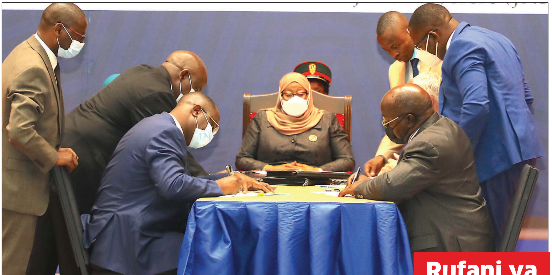
Rais Samia Suluhu Hassan, akishuhudia tukio la utiaji saina makubaliano kati ya serikali na kampuni za uchimbaji madini za Black Rock Mining Limited, Strandline Resources Limited na Nyanzaga jijini Dar es Salaam jana.