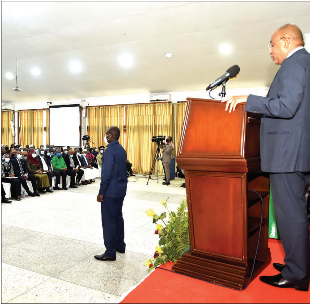
Rais wa Zanzibar, Dk. Hussein Ali Mwinyi, akihutubia katika Maadhimisho ya Siku ya Maadili na Haki za Binadamu, yaliyofanyika ukumbi wa Sheikh Idrisa Abdulwakil Kikwajuni jijini Zanzibar.