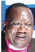
Na Askofu Mwamalanga