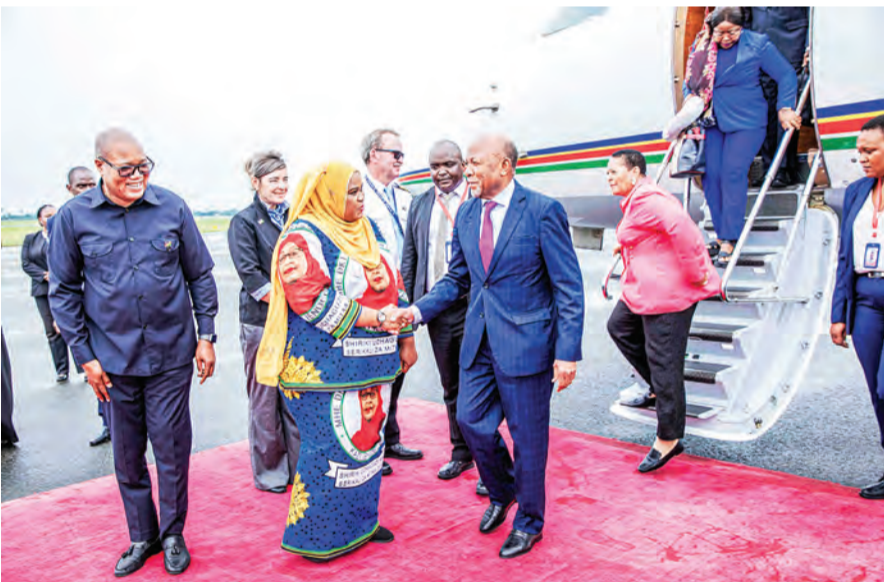
Waziri wa Maendeleo ya Jamii, Jinsia, Wazee na Watoto Zanzibar, Riziki Pembe Juma akimpokea Rais wa Namibia, Dk. Nangolo Mbumba alipowasili katika Uwanja wa Ndege wa Kimataifa wa Julius Nyerere, kwa ajili ya kushiriki sherehe za miaka 60 ya Muungano, jana.