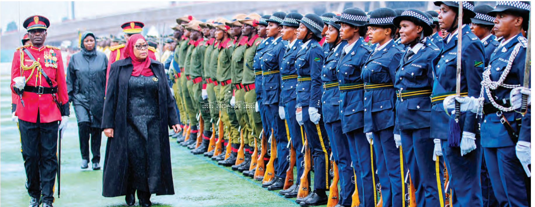
Rais na Amiri Jeshi Mkuu wa Majeshi ya Ulinzi na Usalama, Samia Suluhu Hassan akikagua gwaride la heshima lililoandaliwa na Jeshi la Ulinzi la Wananchi wa Tanzania (JWTZ), wakati wa Sherehe za Miaka 60 ya Muungano wa Tanganyika na Zanzibar, katika Uwanja wa Uhuru, Dar es Salaam jana.