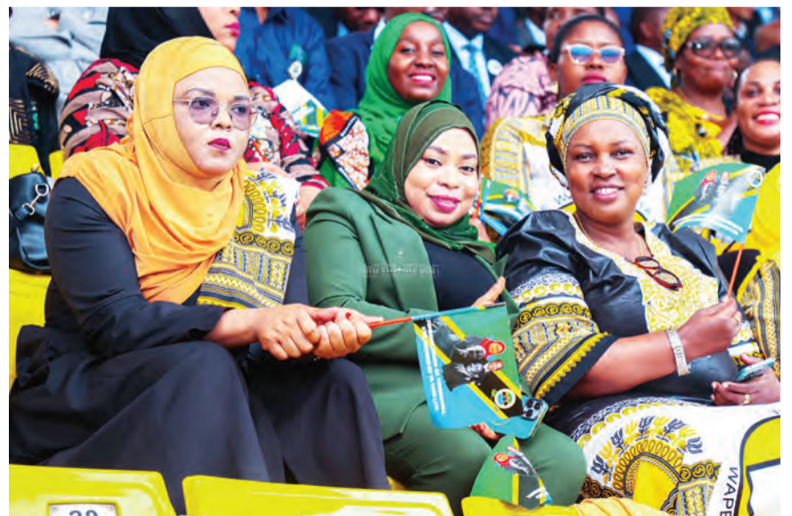
Sehemu ya viongozi mbalimbali pamoja na wananchi waliohudhuria sherehe hizo.