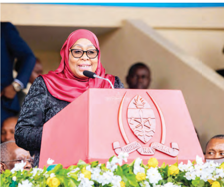
Rais Samia Suluhu Hassan akihutubia wananchi na viongozi mbalimbali, wakati wa sherehe hizo.