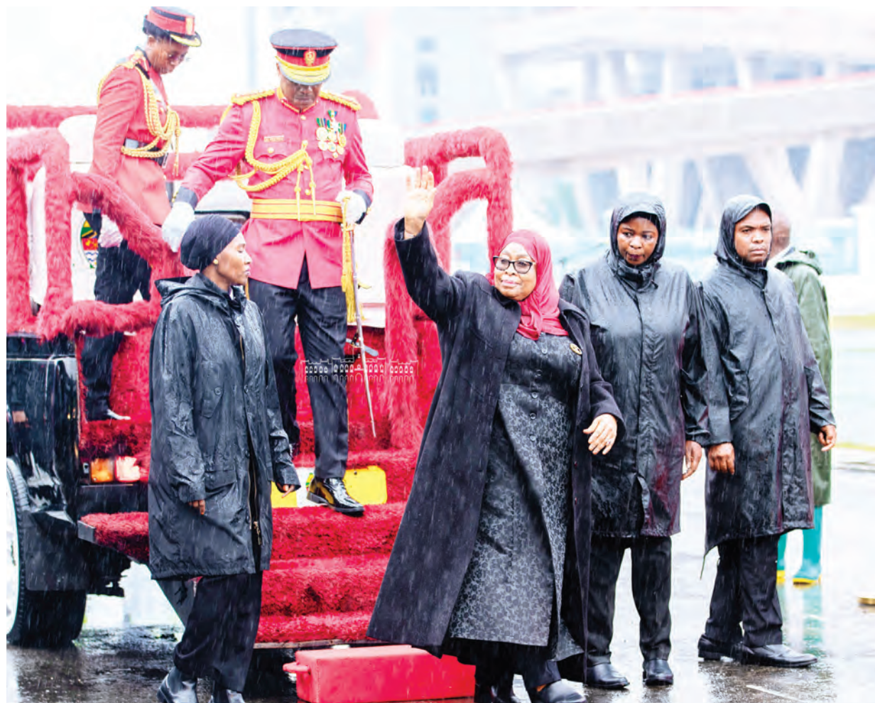
Rais na Amiri Jeshi Mkuu wa Majeshi ya Ulinzi na Usalama, Samia Suluhu Hassan akiwapungia mkono wananchi, alipowasili katika Uwanja wa Uhuru, Dar es Salaam jana, wakati wa sherehe za Miaka 60 ya Muungano wa Tanganyika na Zanzibar. Picha zaidi Uk. 2&7

• Viongozi Afrika wasema umejenga uchumi... Endelea Ukurasa 2