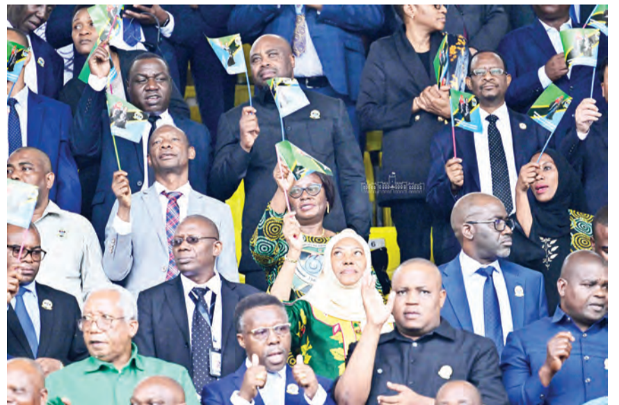
Sehemu ya viongozi mbalimbali pamoja na wananchi waliohudhuria sherehe hizo.