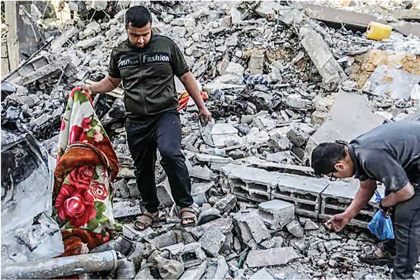
Wapalestina wakiokota vifaa vyao baada ya jengo kuharibiwa na shambulizi la jeshi la Israel jana katika mji wa Rafah.

Mnamo Desemba 2023, taifa hilo la Afrika Magharibi lilifungia gazeti la Ufaransa la Le Monde lililishutumu kwa kuripoti kwa upendeleo.