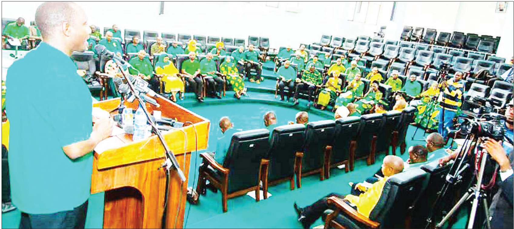
Katibu Mkuu wa Chama Cha Mapinduzi, Dk. Bashiru Ally, akifungua kikao cha siku mbili cha Sekretarieti ya Halmashauri Kuu ya Taifa ya CCM na Kamati za Utekezaji za Jumuiya za Chama - UVCCM, UWT na Wazazi katika ukumbi wa White House jijini Dodoma.