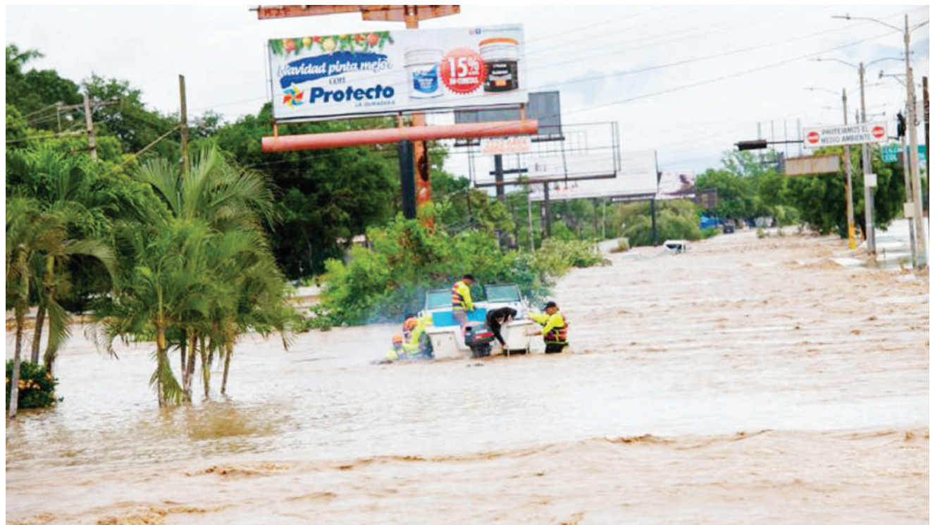
Kimbunga Eta na lotta, kimeacha watu 150,000 bila makazi katika kitongoji cha Planeta baada ya Mto Chamelecón kuvunja kingo zake, nchini Honduras, jana.