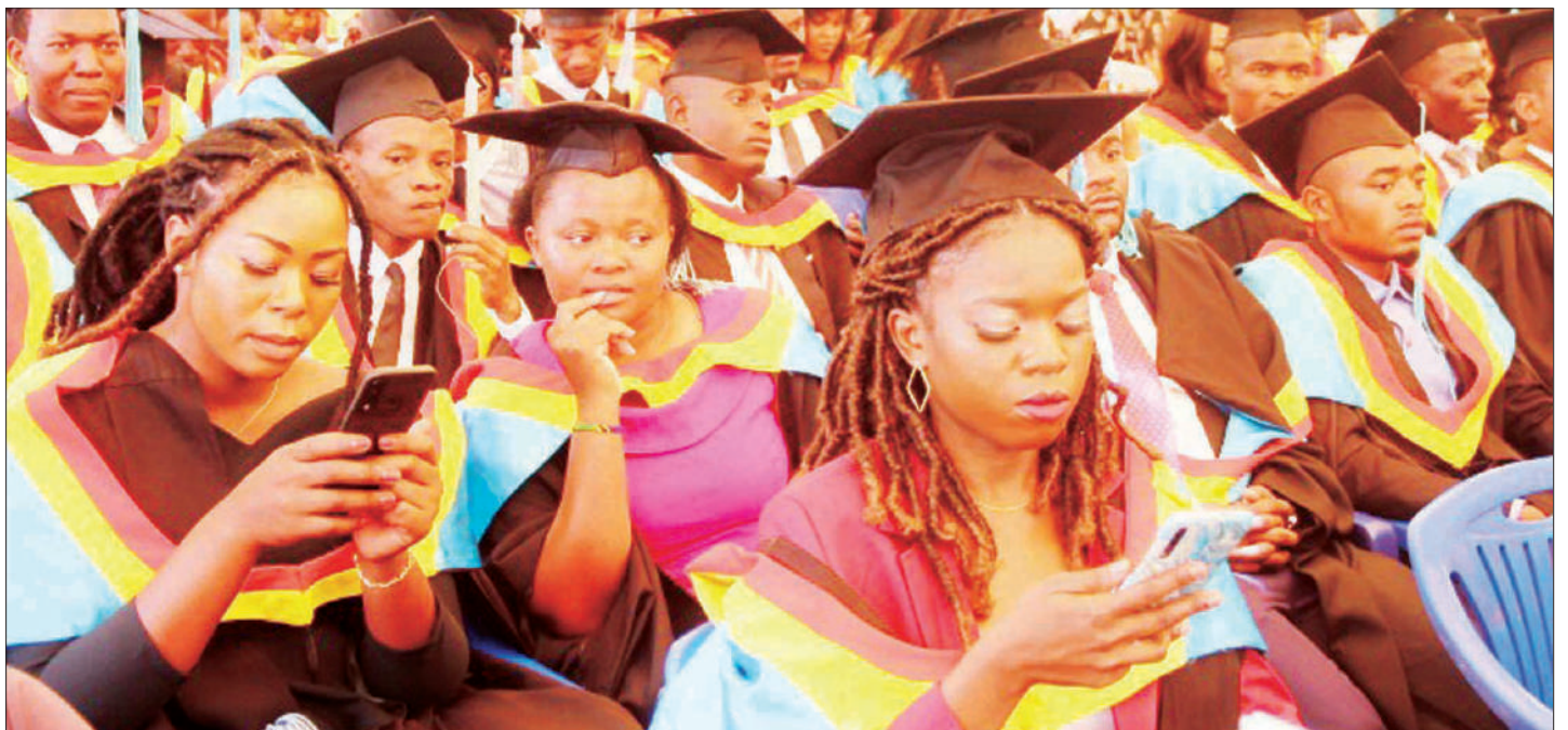
Baadhi ya wahitimu wa Chuo Kikuu Mzumbe, Ndaki ya Mbeya, wakiwa wamevalia majoho mwishoni mwa wiki wakati wa sherehe za kutunukiwa shahada mbalimbali na Mkuu wa Chuo hicho, anayemaliza muda wake, Jaji Mkuu mstaafu, Barnabas Samatta.

Alisema vijana hao walikamatwa Novemba 25, mwaka huu saa 2:00 usiku katika eneo la Ilolo lililopo Kata ya Sinde jijini hapa huku akidai kuwa vijana hao pia huwa wanajihusisha na matukio ya wizi.