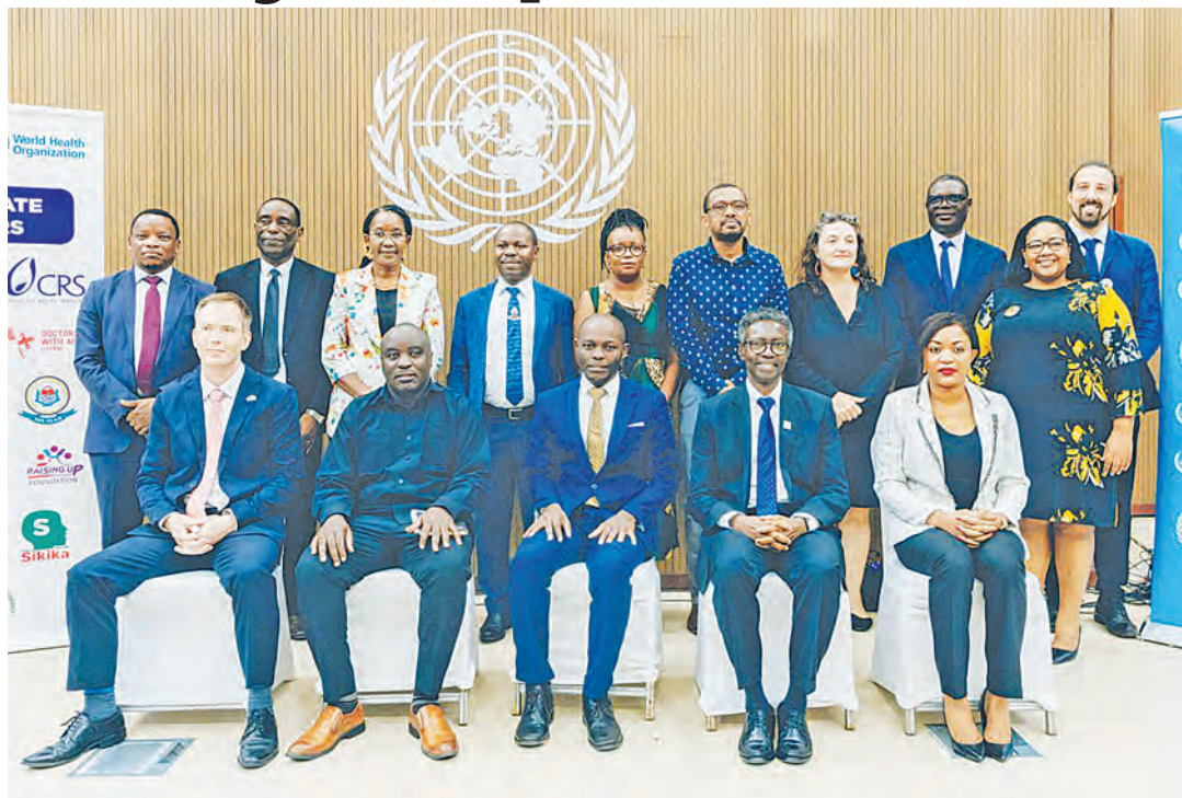
Viongozi wa taasisi zilizotambuliwa na WHO kuboresha afya.

Profesa Maluka, akiwa mtafiti kiongozi anasema: "Utafiti huo ulilenga mambo mawili makub-