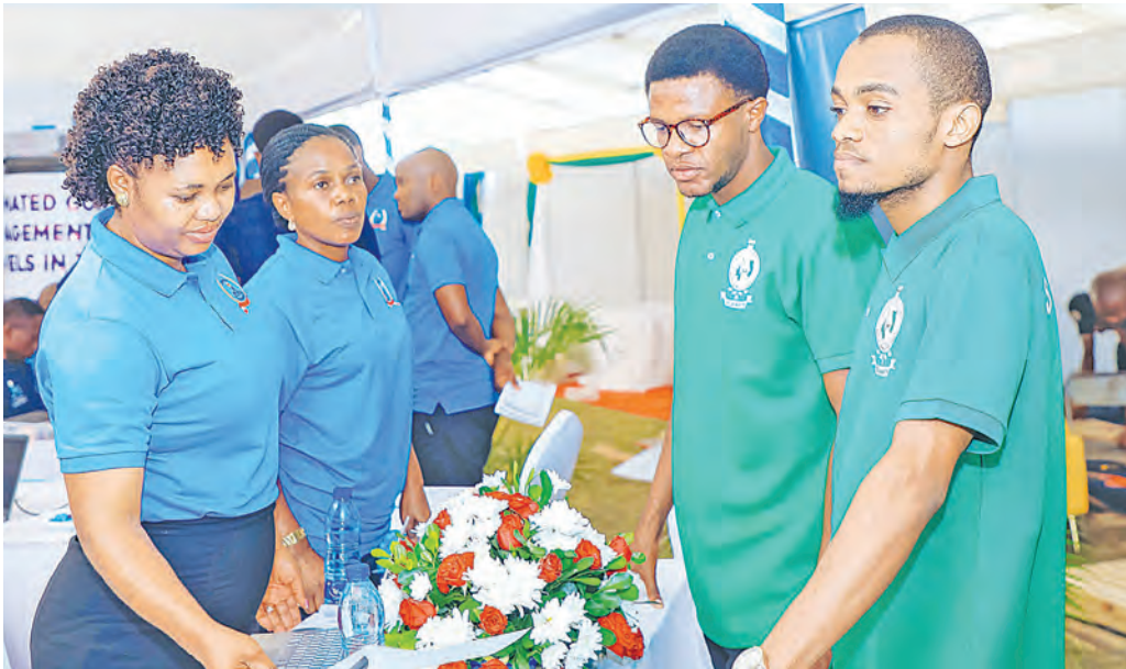
Wageni mbalimbali waliotembelea Maadhimisho ya Wiki ya Kitaifa ya Elimu, Ujuzi na Ubunifu wakipata maelezo katika banda la maonyesho la Chuo Kikuu Mzumbe jana viwanja vya Shule ya Sekondari Popatlal jijini Tanga.