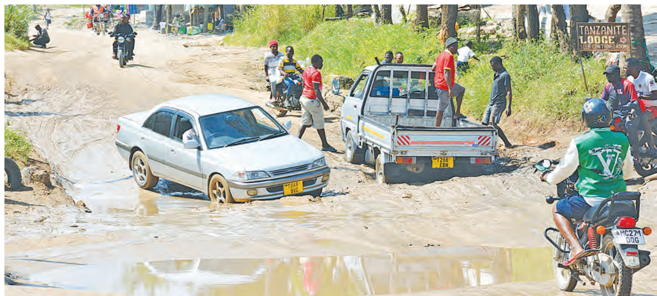
Vyombo vya moto vikipita kwa shida na kukwama kutokana na ubovu wa barabara ya Goba Tegeta A, eneo la kwa Ndosi jijini Dar as Salaam jana.

Alisema Wizara yenye dhamana ya Kazi, Ajira na Maendeleo ya Vijana ilikuwa na malalamiko manane (8), Wizara ya Afya (8), Wizara ya Ujenzi na Uchukuzi (7), Wizara ya Maliasili na Utalii (4) na Bunge (2), hivyo kuwa na jumla ya malalamiko 179.