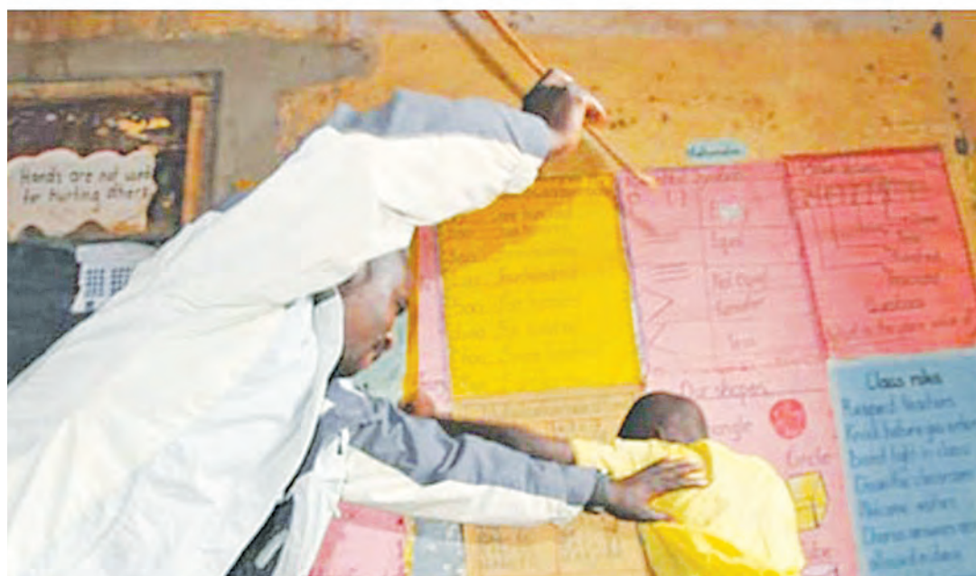
Wadau wanapinga ukatili kama huu unaozidi adhabu.