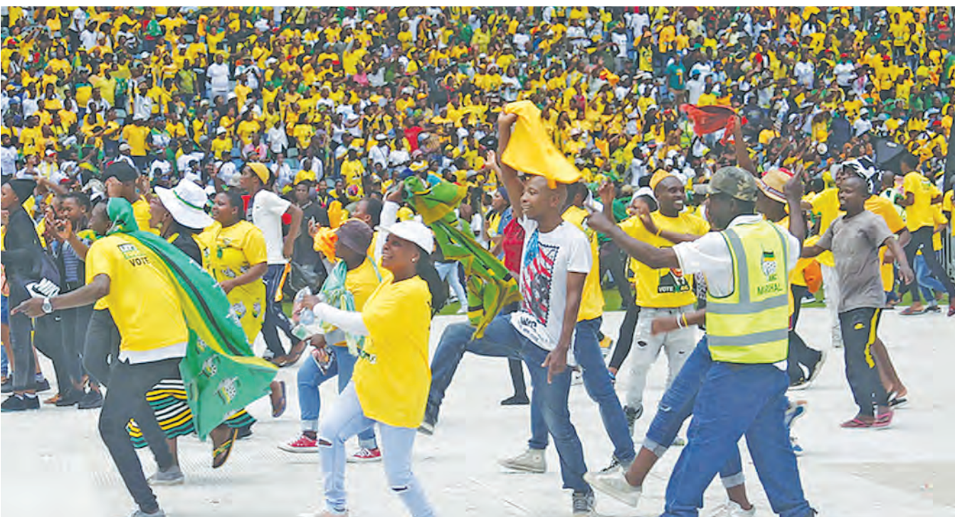
Wafuasi wa Chama tawala Afrika Kusini cha African National Congress (ANC) wakiwa katika mkutano wa kuhitimisha kampeni za kisiasa juzi jijini Johannesburg.