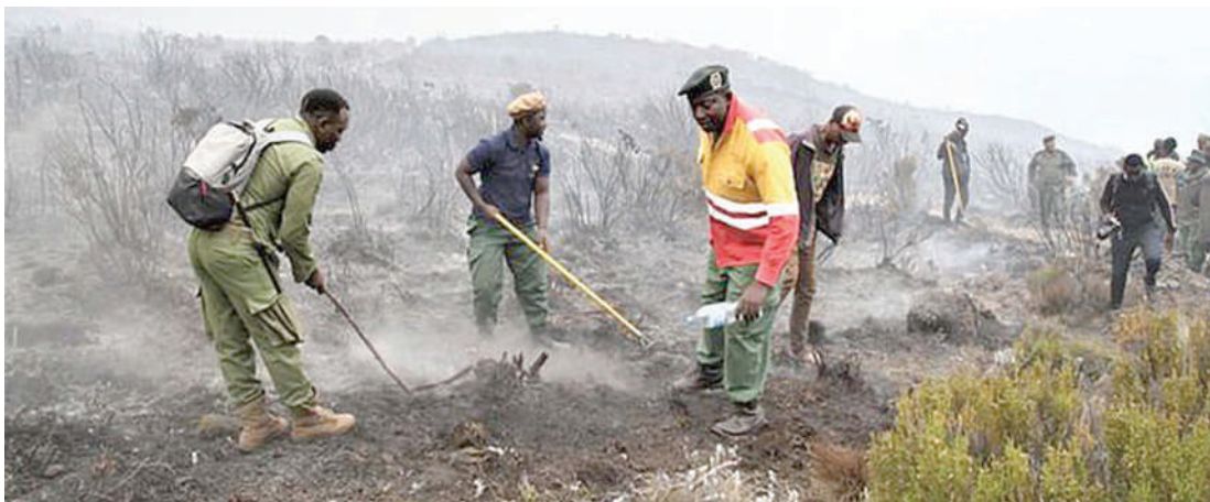
Wafanyakazi wa KINAPA wakizima moto kwenye eneo la Mlima Kilimanjaro.

Njia ya uandaaji mashamba ya kizamani kwa kutumia moto anaitaja kuwa ni chanzo cha moto katika hifadhi kwa mashamba yaliyo karibu na hifadhi hiyo na moto unaochomwa katika mashamba hayo kwa ajili ya kuungua visiki husambazwa na upepo hadi kwe-