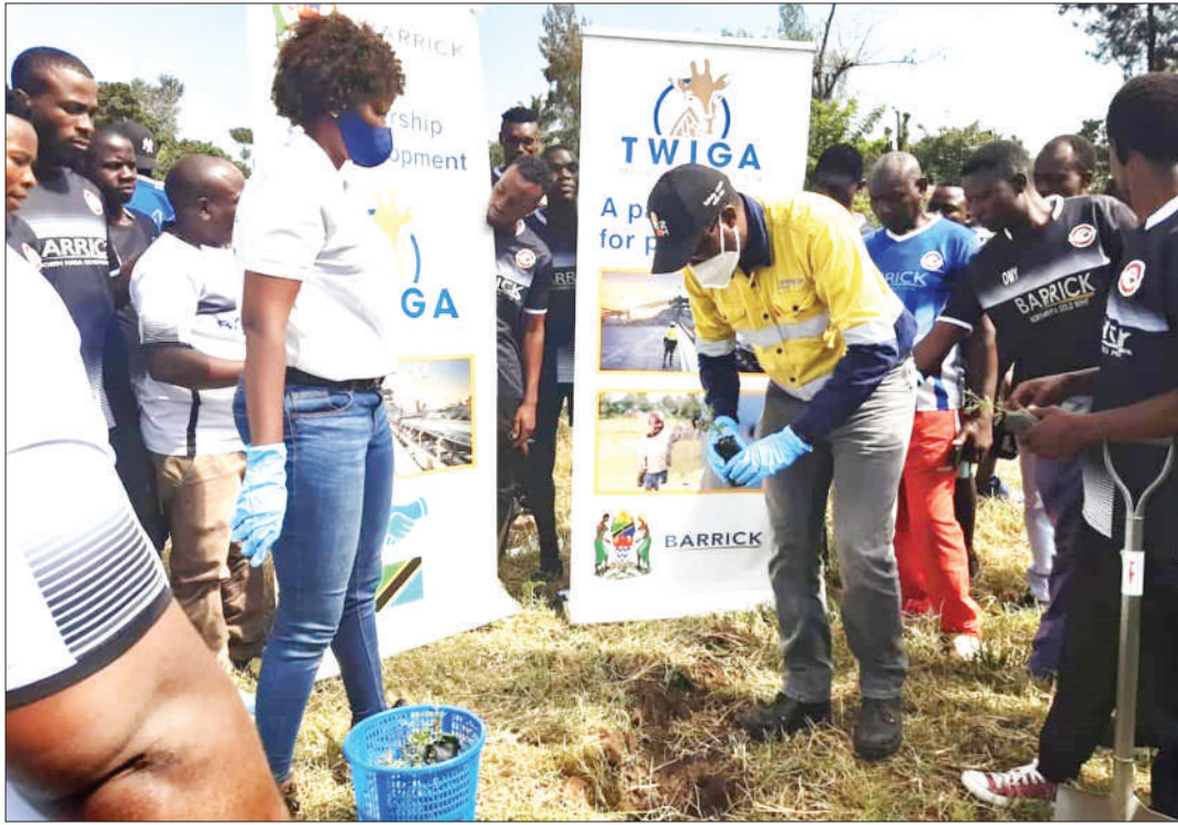
Wafanyakazi wa mgodi wa Barrick- North Mara wakishiriki zoezi la kupanda miti kwenye eneo la mgoji katika maadhimisho ya Siku ya Mazingira Duniani mwishoni mwa wiki.