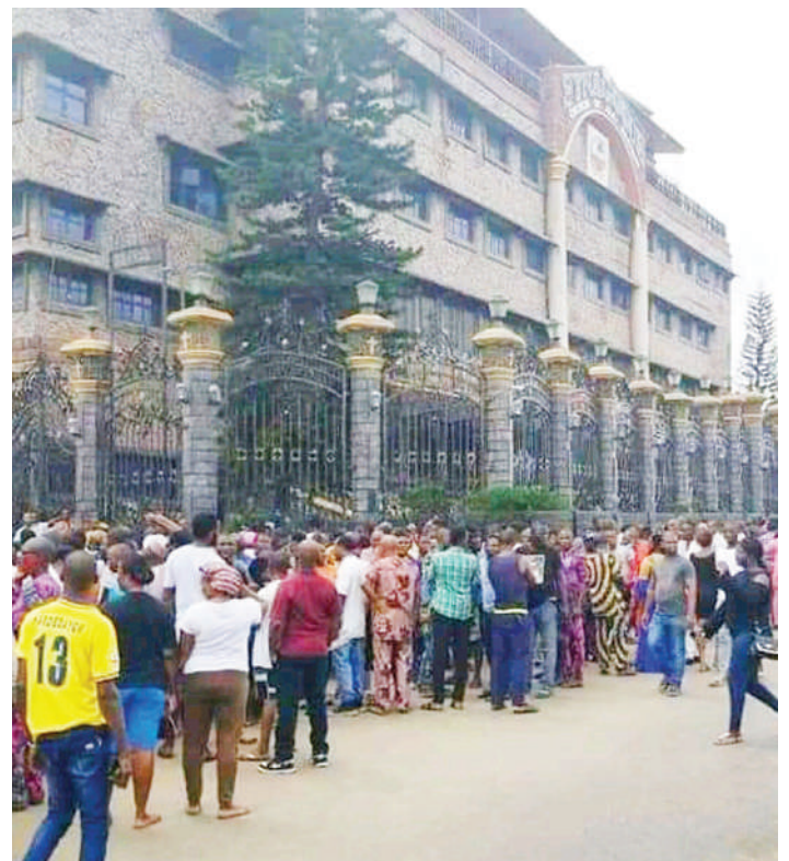
Mamia ya waombolezaji wakiwa katika Synagogue Church of All Nations (SCOAN), jana.