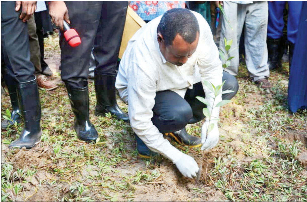
Makamu wa Kwanza wa Rais wa Zanzibar, Othman Masoud, akipanda mti aina ya mkoko katika ufukwe wa Bahari ya Nyamanzini nje ya mji wa Zanzibar, katika maadhimisho ya Siku ya Mazingira Duniani.

Ujumbe wa mwaka huu kwa Zanzibar katika kuadhimisha siku hiyo ni, "Tunza mazingira kwa kurejesha uasilu wake kufikia uchumi wa bluu".