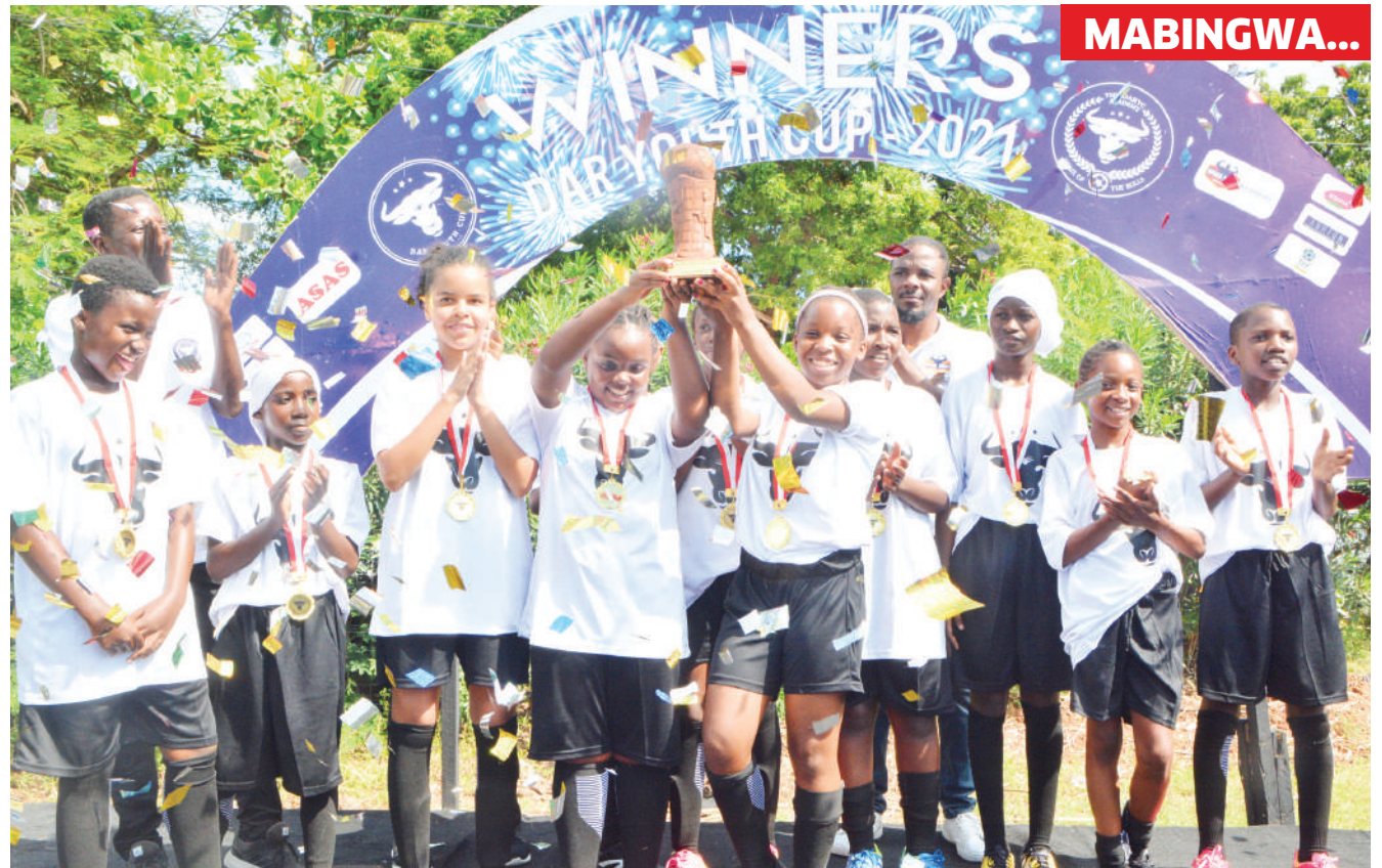
Wachezaji wa timu ya wasichana Bulls U-13, wakishangilia baada ya kutwaa ubingwa kwa kuifunga timu ya Shule Msingi Feza, katika michuano ya Dar Youth Cup, iliyofanyika viwanja vya Gymkhana jijini Dar es Salaam juzi.