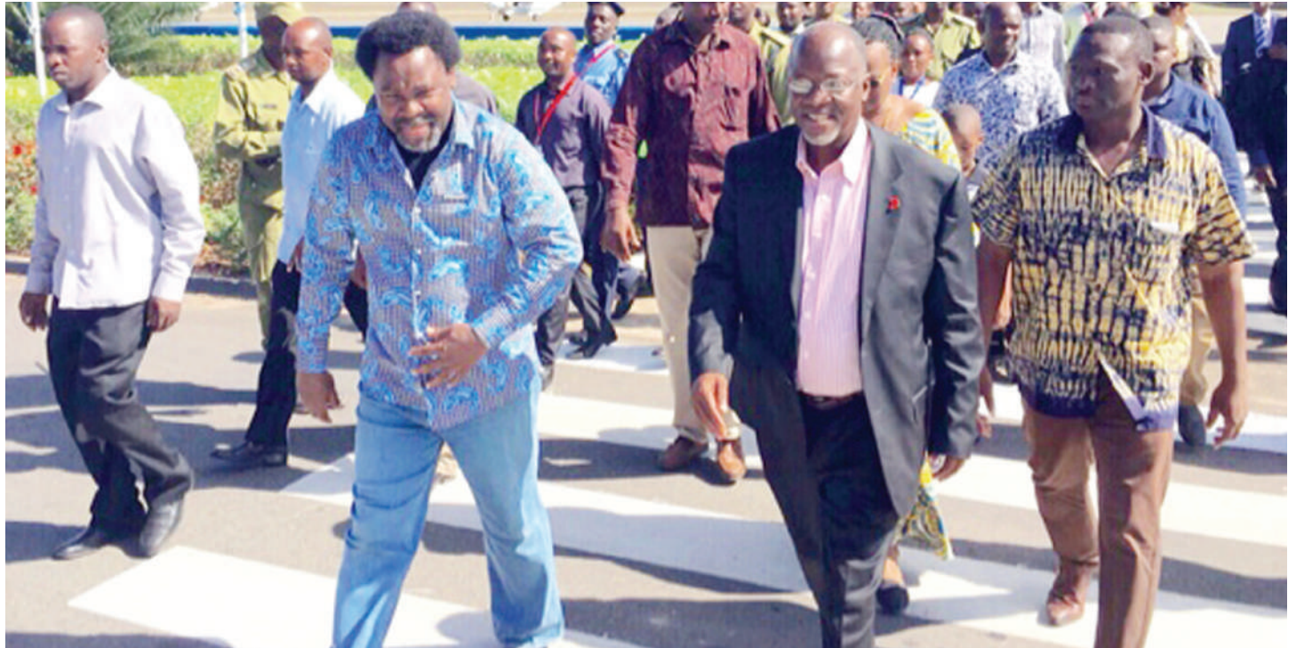
Hayati Dk. John Magufuli akimpokea Mhubiri wa kimataifa kutoka Nigeria, TB Joshua, kwenye Uwanja wa Ndege wa Kimataifa wa Julius Nyerere (JNIA) jijini Dar es Salaam, Novemba 3, mwaka 2015. Mhubiri huyo aliwasili nchini kushuhudia Hayati Magufuli alipoapishwa kwa muhula wa tano wa urais.

Baada ya kutangazwa kifo chake na kuthibitishwa na kani-